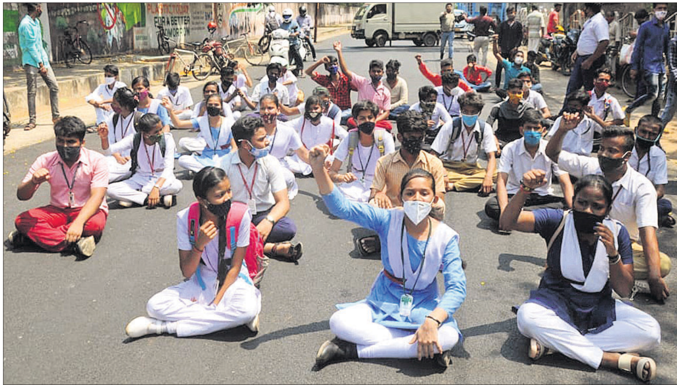
କୋଭିଡ୍ ଭୟାନକ ସଂକ୍ରମଣକୁ ଦୂଷ୍ଟରେ ରଖି ଓଡ଼ିଶାରେ ମାଟ୍ରିକ୍ ପରୀକ୍ଷା ବାତିଲ କରିବା ଦାବିରେ ମଙ୍ଗଳବାର ନବୀନ ନିବାସ ଅଭିଯୁକ୍ତ ଯାଜପୁରୀ ଛାତ୍ରଛାତ୍ରୀମାନେ ଭୁବନେଶ୍ୱର ଫରେଷ୍ଟ ପାର୍କ ରାସ୍ତାରେ ଧାରଣାରେ ବସିଛନ୍ତି।

ଅନ୍ୟ କରୁଣା ଉପକରଣ ଅଛି। ତେଣୁ ଲକ୍ଷ୍ମୀର ଶେଷ ବିକଳ ହେବା ଉଚିତ। ମାଲକୋ କଂଗ୍ରେସରେ କୋଭିଡ୍-୧୯ ପ୍ରୋଟୋକଲକୁ କଡ଼ାକଡ଼ି କଲେ ଓ ତାକୁ ସମସ୍ତେ ମାନିଲେ ଲକ୍ଷ୍ମୀର ଶେଷ ବିକଳ ହେବା ନାହିଁ। ଲୋକେ ଅନାବଶ୍ୟକ ଭାବେ ବାହାରକୁ ବାହାରକୁ ନାହିଁ। ସମସ୍ତେ ଭାଙ୍ଗିନ ନିଆକୁ ବୋଲି ମୋଦି ପରାମର୍ଶ ଦେଇଛନ୍ତି। ଏହି ଅବସରରେ ମହାମାରୀ ବିରୋଧରେ ଅବମ୍ୟ ଉଦ୍ୟମ କରୁଥିବା ଭାଙ୍ଗିନ ଓ ସ୍ୱାସ୍ଥ୍ୟସେବା କର୍ମୀମାନଙ୍କୁ ପ୍ରଧାନମନ୍ତ୍ରୀ ଧନ୍ୟବାଦ ଜଣାଇଛନ୍ତି।