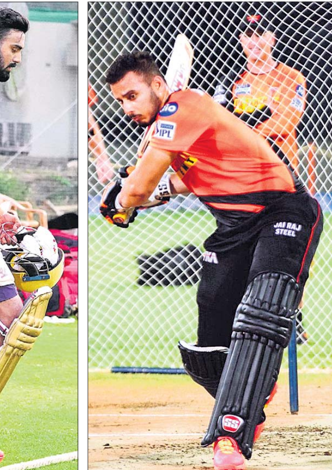
ନେତୃତ୍ୱରେ ପଞ୍ଜାବ କିଙ୍ଗ୍ସ୍ ଅଧିନାୟକ ଲୋକେଶ୍ ରାହୁଲ୍ ଓ ସନ୍ତୋରାଜର୍ସ୍ ହାଇଡ୍ରାବାଦର ଅବସ୍ଥା ସମ୍ପର୍କରେ।