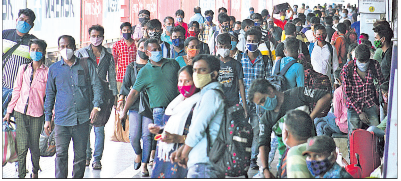
କଟକ ରେଳଷ୍ଟେ ଷ୍ଟେଶନରେ ଗନ୍ତବ୍ୟସ୍ଥଳକୁ ଯିବାପାଇଁ ଅପେକ୍ଷାରତ ଯାତ୍ରୀଙ୍କ ଭିଡ଼।