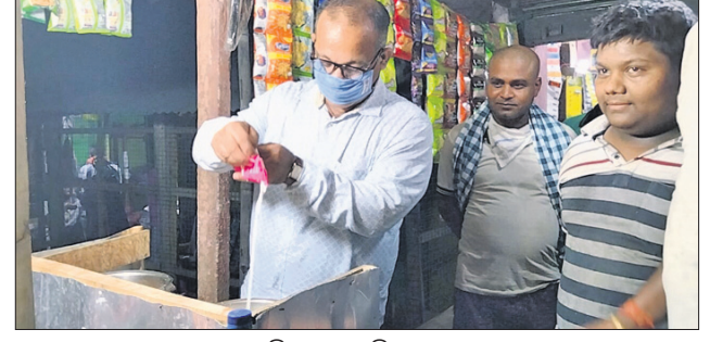
ଛାତ୍ର ଗାପସକ ସହ ମନ୍ତ୍ରୀ ଜ୍ୟୋତିପ୍ରକାଶ ପାଣିଗ୍ରାହୀ।