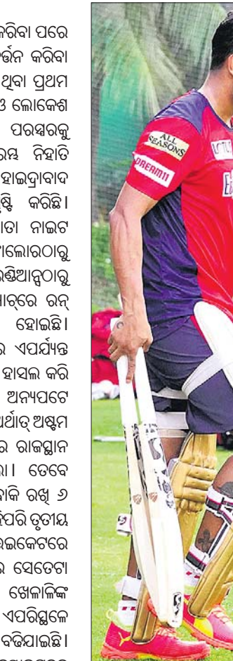
ନେତୃତ୍ୱରେ ପଞ୍ଜାବ କିଙ୍ଗ୍ସ୍ ଅଧିନାୟକ ଲୋକେଶ୍ ରାହୁଲ୍ ଓ ସନ୍ତୋରାଜର୍ସ୍ ହାଇଡ୍ରାବାଦର ଅବସ୍ଥା ସମ୍ପର୍କରେ।