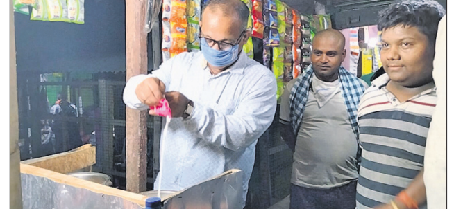
ଛାତ୍ର ଗାପସକ ସହ ମନ୍ତ୍ରୀ ଜ୍ୟୋତିପ୍ରକାଶ ପାଣିଗ୍ରାହୀ।