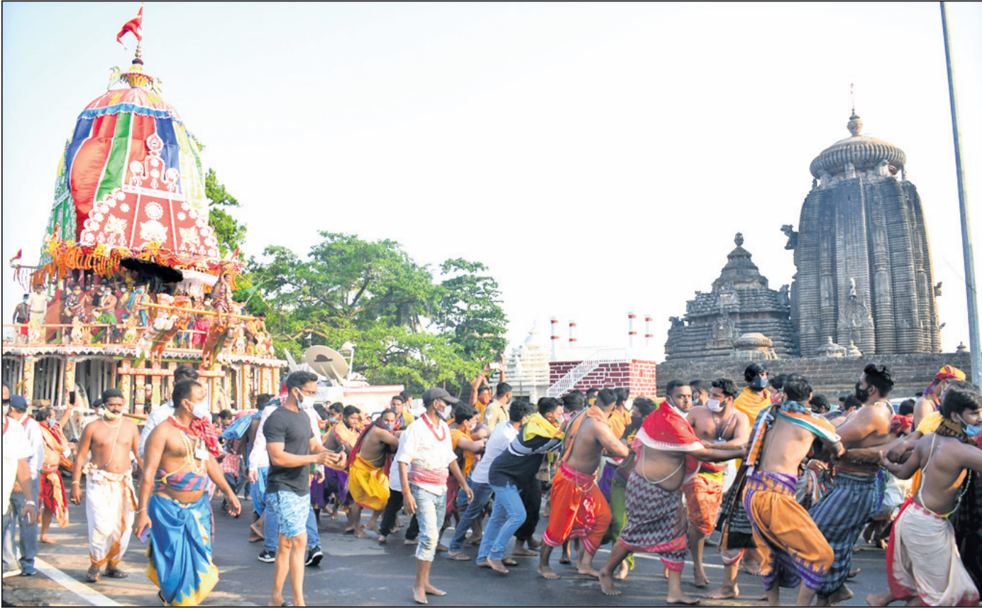
ମହାପ୍ରଭୁ ଶ୍ରୀଲିଙ୍ଗରାଜଙ୍କ ରୁକୁଣା ରଥକୁ ମଙ୍ଗଳବାର ସେବାୟତ ଓ ପୋଲିସ୍ କର୍ମଚାରୀ ଚାଣି ନେଉଛନ୍ତି।