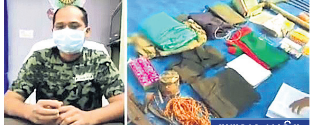
ଏସ୍‌ସି ଅଭିଷେକ ସୂଚନା ଦେଉଛନ୍ତି। ଜବତ ହୋଇଥିବା ସାମଗ୍ରୀ।

ମାଲକାନଗିରି, ୨୦୧୪ (ଡି.ଏନ୍.ଏ.) ମାଲକାନଗିରି ଜିଲ୍ଲା ସୀମାରେ ଛତିଶଗଡ଼ର ଦାକ୍ଷେୟା ଜିଲ୍ଲାରେ ପୋଲିସ୍-ମାଓବାଦୀଙ୍କ ମଧ୍ୟରେ ଗୁଳି ବିନିମୟ ଘଟିଛି।