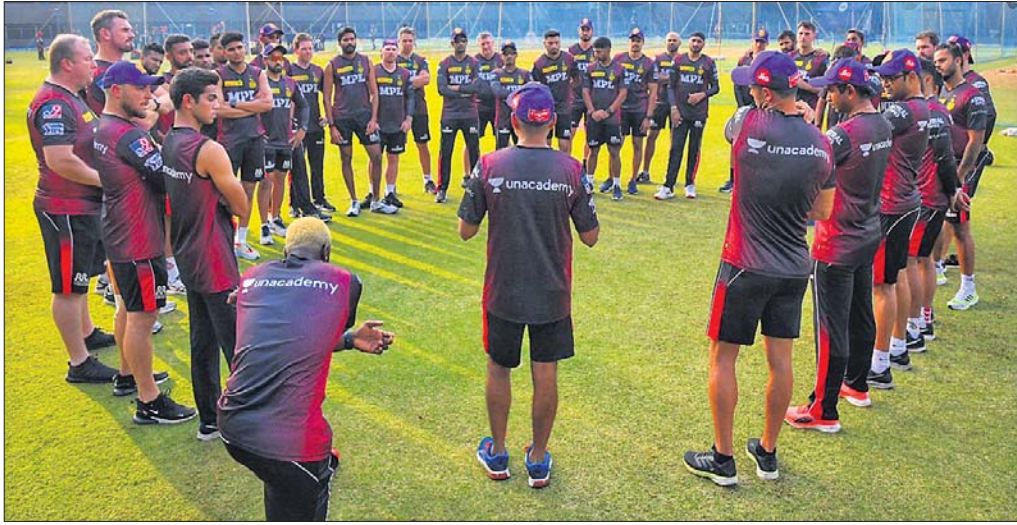
ଅଭ୍ୟାସ ସେସନରେ ମନୁଶାନ୍ତ କୋଲକାତା ନାଲଟ ରାଇଡର୍ସ୍ ଦଳର ଖେଳାଳି ଓ ସପୋର୍ଟ ସ୍ଟାଫ୍।

ପ୍ରଥମ ମ୍ୟାଚ୍ ପରାଜୟ ପରେ ଖୋଲକାତା ନେତୃତ୍ୱାଧୀନ ଚେନ୍ନାଇ ପ୍ରଥମ କିଛି କ୍ରମାଗତ ଟୁର୍କି ବିଜୟ ହାସଲ କରି କବରଦସ୍ତ ପ୍ରତ୍ୟାବର୍ତ୍ତନ କରିଛି। ଇଣ୍ଡିଆନ୍ ପ୍ରିମିୟର ଲିଗ୍ (ଆଇପିଏଲ୍)ରେ ଚେନ୍ନାଇ ଚାର୍ ପରବର୍ତ୍ତୀ ମ୍ୟାଚ୍ରେ ସଂପୂର୍ଣ୍ଣ କରୁଥିବା କୋଲକାତା ନାଲଟ ରାଇଡର୍ସ୍କୁ ଭେଟିବ। ବୁଧବାର ଖେଳାଦିବାକୁ ଥିବା ବିପକ୍ଷରେ ଚେନ୍ନାଇ ଚିତିଲେ ବିଜୟରେ ହାସଲ କରିବ।