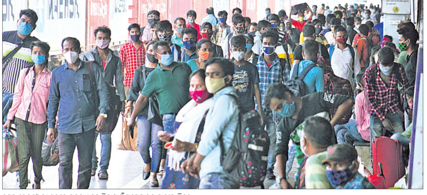
କଟକ ରେଳଷ୍ଟେ ଷ୍ଟେଶନରେ ଗନ୍ତବ୍ୟସ୍ଥଳକୁ ଯିବାପାଇଁ ଅପେକ୍ଷାରତ ଯାତ୍ରୀଙ୍କ ଭିଡ଼।