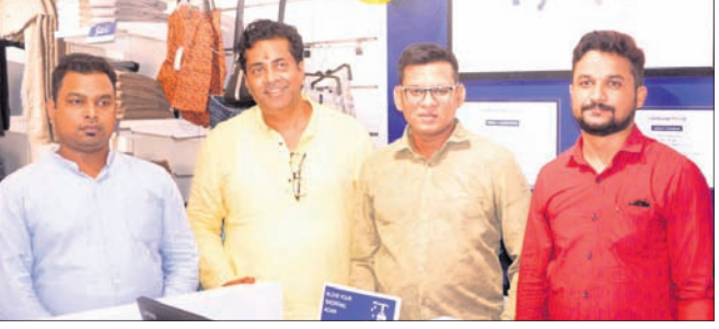
ଏହା ଦ୍ୱିତୀୟ ଶ୍ରେଣୀର ଏବଂ ପ୍ରଥମ ପର୍ଯ୍ୟାୟର ପ୍ରଥମ ପଦକ୍ଷେପ ଯାହା ସମ୍ପୂର୍ଣ୍ଣ ଆରମ୍ଭ କରିବ । ୨୯୯୯୯ଟି ଶୋ' ରୁମ୍ ନିର୍ମାଣ କରାଯାଇଛି ।

କଟକ, ୨୨ ଅପ୍ରିଲ: ଅଗ୍ରଣୀ ଯୋଷାକ ନିର୍ମାଣ କମ୍ପାନୀ ପକ୍ଷରୁ ଆପୋଲୋ ଇଣ୍ଡିଆ ପ୍ରା.ଲି. ଉପରେ ଏକ ବ୍ରାଣ୍ଡ କ୍ରିମ୍ ସମ୍ପର୍କ କୁବର ନୂଆ ଶୋ' ରୁମ୍ ଗ୍ରହଣ କରାଯାଇଛି ।