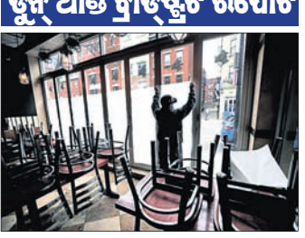
୮୨% କ୍ଷୁଦ୍ର ବାଣିଜ୍ୟ କୋଭିଡ୍ ଫଟକା ଲାଗିଛି । ସର୍ବନିମ୍ନ ୨୫୦ କମ୍ପାନୀକୁ ସାମିଲ କରାଯାଇଥିଲା । କୋଭିଡ୍ରେ ହୋଇଥିବା କ୍ଷତିଗ୍ରସ୍ତତା ଲାଗି ୨ ବର୍ଷ ସମୟ ଲାଗିବ

ମୁମ୍ବାଇ, ୨୨ ଅପ୍ରିଲ: କୋଭିଡ୍ ମହାମାରୀର ଦ୍ୱିତୀୟ ଲହରୀ ଯୋଗୁଁ ଦେଶର ଅର୍ଥ ବ୍ୟବସ୍ଥା କ୍ଷତିଗ୍ରସ୍ତ ହୋଇଛି । ୮୨% କ୍ଷୁଦ୍ର ବାଣିଜ୍ୟ ଉପରେ କୋଭିଡ୍ ମାଡ୍ ପଡ଼ିଥିବା ଏକ ରିପୋର୍ଟରେ ପ୍ରକାଶ ପାଇଛି ।