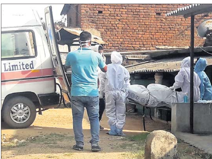
କୋଭିଡ୍ ଆକ୍ରାନ୍ତଙ୍କ ମୃତଦେହକୁ ଅସମ୍ମାନ

ପିପିଲି ଉପନିର୍ବାଚନକୁ ହାତେଇବା ପାଇଁ ଶାସକ ବିଜେଡି ଭୋଟରଙ୍କୁ ସିଧାସଳଖ ପ୍ରଭାବିତ କରୁଛି ।