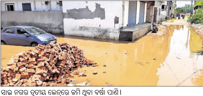
ସାଇ ନଗର ତୃତୀୟ ଲେନ୍‌ରେ ଜମି ଥିବା ବର୍ଷା ପାଣି।