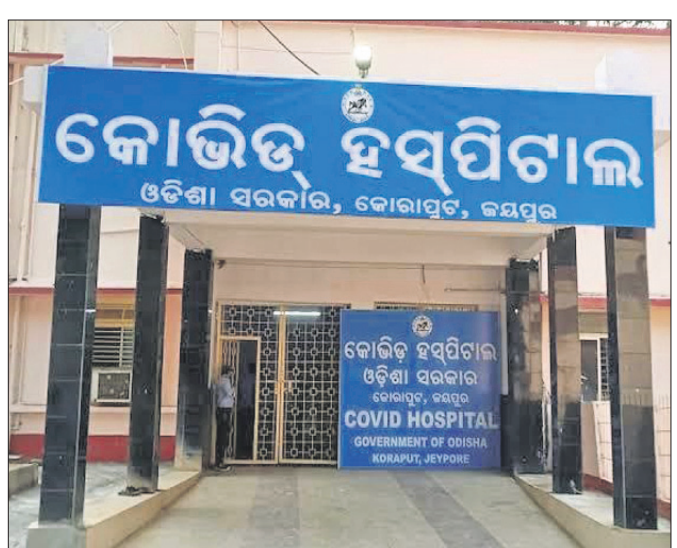
କୋଭିଡ୍ ହସ୍ପିଟାଲ ଓଡ଼ିଶା ସରକାର, କୋରାପୁଟ, କନ୍ଧପୁର

ରାଜ୍ୟରେ ବର୍ତ୍ତମାନ କରୋନା ସଂକ୍ରମଣ ଯେଉଁଭାବେ ବଢ଼ିବାରେ ଲାଗିଛି ତାକୁ ଆଖି ଆଗରେ ରଖି ସରକାର ବିଭିନ୍ନ ସହରରେ ଥିବା କୋଭିଡ୍ ଡାକ୍ତରଖାନାକୁ ଚୁକ୍ତ ଖୋଲିବା ପାଇଁ ନିର୍ଦ୍ଦେଶ ଦେଇଛନ୍ତି।