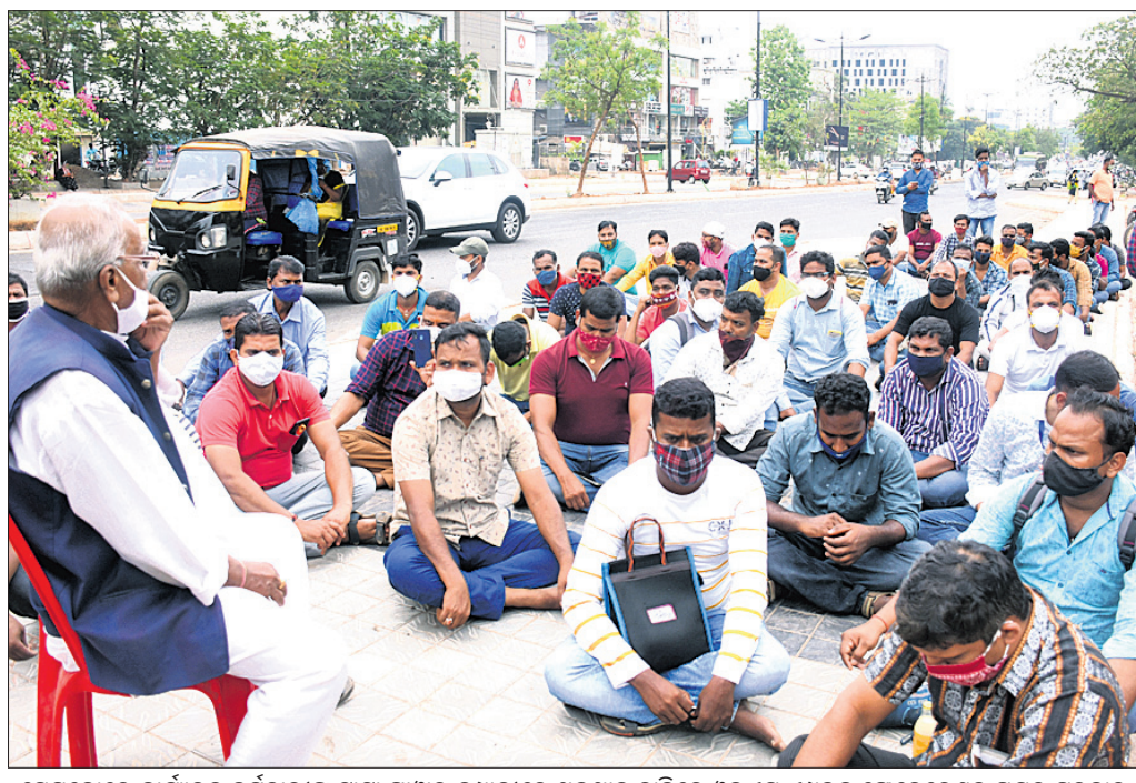
ସେସକୋରେ କାର୍ଯ୍ୟକାରୀ କର୍ମଚାରୀଙ୍କୁ ଚାଟା ପାଞ୍ଚାଳ କମ୍ପାନୀରେ ଅଭିଯାନ ଦାବିରେ ଉଲ୍ଲସ୍ ଏମ୍ପ୍ଲଜ୍ ଫେଡେରେଶନ ପକ୍ଷରୁ ଗୁରୁବାର ଭଦ୍ରକୋଟା ଗାଁରେ ଉପସ୍ଥାପିତ ହୋଇଥିବା ପ୍ରତିବାଦୀ ଯାତ୍ରାରେ ଯୋଗାଣ କରାଯାଇଛି।

ପୁରୀ ଅଫିସ, ୨୨୧୪: ଶ୍ରୀମନ୍ଦିର ପରିସରରୁ ବିମଳା ମନ୍ଦିରରେ ମୁକ୍ତିମଣ୍ଡପ ପଞ୍ଚିତ ସଭା ସଦସ୍ୟ ଭାବେ ପରିଚୟ ଦେଇ ଚଣ୍ଡାପାଠ ସହ ଭିଡିଓ କଲି କରିଥିବା ୨ଜଣଙ୍କ ନାଁରେ ସିଂହପୁର ଥାନାରେ ଗୁରୁବାର ମାମଲା ରୁଜୁ ହୋଇଛି।