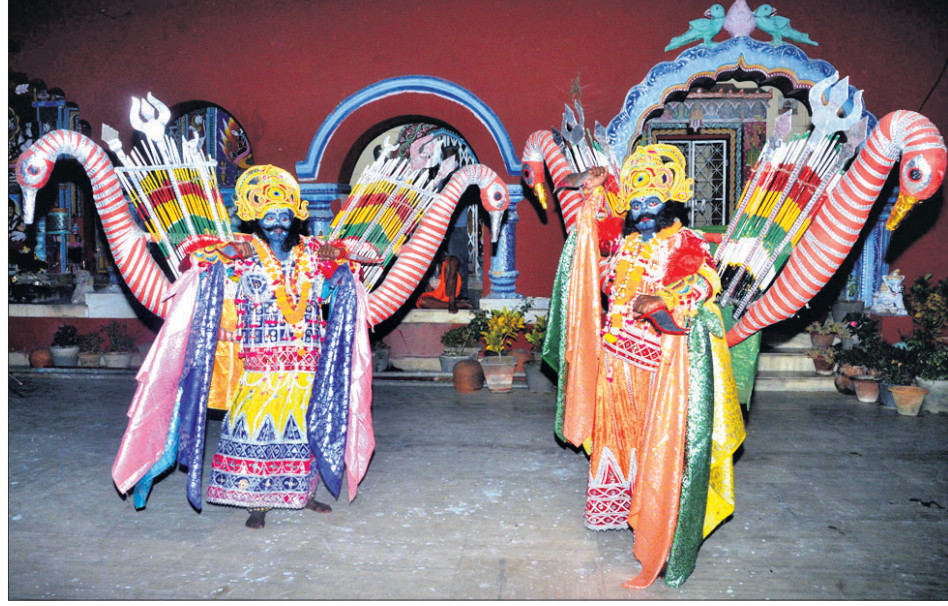
ଶ୍ରୀକ୍ଷେତ୍ର ସାହିଯାତର ବିତୀୟ ଦିବସରେ ଗୁରୁବାର ହରତଂଶୀ ସାହିକୁ ଆସିଥିବା ବେଶଧାରୀମାନେ ନୃତ୍ୟ କରୁଛନ୍ତି।