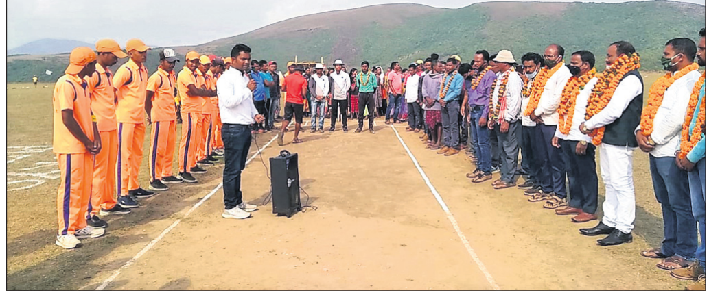
ଫାଇନାଲ ମ୍ୟାଚରେ ଉପସ୍ଥିତ ଖେଳାଳି, ଅତିଥି ଓ ଅନ୍ୟମାନେ।