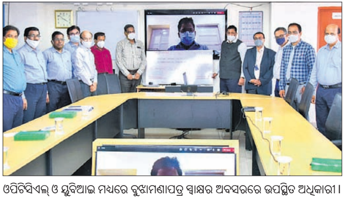
ଓପିଟିସିଏଲ୍ ଓ ମୁରିଆଇ ମଧ୍ୟରେ ରୁଝାମଣା ପତ୍ର ସ୍ୱାକ୍ଷର ଅବସରରେ ଉପସ୍ଥିତ ଅଧିକାରୀ।

ଟଙ୍କା ଲକ୍ଷି ଆକାରରେ ପ୍ରଦାନ କରିଥିଲେ। ବଳକା ୬୦୦.୧୨ କୋଟି ଟଙ୍କା ଓପିଟିସିଏଲ୍ ରଣ ଆଣିବାରେ ବ୍ୟବସ୍ଥା କରିଛି। ଓପିଟିସିଏଲ୍ ଆବେଦନକରିବ ବନ୍ଦୁ ରାଷ୍ଟ୍ରୀୟ ବ୍ୟାଙ୍କ ଏବଂ ଅର୍ଥ ପ୍ରଦାନକାରୀ ସଂସ୍ଥା ଭାଗ ନେଇଥିବାବେଳେ ଯୁନିୟନ ବ୍ୟାଙ୍କ ଅଫ୍ ଇଣ୍ଡିଆର ରଣ ହାର ସର୍ବନିମ୍ନ ୭.୨୦% ହୋଇଥିବାରୁ ଓପିଟିସିଏଲ୍ ଏହି ବ୍ୟାଙ୍କ ସହ ରୁଝାମଣା ପତ୍ର ସ୍ୱାକ୍ଷର କରିଛି।