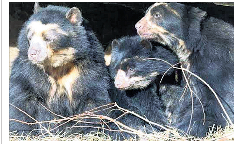
ପିତାପତ୍ନୀ-ଗଜପତ୍ନୀ ରାସ୍ତା ପାର୍ଶ୍ୱରୁ ଉଦ୍ଧାର ହୋଇଥିବା ଭାଲୁଛୁଆ।