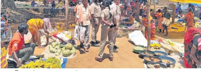
ଡାକୁଗାଁ ସାପ୍ତାହିକ ହାଟରେ ପୋଲିସ୍ ଓ ପ୍ରଶାସନ ଅଧିକାରୀମାନେ ପହଞ୍ଚି ବୋକାଳ ବନ୍ଦ କରିବାକୁ ବ୍ୟବସାୟୀଙ୍କୁ ନିର୍ଦ୍ଦେଶ ଦେଇଛନ୍ତି।

ସାରା ରାଜ୍ୟରେ କରୋନା ମହାମାରୀ ନିଜର କାୟା ବିସ୍ତାର କରୁଥିବା ବେଳେ ନବରଙ୍ଗପୁର ଜିଲ୍ଲା ଡାକୁଗାଁ ମଧ୍ୟ ଏଥିରୁ ବାଦ ପଡ଼ିନାହିଁ। ଏହାକୁ ନଜରରେ ରଖି ଡାକୁଗାଁରେ ଗୁରୁବାର ହେଉଥିବା ସାପ୍ତାହିକ ହାଟକୁ ବନ୍ଦ ରଖିବାକୁ ପ୍ରଶାସନ ନିର୍ଦ୍ଦେଶ ଦେଇଥିଲା।