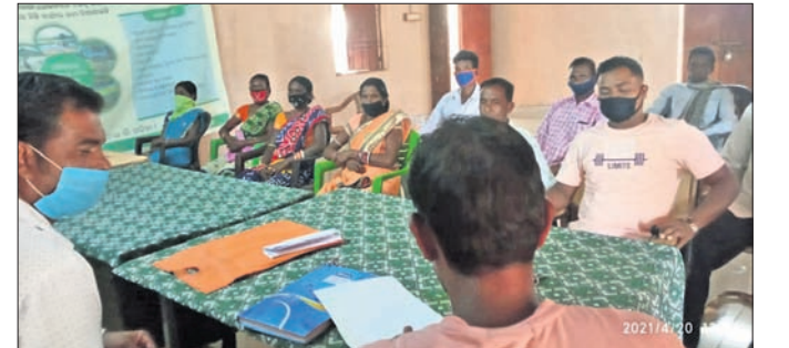
ପଞ୍ଚାୟତ ଅଧିବସରେ ବାଲିଡ଼ା ଟିଏକ୍ସ ।