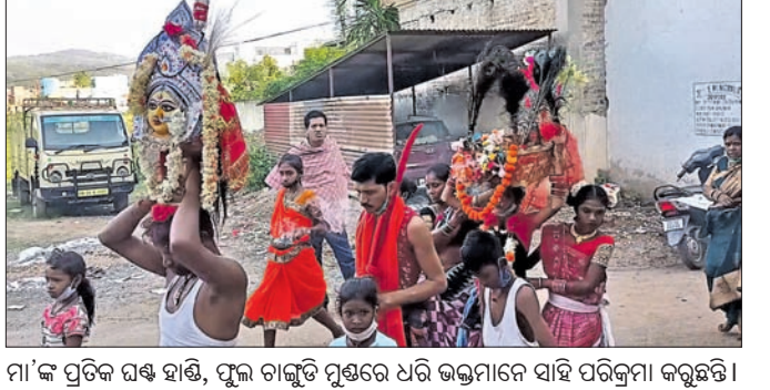
ମା'ଙ୍କ ପ୍ରତୀକ ଘଣ୍ଟ ହାଣ୍ଡି, ପୁଲ ଗାଳୁଡ଼ି ପୁଷ୍ପରେ ଧରି ଭକ୍ତମାନେ ସାହି ପରିକ୍ରମା କରୁଛନ୍ତି।