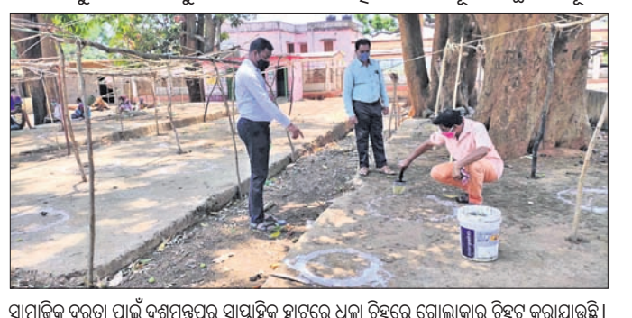
ସାମାଜିକ ଦୂରତା ପାଇଁ ଦଶମପଦ୍ମର ସାପ୍ତାହିକ ହାଟରେ ଧଳା ଦୁନରେ ସ୍ଥାନ ନିରୂପଣ କରାଯାଇଛି।

ଗୁରୁବାର ଦଶମପଦ୍ମରୁ କୁଳ ଜଣେ କରୋନା ପଞ୍ଜିତ ଚିକିତ୍ସା ହୋଇଛନ୍ତି। ଏହାପରେ ସ୍ଥାନୀୟ ତହସିଲଦାର ଅଧ୍ୟକ୍ଷ ପ୍ରକାଶ ଚିକିତ୍ସା, ବନ୍ଧନପଦ୍ମର ଥାନା ଏଏସଆଇ ବାବୁଲ୍ ପ୍ରଧାନ ସାପ୍ତାହିକ ହାଟକୁ ଯାଇ ବ୍ୟବସାୟୀଙ୍କ ସହ କଥା ହୋଇଛନ୍ତି।