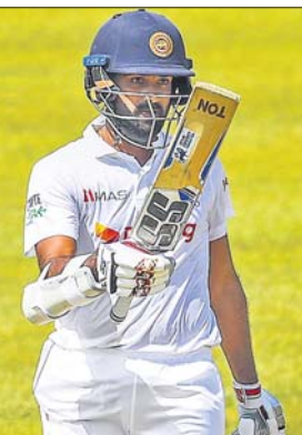
ଅର୍ଦ୍ଧଶତକ ହାସଲକାରୀ ଲାହିରୁ ଥିରମାନେ

ଲିଟନ ଦାସ ୫୦ ରନକରି ଆଉଟ ହୋଇଥିଲେ। ପୂର୍ବରୁ ଓପନର ଚାମିନ