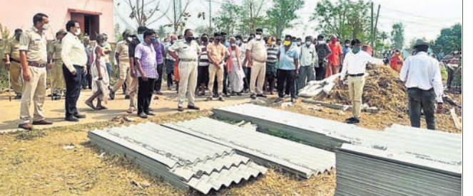
ପୋଲିସ୍ ଓ ପ୍ରଶାସନିକ ଅଧିକାରୀ ଜବରଦସ୍ତୀ ହଟାଇଛନ୍ତି।

ଅନୁଗୋଳ ଜିଲ୍ଲା କେନ୍ଦ୍ରପା ବ୍ଲକ୍ କୋଶଳା ଗ୍ରାମ ଶିମିଳିସାହିବିଦ୍ୟାଳୟ ଖେଳପଡ଼ିଆକୁ ଶୁକ୍ରବାର ଜବରଦସ୍ତୀ ଉଚ୍ଛେଦ କରାଯାଇଛି।