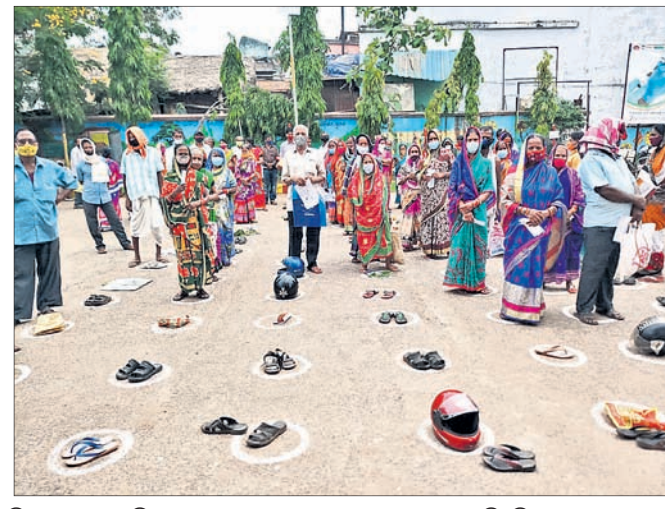
ଟିକାନେବାକୁ ଆସିଥିବା ଲୋକମାନେ ଗଣାଖରାରେ ଅପେକ୍ଷା କରିଛନ୍ତି।

ସୂଚନାଯୋଗ୍ୟ, ଜୁବନ ଗୋଷ୍ଠୀ ସ୍ୱାସ୍ଥ୍ୟକେନ୍ଦ୍ରରେ ୪୫ରୁ ବର୍ଷରୁ ଊର୍ଦ୍ଧ୍ୱ ୨୦୦ଜଣଙ୍କୁ ଦୈନିକ ଟିକା ପ୍ରଦାନ କରିବାକୁ ସରକାରୀ ନିର୍ଦ୍ଦେଶ ରହିଛି।