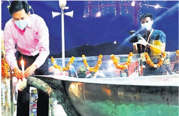
ସବୁରୁ ବଡ଼ ଦାପ

ପିଲାମାନେ ତୁମେ ତ ଦାପ ଦେଖୁଥିବ ନିଶ୍ଚୟ । ଛୋଟ ବଡ଼ ଆଦି ବିଭିନ୍ନ ପ୍ରକାରର ଦାପ ରହିଛି । ବେଳେବେଳେ ସ୍ମରଣ ଅବସରକୁ ସୃଷ୍ଟିରେ ରଖି ବଡ଼ ବଡ଼ ଦାପ ବି ତିଆରି କରାଯାଏ । ଯେଉଁଥିରେ ୪-୫ ଲିଟର ତେଲ ଧରିପାରେ । କିନ୍ତୁ ଏମିତି ବି ଏକ ଦାପ ରହିଛି, ଯେଉଁଥିରେ ୨ ହଜାରରୁ ଅଧିକ ଲିଟର ତେଲ ଧରିପାରେ । ଏମିତି ଏକ ବଡ଼ ଦାପ ତିଆରି ହୋଇ କୁମ୍ଭମେଳାରେ ପ୍ରଦର୍ଶିତ କରାଯାଇଥିଲା । ଏତେ