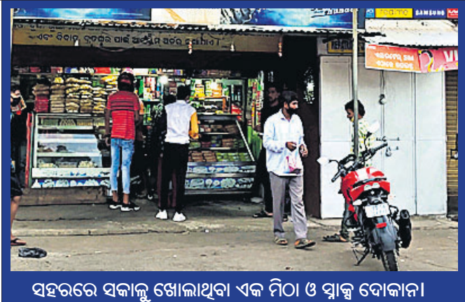
ସହରରେ ସକାଳୁ ଖୋଲାଥିବା ଏକ ମିଠା ଓ ସ୍ଵାଦୁ ବୋକାନ।

କଠୋର ହେବ ବୋଲି ସୂଚନା ମିଳିଛି। ଗୁରୁବାର ରାତି ୯ଟାରୁ ବନ୍ଦ ରହିଥିବା ଚାଳଚେର ପୌରାଞ୍ଚଳ ଓ ବଇଁଠା ବଜାରରେ କଟକଣା ଉଲ୍ଲସନର ସେପରି ଚିତ୍ର ଦେଖିବାକୁ ମିଳି ନ ଥିଲା।