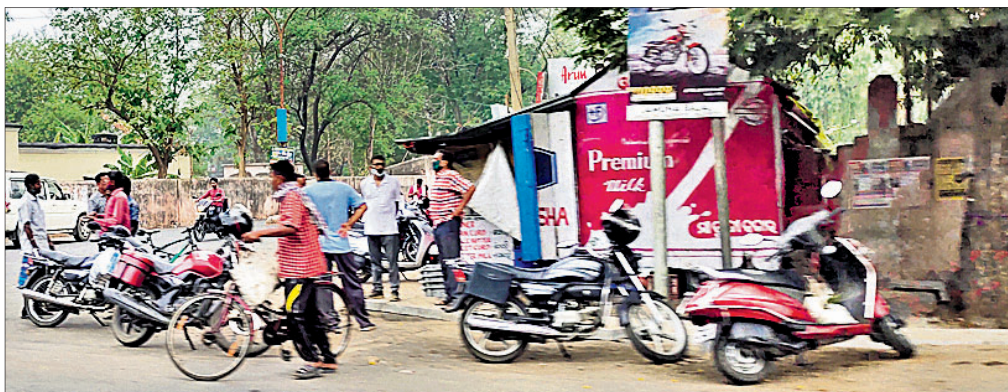
ଅନୁଗୋଳ ସହରର ଏକ ଚା' ଦୋକାନ ନିକଟରେ କେତେଜଣ ଲୋକ ପହଞ୍ଚିଛନ୍ତି।

ଅନୁଗୋଳ ଜିଲ୍ଲାରେ କରୋନା ବୁଦ୍ଧି ସଂକ୍ରମଣ କାରି ରହିଛି। ବିଶେଷକରି ଅନୁଗୋଳ, ଚାଳଚେର ଓ କିଶୋରନଗର ବ୍ଲକ୍ରେ ଦୈନିକ ଅଧିକ ସଂଖ୍ୟକ ପଜିଟିଭ୍ ଟିକ୍ସଟ୍ ହେଉଛନ୍ତି।