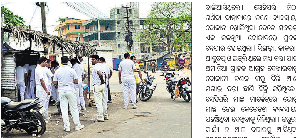
ଶିମିଳିପଡ଼ାଠାରୁ ଏକ ପାନ ଦୋକାନରେ ପିଟିସି ଅଫିସରଙ୍କ ଗହଳ।

କଠୋର ହେବ ବୋଲି ସୂଚନା ମିଳିଛି। ଗୁରୁବାର ରାତି ୯ଟାରୁ ବନ୍ଦ ରହିଥିବା ଚାଳଚେର ପୌରାଞ୍ଚଳ ଓ ବଇଁଠା ବଜାରରେ କଟକଣା ଉଲ୍ଲସନର ସେପରି ଚିତ୍ର ଦେଖିବାକୁ ମିଳି ନ ଥିଲା।