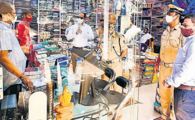
କଟକଣା ମାନିବା ପାଇଁ ଜଣେ ବ୍ୟବସାୟୀଙ୍କୁ ହାତ ଯୋଡ଼ି ତହସିଲଦାର ଅନୁରୋଧ କରୁଛନ୍ତି।

ଅନୁଗୋଳ ଜିଲ୍ଲା କିଶୋରନଗର ବ୍ଲକ୍ ହତ୍ୟା ଓ କିଶୋରନଗର ଥାନା ଅଞ୍ଚଳର ବିଭିନ୍ନ ଗ୍ରାମରେ କିଛିଦିନ ହେବ କରୋନା ସଂକ୍ରମଣ ବୃଦ୍ଧି ପାଇଛି।