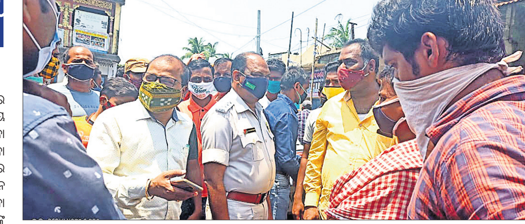
ତହସିଲଦାର ଏବଂ ଏଡ଼ିପିଓ ଉଭେନ୍ଦ୍ର ବ୍ୟବସାୟୀଙ୍କ ସହ ଆଲୋଚନା କରୁଛନ୍ତି।