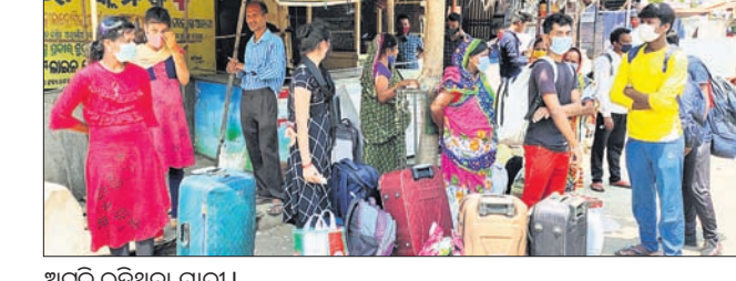
ଅଧିକ ରହିଥିବା ଯାତ୍ରୀ।

କାର୍ଯ୍ୟାଳୟଗୁଡ଼ିକ ଗ୍ରହଣ କରାଯାଇଥିଲା। ପୋଲିସ ପ୍ରଶାସନ ପକ୍ଷରୁ ସହରର ଫାଷ୍ଟ ମେଟ, ଲୋଡାପଡ଼ା, ଖୋଡ଼ାପିଲି, ଆଲୁଲି ଓଭରବ୍ରିଜ୍ ଓ ଅନ୍ୟସବୁର ରୋଡ଼ ଆଦି ମୁଖ୍ୟ ଛକଗୁଡ଼ିକରେ ଅସ୍ଥାୟୀ କ୍ୟାମ୍ପ କରାଯାଇ ଯିବାଆସିବା କରୁଥିବା ଯାନବାହନଗୁଡ଼ିକର କାର୍ଗଜପତ୍ର ଯାଞ୍ଚ କରାଯାଇଥିଲା। ଶତ୍ରୁତାଉନ୍ ଯୋଗୁ ସମସ୍ତ ଯାତ୍ରାବାହୀ ବସ୍ ସେବା ବନ୍ଦ ରହିବା ଫଳରେ ଦୂରଦୂରାନ୍ତରୁ ଆସୁଥିବା କେତେକ ଯାତ୍ରୀ ସମସ୍ୟାର ସମ୍ମୁଖୀନ ହୋଇଥିଲେ।