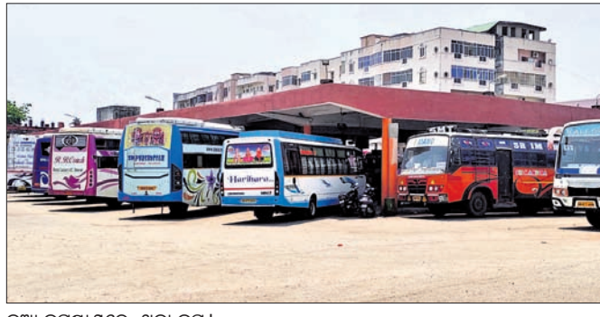
ଦୁଆ ବସ୍ଷ୍ଟାଣ୍ଡରେ ଥିବା ବସ୍।