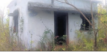
ପାରଳାଖେମୁଣ୍ଡି, ୨୪୪୫ (ଡି.ଏନ୍.ଏ.)