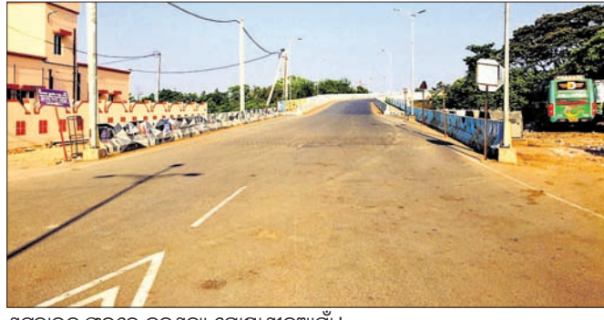
ଶତ୍ରୁତାଉନ୍ ଫକରେ ଜନଶୂନ୍ୟ ଗୋଷାଣୀୟାଗାଁ।