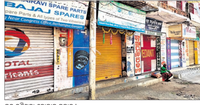
ବନ୍ଦ ରହିଥିବା ଦୋକାନ ବଜାର।