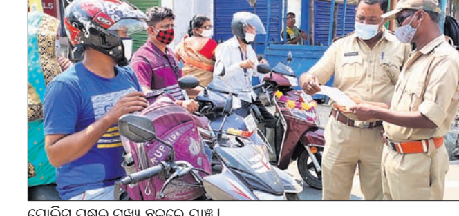
ପୋଲିସ୍ ପକ୍ଷରୁ ମୁଖ୍ୟ ଛକରେ ଯାଞ୍ଚ।