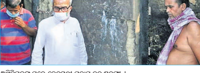
ଅଗ୍ନିପିପନଙ୍କ ଘରେ କେନ୍ଦ୍ରମନ୍ତ୍ରୀ ପ୍ରତାପ ଚନ୍ଦ୍ର ଷଡ଼ଙ୍ଗୀ ।