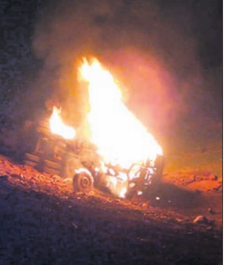
ଦୁର୍ଘଟଣାଗ୍ରସ୍ତ ଟ୍ରକ୍ ଜଳୁଛି।

ଦେବଗଡ଼ ଜିଲା ବାରକୋଟ ଥାନା ଅନ୍ତର୍ଗତ ୪୯ ନମ୍ବର ଜାତୀୟ ରାଜପଥର କଳା ଗ୍ରାମ ପୋଲ ନିକଟରେ ଏକ ଲୁହାପଥର ବୋହେଇ ଟ୍ରକ୍ ଦୁର୍ଘଟଣାଗ୍ରସ୍ତ ହୋଇଛି। ସେଥିରେ ନିଆଁ ଲାଗିଯିବା ସହ ଚାଳକ ଜୀବନ୍ତ ବନ୍ଦୁ ହୋଇଥିବା ଜଣାପଡ଼ିଛି। ଶନିବାର ରାତି ପ୍ରାୟ ୧୦ଟା ୧୫ରେ କେନ୍ଦୁଝରପୁର ଏକ ଲୁହାପଥର ବୋହେଇ ଟ୍ରକ୍ (ନଂ. ଓଡି ୦୯-୫୮୧୯୦) ବାରକୋଟ ଆଡ଼କୁ ଆସୁଥିବା ସମୟରେ ବିପରୀତ ଦିଗରୁ ଯାଉଥିବା ଅନ୍ୟ ଏକ ମାଲବୋହେଇ ଟ୍ରକ୍ କଳା ପୋଲ ନିକଟରେ ଅତିକ୍ରମ କରିଥିଲା। ଫଳରେ ଲୁହାପଥର ବୋହେଇ ଟ୍ରକ୍ ଚାଳକ ଭାରସାମ୍ୟ ହରାଇବାରୁ ଟ୍ରକ୍ ଗାଝା ତଳକୁ ଖସି ଟ୍ରକ୍ ପଡ଼ିବା ସହ ସେଥିରେ ତଳରୁ ନିଆଁ ଲାଗିଯାଇଥିଲା। ସୂଚନାପାଇଁ ବାରକୋଟ ଦମକଳ ବାହିନୀ ଘଟଣାସ୍ଥଳରେ ପହଞ୍ଚି ନିଆଁକୁ ଆୟତ୍ତ କରିଥିଲେ। ଯେଉଁ ଟ୍ରକ୍ ଚାଳକ ବାହାରକୁ ବାହାରି ନ ପାରି ଜଳି ଯାଇଥିଲେ।