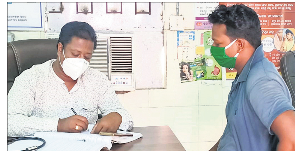
ଡାକ୍ତର ଆସି ନ ଥିବାରୁ ଫାର୍ମାସିଷ୍ଟ ରୋଗୀକୁ ଚିକିତ୍ସା କରୁଛନ୍ତି।

ଜନସାଧାରଣଙ୍କୁ ଉତ୍ତମ ସ୍ୱାସ୍ଥ୍ୟସେବା ଯୋଗାଇ ଦେବାକୁ ପ୍ରତି ୨୫ ହଜାର ଜନସଂଖ୍ୟାକୁ ନେଇ ପ୍ରାଥମିକ ସ୍ୱାସ୍ଥ୍ୟକେନ୍ଦ୍ର ରହିଥିବା ବେଳେ ଲକ୍ଷେରୁ ଉର୍ଦ୍ଧ୍ୱ ଲୋକଙ୍କୁ ନେଇ ରହିଛି ଗୋଷ୍ଠୀ ସ୍ୱାସ୍ଥ୍ୟକେନ୍ଦ୍ର।