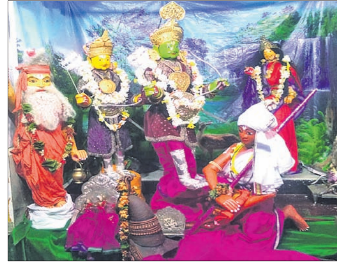
ଶ୍ରୀରାମାୟଣ କାଉଁରୀ ଗଙ୍ଗାପାର ବେଶ ।