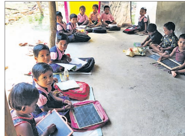
ମହାକାଳପଡ଼ାର ଏକ ଅଜ୍ଞାନତା କେନ୍ଦ୍ରର ନିଜସ୍ୱ ଗୃହ ନ ଥିବାରୁ ଶିଶୁମାନେ ଜଣେ ବ୍ୟକ୍ତିଙ୍କ ବାରଣ୍ଡାରେ ବସି ପଢୁଥିବାର ଦୃଶ୍ୟ।

ପାଇଁ ବେଶ୍ ଉପଯୋଗୀ। ତେବେ ନିଜସ୍ୱ କେନ୍ଦ୍ରର ଗୃହ ନିର୍ମାଣ ନ ହେବା ଫଳରେ ଯୋଜନା ପ୍ରଣୟନର ପ୍ରକୃତ ଉଦ୍ଦେଶ୍ୟ ସାଧିତ ହୋଇପାରୁନାହିଁ।