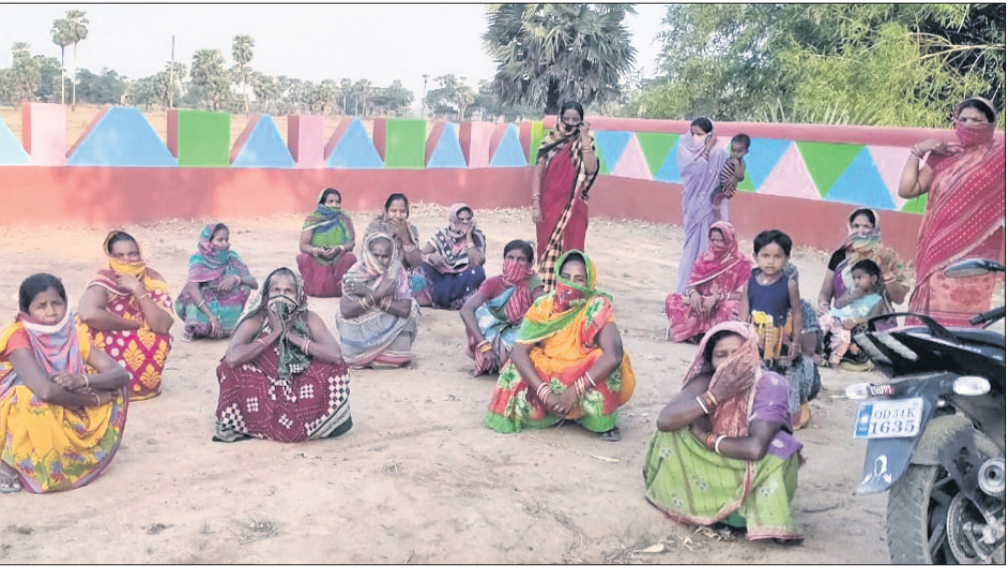
ମହିଳାମାନେ ସରପଞ୍ଚଙ୍କ ଭେଟି ପାଣି ଯୋଗାଇ ଦେବାର ବ୍ୟବସ୍ଥା କରିବାକୁ କହୁଛନ୍ତି।

ହୋଇ ଡାକ୍ତରଙ୍କର ପରାମର୍ଶ ଲୋଭୁଛନ୍ତି। କିନ୍ତୁ ରବିବାର ଛୁଟିଦିନ ଥିବା ବେଳେ ନାରଗାଁ ଗୋଷ୍ଠୀ ସ୍ୱାସ୍ଥ୍ୟକେନ୍ଦ୍ରରେ ଡାକ୍ତରଙ୍କ ବଦଳରେ ଫାର୍ମାସିଷ୍ଟ ଆଡ଼ତୋରରେ ରୋଗୀଙ୍କୁ ଦେଖୁଥିଲେ।