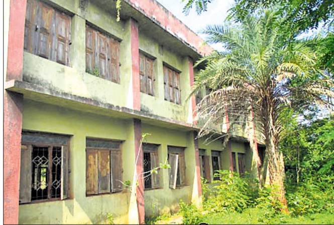
ଭଗ୍ନ ଅବସ୍ଥାରେ ଥିବା କର୍ଷିକୋ ପାଠଶାଳା ।

ନିମ୍ନମାନର କାମ ଏବଂ ଉପଯୁକ୍ତ ରକ୍ଷଣାବେକ୍ଷଣ ଅଭାବରୁ ଦୀର୍ଘ ୨୪ ବର୍ଷ ହେବ ଅବହେଳିତ ଅବସ୍ଥାରେ ପଡ଼ିଥିବା କର୍ଷିକୋ ପାଠଶାଳା ଭାଙ୍ଗି ପଡ଼ିବାକୁ ବସିଛି ।