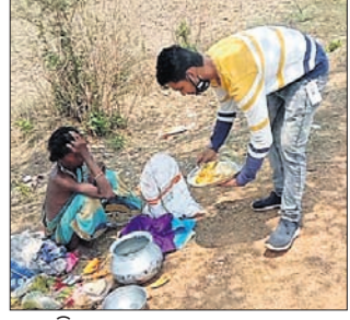
ହେଲପିଙ୍ଗ୍ ହ୍ୟାଣ୍ଡ ପକ୍ଷରୁ ଅସହାୟଙ୍କୁ ରକ୍ଷା ଖାଦ୍ୟ ଦିଆଯାଉଛି ।

ଭଞ୍ଜନଗର ବ୍ଲକ୍ ଓ ଏନଏସିରେ ଶନିବାର ସୁଦ୍ଧା ୪୬ ଜଣ ସଂକ୍ରମିତ ହୋଇଛନ୍ତି । ସେଥିମଧ୍ୟରୁ ୧୩ ଆକ୍ରାନ୍ତ ସୁସ୍ଥ ହୋଇଥିବା ବେଳେ ୩୨ ଜଣ ସଂକ୍ରମିତ ହୋଇଥିବା ରବିବାର ସୂଚନା ମିଳିଛି ।