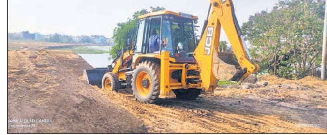
କେସିବି ଲଗାଇ ନଦୀକୁ ପୋତାଯାଇଛି।

ପାଚାଦାପ, ୨୫୪ (ସ୍ୱ.ପ୍ର.): ପାଚାଦାପ ଉପକଣ୍ଠରେ ବାଲିଖୋରା ବସ୍ତି ଓ ଉଦୟବିହାର ମଠିରେ ଥିବା ବନ୍ଦନଦୀ ଉପରେ ରାତ୍ରି ନିର୍ମାଣରୁ ରବିବାର ବସ୍ତିବାସିଦା ବିରୋଧ କରିବା ସହ କାମ ବନ୍ଦ କରିଛନ୍ତି।