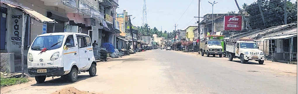
ଶରତାଞ୍ଜନ ପୋଲିସ୍ ରାସ୍ତାଘାଟ ଜନଶୂନ୍ୟ ହୋଇପଡ଼ିଛି ।

ନୟାଗଡ଼ ଅଫିସ, ୨୫.୪.୨୧: ନୟାଗଡ଼ ଜିଲ୍ଲାର ବାସୁନ୍ଦରୀ ଥାନା ପୋଲିସ୍ ଟୀମ୍ ଲିଗର ବିଭେଗୀ ମଦ ସହ ଏକ ବୋଲେରୋ ଜବତ କରିଛି । ଉକ୍ତ ଗାଡ଼ିରେ ମଦ ବୋଲ୍‌ରୋ ହେଉଥିଲା । ଏହି ଘଟଣାରେ ପୋଲିସ୍ ମୟୂରଖାଲିଆ ତତ୍ତ୍ୱସାହିବ ବିଭେଦ କେଶରୀ ପ୍ରଧାନଙ୍କୁ ଗିରଫ କରିଛି । ଏତଦ୍ୱାରା ଏକ ମାମଲା(ନଂ.୬୪/୨୧) ରୁଟି ହୋଇଛି । ପୋଲିସ୍ ତଦନ୍ତ ଜାରି ରଖିଛି ।