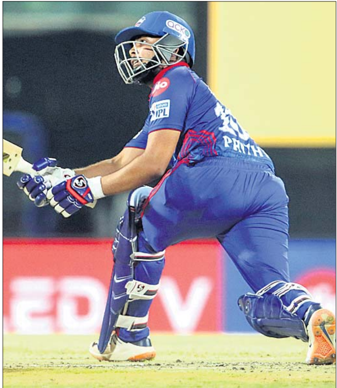
ମ୍ୟାଚ ଅଫ୍ ଦି ମ୍ୟାଚ ପୃଥ୍ୱୀ ଶାଁ