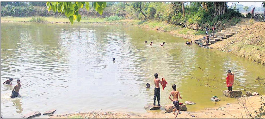
କାବୁଆ ଗତିସ୍ୱର ମନ୍ଦିର ନିକଟ ଜଗନ୍ନାଥ ପୋଖରୀ ।

ନୟାଗଡ଼ ଅଫିସ, ୨୫.୪.୨୧: ନୟାଗଡ଼ ଓ ଖୋର୍ଦ୍ଧା ବନଖଣ୍ଡରେ ବନ ବିଭାଗ ଗ୍ରାଣ୍ଟ ପାଇଛି । ବନ ବିଭାଗର କାମ ଏବେ ଜ୍ରାନ୍ତମୁଖ୍ୟର ସ୍ୱତନ୍ତ୍ର ଟାକ୍ସ(ଏସ୍‌ଏସ୍) କରୁଛି । ତଥାପି ବନ ବିଭାଗର ନିଦ ଭାଙ୍ଗୁନାହିଁ । ଏସ୍‌ଏସ୍‌ଏସ୍ ୧୦ ମାସର କାର୍ଯ୍ୟକୁ ଅନୁଧ୍ୟାନ କଲେ ଏହା ପ୍ରମାଣିତ ହୋଇଛି । ଉଭୟ ବନଖଣ୍ଡରୁ ଏସ୍‌ଏସ୍‌ଏସ୍ ଗତ ୧୦ ମାସ ମଧ୍ୟରେ ୬ ବାଘଛାଲ, ୨ ହାତାଦାଗ୍ ଜବତ କରାଯାଇଛି । ବନ ବିଭାଗର ଅବହେଳା ଯୋଗୁଁ ବାଘ, ହାତାଦାଗ୍ ବଢ଼ିଛି । ଶିକାରୀ ଓ ବ୍ୟବସାୟୀମାନେ ମିଶି ବାଘଛାଲ ଓ ହାତାଦାଗ୍ ଅନ୍ୟ ଅଞ୍ଚଳକୁ ଚାଲି ଯାଇଛନ୍ତି । ଚତୁର୍ଥାଧିକ ସଂଖ୍ୟାରେ ବାଘଛାଲ ଓ ହାତାଦାଗ୍ ଅନ୍ୟ ଅଞ୍ଚଳକୁ ଚାଲି ଯାଇଛି । କେତେକଗଣ ବ୍ୟକ୍ତିଙ୍କ ମତରେ ଏହାର କୌଣସି ଖବର ଲୋକଲୋଚନକୁ ଆସିପାରିନାହିଁ । ଏସ୍‌ଏସ୍‌ଏସ୍ ପକ୍ଷରୁ ବାଘଛାଲ ଓ ହାତାଦାଗ୍ ଜବତ ହେବା ପରେ ଏହି ତଥ୍ୟ ସାମ୍ବାଦିକ ଆହୁରି ବୋଲି ଯାଆନ୍ତେଇ ଯାଆନ୍ତେଇ ପଡ଼ିପାରେ । ସୁତରା ଅନୁଯାୟୀ, ନୟାଗଡ଼ ଓ ଖୋର୍ଦ୍ଧା ବନଖଣ୍ଡରୁ ଅଞ୍ଚଳରେ ବନଜବତ ଉଭୟ ବନଖଣ୍ଡରୁ ଏସ୍‌ଏସ୍‌ଏସ୍ ଗତ ୧୦ ମାସ ମଧ୍ୟରେ ୬ ବାଘଛାଲ, ୨ ହାତାଦାଗ୍ ଜବତ କରାଯାଇଛି । ବନ ବିଭାଗ ନିଜ କାର୍ଯ୍ୟକୁ ଅନୁଧ୍ୟାନ କଲେ ଏହା ପ୍ରମାଣିତ ହୋଇଛି । ଉଭୟ ବନଖଣ୍ଡରୁ ଏସ୍‌ଏସ୍‌ଏସ୍ ଗତ ୧୦ ମାସ ମଧ୍ୟରେ ୬ ବାଘଛାଲ, ୨ ହାତାଦାଗ୍ ଜବତ କରାଯାଇଛି । ବନ ବିଭାଗ ନିଜ କାର୍ଯ୍ୟକୁ ଅନୁଧ୍ୟାନ କଲେ ଏହା ପ୍ରମାଣିତ ହୋଇଛି । ଉଭୟ ବନଖଣ୍ଡରୁ ଏସ୍‌ଏସ୍‌ଏସ୍ ଗତ ୧୦ ମାସ ମଧ୍ୟରେ ୬ ବାଘଛାଲ, ୨ ହାତାଦାଗ୍ ଜବତ କରାଯାଇଛି । ବନ ବିଭାଗ ନିଜ କାର୍ଯ୍ୟକୁ ଅନୁଧ୍ୟାନ କଲେ ଏହା ପ୍ରମାଣିତ ହୋଇଛି । ଉଭୟ ବନଖଣ୍ଡରୁ ଏସ୍‌ଏସ୍‌ଏସ୍ ଗତ ୧୦ ମାସ ମଧ୍ୟରେ ୬ ବାଘଛାଲ, ୨ ହାତାଦାଗ୍ ଜବତ କରାଯାଇଛି ।