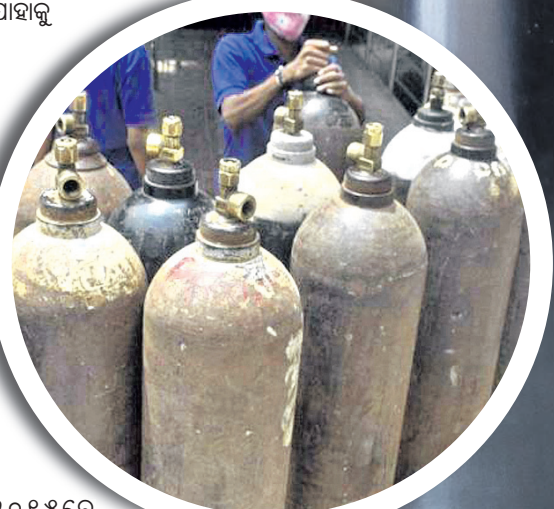
୨୦୧୫ରେ ଅତ୍ୟାବଶ୍ୟକ ସାମଗ୍ରୀ ସୂଚୀରେ ଅନ୍ତର୍ଭୁକ୍ତ କରାଯାଇଛି ।