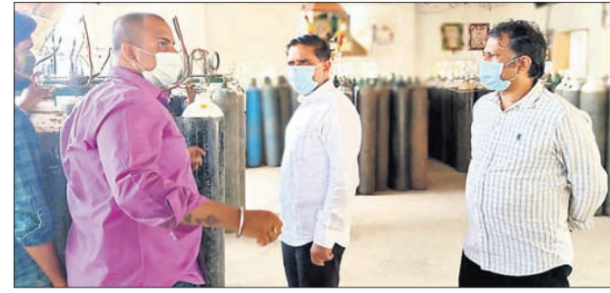
ଜିଲ୍ଲାପାଳ ଅନୁଧ୍ୟାନ କରୁଛନ୍ତି । ବ୍ରହ୍ମପୁର ଅଫିସ୍/ଇନ୍ଦ୍ରପୁର, ୨୫୪ (ଡି.ଏନ୍.ଏ.)