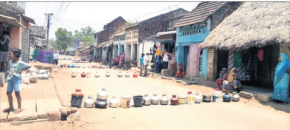
ମହିଳାମାନେ ରାସ୍ତାରେ ଗରା, ବାଲଟି ରଖି ରାସ୍ତା ଅବରୋଧ କରିଛନ୍ତି ।