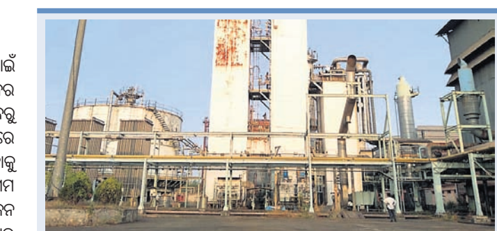
ନିଜସ୍ୱ ପାଖାର ପ୍ଲାଣ୍ଟ ଅଟଳ ନିରନ୍ତର ବିଦ୍ୟୁତ୍ ସେବା ନ ମିଳିଲେ ଅକ୍ସିଜେନ ମିଳିବା ଅସମ୍ଭବ

କୋଭିଡ୍ ସଂକ୍ରମଣର ଚିନ୍ତା ପାଇଁ ଦେଶରେ ମୋଡିକାଲ ଅକ୍ସିଜେନର ବହୁଳ ଚାହିଦା ରହିଛି।