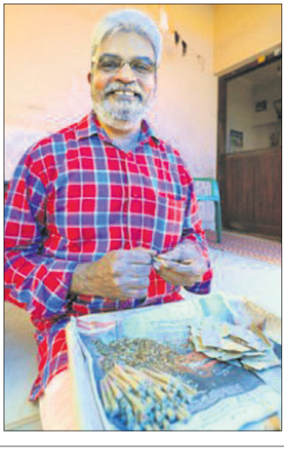
ଆକାଉଣ୍ଟରେ ମାତ୍ର ୮୫୦ ଟଙ୍କା