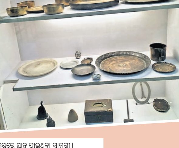
ମଧୁସୂଦନ ସଂଗ୍ରହାଳୟରେ ସ୍ଥାନ ପାଇଥିବା ସାମଗ୍ରୀ।

ମଧୁସୂଦନ। ସେ ମହତ୍ତ୍ଵ ଅର୍ଥ ପ୍ରଚଳାଭନକୁ ପ୍ରତ୍ୟାଖ୍ୟାନ କରି ଠିଆ ହେଲେ ଗରିବ ଚାଷୀମାନଙ୍କ ସଂଗ୍ରହରେ। ସବୁ ବଡ଼ ବଡ଼ ଓକିଲ ତାଙ୍କ ପାଇଁ ଲଢ଼ୁଥିବାରୁ ଏ ନୂଆ ଓଡ଼ିଆ ଓକିଲକୁ ନେଇ କିଛି ଫରକ ପଡ଼ିବନି ବୋଲି ଭାବିଥିଲେ ମହନ୍ତ। ମାତ୍ର ବିଧି ବିଧାନ ଥିଲା ଅଲଗା। ମଧୁସୂଦନଙ୍କ ବଳିଷ୍ଠ ଜନାଦରଣ ଓ ମୋକଦ୍ଦମା ପରିଚାଳନା କୌଶଳ ଆଗରେ ହାର ମାନିଲେ ସବୁ ନାମାଦୀମାନ ଓକିଲ। ଜିତାପତ ନେଲା ଗରିବ ଚାଷୀ। ତା'ପରଠାରୁ ଆକାଶକୁ ଛୁଆଁ ହେଲା ମଧୁସୂଦନଙ୍କ ସୁନାମ। ମଧୁସୂଦନ ବାରିଷ୍ଟରୀ ପଡ଼ି ନ ଥିଲେ, କିନ୍ତୁ ଲୋକେ ତାଙ୍କୁ ସ୍ଵତନ୍ତ୍ର