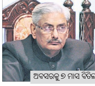
ଅବସରକୁ ୭ ମାସ ବିତାଇ

ନୂଆଦିଲ୍ଲୀ, ୨୭/୪ ଅବସର ପ୍ରାୟ ୭ ମାସ ପରେ ବି ସରକାରୀ ବଙ୍ଗଳା ଛାଡ଼ିନାହାନ୍ତି ସୁପ୍ରିମକୋର୍ଟର ପୂର୍ବତନ ବିଚାରପତି ଜଷ୍ଟିସ୍ ଅରୁଣ ମିଶ୍ର । ନୂଆଦିଲ୍ଲୀର ଆକବର ରୋଡ୍‌ସ୍ଥିତ ବଙ୍ଗଳାରେ ରହିବା ଅବଧିକୁ ଏପ୍ରିଲ ପର୍ଯ୍ୟନ୍ତ ବଢ଼ାଇବାକୁ ସେ ସୁପ୍ରିମକୋର୍ଟକୁ ଅନୁରୋଧ କରିଛନ୍ତି । ଜଷ୍ଟିସ୍ ମିଶ୍ରଙ୍କ କହିବା ଅନୁଯାୟୀ, ଜୁମାର ଭାବେ ତାଙ୍କ ସପ୍ତାହ । ଭାରତର ସ୍ଥିତି ଅତ୍ୟନ୍ତ ହୃଦୟ ବିଦାରକ । ଏଥିରେ ମୁକ୍ତମୁଖୀ ପାଇଁ ଆମେ କରୁଣା ଅକ୍ସିଜେନ ଓ ଅନ୍ୟ ସାମଗ୍ରୀ ଯୋଗାଣକୁ ସୁନିଶ୍ଚିତ କରୁଛି ।