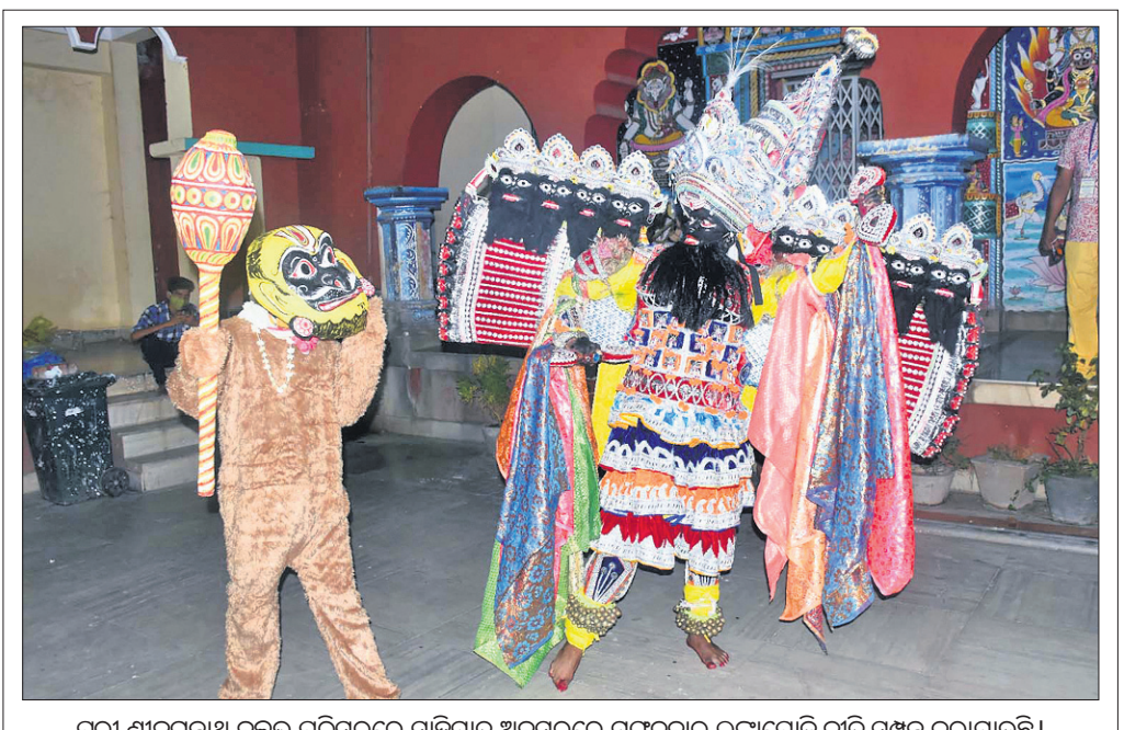
ପୁରୀ ଶ୍ରୀଜୀଉଙ୍କୁ ବଳୁଇ ପରିସରରେ ସାହିଯାତ୍ର ଅବସରରେ ମଙ୍ଗଳବାର ଲଙ୍କାପୋଡ଼ି ନାଟ ସମ୍ପନ୍ନ କରାଯାଇଛି।