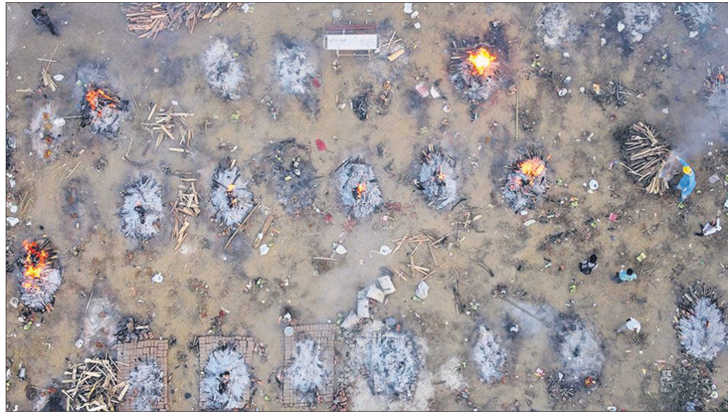
ଦିଲ୍ଲୀର ଏକ ଶ୍ମଶାନରେ ଗଣ ଶବ ସକ୍ୱାର ବେଳର ଦୃଶ୍ୟ ।

ରାଜନୈତିକ ରାଜଧାନୀ ଦିଲ୍ଲୀ ୩ ଆର୍ଥିକ ରାଜଧାନୀ ମୁମ୍ବାଇରେ ତାଲାବନ୍ଦ ହୋଇଛି । ଦୁଇ ବଡ଼ ସହରର ପ୍ରଶାସନ ରାସ୍ତାଗୁଡ଼ିକରେ ସାଇଲେନ୍ସ ବଜାଇ ଆସୁଛି । ସଂକ୍ରମଣ ସୁନାମରେ ସ୍ୱାସ୍ଥ୍ୟ ଭିତ୍ତିଭୂମି ଧୋଇ ହୋଇଯାଇଛି । ହାତରେ ପର୍ଯ୍ୟାୟ ଭାଙ୍ଗି ନାହିଁ । ଅକ୍ସିଜେନ, ଇଞ୍ଜିନିୟରିଂ, ଔଷଧ, ଶଯ୍ୟାରେ ଅଭାବ ଦେଖିବାକୁ ଆରମ୍ଭ ହୋଇଛି । ମୃତଦେହ ସକ୍ୱାର ପାଇଁ ଲାଗୁଥିବା ଏବଂ ଲିଫ୍ଟ ନ ଥିବା ଚିତା ଦୃଶ୍ୟ ସମଗ୍ର ଦିଲ୍ଲୀକୁ ବ୍ୟାପି ଚାଲିଛି ।