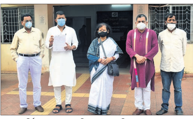
ମୁଖ୍ୟ ନିର୍ବାଚନ ଅଧିକାରୀଙ୍କୁ ଦାବିପତ୍ର ଦେବାକୁ ଆସିଥିବା କଂଗ୍ରେସ ନେତୃବୃନ୍ଦ।