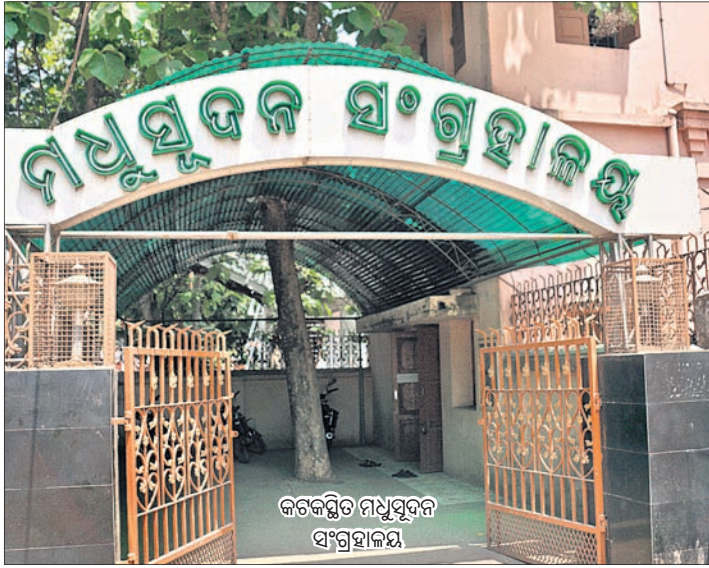
କଟକସ୍ଥିତ ମଧୁସୂଦନ ସଂଗ୍ରହାଳୟ