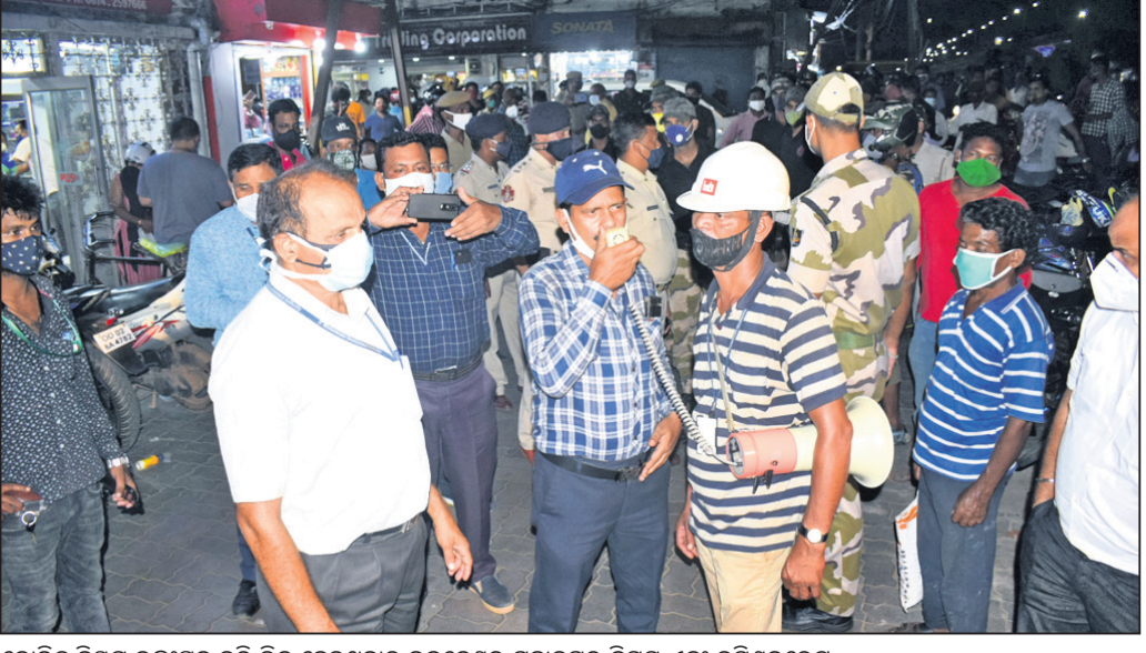
କୋଭିଡ୍ ନିୟମ ଉଲ୍ଲଙ୍ଘନ କରି ଭିଡ଼ ହେଉଥିବାରୁ ଭୁବନେଶ୍ୱର ମହାନଗର ନିଗମ ଏବଂ କମିଶନରେଟ୍ ପୋଲିସ୍ ପକ୍ଷରୁ ବୁଧବାର ରାଜଧାନୀର ମାର୍କେଟ୍ ବିଲ୍ଡିଂ ୪୮ ଘଣ୍ଟା ପାଇଁ ବନ୍ଦ କରାଯାଇଛି।