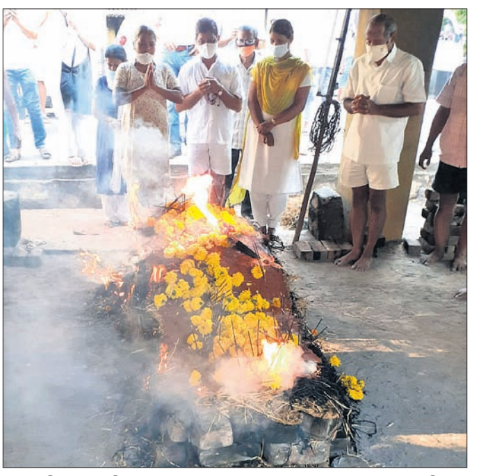
ଅରବିନ୍ଦ ଆଶ୍ରମ ନିକଟସ୍ଥ ଶୁଶ୍ରୂଣା ଘାଟରେ ମନୋଜଙ୍କ ଶେଷକୃତ୍ୟ ସମ୍ପନ୍ନ ହେଉଛି।

ଓଡ଼ିଆ ସାହିତ୍ୟର ଯଶସୀ ସାଧକ ମନୋଜ ଦାସ ରୁଧିରାଦେବୀ ପଞ୍ଚଭୂତରେ ଲୀନ ହୋଇଛନ୍ତି। ରାଷ୍ଟ୍ରୀୟ ମର୍ଯ୍ୟାଦା ସହ ପୁରୁଷୋତ୍ତମ ଅରବିନ୍ଦ ଆଶ୍ରମ ନିକଟସ୍ଥ ଶୁଶ୍ରୂଣା ଘାଟରେ ତାଙ୍କର ଶେଷକୃତ୍ୟ ସମ୍ପନ୍ନ ହୋଇଛି। ଶେଷକୃତ୍ୟ ସମୟରେ ପୁରୁଷୋତ୍ତମ ସରକାରଙ୍କ ଚରଫରୁ ବହୁ ବିଶିଷ୍ଟ ବ୍ୟକ୍ତି ଉପସ୍ଥିତ ଥିବାବେଳେ ଓଡ଼ିଶା ସରକାରଙ୍କ ଚରଫରୁ ସଂସ୍କୃତି ମନ୍ତ୍ରୀ ଡାକ୍ତରପ୍ରକାଶ ପାଣିଗ୍ରାହୀ ଯୋଗ ଦେଇଥିଲେ। ଅନ୍ୟପକ୍ଷେ ମୁଖ୍ୟମନ୍ତ୍ରୀ ନବୀନ ପଟ୍ଟନାୟକ ସମ୍ପାଦନା ସ୍ଵର୍ଗତ ମନୋଜ ଦାସଙ୍କ ପରିବାର ଲୋକଙ୍କ ସହ ଚେଲିଫୋନ ଯୋଗେ କଥା ହେବା ସହିତ ଗଭୀର ଶୋକ ପ୍ରକାଶ କରିଛନ୍ତି।