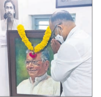
ସଂସ୍କୃତି ମନ୍ତ୍ରୀ ଡାକ୍ତରପ୍ରକାଶ ପାଣିଗ୍ରାହୀ ଶ୍ରଦ୍ଧାସୁମନ ଜଣାଇଛନ୍ତି।

ଅନୁରୋଧ କରିଥିଲେ। ଏପରି କି କେନ୍ଦ୍ରମନ୍ତ୍ରୀ ଧର୍ମେନ୍ଦ୍ର ପ୍ରଧାନ ମଧ୍ୟ ପୁରୁଷୋତ୍ତମ ଉପରାଜ୍ୟପାଳ ଡାକ୍ତରପ୍ରକାଶ ପାଣିଗ୍ରାହୀଙ୍କୁ ଅନୁରୋଧ କରିଥିଲେ।