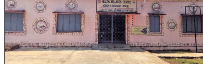
କେରୋଟାଙ୍କ ସ୍ୱାସ୍ଥ୍ୟକେନ୍ଦ୍ର ।