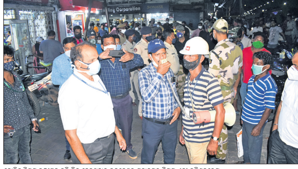
କୋଭିଡ୍ ନିୟମ ଉଲ୍ଲଙ୍ଘନ କରି ଭିଡ଼ ହେଉଥିବାରୁ ଭୁବନେଶ୍ୱର ମହାନଗର ନିଗମ ଏବଂ କମିଶନରେଟ୍ ପୋଲିସ୍ ପକ୍ଷରୁ ବୁଧବାର ରାଜଧାନୀର ମାର୍କେଟ୍ ବିଲ୍ଡିଂ ୪୮ ଘଣ୍ଟା ପାଇଁ ବନ୍ଦ କରାଯାଇଛି।