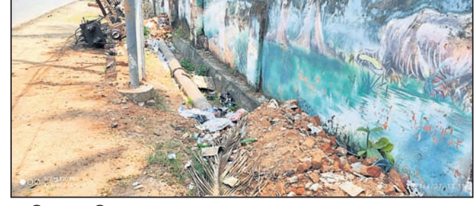
ସୋଡି ହୋଇ ପଡିଥିବା ତ୍ରେନ୍ ।