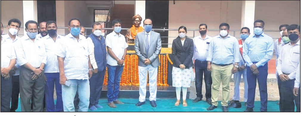
ହିଞ୍ଜିଳିକାରୁରେ ଜିଲ୍ଲା ଜକ୍ ପ୍ରତିମୂର୍ତ୍ତି ଉନ୍ନୋଚନ କରୁଛନ୍ତି ।