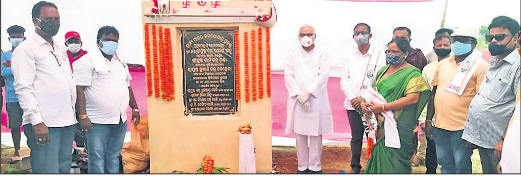
ଏମପି, ବିଧାୟକ, ବ୍ଲକ ଅଧ୍ୟକ୍ଷ ଓ ଅନ୍ୟମାନେ ।