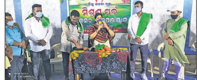
ମିଶ୍ରଣ ପର୍ବରେ ବିଧାୟିକା ଉଦ୍‌ଘୋଷଣା ଦେଉଛନ୍ତି ।