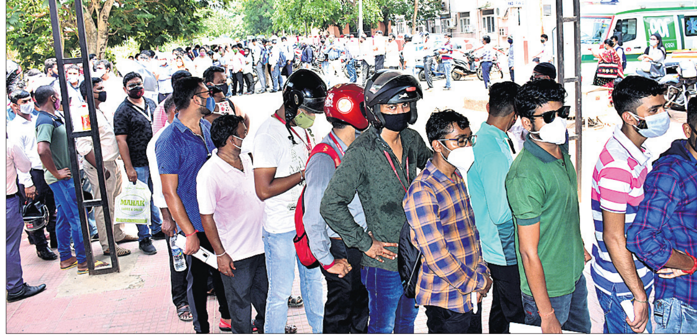
ଭୁବନେଶ୍ୱର କ୍ୟାମ୍ପରେ ହାତୀକୋଳି ଟିକାକରଣ କେନ୍ଦ୍ରରେ ଗୁରୁବାର ଟିକା ନେବା ପାଇଁ ଲୋକେ ଲମ୍ବାଯାତ୍ରରେ ଅପେକ୍ଷା କରିଛନ୍ତି।