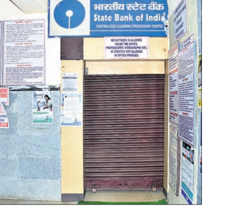
ସିଲ୍ ହୋଇଥିବା କୋର୍ଟ, କୋଟି ସେଣ୍ଟର, ବ୍ୟାଙ୍କ।

ଭୁବନେଶ୍ୱର, ୨୯୪୪ (ବୁଧବେଳା) ରାଜଧାନୀ ଭୁବନେଶ୍ୱରରେ ସଂକ୍ରମଣ ରୋକିବାକୁ ବିପନ୍ନି ଓ କମିଶନରେ ପୋଲିସ ପକ୍ଷରୁ ଚଢ଼ାଇ କରାଯାଇ ଉଚ୍ଚାଧିକାରୀଙ୍କୁ ବାହାରକୁ ଆସିବାକୁ କରାଯାଇଛି।