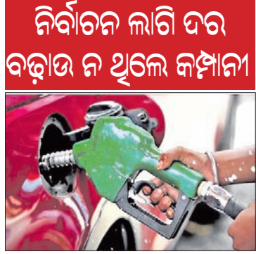
ନିର୍ବାଚନ ଲାଗି ଦର ବଢ଼ାଇ ନ ଥିଲେ କମ୍ପାନୀ

ଦେଶ ମଧ୍ୟରେ ପୁଣି ଥରେ ପେଟ୍ରୋଲ ଏବଂ ଡିଜେଲ ଦର ବଢ଼ିପାରେ। ୪ ରାଜ୍ୟ ଏବଂ ଗୋଟିଏ କେନ୍ଦ୍ର ଶାସିତ ଅଞ୍ଚଳରେ ନିର୍ବାଚନ ଥିବାବୁଡ଼ି ତେଲ ବିପଣନ କମ୍ପାନୀଗୁଡ଼ିକ ବର୍ତ୍ତମାନ ଇଣ୍ଡିଆନ ଦେଲ କୋର୍ପୋରେସନ୍ ପରିଚାଳନା କରୁନାହାନ୍ତି।