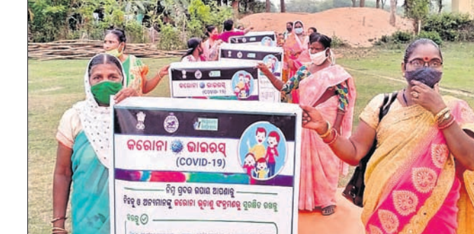
ମହିଳା ଗ୍ରୁପ ଦ୍ୱାରା ସଚେତନତା କରାଯାଇଛି।