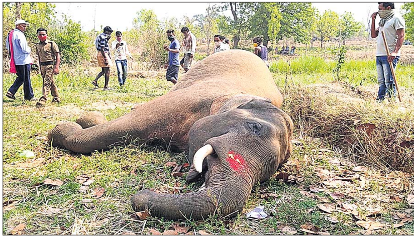
ବାମନା ବନଖଣ୍ଡରେ ଦନ୍ତାହାତୀର ମୃତଦେହ।

ସମ୍ବଲପୁର ଜିଲ୍ଲା ବାମନା ବନଖଣ୍ଡ କାନନ୍ତକୁପା ନିକଟ ଏକ ବିଲ୍ଡୁ ଗୁରୁବାର ସକାଳେ ଏକ ଦନ୍ତାହାତୀର ମୃତଦେହକୁ ବନ ବିଭାଗ ଜବତ କରିଛି।