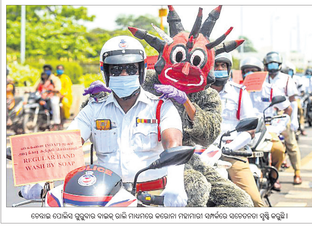
ଡେରାଡୁନ ପୋଲିସ୍ ଗୁରୁବାର ବାଇକ୍ ରାଲି ମାଧ୍ୟମରେ କରୋନା ମହାମାରୀ ସମ୍ପର୍କରେ ସଚେତନତା ସୃଷ୍ଟି କରୁଛି।