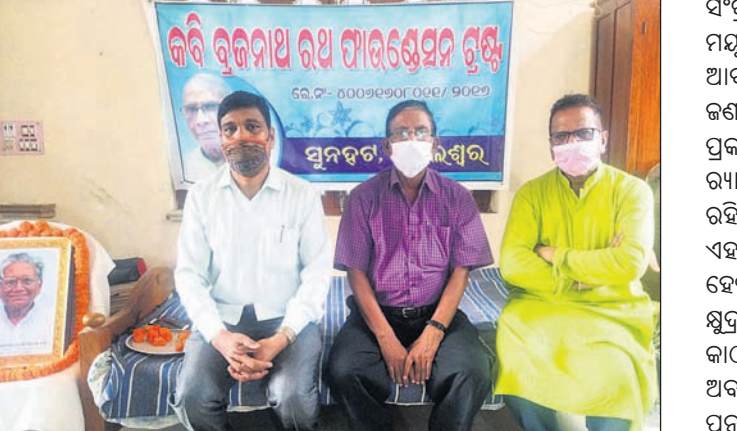
ଶୋକସଭାରେ ଗ୍ରନ୍ଥର କର୍ମକର୍ତ୍ତା।