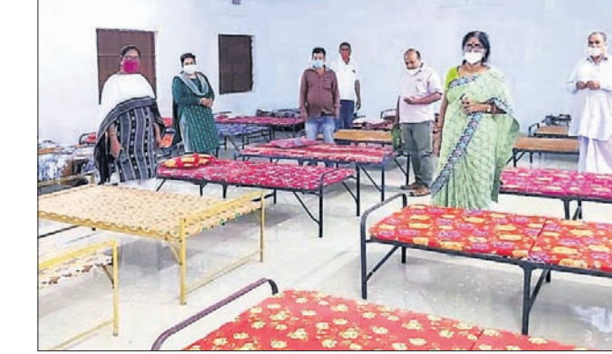
ପ୍ରଶାସନିକ ଅଧିକାରୀମାନେ କୋଭିଡ୍ କେନ୍ଦ୍ରର ସେଣ୍ଟର ବୁଲି ଦେଖୁଛନ୍ତି।