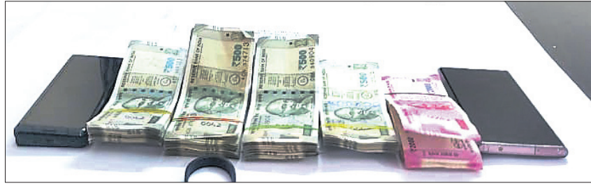
କବଚ ଚକା ସହ ଗିରଫ ଅଭିଯୁକ୍ତ