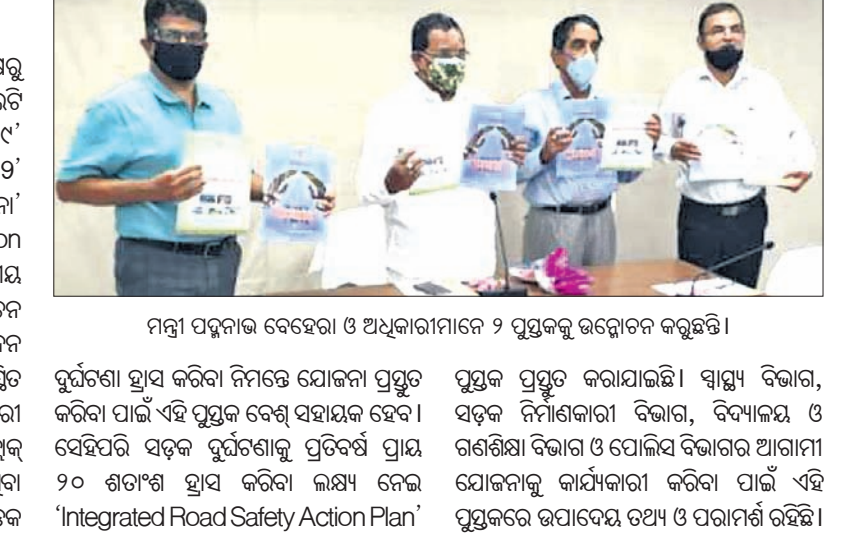
ମନ୍ତ୍ରୀ ପଦ୍ମନାଭ ବେହେରା ଓ ଅଧିକାରୀମାନେ ୨ ପୁସ୍ତକ ଉନ୍ମୋଚନ କରୁଛନ୍ତି।

ଭୁବନେଶ୍ୱର, ୩୦୪ (ବୁଧବୋ) ବାଣିଜ୍ୟ ଓ ପରିବହନ ବିଭାଗ ପକ୍ଷରୁ ଉପନିର୍ଦ୍ଦେଶକ ତପନ ମିଶ୍ରଙ୍କ ଦ୍ୱାରା ଲିଖିତ ଦୁଇଟି ପୁସ୍ତକ 'ଓଡ଼ିଶାରେ ସଡ଼କ ଦୁର୍ଘଟଣା-୨୦୧୯' (Road Accidents in Odisha-2019) ଓ ସମ୍ବନ୍ଧିତ ସଡ଼କ ସୁରକ୍ଷା କାର୍ଯ୍ୟ ଯୋଜନା (Integrated Road Safety Action Plan) ଉନ୍ମୋଚନ ହୋଇଯାଇଛି।