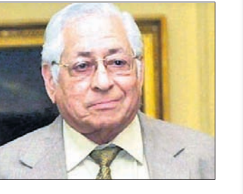
ଆଇନଜୀବୀ ମାନ୍ୟତା ପାଇବା ପରେ ୧୯୮୧ରୁ ୯୦ ଏବଂ ୧୯୯୮ରୁ ୨୦୦୪ ଆର୍ଟି କେନେରାଲ ଭାବେ କାର୍ଯ୍ୟ କରିଥିଲେ। ତାଙ୍କ ପରଲୋକରେ ରାଷ୍ଟ୍ରପତି, ପ୍ରଧାନମନ୍ତ୍ରୀ, ସ୍ପୀକର୍, ପ୍ରଧାନ ବିଚାରପତିଙ୍କ ସମେତ ବହୁ ବିଶିଷ୍ଟ ବ୍ୟକ୍ତି ଶୋକାବ୍ୟକ୍ତ କରିଛନ୍ତି।

ନୂଆଦିଲ୍ଲୀ, ୩୦.୦୪(ପି.ଟି.): ବରିଷ୍ଠ ଆଇନଜୀବୀ ତଥା ଭାରତର ପୂର୍ବତନ ଆର୍ଟି କେନେରାଲ ସୋଲି ଜାହାଙ୍ଗୀର ସୋରାବଜୀଙ୍କ ଶୁକ୍ରବାର ସକାଳେ ପରଲୋକ ହୋଇଯାଇଛି। ତାଙ୍କୁ ୯୧ ବର୍ଷ ହୋଇଥିଲା। ସେ କରୋନା ସଂକ୍ରମିତ ହେବା ପରେ ଦକ୍ଷିଣ ଦିଲ୍ଲୀର ଏକ ଘରୋଇ ହସ୍ପିଟାଲରେ ଭର୍ତ୍ତି ହୋଇଥିଲେ। ପତ୍ନୀ ବିଭୂଷିଣ ସମ୍ମାନରେ ସମ୍ମାନିତ ସୋରାବଜୀ ୧୯୫୩ରେ ବନ୍ଦେ ହାଇକୋର୍ଟରେ ତାଙ୍କ ଆଇନଜୀବୀ କ୍ୟାରିୟର ଆରମ୍ଭ କରିଥିଲେ। ୧୯୭୧ରେ ସୁପ୍ରିମକୋର୍ଟ ଦ୍ଵାରା ବରିଷ୍ଠ