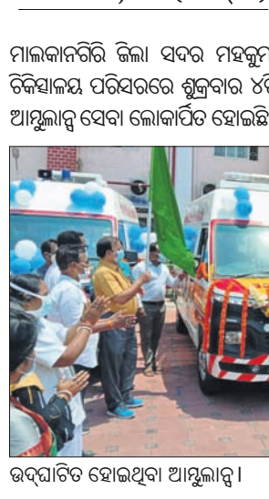
ଉଦ୍ଘାଟନ ହୋଇଥିବା ଆୟୁଲ୍ୟାନ୍ସ।