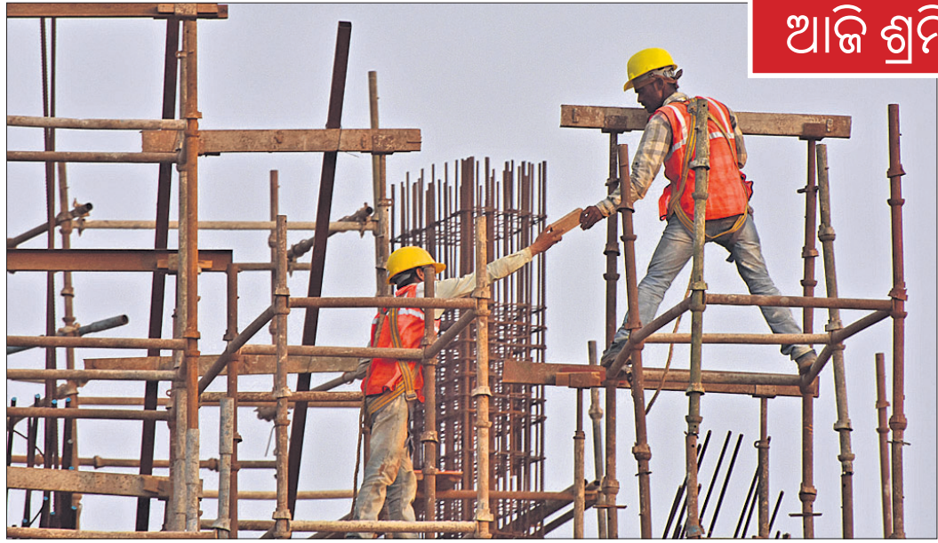
ଶନିବାର ଶ୍ରମିକ ଦିବସ। ସାରା ଦେଶ ଶ୍ରମିକଙ୍କ ପାଇଁ ଦିନଟିଏ ଉତ୍ସର୍ଗ କରୁଥିବାବେଳେ ଏହାର ଅବ୍ୟବହାର ପୂର୍ବରୁ ଶୁକ୍ରବାର ଭୁବନେଶ୍ୱରର ଏକ କୋଠା ନିର୍ମାଣରେ ନିମଗ୍ର ଦେଶ ଗଡୁଥିବା ଏହି ବିଶ୍ୱକର୍ମୀମାନେ।

ଭୁବନେଶ୍ୱର, ୩୦୪(ବି.ଏନ.ଏ.): ରାଜ୍ୟରେ କୋଭିଡ୍ ସଂକ୍ରମଣ ସଂଖ୍ୟା ଦିନକୁ ଦିନ ବୃଦ୍ଧି ପାଉଥିବାବେଳେ ଜନସାଧାରଣଙ୍କ ସୁରକ୍ଷା ଦୃଷ୍ଟିରୁ ସରକାର ସତରକ କରାଯାଇ ସହ ନାଲଟ୍ କର୍ମକୁ ଲାଗାଇଛନ୍ତି।