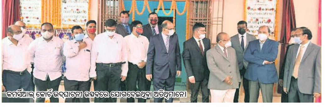
କର୍ମସୂଚୀ କୋର୍ଟ ଉଦ୍ଘାଟନା ଉତ୍ସବରେ ଯୋଗଦେଇଥିବା ଅତିଥିମାନେ।

ସମ୍ବଲପୁର ଜିଲ୍ଲାରେ ରାଜ୍ୟର ପ୍ରଥମ କର୍ମସୂଚୀ କୋର୍ଟ ଶୁକ୍ରବାର ଉଦ୍ଘାଟିତ ହୋଇଛି। ଏହାସହ ଦ୍ୱିତୀୟ ସିନିୟର ସିଜିଟି କୋର୍ଟ (ଜିମି ଅଧିକାରୀ ସମ୍ବନ୍ଧରେ) ଓ ଡିଜିଟାଲ ରେକର୍ଡିଂ ଲୋକାଧିକାରୀ ହୋଇଛି।