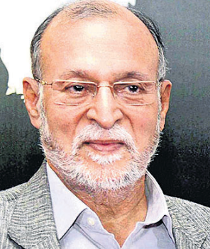
ନୂଆଦିଲ୍ଲୀ, ୩୦.୦୪(ପି.ଟି.): ଦିଲ୍ଲୀ ଉପରାଜ୍ୟପାଳ (ଏଭିଜି) ଅନିଲ ଭେଙ୍କାଳ କରୋନା ପରିଚିତ୍ ଚିହ୍ନିତ ହୋଇଛନ୍ତି।

ଲୋକଙ୍କ ଜୀବନ ରକ୍ଷାରେ ରାଷ୍ଟ୍ର ବିପକ୍ତ: ଦିଲ୍ଲୀ ହାଇକୋର୍ଟ ସମ୍ବିଧାନ ଅନୁଚ୍ଛେଦ ୨୧ ଅନୁସାରେ ନାଗରିକମାନଙ୍କ ଜୀବନ ରକ୍ଷା ରାଷ୍ଟ୍ରର କର୍ତ୍ତବ୍ୟ। କିନ୍ତୁ ଏଥିରେ ରାଷ୍ଟ୍ର ବିପକ୍ତ ହୋଇଛି। ଲୋକଙ୍କ ଜୀବନ ରକ୍ଷା