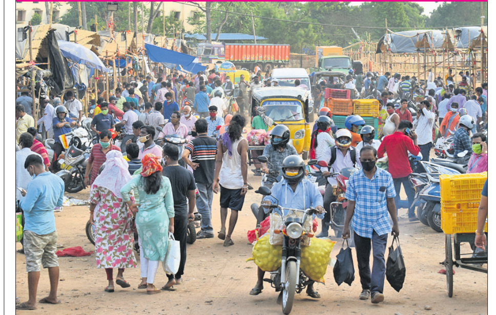
ଶନିବାର ଏବଂ ରବିବାର ସପ୍ତାହାନ୍ତ ଶହଡ଼ାଉନ ଥିବାକୁ ଶୁକ୍ରବାର ଭୁବନେଶ୍ୱର ଯୁନିଟ୍-୧ ପରିବାହନ ପ୍ରବଳ ଭିଡ଼।