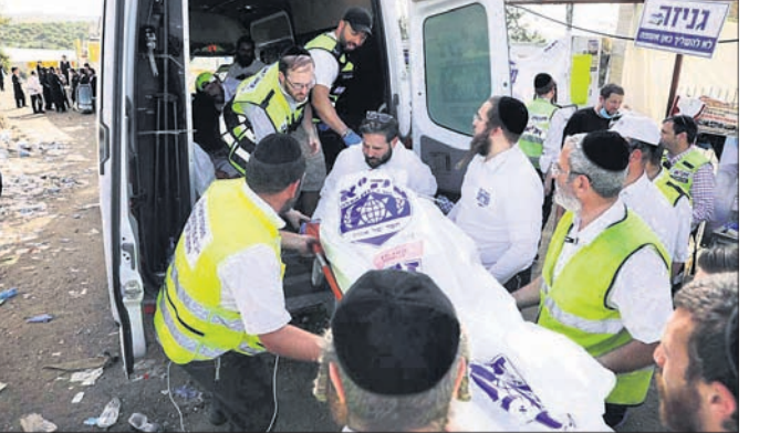
ପ୍ରଧାନମନ୍ତ୍ରୀ ବେଞ୍ଜାମିନ ନେତାନ୍ୟାହୁ ଦଳାତକଟା ଘଟଣାକୁ ବଡ଼ ବିପର୍ଯ୍ୟୟ ବୋଲି କହିବା ସହ ଆହତମାନଙ୍କ ଆଶୁ ଆରୋଗ୍ୟ କାମନା କରିଛନ୍ତି।

ଜେରୁଜେଲମ, ୩୦.୦୪(ଆଇଏଏନଏସ) ଇସ୍ରାଏଲ୍ରେ ଗୁରୁବାର ମଧ୍ୟରାତ୍ରରେ ଏକ ଇସ୍ରାଏଲି ଉତ୍ସବ ପାଳନ ବେଳେ ଦଳାତକଟା ଘଟି ୪୪ ଜଣଙ୍କ ମୃତ୍ୟୁ ହୋଇଛି। ଏଥିରେ ଅନ୍ୟ ୧୦୩ ଜଣ ଆହତ ହୋଇଥିବାବେଳେ କେତେଜଣଙ୍କ ଅବସ୍ଥା ସଙ୍କଟାପନ୍ନ ଥିବାବୁ ମୃତ୍ୟୁ ସଂଖ୍ୟା ବଢ଼ିବା ଆଶଙ୍କା କରାଯାଉଛି। ଉତ୍ସବ ଇସ୍ରାଏଲର ମାଭକ୍ତ ମେରୋନରେ ଅନୁଷ୍ଠିତ ଏହି ଉତ୍ସବରେ ଲକ୍ଷାଧିକ ଲୋକ ଯୋଗଦେଇଥିଲେ। ଇସ୍ରାଏଲି ସୁନାମିନ ଲାଗୁ ରାତିରେ ଅବସରରେ ପ୍ରତିବର୍ଷ ଏହି ଉତ୍ସବ ଅନୁଷ୍ଠିତ ହୋଇଥାଏ।