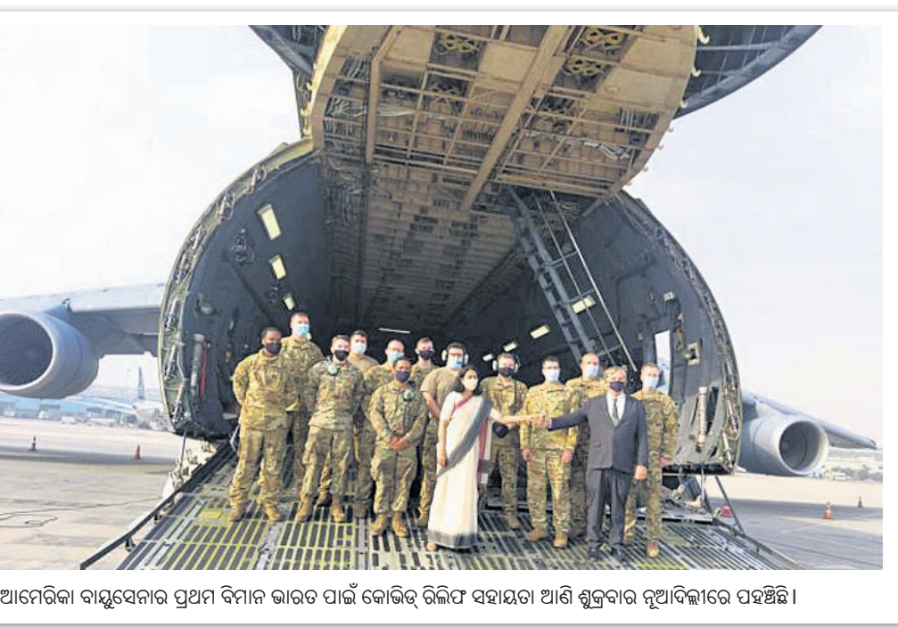
ଆମେରିକା ବାୟୁସେନାର ପ୍ରଥମ ବିମାନ ଭାରତ ପାଇଁ କୋଭିଡ୍ ରିଲିଫ୍ ସହାୟତା ଆଣି ଶୁକ୍ରବାର ନୂଆଦିଲ୍ଲୀରେ ପହଞ୍ଚିଛି।