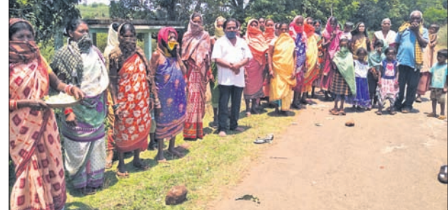
ବାହାରୁ ଆସୁଥିବା ବ୍ୟକ୍ତିଙ୍କୁ ଆଦିବାସୀ ମହିଳାମାନେ ବନ୍ଦାପନା କରୁଛନ୍ତି।

କୋରାପୁଟ, ୩୦୪ (ସ.ପ୍ର.) କୋରାପୁଟ ଜିଲ୍ଲାରେ ବସବାସ କରୁଥିବା ଆଦିବାସୀଙ୍କ ପରାମର୍ଶ ଦିଆଯାଇଛି। ଏବେ ସେମାନେ ଚୈତ୍ରପର୍ବ ପାଳନ କରୁଛନ୍ତି। ଏହି ପର୍ବ ବିଭିନ୍ନ ସ୍ଥାନରେ ବିଭିନ୍ନ ଭାବେ ପାଳନ ହୋଇଥାଏ। ଶୁକ୍ରବାର ସେମିଲିଗୁଡ଼ା ବ୍ଲକ ସୁବାଇ ପଞ୍ଚାୟତର ବିଳାପୁଟ ଗ୍ରାମରେ ମଧ୍ୟ ଆଡ଼ମ୍ବର ସହକାରେ ଏହା ପାଳନ ହୋଇଛି। ଏହି ପର୍ବରେ ବେଶ୍ୟ ଶିକାର ପାଇଁ ଗ୍ରାମର ସମସ୍ତ ପୁରୁଷ ଜଙ୍ଗଲକୁ ଯାଇଥିବାବେଳେ ଗ୍ରାମର ସମସ୍ତ ମହିଳା ଓ ପୁରୁଷମାନେ ଗ୍ରାମ ମୁଣ୍ଡରେ ଠିଆହୋଇ ଗ୍ରାମକୁ ଆସୁଥିବା ବ୍ୟକ୍ତିବିଶେଷଙ୍କୁ ପାଦ ଛୁଇଁ ଚୂଷିଆ ମାରିବା ସହ ହଳଦୀ, ଚାଉଳ,