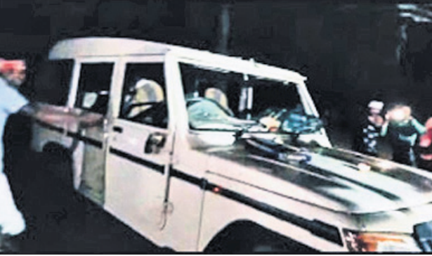
ଭାଙ୍ଗିଛନ୍ତି ଯାଇଥିବା ପୋଲିସ୍ ଗାଡ଼ି।