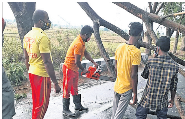
ଭାଙ୍ଗିପଡ଼ିଥିବା ଗଛକୁ ଅଗ୍ନିଶମ କର୍ମଚାରୀମାନେ କାଟୁଛନ୍ତି।