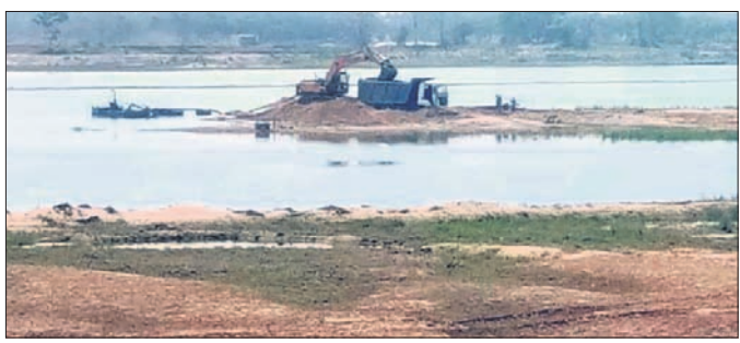
ବୈତରଣୀ ନଦୀ ଗର୍ଭରୁ ବାଲି ଉତ୍ତୋଳନ କରାଯାଇଛି।

ଯାକପୁର ଜିଲ୍ଲା ଦେଇ ପ୍ରବାହିତ ବୈତରଣୀ ନଦୀରୁ ବାଲି ଲୁହ୍ ସୂଚିତ ଯୋଜନାରେ ଚାଲିଛି। ଯୋଜନା ଅନୁଯାୟୀ ଲୁହ୍ ବାଲି ବାବଦ ଅର୍ଥକୁ ୪ ଭାଗ କରାଯାଇଛି। ଗୋଟିଏ ଭାଗ ସରକାରଙ୍କ ରାଜସ୍ୱ ଆଦାୟରେ ଦର୍ଶାଯାଉଥିବାବେଳେ ଆଉ ୩ ଭାଗ ଅର୍ଥକୁ ସମ୍ପୂର୍ଣ୍ଣ ସଂସ୍ଥା, ତହସିଲ ଅଧିକାରୀ ଓ ଦାୟିତ୍ୱରେ ଥିବା ଅତିରିକ୍ତ ଜିଲ୍ଲାପାଳଙ୍କ ପକ୍ଷରୁ ଯାଉଥିବା ଅଭିଯୋଗ ହେଉଛି।