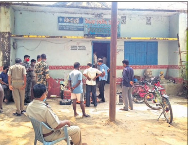
ତାଲିମ କେନ୍ଦ୍ରକୁ ପୋଲିସ ଉପସ୍ଥିତରେ ଖାଲି କରାଯାଇଛି ।