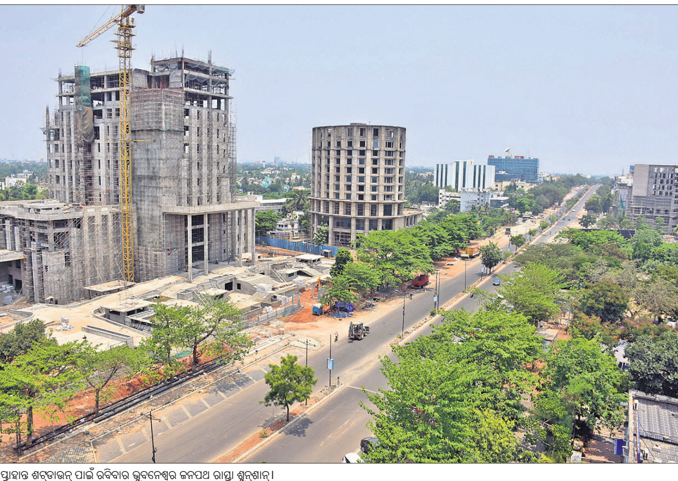
ସପ୍ତାହାନ୍ତ ଶର୍ତ୍ତାଭଙ୍ଗ ପାଇଁ ରବିବାର ଭୁବନେଶ୍ୱର ଜନପଥ ରାସ୍ତା ଶୁନ୍ଦରୀ।

ଭୁବନେଶ୍ୱର, ୨୫ (ଭୁବନେଶ୍ୱର): କରୋନା ସଂକ୍ରମଣରୁ ରାଜ୍ୟରୁ ଲୋକଙ୍କୁ ସୁରକ୍ଷା ଦେବା ପାଇଁ ନବୀନ କୁଟୁମ୍ବରୁ ନେତାମାନଙ୍କୁ ଶୁଭେଚ୍ଛା ଜଣାଉଛି।