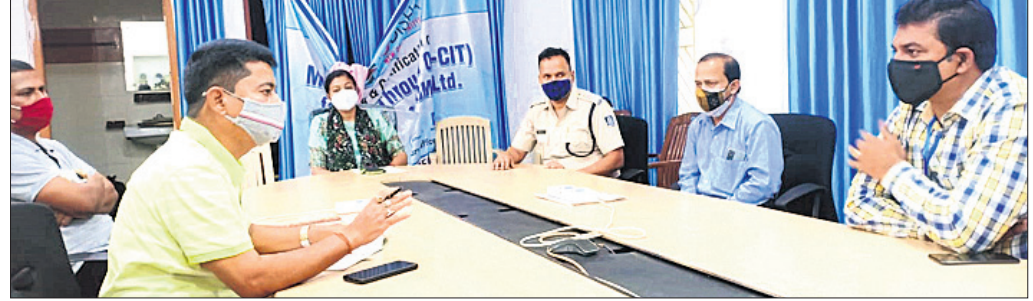
ତ୍ରିପାକ୍ଷିକ ବୈଠକରେ ଯୋଗ ଦେଇଥିବା ଅଧିକାରୀ ଓ ଅନ୍ୟମାନେ।