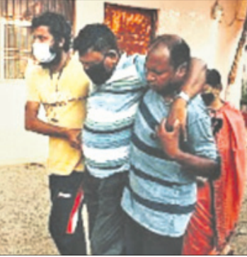
ଆହତ ଏଏସପାଇକୁ ଡାକ୍ତରଖାନାକୁ ନିଆଯାଇଛି।