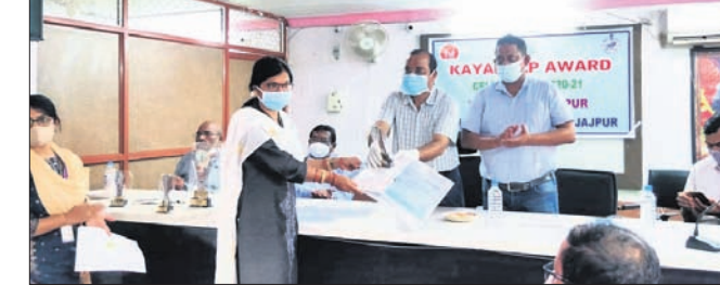
ବନ୍ତଳା ପ୍ରାଥମିକ ସ୍ୱାସ୍ଥ୍ୟକେନ୍ଦ୍ର କାୟାକଳ୍ପ ପୁରସ୍କାର ପ୍ରଦାନ କରାଯାଇଛି।