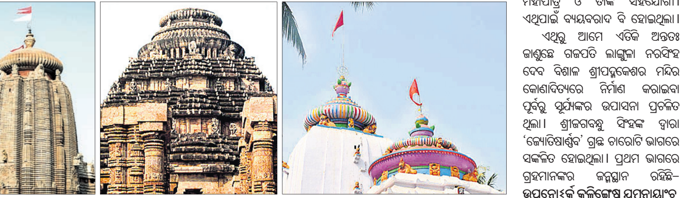
ଶ୍ରୀକରନାଥ, ଶ୍ରୀଲିଙ୍ଗରାଜ, କୋଣାର୍କ ଓ ବିରଜା ମନ୍ଦିର ସମ୍ବନ୍ଧରେ।

କୌଣସି ପ୍ରମାଣ ନ ଥିବାରୁ ପୂର୍ଣ୍ଣାଙ୍କ ଆମେ ଗଜପତି ଲାଙ୍ଗୁଳା ନରସିଂହ ଦେବଙ୍କ ନିର୍ମିତ ପୂର୍ଣ୍ଣାଙ୍କର ତୃତୀୟ ମନ୍ଦିର ବୋଲି କହିପାରିବା। ଶାୟତ୍ତ ନିର୍ମିତ ମନ୍ଦିର ପ୍ରଥମ ହୋଇଥିବା ବେଳେ କେଶରୀବଂଶ ରାଜ୍ୟ ବେଳେ ତୃତୀୟ ମନ୍ଦିର ନିର୍ମିତ ହୋଇଥିଲା। ଚନ୍ଦ୍ରଭାଗା ତୀର୍ଥରୁ ଶ୍ରୀପୂର୍ଣ୍ଣାଙ୍କର ବିଗ୍ରହ ପାଇ ମନ୍ଦିରରେ ପୂଜା ବ୍ୟବସ୍ଥା କରିଥିଲେ। ଏଠି ଦିନକୁ ସମ୍ପାଦନା ଆସେ ତୀର୍ଥରୁ ବିଗ୍ରହ ନିକୁଣ୍ଡାକୁ ଆଗରୁ କାଣ୍ଡ ପୂର୍ଣ୍ଣା ଉପାସନା ଥିଲା। ଏହା ସମ୍ପାଦନା ପାତ୍ର।