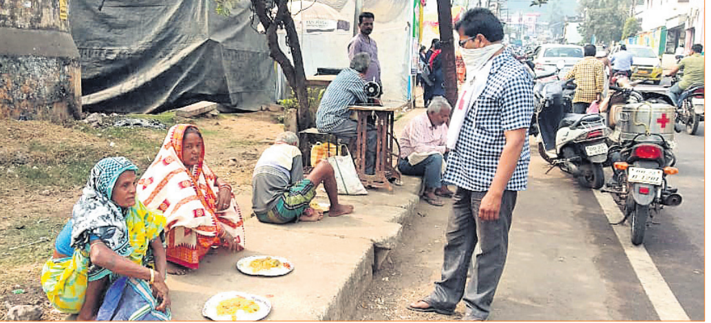
ଅସହାୟ ଲୋକମାନଙ୍କୁ ଅନୁଷ୍ଠାନ ପକ୍ଷରୁ ରକ୍ଷାଖାଦ୍ୟ ପ୍ରଦାନ କରାଯାଇଛି ।

ଏକ ଦୁଃଖଦଘଟଣାରୁ ଏହିଫୋରମର ଜନ୍ମ ହୋଇଛି । ନୟାଗଡ଼ ପୁରୁଣା ସହରରେ ବିଭୂତି ଭୃକ୍ଷଣ ପକ୍ଷୀମାନଙ୍କ (ଚିକୁ) ନିଜ ପୁଅର ପାଠପଢ଼ା ପାଇଁ ନିଜ ଆୟରୁ ପ୍ରାୟ ୧୫ ହଜାର ଟଙ୍କା ସଞ୍ଚୟ କରି ରଖୁଥିଲେ । ଆଖି ଥିଲା ଅସୁମାରୀ । ହେଲେ ପୁଅକୁ ୪ବର୍ଷ ହୋଇଥିବା ବେଳେ ଏକ ହୃଦୟବିଚାରକ ଘଟଣା ଘଟିଲା । ଆଜିକୁ ଅଳ୍ପେଇ ବର୍ଷ ତଳର କଥା । ସେଦିନ ପୁଅ କଦଳୀ ଖାଉଥିଲା । ହାତରୁ ପୁଅର ଚଢ଼ିରେ କଦଳୀ ଲାଗି ଯାଇଥିଲା । ଯେତେ ରେଷ୍ଟା କଲେ ମଧ୍ୟ ଚଢ଼ିକୁ କଦଳୀ ବାହାରି ନ ଥିଲା । ଗୁରୁତର ଅବସ୍ଥାରେ ପୁଅକୁ ଡାକ୍ତରଖାନାରେ ଭର୍ତ୍ତି କରାଯାଇଥିଲା । ସେଠାରେ ଡାକ୍ତର ତାଙ୍କୁ ମୃତ ଘୋଷଣା କରିଥିଲେ । ଦୁଃଖରେ ଭାଙ୍ଗି ପଡ଼ିଲେ ସାରା ପରିବାର । ଏମିତି