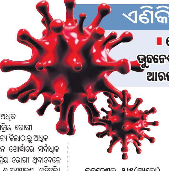
ଭୁବନେଶ୍ୱର, ୨୫ (ଭୁବନେଶ୍ୱର):

ଭୁବନେଶ୍ୱର, ୨୫ (ଭୁବନେଶ୍ୱର): ରାଜ୍ୟରେ କରୋନା ଚିକିତ୍ସା ଲଢ଼ାଇବା ପାଇଁ ନେତାମାନଙ୍କୁ ଶୁଭେଚ୍ଛା ଜଣାଉଛି।