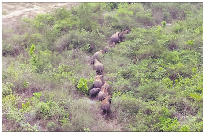
ଜନବସତିକୁ ପଶି ଆସିଥିବା ହାତୀପଲ।