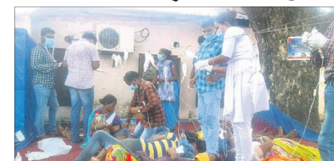
ପଡିଆ ଡାକ୍ତରଖାନାରେ ଶଯ୍ୟା ଅଭାବକୁ ରୋଗୀଙ୍କୁ ତଳେ ଚିକିତ୍ସା କରାଯାଇଛି।

ଶୁକ୍ରବାର ବସୁଥିବା କୁର୍ତ୍ତି ହାତ ଉପରେ କୁର୍ତ୍ତି ସମେତ ଶିମିଳିବାସ୍ତ୍ରା, ସମେତ ଗାଞ୍ଜରକୋଣ୍ଡା, ପେଦାଗୁଡା, ଏମିଡି-୨୮, ଏମିଡି-୧୧୦ ଗ୍ରାମର ଶତାଧିକ ଲୋକ ନିର୍ଭର କରିଥିବା ପ୍ରକଳ ଖରା