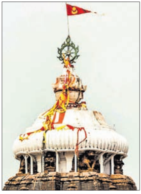
ଶ୍ରୀକରନାଥ, ଶ୍ରୀଲିଙ୍ଗରାଜ, କୋଣାର୍କ ଓ ବିରଜା ମନ୍ଦିର ସମ୍ବନ୍ଧରେ।