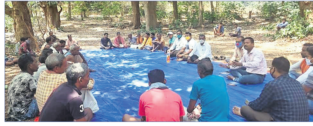
ବୈଠକରେ ଯୋଗଦେଇଥିବା ଆଦିବାସୀମାନେ ।

ଗ୍ରାମକୁ ବିସ୍ଥାପନ କରାଯିବା ପାଇଁ ରାଜ୍ୟ ସରକାରଙ୍କ ତରଫରୁ ଗୋଟିଏ ଜାରି ହୋଇଛି । ରାଜ୍ୟ ବିଭାଗ, ପଞ୍ଚାୟତରାଜ ବିଭାଗ ଓ ବନ୍ୟପ୍ରାଣୀ ବିଭାଗ ତରଫରୁ ପ୍ରତି ଗ୍ରାମରେ ବୈଠକ କରାଯାଇଥିଲା । ବୈଠକରେ ଯୋଗଦେଇଥିବା ସରକାରୀ ପଦାଧିକାରୀମାନେ ବିସ୍ଥାପନ ପ୍ରକ୍ରିୟା ଓ କ୍ଷତିପୂରଣ ସମ୍ପର୍କରେ ଲୋକଙ୍କୁ ବୁଝାଣୁଛନ୍ତି । ହେଲେ ଲୋକମାନେ ନିଜର ବାଘ ବଂଶ ବୃଦ୍ଧି କରିବା ପାଇଁ ରାଜ୍ୟ ବିଭାଗଟି ଛାଡି ଅନ୍ୟତ୍ର ଯିବା ପାଇଁ ରାଜି ହୋଇ ନ ଥିଲେ । ଗତ କିଛି ଦିନ ତଳେ ସୁନ୍ଦରୀ ବାଘୁଣୀକୁ ବାଘବନ୍ଦୁ ଅଭୟାରଣ୍ୟକୁ ଫେରାଇ ଦିଆଯାଇଛି । ଏହି ପରିସ୍ଥିତିରେ ସାତକୋଶିଆରେ ବାଘ ବଂଶ ବୃଦ୍ଧି କରିବା ପାଇଁ ରାଜ୍ୟ ସରକାର ପୂର୍ଣ୍ଣସ୍ତରରେ ନୟାଗଡ଼ ଜିଲା ବଡ଼ଶିଳିଙ୍ଗା ପଞ୍ଚାୟତରାଜ କେତେକ ଆଦିବାସୀ ଗ୍ରାମକୁ ବିସ୍ଥାପନ କରିବା ପାଇଁ ଉଦ୍ୟମ ଆରମ୍ଭ କରିଛନ୍ତି । ଏହି ଖବର ପାଇବା ପରେ ବଡ଼ଶିଳିଙ୍ଗା ପଞ୍ଚାୟତରାଜ ତମାପାଡି, ବେଦାଡି, କୁଡୁଳି, କୁମୁରା, ଜାନକାଖୋଲା ଗ୍ରାମର ଆଦିବାସୀମାନେ ଗତ ଶନିବାର ଜାନକାଖୋଲା ଆୟତୋଗରେ