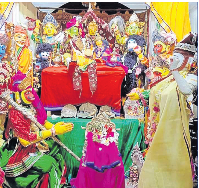
ଶ୍ରୀରାମଙ୍କ ଅଭିଷେକ ମହୋତ୍ସବ ବେଶ ।

ଓଡ଼ିଶାର ୨ୟ ଶ୍ରୀକ୍ଷେତ୍ର ଭାବେ ପରିଚିତ ଓଡ଼ିଶାରେ ବିଜେ ଶ୍ରୀରାମାୟଣାଉଳ ୧୦ ଦିନ ବ୍ୟାପୀ ଶ୍ରୀରାମ ନବମୀ ଯାତ୍ରା କରୋନା କଟକଣା ମଧ୍ୟରେ ସମ୍ପନ୍ନ ହୋଇଛି । ଶ୍ରୀରାମନବମୀ ଅବସରରେ ଶ୍ରୀରାମ ବିଜେ ବେଶରେ ସମ୍ପା ଦର୍ଶନ ଦେଇଥିଲେ । ଶନିବାର ଥିଲା ମୁଖ ଯାତ୍ରା ବେଶ । ରବିବାର ସମ୍ପାରେ ଶ୍ରୀରାମଙ୍କ ରାଜାଭିଷେକ ସହିତ ଶ୍ରୀରାମ ନବମୀ ଯାତ୍ରା ଶେଷ ହୋଇଛି । ପ୍ରକୃତ ୧୪ ବର୍ଷ ବନବାସ ପରେ ଲଙ୍କା ଜୟ କରି ଜଗତଜନନୀ ମା' ଜାନକୀଙ୍କୁ ସଙ୍ଗରେ ଧରି ଆସିଥିବା ଫେରିଛନ୍ତି । ଏଥିପାଇଁ ଘରେ ଘରେ ଆନନ୍ଦ ଉଲ୍ଲାସ ଲାଗି ରହିଛି । ପରମ ମିତ୍ର ସୁଗ୍ରୀବ, ଲଙ୍କପତି ବିଭୀଷଣ, ବ୍ରହ୍ମା, ବିଷ୍ଣୁ, ମହେଶ୍ୱର, ଅଶ୍ୱ ସେନାଧ୍ୟକ୍ଷ ପ୍ରଭୃତ୍ ଚତୁଃପାର୍ଶ୍ୱରେ ବିଦ୍ୟମାନ ହୋଇଛନ୍ତି । ଶ୍ରୀରାମମାନେ ସ୍ୱର୍ଣ୍ଣ, ରୌପ୍ୟ ଅଳଙ୍କାରରେ ସଜ୍ଜିତ । ସମ୍ପା ଆଳତୀ ସହିତ ସିଂହଦ୍ୱାରରେ ଅପେକ୍ଷା କରିଥିବା ଶ୍ରୀକାଳୀମାନେ ପ୍ରଭୃତ୍ ଅଭିଷେକ ଉତ୍ସବ ଦର୍ଶନ କରିଛନ୍ତି ।