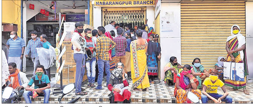
ନବରଙ୍ଗପୁରସ୍ଥିତ ଏକ ବ୍ୟାଙ୍କ ପରିସରରେ ଗ୍ରାହକଙ୍କ ଭିଡ଼।