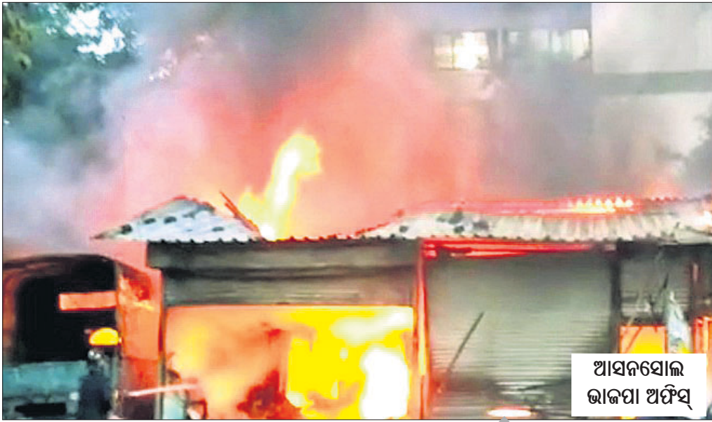
ଆସନସୋଲ ଭାଇପା ଅଫିସ୍

ସଦ୍ୟ ଅନୁଷ୍ଠିତ ବିଧାନସଭା ନିର୍ବାଚନରେ ମୁଖ୍ୟମନ୍ତ୍ରୀ ମମତା ବାନାର୍ଜୀଙ୍କ ନେତୃତ୍ୱାଧୀନ ଟିଏମ୍‌ସି ୨୧୩ ଆସନ ଦଖଲ କରି ଏକକ ସଂଖ୍ୟାଗରିଷ୍ଠ ଦଳ ଭାବେ ଉଭା ହୋଇଛି। ଭାଇପାକୁ ୭୭ ଆସନରେ ସଫଳତା ମିଳିଥିବାବେଳେ ରାଷ୍ଟ୍ରୀୟ ସେକ୍ୟୁଲାର ମଜ୍ଜିଦ୍ ପାର୍ଟି ଏବଂ ସ୍ୱାଧୀନ ପ୍ରାର୍ଥୀ ଗୋଟିଏ ଲେଖାଏ ଆସନରେ ବିଜୟ ହୋଇଛନ୍ତି। ନିର୍ବାଚନ ପଞ୍ଚାଦଶ ଦିନ ପରୁ ପଶ୍ଚିମବଙ୍ଗର ବିଭିନ୍ନ ସ୍ଥାନରେ ହିଂସାକାଣ୍ଡ ଘଟିଛି। ଏନେଇ ରାଜ୍ୟପାଳ ଜଗଦୀପ ଧନକର ପୋଲିସ୍ ମହାନିର୍ଦ୍ଦେଶକ, କୋଲକାତା ପୋଲିସ୍ କମିଶନର ଏବଂ ମମତାଙ୍କ ସହ ଆଇନଶୁଖିଲା ବନ୍ଦୀ ରଖିବା ପାଇଁ ଆଲୋଚନା କରିଛନ୍ତି। ଗଣତାନ୍ତ୍ରିକ ବ୍ୟବସ୍ଥାରେ ନିର୍ବାଚନ ପରବର୍ତ୍ତୀ ହିଂସାରେ ୯ ଜଣଙ୍କ ମୃତ୍ୟୁ ଘଟିବା ଅତ୍ୟନ୍ତ ଦୁର୍ଭାଗ୍ୟଜନକ ବୋଲି ରାଜ୍ୟପାଳ ରୁଜ୍ କରିଛନ୍ତି।