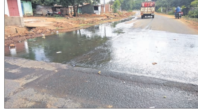
ରାସ୍ତାରେ ବର୍ଷାଜଳ ଜମି ରହିଛି ।

କୋରାପୁଟ ଜିଲ୍ଲାରେ କରୋନା ମାରୁଛି ଲାଘୁଣିଆଁ। ନିକଟରେ ଦିନକରେ ୧୨୭ କରୋନା ଆକ୍ରାନ୍ତ ଚିକିତ୍ସା ହୋଇଥିବା ବେଳେ ଯୋଗ୍ୟର ଦିନକରେ ସର୍ବାଧିକ ୧୪୫ ଜଣ କରୋନା ଆକ୍ରାନ୍ତ ଚିକିତ୍ସା ହୋଇଛନ୍ତି।