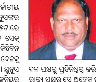
ଦଳ ପକ୍ଷରୁ ପ୍ରତିନିଧିତ୍ୱ କରିଥିଲେ।