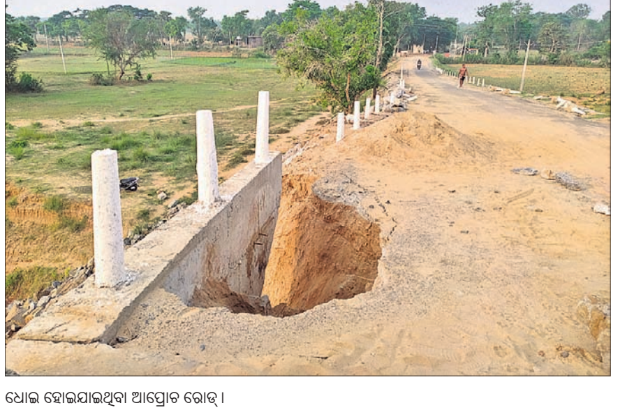
ଧୋଇ ହୋଇଯାଇଥିବା ଆପ୍ରୋଟ ରୋଡ୍।

ନିମ୍ନମାନର ହୋଇଥିଲା। ଏହାକୁ ନେଇ ସ୍ଥାନୀୟ ଲୋକେ ଗ୍ରାମ୍ୟ ଉନ୍ନୟନ ବିଭାଗ ଉଚ୍ଚ କର୍ତ୍ତୃପକ୍ଷଙ୍କ ନିକଟରେ ଲିଖିତ ଓ ମୌଖିକ ଅଭିଯୋଗ କରିଥିଲେ।