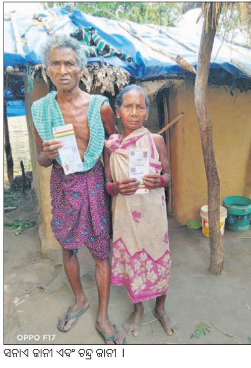
ସମାଜିକ ଦାବି ଏବଂ ଚନ୍ଦ୍ର ଜାନୀ ।

ନବରଙ୍ଗପୁର ଜିଲ୍ଲା ଡେକୁଲିଖୁଣ୍ଟି ବ୍ଲକ୍ ପୂଜାରୀଗୁଡ଼ା ପଞ୍ଚାୟତ ଅନ୍ତର୍ଗତ କାତ୍ରାଗୁ ଗ୍ରାମକୁ ନବରଙ୍ଗପୁର ଜିଲ୍ଲାପାଳ ପାଠ୍ୟପୁସ୍ତକ ପ୍ରକଳ୍ପରେ ଆବାସ ଯୋଜନାରେ ବଞ୍ଚିତ ହେବାକୁ ନିରାଶ ହେବାକୁ ପଡ଼ିଛି।