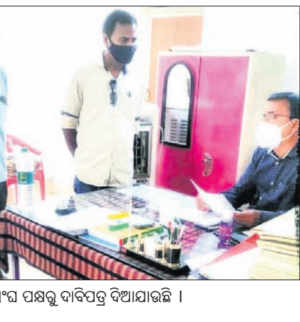
ଶିକ୍ଷକ ସଂଘ ପକ୍ଷରୁ ଦାବିପତ୍ର ଦିଆଯାଉଛି ।