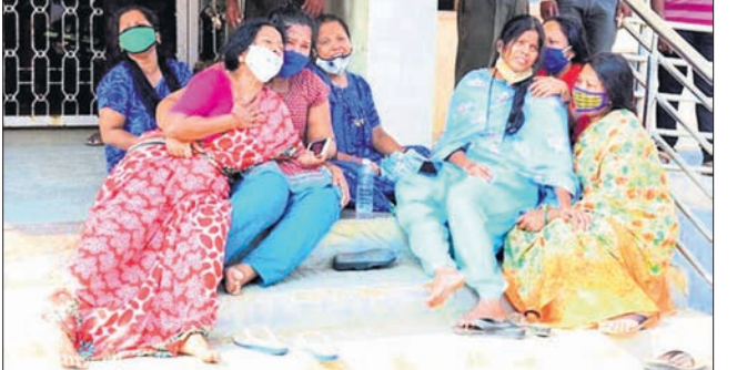
ଚମରାଜନଗରସ୍ଥିତ କୋଭିଡ୍-୧୯ ହେଲଥ ସେଣ୍ଟରରେ ପରିଚ୍ଛନ୍ନ ହୋଇ ଚୁଖରେ ଭାଙ୍ଗିପଡ଼ିଛନ୍ତି ସମ୍ପର୍କୀୟ।