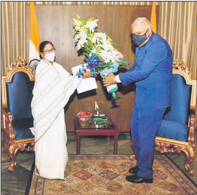
ଟିଏମ୍‌ସି ସୁପ୍ରିମୋ ମମତା ବାନାର୍ଜୀ କୋଲକାତାସ୍ଥିତ ରାଜଭବନରେ ରାଜ୍ୟପାଳ ଜଗଦୀପ ଧନକରଙ୍କୁ ଭେଟୁଛନ୍ତି।

ମନୁଶାଳୟ ରାଜ୍ୟ ସରକାରଙ୍କୁ ରିପୋର୍ଟ ମାଗିଛି। ମୁଖ୍ୟମନ୍ତ୍ରୀ ମମତା ବାନାର୍ଜୀ ଟିଏମ୍‌ସି କର୍ମୀମାନଙ୍କୁ ଶାନ୍ତିରକ୍ଷାକା ବଜାୟ ରଖିବାକୁ ପରାମର୍ଶ ଦେଇଛନ୍ତି।