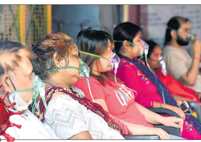
ଉତ୍ତରପ୍ରଦେଶର ଗାଜିଆବାଦସ୍ଥିତ ଇନ୍ଦିରାପୁରମ୍‌ ଗୁରୁଦ୍ୱାରାରେ ଶିଶୁ ସଙ୍ଗଠନ ପକ୍ଷରୁ ମାଗଣାରେ ଅଣ୍ଟିକେନ ଦିଆଯାଇଛି।

କ୍ରମାଗତ ଦ୍ୱିତୀୟ ଦିନ ପାଇଁ ଦେଶରେ ଦୈନିକ କରୋନା ସଂକ୍ରମଣ ସାମାନ୍ୟ ହୁଏ ପାଇଁ। ଗତ ୨୪ ଘଣ୍ଟାରେ ୩.୬୮ ଲକ୍ଷ ନୂଆ ସଂକ୍ରମିତ ଚିହ୍ନ ହୋଇଛନ୍ତି। ସେହିପରି ଦିନକରେ ୩,୪୧୭ ଜଣ ଆକ୍ରାନ୍ତଙ୍କ ମୃତ୍ୟୁ ଘଟିଛି। ଦେଶରେ ମୋଟ ସଂକ୍ରମିତଙ୍କ ସଂଖ୍ୟା ୧.୯୯ କୋଟିରେ ପହଞ୍ଚିଛି। ସମୁଦାୟ ମୃତ୍ୟୁ ସଂଖ୍ୟା ୨.୧୮ ଲକ୍ଷ ପାର୍ କରିଛି। ସୋମବାର ଦେଶରେ କରୋନା ସ୍ଥିତି ସମ୍ପର୍କରେ ସ୍ୱାସ୍ଥ୍ୟ ମନ୍ତ୍ରୀଙ୍କ ପକ୍ଷରୁ ଏକ ସମୀକ୍ଷା ବୈଦିକ ବସିଥିଲା। ଏବେ ସୁଦ୍ଧା ମୋଟ ୧୨ଟି ରାଜ୍ୟରେ ଲକ୍ଷାଧିକ ସକ୍ରିୟ