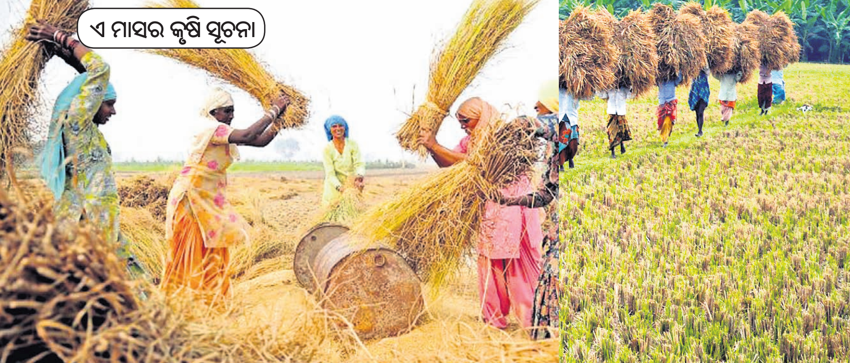
ଏ ମାସର କୃଷି ସୂଚନା

କୃତ୍ରିମ ନାଲି ଖାତା ହେଉଥିଲେ ଅଧିକ ଗ୍ରାମ ଫ୍ୟୁରାସଲକୁ ଏକ ଲିଟର ପାଣିରେ ମିଶାଇ ୩ ଦିନ ପର୍ଯ୍ୟନ୍ତ ଦିଅନ୍ତୁ ।