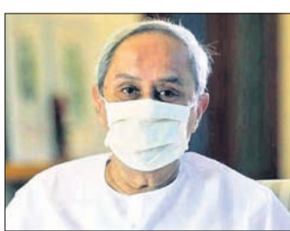
କେନ୍ଦ୍ର ଅର୍ଥମନ୍ତ୍ରୀଙ୍କୁ ନବୀନଙ୍କ ଚିଠି

କୋଭିଡ୍-୧୯ ଦ୍ୱିତୀୟ ଲହରୀ ସମଗ୍ର ଦେଶ ପାଇଁ ଉପକ୍ରମ ପରିଚ୍ଛନ୍ନି ପୁଣି କରିଛି। ଏହି ମହାମାରୀ ପାଇଁ କ୍ରୟ କରାଯାଉଥିବା ଟିକା ଉପରୁ ବ୍ରହ୍ମାଣ୍ଡ ଓ ସେବା ଟିକସ(ଜିଏସ୍ଟି) ଛାଡ଼ କରିବାକୁ ପୁଣ୍ୟମନ୍ତ୍ରୀ ନବୀନ ପଟ୍ଟନାୟକ କେନ୍ଦ୍ର ସରକାରଙ୍କୁ ନିବେଦନ କରିଛନ୍ତି। ଏ ନେଇ ଗୁରୁବାର ଅର୍ଥମନ୍ତ୍ରୀ ନିର୍ମଳା ସୀତାରାମନଙ୍କୁ ନବୀନ ଚିଠି ଲେଖିଛନ୍ତି। ଏଥିସହିତ କେନ୍ଦ୍ର ସରକାରଙ୍କ ଦ୍ୱାରା ଆଦାୟ କରାଯାଉଥିବା ସେସ୍ ଓ ସରକାରୀ ରାଜସ୍ୱ ଆୟକୁ ସହାୟତା କରିବାକୁ ମଧ୍ୟ ଅନୁରୋଧ କରିଛନ୍ତି।