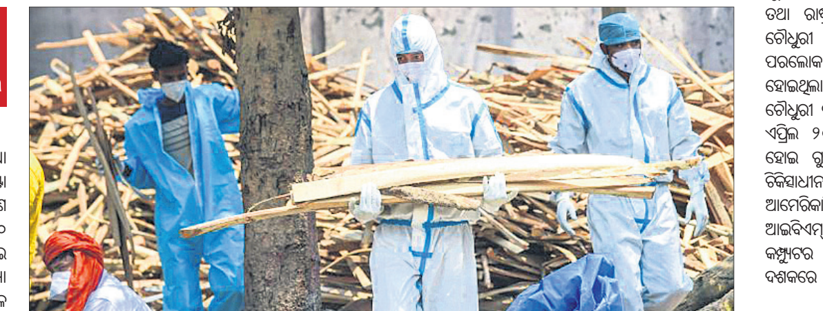
ବାକିରୁ ଶୁଣାଣରେ ସ୍ୱାସ୍ଥ୍ୟକର୍ମୀ ଓ ପରିବାର ସଦସ୍ୟ ପିପିଇ କିଟ୍ ପିନ୍ଧି କରୋନା ମୃତକଙ୍କ ଶେଷକୃତ୍ୟ ପାଇଁ କାଠ ନେଉଛନ୍ତି ।

ନୂଆଦିଲ୍ଲୀ, ୬।୫(ପି.ଟି.): କରୋନା ସଂକ୍ରମଣ ପ୍ରତିଦିନ ନୂଆ ରେକର୍ଡ୍ କରିଚାଲିଛି । ଗତ ୨୪ ଘଣ୍ଟା ମଧ୍ୟରେ ଭାରତରେ ୪,୧୨,୨୬୨ ଜଣ ସଂକ୍ରମିତ ହୋଇଥିବାବେଳେ ୩,୯୮୦ ଜଣ ପ୍ରାଣ ହରାଇଛନ୍ତି । ଏହାକୁ ମିଶାଇ ଦେଶରେ ମୋଟ ସଂକ୍ରମିତଙ୍କ ସଂଖ୍ୟା ୨,୧୦,୭୬୪,୪୧୦ରେ ପହଞ୍ଚିଥିବାବେଳେ କରୋନା ଜନିତ ମୋଟ ମୃତ୍ୟୁସଂଖ୍ୟା ୨,୩୦,୧୨୮ ହୋଇଥିବା କେନ୍ଦ୍ର ସ୍ୱାସ୍ଥ୍ୟ ମନ୍ତ୍ରାଳୟ ତଥ୍ୟରୁ ଜଣାପଡ଼ିଛି । ଏହା ପୂର୍ବରୁ ଗତ ଏପ୍ରିଲ ୩୦ରେ ନେଇ ସଂକ୍ରମଣ ୪ ଲକ୍ଷ ଚପିଥିଲା । ଦେଶରେ ସକ୍ରିୟ ମାମଲା ସଂଖ୍ୟା ୩୫,୬୬,୩୮୮ରେ ପହଞ୍ଚିଲାଣି । ଯାହା ମୋଟ ସଂକ୍ରମଣର ୧୬.୯୨ ପ୍ରତିଶତ । ଆରୋଗ୍ୟ ହାର ହ୍ରାସ ପାଇ ୮୧.୯୯ରେ ପହଞ୍ଚିଥିବା ସରକାରୀ ତଥ୍ୟରୁ