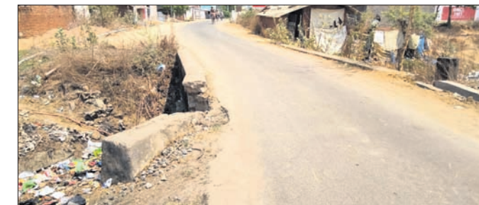
ଭାଙ୍ଗି ଯାଇଥିବା ପୋଲ ।