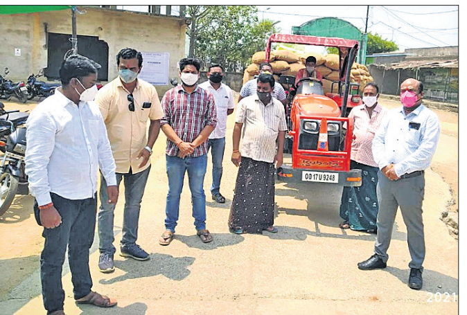
ଅତୀତର ମଣ୍ଡି ଚାଷୀମାନେ ବିକ୍ରି ପାଇଁ ଧାନ ଆଣିଛନ୍ତି ।

ବରଗଡ଼ ଜିଲ୍ଲାରେ ରୂପାବାରୁ ରବି ଧାନ ସଂଗ୍ରହ ପ୍ରକ୍ରିୟା ଆରମ୍ଭ ହୋଇଛି । କୋଭିଡ଼ ସଂକ୍ରମଣ ବୃଦ୍ଧି ପାଇଥିବା ଦୃଷ୍ଟିରୁ ଏହାକୁ ପ୍ରତିହତ କରିବା ପାଇଁ ଧାନ ବିକ୍ରି ସମୟରେ ମଣ୍ଡିରେ ସାମାଜିକ ଦୂରତା ଅବଲମ୍ବନ, ସାନିଟାଇଜ୍, ମାସ୍କ ପିନ୍ଧିବାକୁ ଗୁରୁତ୍ୱ ଦିଆଯାଇଛି । ଅନ୍ୟବର୍ଷ ଭଳି ଏଥର ମଧ୍ୟ ଟୋକନକୁ ବାଧ୍ୟତାମୂଳକ କରାଯାଇଛି । ତେବେ ଅନେକ ଚାଷୀଙ୍କ ପାଖକୁ ଏପର୍ଯ୍ୟନ୍ତ ଟୋକନ ପହଞ୍ଚି ପାରିନାହିଁ । ସେହିପରି କୋଭିଡ଼ ସଂକ୍ରମଣ ବୃଦ୍ଧିପାଇଁ ଥିବାବେଳେ ଚମ୍ପୁ ଖାନିଂ ଚାଷୀଙ୍କ ପାଇଁ ଅଭୁତା ସାଜିଛି । ଏଥିଯୋଗୁଁ ସଂକ୍ରମଣ ଭୟ ଅଧିକ ରହିଛି ବୋଲି ଚାଷୀମାନେ କହିଛନ୍ତି । ଏ ସମ୍ପର୍କରେ ଅତିରିକ୍ତ ସମବାୟ ଉପନିବନ୍ଧକ ଭକ୍ତବନ୍ଧୁ ସାହୁଙ୍କୁ ପଚାରିବାରୁ ଖାନିଂ ମେଡିକାଲ ନିରୁପଣ କରିବା ଏବଂ ପ୍ରତି କୋଭିଡ଼ ମଧ୍ୟରେ ଅତିକ୍ରମରେ ମାମୁଳି ଦୂରତା ରଖିବାକୁ କୁହାଯାଇଛି । ସେହିପରି କୋଭିଡ଼ ସମୟରେ ଧାନ ସଂଗ୍ରହ ପ୍ରକ୍ରିୟା ଏକ ଚ୍ୟାଲେଞ୍ଜ ହୋଇଥିବାରୁ ଯୋଗ୍ୟ ଧରିବା ଏବଂ ସମସ୍ତ ପଞ୍ଜୀକୃତ ଚାଷୀମାନଙ୍କୁ ଧାନ ବିଶାୟିତ ବୋଲି ଯାବଦ ଧାନ ବିଶାୟିତ ସମୟରେ ବିଭିନ୍ନ କଟକଣାକୁ ନେଇ ଏକ ବିଶ୍ୱସ୍ତି ପ୍ରକାଶ