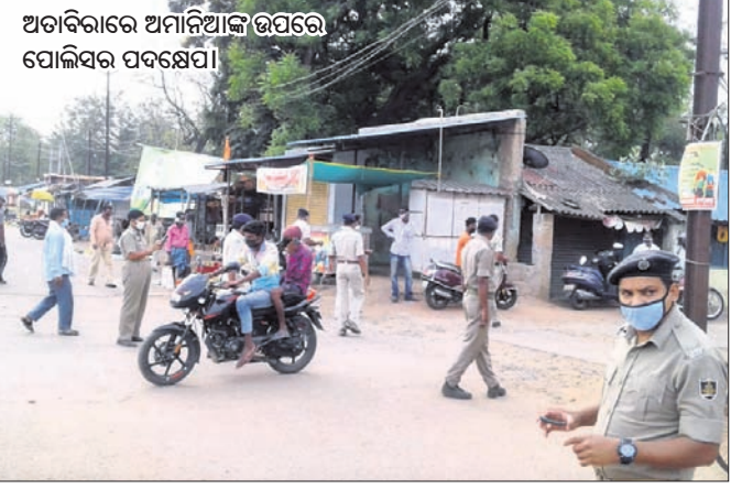
ଅତୀତରାରେ ଅମାନିଆକୁ ଉପରେ ପୋଲିସର ପଦକ୍ଷେପ ।

ବରଗଡ଼ ଜିଲ୍ଲା ଅତୀତରା ବୁଦ୍ଧ ଅଞ୍ଚଳରେ କୋଭିଡ଼ ଆକ୍ରାନ୍ତ ଓ ମୃତକଙ୍କ ସଂଖ୍ୟା ବଢିବାରେ ଲାଗିଛି । ତଥାପି ଲୋକେ ବିନା ମାସ୍କ, ଗୋଟିଏ ବାଜକରେ ୩ରୁ ୪ଜଣ ଯିବାଆସିବା କରୁଛନ୍ତି । ଏଭଳି ଅମାନିଆକୁ ପୋଲିସ ପ୍ରଶାସନ ଗୁରୁବାର ଡାକବାଜି ଯନ୍ତ୍ର ସହାୟତାରେ ସତେଜତା କରିବା ସହିତ ସେମାନଙ୍କ ଉପରେ କାର୍ଯ୍ୟାନୁଷ୍ଠାନ ନେଉଥିବା ଦେଖିବାକୁ ମିଳିଥିଲା । ୫୩ ନଂ. ବରଗଡ଼-ସମ୍ବଲପୁର ଜାତୀୟ ରାଜପଥ, ୫୪ ନମ୍ବର ଗୋଡ଼ଭାଗ-ବୁରୁମ୍ ରାଜ୍ୟ ରାଜପଥ, ଗ୍ରାମାଞ୍ଚଳ