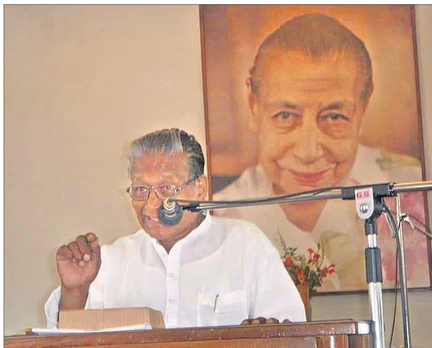
ପଞ୍ଚିତେରୀରେ ଆଶ୍ରମର ଅନ୍ତର୍ଦ୍ଧ୍ୟାୟାମାନଙ୍କୁ ଶ୍ରୀଅରବିନ୍ଦକ ଦର୍ଶନ ସମ୍ପର୍କରେ ଉଦ୍‌ବୋଧନ ଦେଉଛନ୍ତି।

ଅହର ଆର୍ ପ୍ରତିଷ୍ଠାର ରହସ୍ୟ। ଆମ ଅବଚେତନକୁ ଭାଗ୍ୟାନ୍ତ କରି ରଖୁଥିବା ଯେତେବେଳେ ଦୁର୍ଯ୍ୟୋଧନ ଉଲ୍ଲେଖ କରୁଥିଲେ, ସେବଦ୍ୱାରା ପଶ୍ୟାନ୍ତରେ ହେଉ ଚାହେଁ ବିଦ୍ୟମାନ ବ୍ୟକ୍ତିଗତ ତଥା ସାମୂହିକ ଅହର ନାନାଦି ଉପଦ୍ରବ: ସ୍ୱାର୍ଥପରତା, ନିର୍ଦ୍ଦୟତା, ଧର୍ମାନ୍ଧତା, ଅଜ୍ଞାନ ଶ୍ରମତାଲିପ୍ତା ଇତ୍ୟାଦି। ବ୍ୟାପକ ଇତିହାସ କଥା ଦୂରରେ ରଖି, ଆମର ଜୀବନକାଳରେ ଏଭଳି ମୃତ୍ୟୁର କେତେ ଲମ୍ବାୟତ୍ ଧରି ପଢ଼ିବାର ସାକ୍ଷୀ ଆମେ। ସାମ୍ରାଜ୍ୟବାଦୀ ରାଜତନ୍ତ୍ର ଓ ସାମ୍ରାଜ୍ୟବାଦ, ଅନ୍ତତଃ ଅର୍ଦ୍ଧଶତାବ୍ଦୀ ପୂର୍ବରୁ ମଣି ତାକୁ ନିଜ ସାମ୍ରାଜ୍ୟ ବନାଇବାର ସ୍ୱପ୍ନାନ୍ତ ହିତକରୁ ଶୁଣିବା ନା ମାତ୍ର, ଦୁର୍ଲ୍ଲଭ ଅପେକ୍ଷାକୃତ କ୍ଷୁଦ୍ର କ୍ଷେତ୍ରରେ ଆମ ପାଦ ବିକପିତ ବା ରାଜନୈତିକ କ୍ଷମତାଶାଳୀର 'ଆଜି ଯେ ରାଜେନ୍ଦ୍ରାସନେ କାଳି ସେ ପକିର' ବନିବାର ଅସଂଖ୍ୟ ଦୁଃଖୀ ଆମ ସ୍ମୃତିରେ ଜୀବନ୍ତ। ତଥାପି ଆମେ ଆମ ଜୀବନରେ - ବ୍ୟକ୍ତିଗତ ମଣିଷ ରୂପେ ବା ଗୋଷ୍ଠୀଗତ ଭାବେ- ଅହର ଭୂମିକା ସମ୍ପର୍କରେ ସଚେତନ ନୋହୁଁ। ଅନ୍ତତଃ ଆମ ଆଚରଣରେ ପରିବର୍ତ୍ତନର ଲକ୍ଷଣ ଅତୀତ ମନ୍ଦର।