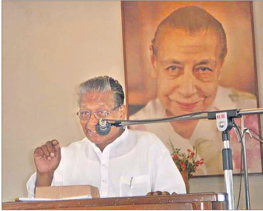
ପଞ୍ଚିତେରୀରେ ଆଶ୍ରମର ଅନ୍ତର୍ଦ୍ଧ୍ୟାୟାମାନଙ୍କୁ ଶ୍ରୀଅରବିନ୍ଦକ ଦର୍ଶନ ସମ୍ପର୍କରେ ଉଦ୍‌ବୋଧନ ଦେଉଛନ୍ତି ।

ଅହର ଆର୍ ପ୍ରତିଷ୍ଠାର ରହସ୍ୟ। ଆମ ଅବଚେତନକୁ ଭାରାଣୀକ କରି ରଖୁଥିବା ଯେତେବେଳେ ଦୁର୍ଯ୍ୟୋଗର ଉଲ୍ଲେଖ କରୁଥିଲି, ସେସବୁର ପଶ୍ୟାନ୍ତରେ ହେଉ ଚାହେଁ ବିଦ୍ୟମାନ ବ୍ୟକ୍ତିଗତ ତଥା ସାମୂହିକ ଅହର ନାନାଦି ଉପଦ୍ରବ: ସ୍ୱାର୍ଥପରତା, ନିର୍ଦ୍ଦୟତା, ଧର୍ମାନ୍ଧତା, ଅଜ୍ଞାନ ଶ୍ରମତାଲିପ୍ତା ଇତ୍ୟାଦି। ବ୍ୟାପକ ଇତିହାସ କଥା ସୂଚକ ରଖିଲୁ, ଆମର ଜୀବନଶାସ୍ତ୍ରରେ ଏଭଳି ମୂଢ଼ତାର କେତେ ଲମ୍ବାୟତ୍ ଧରି ପଢ଼ିବାର ସାକ୍ଷୀ ଆମେ। ସାମ୍ରାଜ୍ୟବାଦୀ ରାଜତନ୍ତ୍ର ଓ ସାମ୍ରାଜ୍ୟବାଦ, ଅନ୍ତତଃ ଅର୍ଦ୍ଧଶତାବ୍ଦୀ ଧରି ମଣି ତାକୁ ନିଜ ସାମ୍ରାଜ୍ୟ ବନାଇବାର ସ୍ୱପ୍ନାନ୍ତର ହିତକରୁ ଶୁଣିବା ନା ମାତ୍ର, ଦୁର୍ଲ୍ଲଭ ଅପେକ୍ଷାକୃତ କ୍ଷୁଦ୍ର କ୍ଷେତ୍ରରେ ଆମ ପାଦ ବିକପିତ ବା ରାଜନୈତିକ ଶ୍ରମତାଗାଳୀର 'ଆଜି ଯେ ରାଜେନ୍ଦ୍ରାସନେ କାଳି ସେ ପକିର' ବନିବାର ଅସଂଖ୍ୟ ଦୁଃଖୀ ଆମ ସ୍ମୃତିରେ ଜୀବନ୍ତ। ତଥାପି ଆମେ ଆମ ଜୀବନରେ - ବ୍ୟକ୍ତିଗତ ମଣିଷ ରୂପେ ବା ଗୋଷ୍ଠୀଗତ ଭାବେ- ଅହର ଭୂମିକା ସମ୍ପର୍କରେ ସଚେତନ ନୋହୁଁ। ଅନ୍ତତଃ ଆମ ଆଚରଣରେ ପରିବର୍ତ୍ତନର ଲକ୍ଷଣ ଅତୀତ ମନ୍ଦର ।