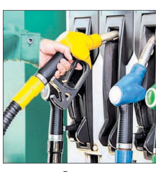
ନୂଆଦିଲ୍ଲୀ/ ଭୁବନେଶ୍ୱର, ୬/୫

ଚଳିତ ବର୍ଷ ଏପ୍ରିଲ ୧୫ ରେ ଶେଷ ଥର ପାଇଁ ତେଲ ଦର ପରିବର୍ତ୍ତନ ହୋଇଥିଲା। ଗତ ୧୮ ଦିନ ପରେ ଲଗାତର ତୃତୀୟ ଦିନ ଲାଗି ଗୁରୁବାର ତେଲ ଦର ବୃଦ୍ଧି। ଦେଶର ପ୍ରମୁଖ ଟେଲ ବିପଣନ କମ୍ପାନୀ ଇଣ୍ଡିଆନ ଅଏଲ କର୍ପୋରେସନ ଲିମିଟେଡ୍ (ଆଇଓଏଏଲ) ପକ୍ଷରୁ ମିଳିଥିବା ସୂଚନା ଅନୁସାରେ ଗୁରୁବାର ଭୁବନେଶ୍ୱରରେ ପେଟ୍ରୋଲ ଲିଟର ପିଛା ୨୪ ପଇସା ଏବଂ ଡିଜେଲ ୩୧ ପଇସା ବୃଦ୍ଧି ଘଟିଛି। ଫଳରେ ଏଠାରେ ପେଟ୍ରୋଲ ଦର ୯୧.୬୮ ଟଙ୍କା ହୋଇଥିବା ବେଳେ ଡିଜେଲ ଦର ୮୮.୬୯ ଟଙ୍କାରେ ପହଞ୍ଚିଛି। ସେହିପରି ନୂଆଦିଲ୍ଲୀରେ ପେଟ୍ରୋଲ ଉପରେ ୨୫ ପଇସା ଏବଂ ଡିଜେଲରେ ୩୦ ପଇସା ବୃଦ୍ଧି ହୋଇଛି। ଫଳରେ ଏଠାରେ ପେଟ୍ରୋଲ ଦର ଲିଟର ପିଛା ୯୦.୯୯ ଟଙ୍କା ଓ ଡିଜେଲ ଦର ଲିଟର ପିଛା ୮୧.୪୨ ଟଙ୍କାରେ ବୃଦ୍ଧି ହେଉଛି। ସେହିଭଳି ଦେଶର ଅନ୍ୟ ପ୍ରମୁଖ ମେଟ୍ରୋ ସହର ଚେନ୍ନାଇ, କୋଲକାତା ଏବଂ ମୁମ୍ବାଇରେ