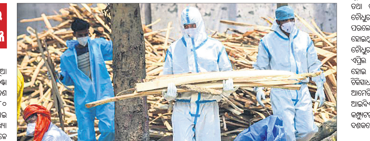
ବାକିରୁ ଶୁଣାଣିରେ ସ୍ୱାସ୍ଥ୍ୟକର୍ମୀ ଓ ପରିବାର ସଦସ୍ୟ ପିପିଇ କିଟ୍ ପିନ୍ଧି କରୋନା ମୃତକଙ୍କ ଶେଷକୃତ୍ୟ ପାଇଁ କାଠ ନେଉଛନ୍ତି ।

ନୂଆଦିଲ୍ଲୀ, ୬/୫(ପି.ଟି.): କରୋନା ସଂକ୍ରମଣ ପ୍ରତିଦିନ ନୂଆ ରେକର୍ଡ୍ କରିଚାଲିଛି । ଗତ ୨୪ ଘଣ୍ଟା ମଧ୍ୟରେ ଭାରତରେ ୪,୧୨,୨୬୨ ଜଣ ସଂକ୍ରମିତ ହୋଇଥିବାବେଳେ ୩,୯୮୦ ଜଣ ପ୍ରାଣ ହରାଇଛନ୍ତି । ଏହାକୁ ମିଶାଇ ଦେଶରେ ମୋଟ ସଂକ୍ରମିତଙ୍କ ସଂଖ୍ୟା ୨,୧୦,୭୬୪,୪୧୦ରେ ପହଞ୍ଚିଥିବାବେଳେ କରୋନା ଜନିତ ମୋଟ ମୃତ୍ୟୁସଂଖ୍ୟା ୨,୩୦,୧୬୮ ହୋଇଥିବା କେନ୍ଦ୍ର ସ୍ୱାସ୍ଥ୍ୟ ମନ୍ତ୍ରାଳୟ ତଥ୍ୟରୁ ଜଣାପଡ଼ିଛି । ଏହା ପୂର୍ବରୁ ଗତ ଏପ୍ରିଲ ୩୦ରେ ନେଇ ସଂକ୍ରମଣ ୪ ଲକ୍ଷ ଚପିଥିଲା । ଦେଶରେ ସକ୍ରିୟ ମାମଲା ସଂଖ୍ୟା ୩୫,୬୬,୩୮୮ରେ ପହଞ୍ଚିଲାଣି । ଯାହା ମୋଟ ସଂକ୍ରମଣର ୧୬.୯୨ ପ୍ରତିଶତ । ଆରୋଗ୍ୟ ହାର ହ୍ରାସ ପାଇ ୮୧.୯୯ରେ ପହଞ୍ଚିଥିବା ସରକାରୀ ତଥ୍ୟରୁ