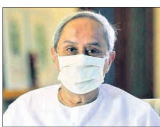
କେନ୍ଦ୍ର ଅର୍ଥମନ୍ତ୍ରୀଙ୍କୁ ନବୀନଙ୍କ ଟିପି

କୋଭିଡ୍-୧୯ ଦ୍ୱିତୀୟ ଲହରୀ ସମଗ୍ର ଦେଶ ପାଇଁ ଉପକ୍ରମ ପରିଚ୍ଛନ୍ନି ପୁଣି କରିଛି। ଏହି ମହାମାରୀ ପାଇଁ କ୍ରୟ କରାଯାଉଥିବା ଟିକା ଉପରୁ ବ୍ରହ୍ମାଣ୍ଡ ଓ ସେବା ଟିକସ(ଜିଏସ୍ଟି) ଛାଡ଼ କରିବାକୁ ପୁଞ୍ଜୀମନ୍ତ୍ରୀ ନବୀନ ପଟ୍ଟନାୟକ କେନ୍ଦ୍ର ସରକାରଙ୍କୁ ନିବେଦନ କରିଛନ୍ତି। ଏ ନେଇ ଗୁରୁବାର ଅର୍ଥମନ୍ତ୍ରୀ ନିର୍ମଳା ସାତ୍ତାରାମନଙ୍କୁ ନବୀନ ଟିପି ଲେଖିଛନ୍ତି। ଏଥିସହିତ କେନ୍ଦ୍ର ସରକାରଙ୍କ ଦ୍ୱାରା ଆଦାୟ କରାଯାଉଥିବା ସେସ୍ ଓ ସରକାରୀ ରାଜସ୍ୱ ଆୟକୁ ସହାୟତା କରିବାକୁ ମଧ୍ୟ ଅନୁରୋଧ କରିଛନ୍ତି।