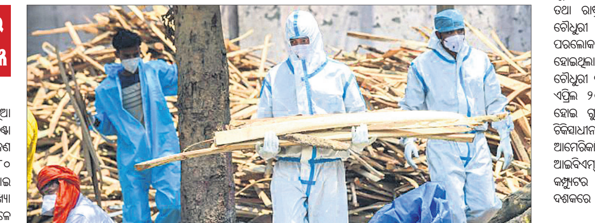
ବାକିରୁ ଶୁଣାଣରେ ସ୍ୱାସ୍ଥ୍ୟକର୍ମୀ ଓ ପରିବାର ସଦସ୍ୟ ପିପିଇ କିଟ୍ ପିନ୍ଧି କରୋନା ମୃତକଙ୍କ ଶେଷକୃତ୍ୟ ପାଇଁ କାଠ ନେଉଛନ୍ତି ।

ନୂଆଦିଲ୍ଲୀ, ୬/୫(ପି.ଟି.): କରୋନା ସଂକ୍ରମଣ ପ୍ରତିଦିନ ନୂଆ ରେକର୍ଡ୍ କରିଚାଲିଛି । ଗତ ୨୪ ଘଣ୍ଟା ମଧ୍ୟରେ ଭାରତରେ ୪,୧୨,୨୬୨ ଜଣ ସଂକ୍ରମିତ ହୋଇଥିବାବେଳେ ୩,୯୮୦ ଜଣ ପ୍ରାଣ ହରାଇଛନ୍ତି । ଏହାକୁ ମିଶାଇ ଦେଶରେ ମୋଟ ସଂକ୍ରମିତଙ୍କ ସଂଖ୍ୟା ୨,୧୦,୭୬୪,୪୧୦ରେ ପହଞ୍ଚିଥିବାବେଳେ କରୋନା ଜନିତ ମୋଟ ମୃତ୍ୟୁସଂଖ୍ୟା ୨,୩୦,୧୨୮ ହୋଇଥିବା କେନ୍ଦ୍ର ସ୍ୱାସ୍ଥ୍ୟ ମନ୍ତ୍ରାଳୟ ତଥ୍ୟରୁ ଜଣାପଡ଼ିଛି । ଏହା ପୂର୍ବରୁ ଗତ ଏପ୍ରିଲ ୩୦ରେ ନେଇ ସଂକ୍ରମଣ ୪ ଲକ୍ଷ ଚପିଥିଲା । ଦେଶରେ ସକ୍ରିୟ ମାମଲା ସଂଖ୍ୟା ୩୫,୬୬,୩୮୮ରେ ପହଞ୍ଚିଛି । ଯାହା ମୋଟ ସଂକ୍ରମଣର ୧୬.୯୨ ପ୍ରତିଶତ । ଆରୋଗ୍ୟ ହାର ହ୍ରାସ ପାଇ ୮୧.୯୯ରେ ପହଞ୍ଚିଥିବା ସରକାରୀ ତଥ୍ୟରୁ