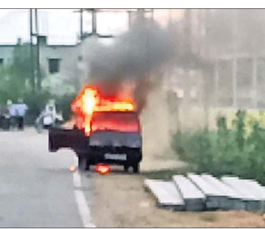
ଗାଡ଼ିରେ ନିଆଁ ଲାଗିଛି।

ଅନୁଗୋଳ ଅଫିସ, ୬/୫: ଅନୁଗୋଳ ସ୍ଥିତ ଆଞ୍ଚଳିକ ବଜାର ସମ୍ମୁଖରେ ଏକ ସୋଡ଼ା ଭର୍ତ୍ତି ଗାଡ଼ି ଜଳିଯାଇଛି। ଶତସଂଖ୍ୟକ ଲୋକ ଗାଡ଼ିରେ ଅଗ୍ନିକାଣ୍ଡ ଘଟିଥିବା ଜଣାପଡିଛି।