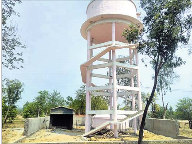
ପାଇପ୍‌ଲାଇନ୍ ପ୍ରକଳ୍ପରେ ଥିବା ଜଳଯୋଗାଣ ପ୍ରକଳ୍ପ।

ଗ୍ରାମାଞ୍ଚଳର ଲୋକଙ୍କୁ ପାଇପ୍ ପାଣି ଯୋଗାଇ ଦେବାକୁ ରାଜ୍ୟ ସରକାର ବିକଳ ଯୋଜନାରେ ପ୍ରକଳ୍ପମାନ ନିର୍ମାଣ କରୁଛନ୍ତି। ଏଥିପାଇଁ ବହୁ ଲକ୍ଷ ଟଙ୍କା ଖର୍ଚ୍ଚ କରାଯାଉଥିଲେ ମଧ୍ୟ ଆବଶ୍ୟକ ରକ୍ଷାଣୀକରଣ କରାଯାଇ ନାହିଁ।