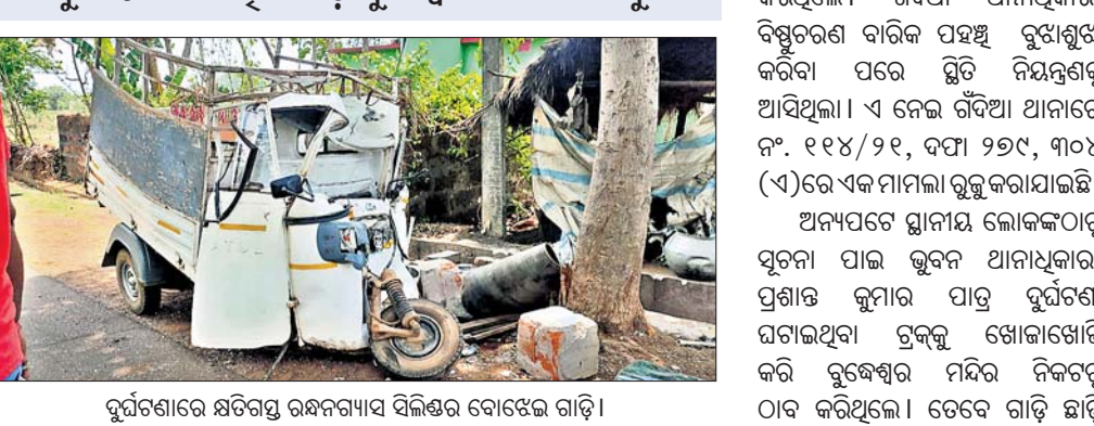
ଦୁର୍ଘଟଣାରେ କ୍ଷତିଗ୍ରସ୍ତ ରକ୍ଷଣାବେତ୍ତ ସିଲିଣ୍ଡର ବୋହେଇ ଗାଡ଼ି।

ଟାକୁ ଉତ୍ତେଜନା, କ୍ଷତିପୂରଣ ଦାବିରେ ରାସ୍ତା ଅବରୋଧ ଦୁର୍ଘଟଣା ଘଟାଇଥିବା ଗାଡ଼ି ବୁଦ୍ଧେଶ୍ୱର ମନ୍ଦିର ନିକଟରୁ ଠାବ