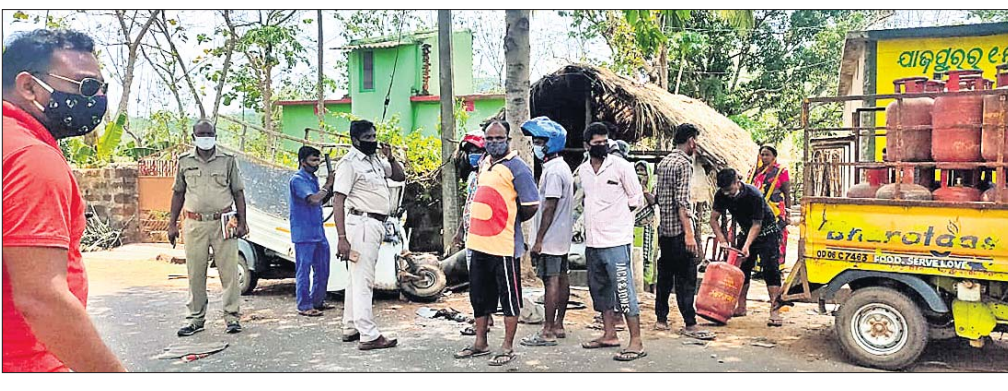
ଘଟଣାସ୍ଥଳରେ ପୋଲିସ୍ ଅଧିକାରୀ ପହଞ୍ଚି ତଦନ୍ତ କରୁଛନ୍ତି।

ଦେଶାନ୍ତ ଜିଲ୍ଲା ଗଝିଆ ଥାନା ମନ୍ଦିର ଛକ ନିକଟରେ ଗୁରୁବାର ସକାଳେ ଏକ ହୃଦୟ ବିଚାରକ ଦୁର୍ଘଟଣା ଘଟିଛି। ଭାରସାମ୍ୟ ହରାଇ ଏକ ୧୪ ଚକିଆ ତ୍ରକ୍ (ନଂ. ଓଡ଼ି ୦୪ କେ ୫୭୮୯) ଚଢ଼ିଯିବା ପ୍ରକଳ୍ପରେ ଜଣେ ବୃଦ୍ଧାଙ୍କ ସମେତ ୨ ଜଣଙ୍କ ମୃତ୍ୟୁ ଘଟିଛି।