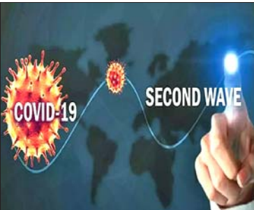
ଲକ୍ଷ କୋଟି ଟଙ୍କା ଚର୍ଚ୍ଚିଛି। ଅର୍ଥ ବ୍ୟୟରେ ଲଗାତର ସୁଧାର ଆହୁରିବା ଏଥିରୁ ଅନୁମାନ କରାଯାଇଛି।

ନୂଆଦିଲ୍ଲୀ, ୭/୫: ଦେଶ ମଧ୍ୟରେ କରୋନା ସଂକ୍ରମଣ ମାମଲା ଲଗାତର ବଢ଼ିଚାଲିଛି। ସଂକ୍ରମଣ ହ୍ରାସ କରିବା ଲାଗି ଟିକାକରଣ ଏକମାତ୍ର ବିକଳ୍ପ ବୋଲି ଏସ୍‌ବିଆଇ ପକ୍ଷରୁ ଏକ ରିପୋର୍ଟରେ ପ୍ରକାଶ ପାଇଛି।