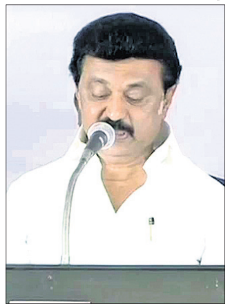
ଏମ୍.କେ. ଷ୍ଟାଲିନ୍ ତେରାଇ, ୭/୫