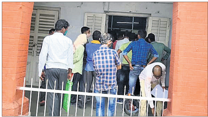
ଉପଜିଲ୍ଲାପାଳଙ୍କ କାର୍ଯ୍ୟାଳୟରେ ଲୋକଙ୍କ ଭିଡ୍ ଜମିଛି।

ଅନୁଗୋଳ ଅଫିସ, ୭ା୫: ଅନୁଗୋଳରେ କରୋନା ଗ୍ରାହ୍ୟ ବଢିବାରେ ଲାଗିଛି।