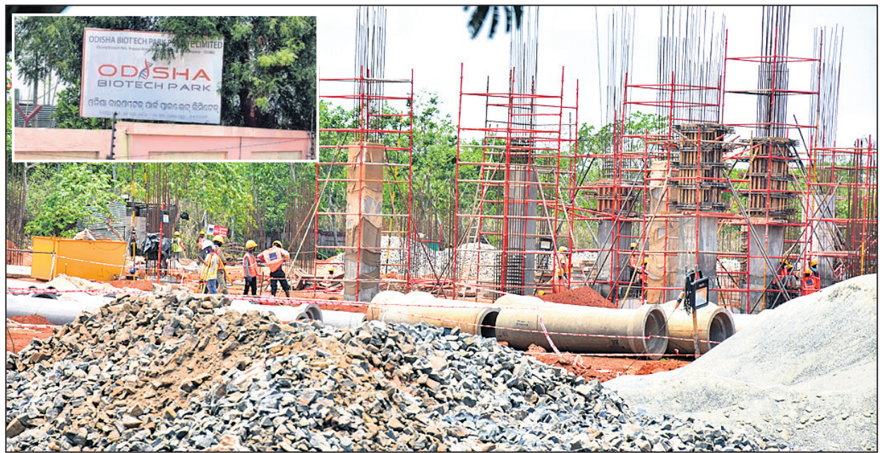
ଭୁବନେଶ୍ୱର ଉପକଣ୍ଠ ଅନ୍ଧାରୁଆରୁ ଟିକା ଉତ୍ପାଦନ କେନ୍ଦ୍ରର ନିର୍ମାଣ କାର୍ଯ୍ୟ ଚାଲୁ ରହିଛି।

ଭୁବନେଶ୍ୱର, ୭/୫ (ବ୍ୟବସ୍ଥା) ରାଜ୍ୟ ସରକାର ଭୁବନେଶ୍ୱର ଉପକଣ୍ଠ ଅନ୍ଧାରୁଆରୁ ଟିକା ଉତ୍ପାଦନ ଯୁନିଟ୍ ଗଠନ କରିବାକୁ ଭାରତ ବାୟୋଟେକ୍ ଲ୍ୟାବ୍‌ସ୍‌ ଲିମିଟେଡ୍ (ବିଆଇଏଲ୍‌ଏଲ୍) ସହ ୭ ବର୍ଷ ତଳେ ଚୁକ୍ତିନାମା ପ୍ରତିଷ୍ଠାପଣ କରିଥିଲେ। ତେବେ ଉକ୍ତ କମ୍ପାନୀ ଓଡ଼ିଶା ଯୁନିଟ୍‌କୁ ସେତେତା ରୁଜୁଦ୍ ଦେଇ ନ ଥିଲା। ରାଜ୍ୟ ସରକାରଙ୍କ ପକ୍ଷରୁ ବାରମ୍ବାର ଏ ନେଇ ଯୋଗାଯୋଗ କରାଯାଇଥିଲେ ମଧ୍ୟ କମ୍ପାନୀ ପକ୍ଷରୁ ଚପୁରତା ପ୍ରକାଶ ପାଇ ନ ଥିଲା। ୨୦୨୦ରେ କୋଭିଡ୍-୧୯ ମହାମାରୀ ବ୍ୟାପିବାରୁ କମ୍ପାନୀ ଇଣ୍ଡିଆନ କାଉନ୍‌ସିଲ୍ ଅଫ୍ ଫେଡିକାଲ୍ ରିସର୍ଚ୍ଚ (ଆଇସିଏମ୍‌ଆର୍) ଏବଂ ନ୍ୟାଶନାଲ୍ ଇନ୍‌ଷ୍ଟିଚ୍ୟୁଟ୍ ଅଫ୍ ଭାଇରୋଲୋଜି (ଏନଆଇଭି) ସହ ମିଶି କୋଭାକ୍ସିନ୍ ଟିକା ଉତ୍ପାଦନ କରିଛି। ଏହି ଟିକା ଯୋଗାଇବା ପାଇଁ ଭାରତ ବାୟୋଟେକ୍ ଉପରେ ପ୍ରବଳ ଚାପ ପଡ଼ୁଛି। ଆବଶ୍ୟକତା ଦେଖି କମ୍ପାନୀ ଓଡ଼ିଶାରେ ଟିକା ଉତ୍ପାଦନ କରିବାକୁ ବ୍ୟଗ୍ର ହୋଇ ପଡ଼ିଛି। ଆସନ୍ତା ୨୦୨୨ ଜୁନ୍ ପୂର୍ବା ଅନ୍ଧାରୁଆରୁ ଟିକା ଉତ୍ପାଦନ ଯୁନିଟ୍