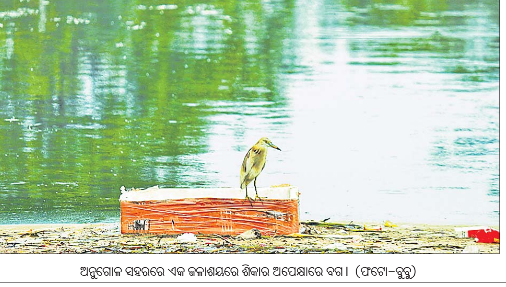
ଅନୁଗୋଳ ସହରରେ ଏକ ଜଳାଶୟନ ଶିକାର ଅପେକ୍ଷାରେ ବଗା