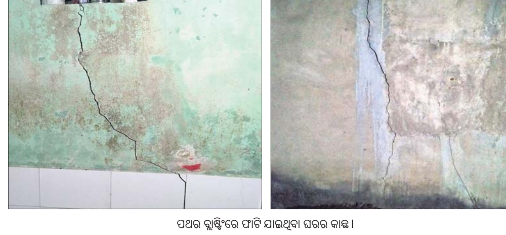
ପଥର ଲୁଣ୍ଠିରେ ଫାଟି ଯାଇଥିବା ଘରର କାଢ଼।

ଗ୍ରାମବାସୀ ଭୟଭୀତ ହୋଇ ପଡ଼ିଛନ୍ତି। ଏ ନେଇ ବାରମ୍ବାର ପ୍ରଶାସନ ନିକଟରେ ଅଭିଯୋଗ କରାଯିବା ସତ୍ତ୍ୱେ କୌଣସି ପ୍ରତିକାର ମିଳୁ ନାହିଁ। ସମସ୍ୟା ସମ୍ପର୍କରେ ଗ୍ରାମର ଏକ ପ୍ରତିନିଧି ଦଳ ମଙ୍ଗଳବାର ଜିଲ୍ଲାପାଳଙ୍କୁ ଭେଟି ବିଧିବଦ୍ଧ ଭାବେ ଅଭିଯୋଗ କରିଥିଲେ। ପଥର ଲୁଣ୍ଠି ବ୍ୟାପକ ମାତ୍ରରେ କ୍ରମେ କ୍ରମେ ବିପଦରେ ପଡ଼ିଛି। ଅନେକ ଘରର