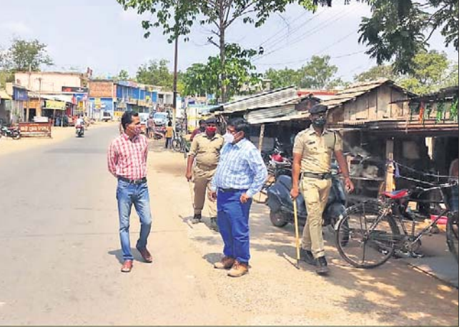
ରାସୋଳରେ କଢ଼ାକଢ଼ି ଯାଅ ଚାଲିଛି।