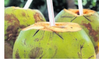
-କବିଜ୍ୟୋତି ନିରଞ୍ଜନ ପତି ରାଣୀ ମାର୍ଗ, ଅନୁଗୋଳ

୩ ଜନ୍ମ ବେଳେ ମୋ ମୁଣ୍ଡଟି ଲଣ୍ଡା ଭିତରେ ପାଣି ମୋ ପେଟକୁ ଥଣ୍ଡା। ପାକକ ହେଲେ ମୋ ହୁଅଇ ଚୁଟି ଭିତରେ ପାନାନ୍ତ ସାଦିଷ୍ଟ ଚୁଟି। ମାଆ ଉକତା ମୋ ବହୁତ ତେଜା ନାଆଁ କହି ଖାଇ ହୁଅହେ ତେଜା ଉ- ପଇଡ଼