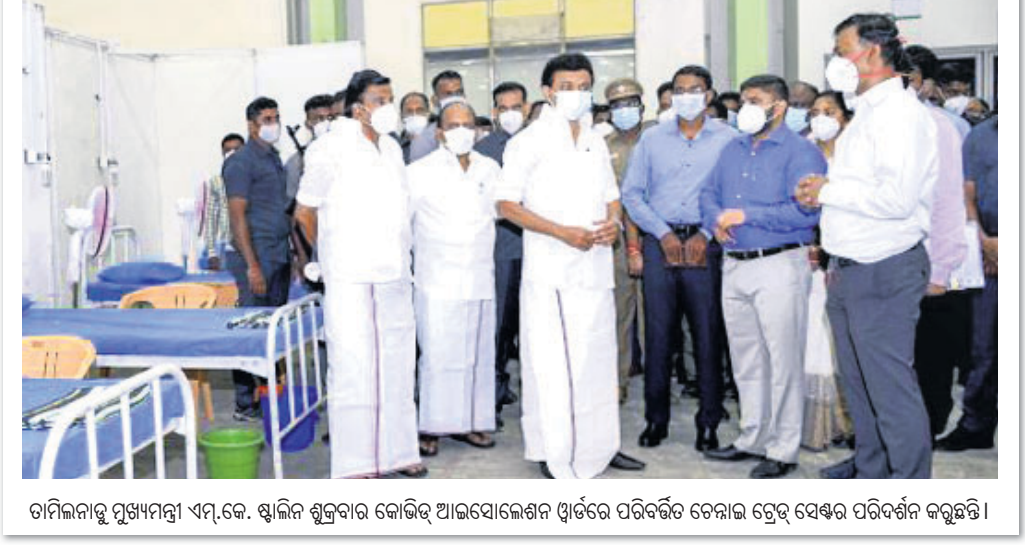
ବାମିଲନାଡୁ ପୁଖ୍ୟମନ୍ତ୍ରୀ ଏମ୍.କେ. ଷ୍ଟାଲିନ ଶୁକ୍ରବାର କୋଭିଡ୍ ଆଇସୋଲେସନ୍ ଓଡ଼ିରେ ପରିବର୍ତ୍ତିତ ଚେନାଇ ହେଉଁ ସେଠାରେ ପରିବର୍ତ୍ତନ କରୁଛନ୍ତି।

ମ୍ୟାନମାରର ସାମରିକ ଶାସକ ଯାଙ୍ଗୁନ୍, ମାଣ୍ଡାଲେ ଏବଂ ସାଗାଲଙ୍ଗ ଅଞ୍ଚଳରେ ନିରୁକ୍ତ କରିଥିବା ପ୍ରଶାସକ ଅଧିକାରୀଙ୍କୁ ସଶସ୍ତ୍ର ବିରୋଧୀମାନେ ହତ୍ୟା କରିଛନ୍ତି। ଏହା ସାମରିକ ଶାସନ ବିରୋଧରେ ସଶସ୍ତ୍ର ପ୍ରତିରୋଧର ସଙ୍କେତ ଦେଉଛି। ଏପ୍ରିଲ ମଧ୍ୟଭାଗରୁ ଓଡ଼ିଶା ପ୍ରଶାସକ ଏବଂ ପୋଲିସ୍ ସୂଚନା ପ୍ରଦାନକାରୀଙ୍କୁ ଚାରିଟି କରି ବାରମ୍ବାର ଆକ୍ରମଣ କରାଯାଇଛି। ଆକ୍ରମଣ ପାଇଁ କେହି ନିଜକୁ ଦାୟୀ କରୁନାହାନ୍ତି। ଫେବୃୟାରୀ ୧୬ ମ୍ୟାନମାରରେ ଆରୋକନରେ ଅନେକ କମ୍ପୋଜିଟ ପ୍ରାଣ ହରାଇଥିବା ଏଥିରେ କଠୋରପକ୍ଷୀମାନେ ସ୍ପଷ୍ଟ ହୋଇ ସଶସ୍ତ୍ର ପ୍ରତିରୋଧୀ ଗୋଷ୍ଠୀ ଗଠନ କରିଛନ୍ତି। ଏହି ଗୋଷ୍ଠୀରେ ବର୍ମାର ମୁକ୍ତବାସିନ୍ଦା ସାମିଲ ଅଛନ୍ତି। ଫେବୃୟାରୀ ଆର୍ମି ଓ ଏଭଳି ଅନ୍ୟ କେତେକ ଗୋଷ୍ଠୀ ମିଳିତ ଭାବେ ସଂଯୁକ୍ତ ପ୍ରତିରକ୍ଷା ବାହିନୀ (ୟୁଡିଏଫ) ଗଠନ କରିଛନ୍ତି। ବିଦ୍ରୋହୀ କରେନ ନ୍ୟାଶନାଲ ୟୁନିୟନର ଶିବିରରେ ନବନିୟୁକ୍ତ ସୈନ୍ୟମାନଙ୍କୁ ସଶସ୍ତ୍ର ତାଲିମ ଦିଆଯାଇଛି।