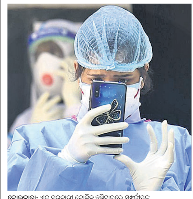
କୋଲକାତା: ଏକ ସରକାରୀ କୋଭିଡ୍ ହସ୍ପିଟାଲରେ ସର୍ପର୍ଟିୟାଲ୍ ଦେଖାଇବା ଜାରି ମୋବାଇଲରେ ଜଣେ ରୋଗୀଙ୍କ ଫଟୋ ଖୋଜୁଛନ୍ତି ସ୍ୱାସ୍ଥ୍ୟକର୍ମୀ।

ନିର୍ଦ୍ଦେଶନାମା ଜାରି ହୋଇଛି, ଯାହାକୁ ଅନୁଲୋଭନ କରିବାକୁ ନିର୍ଦ୍ଦେଶ ଦିଆଯାଇଛି। କାତୀୟ ରାଜଧାନୀକୁ ୭୦୦ ମେଟ୍ରିକ୍ ଟନ୍ ଅକ୍ସିଜେନ ଯୋଗାଣ କରିବାରେ କେନ୍ଦ୍ରର ବିଫଳତା ନେଇ ଦିଲ୍ଲୀ ହାଇକୋର୍ଟ ଜାରି କରିଥିବା ଅପମାନନା ନୋଟିସ୍ କେନ୍ଦ୍ର ସୁପ୍ରିମକୋର୍ଟରେ ଚ୍ୟାଲେଞ୍ଜ କରିଥିଲା। ଏହାର ଶୁଣାଣି କରି ଶୀର୍ଷ ଅଦାଲତ ଉପରୋକ୍ତ ମତବ୍ୟ ଦେଇଛନ୍ତି। କେନ୍ଦ୍ର ପକ୍ଷରୁ ରୁଧିରୀ ଦିଲ୍ଲୀକୁ ୭୩୦ ମେଟ୍ରିକ୍ ଟନ୍ ଅକ୍ସିଜେନ ଦିଆଯାଇଥିବାବେଳେ ଗୁରୁତାର ଏହାକୁ ୫୩୭ ମେଟ୍ରିକ୍ ଟନ୍କୁ ଖସାଇ ଦିଆଯାଇଥିଲା। ତେଣୁ ଅନ୍ୟାନ୍ୟ ପର୍ଯ୍ୟନ୍ତ ଦୈନିକ ୭୦୦ ମେଟ୍ରିକ୍ ଟନ୍ ଅନୁମତି ଯୋଗାଣ ସୁନିଶ୍ଚିତ କରିବାକୁ ସୁପ୍ରିମକୋର୍ଟ କଡ଼ା ନିର୍ଦ୍ଦେଶ ଦେଇଛନ୍ତି।