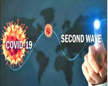
ଲକ୍ଷ କୋଟି ଟଙ୍କା ବୃଦ୍ଧି। ଅର୍ଥ ବ୍ୟୟରେ ଲଗାତର ସୁଧାର ଆହୁରିବା ଏଥିରୁ ଅନୁମାନ କରାଯାଇଛି। ଦ୍ୱିତୀୟ ଲହର ଯୋଗୁ ବଜାରର

ନୂଆଦିଲ୍ଲୀ, ୭/୫: ଦେଶ ମଧ୍ୟରେ କରୋନା ସଂକ୍ରମଣ ମାମଲା ଲଗାତର ବୃଦ୍ଧିଲାଭି। ସଂକ୍ରମଣ ହ୍ରାସ କରିବା ଲାଗି ଟିକାକରଣ ଏକମାତ୍ର ବିକଳ୍ପ ବୋଲି ଏସ୍ବିଆଇ ପକ୍ଷରୁ ଏକ ରିପୋର୍ଟରେ ପ୍ରକାଶ ପାଇଛି। ଏସ୍ବିଆଇର ମୁଖ୍ୟ ଅଧିକାରୀଙ୍କ ଯୋଗ୍ୟତା ଯୋଗୁ କହିଛନ୍ତି, ଗ୍ରାମାଞ୍ଚଳରେ ମେ ମାସରେ କରୋନାର ୪୮.୫% ନୂଆ ମାମଲା ଦେଖାଯାଉଥିବାରୁ ଏହା ଚିନ୍ତା କାରଣ ପାଇଛି। ମାର୍ଚ୍ଚରେ ଏହା ୩୬.୮% ରହିଥିଲା। ସଂକ୍ରମଣ ରୋକିବା ଲାଗି ବୃହତ୍ ପରିମାଣରେ ଟିକାକରଣ ଉପରେ ରିପୋର୍ଟରେ ଗୁରୁତ୍ୱାବେଶ କରାଯାଇଛି। ବର୍ତ୍ତମାନ ୧୭ ଲକ୍ଷ ଲୋକଙ୍କୁ ଦୈନିକ ଟିକାକରଣ ହେଉଥିବା ବେଳେ ତିନିସପ୍ତକ ଯାଏ ଏହା ୫୫ ଲକ୍ଷକୁ ବୃଦ୍ଧି କରିବା ଆବଶ୍ୟକତା ରହିଛି ବୋଲି ରିପୋର୍ଟରେ କୁହାଯାଇଛି।