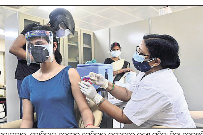
ପ୍ରଧାନମନ୍ତ୍ରୀ: ମୋତିଲାଲ ନେହେରୁ ମେଡିକାଲ କଲେଜରେ ଜଣେ ମହିଳା ଚିକା ନେଉଛନ୍ତି। ତୋକ୍ ଚିକା ନେଇଛନ୍ତି। ତେବେ ଏହା କର୍ପୋରେଟ୍ ହସ୍ପିଟାଲ ଜରିଆରେ କିମ୍ବା ରାଜ୍ୟ କୋଟାକୁ ଦିଆଯାଇଛି। କେନ୍ଦ୍ର ଶୁକ୍ରବାର ସକାଳ ପୂଜା ୧୮ରୁ ୪୪ ବର୍ଷୀୟ ୧୧.୮୧ ଲକ୍ଷ ନାଗରିକ ପ୍ରଥମ

ଅନୁସାରେ ଚିକାକରଣ ନିର୍ଦ୍ଦେଶ ବକାୟ ରଖିବାକୁ କୁହାଯାଇଛି। ସରକାରଙ୍କ ଗାଇଡ୍‌ଲାଇନ୍ ଅନୁସାରେ କୋଭିଡ୍‌ନି ପ୍ରଥମ ତୋକ୍ ଚିକା ନେବାର ୪-୬ ଦିନ ମଧ୍ୟରେ ଦ୍ୱିତୀୟ ତୋକ୍ ନିଆଯିବ। ସେହିପରି କୋଭିଡ୍‌ନିରୁ ବୁଲି ତୋକ୍ ମଧ୍ୟରେ ୪ରୁ ୮ ସପ୍ତାହ ବ୍ୟବଧାନ ରହିବ। ମେ ୧ରେ ଆରମ୍ଭ ହୋଇଥିବା ନୂଆ ଭାଙ୍ଗିନ ନାତି ଅନୁସାରେ ରାଜ୍ୟଗୁଡ଼ିକୁ ପଠାଯାଇଥିବା ଭାଙ୍ଗିନକୁ କେବଳ ୪୪ରୁ ଉର୍ଦ୍ଧ୍ୱ ବୟସ୍କଙ୍କୁ ଦିଆଯିବ। ୧୮ରୁ ୪୪ ବର୍ଷୀୟ ନାଗରିକ ରାଜ୍ୟର ସରକାରୀ ଓ ଘରୋଇ ହସ୍ପିଟାଲଗୁଡ଼ିକକୁ ପୂର୍ବତନ ଭାବେ ଚିକା ନେବେ। ଅନେକ ସ୍ୱାସ୍ଥ୍ୟ ଓ ପରିବାର କଲ୍ୟାଣ ମନ୍ତ୍ରାଳୟର ତଥ୍ୟାନୁସାରେ ଦେଶରେ ମୋଟ ୧୬.୫୦ କୋଟି ତୋକ୍ ଚିକା ଦିଆଯାଇଛି। ଏଥିରୁ ୧୩.୨୧ କୋଟି ପ୍ରଥମ ଓ ୩.୨୯ କୋଟି ଦ୍ୱିତୀୟ ତୋକ୍ ଶୁକ୍ରବାର ସକାଳ ପୂଜା ୧୮ରୁ ୪୪ ବର୍ଷୀୟ ୧୧.୮୧ ଲକ୍ଷ ନାଗରିକ ପ୍ରଥମ