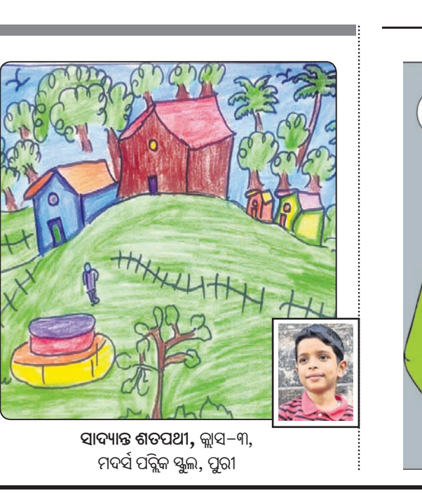
ସାବ୍ୟାନ୍ତ ଶତପଥୀ, କ୍ଲାସ-୩, ମଦର୍ସ ପବ୍ଲିକ୍ ସ୍କୁଲ, ପୁରୀ