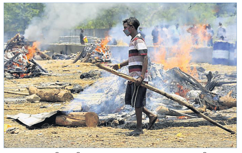
ଝାଡ଼ଖଣ୍ଡର ଜାମ୍‌ସେଦପୁରସ୍ଥିତ ପରଘାଟି ଘାଟରେ ସୋମବାର କରୋନା ମୃତକଙ୍କ ସମ୍ବନ୍ଧ ସମ୍ବନ୍ଧ କରାଯାଇଛି।

ନ ପାରି ସେଗୁଡ଼ିକୁ ପରିବାର ଲୋକେ ଭାସାଇ ଦେଇଥିଲେ। ତେବେ କେଉଁଠାରୁ ମୃତଦେହ ଭାସି ଆସିଛି ତାହାର ତଦନ୍ତ କରାଯିବ ବୋଲି ବିହାର ପ୍ରଶାସନ ପକ୍ଷରୁ କୁହାଯାଇଛି।