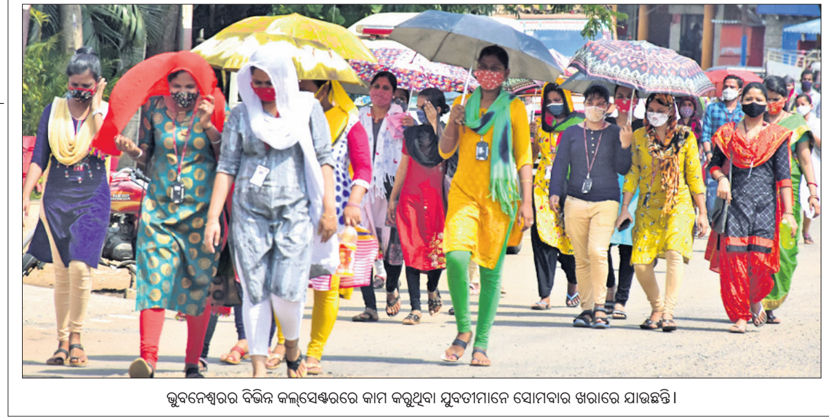
ଭୁବନେଶ୍ୱରର ବିଭିନ୍ନ କଲ୍‌ସେକ୍ଟରରେ କାମ କରୁଥିବା ମୁବତ୍ତାମାନେ ସୋମବାର ଖରାରେ ଯାଉଛନ୍ତି।

ବିଶ୍ୱକପ୍ ପାଇଁ ଭୁବନେଶ୍ୱର କଲିଙ୍ଗ ସ୍ଥାପନା, ଏବଂ ରାଉରକେଲାର ଅର୍ଦ୍ଧଶତାବ୍ଦୀ ହକି ସ୍ଥାପନା ଗ୍ରୀଡ଼ା ଭିଡିଓସ୍ତି ପାଇଁ ଡକାଯାଇଥିବା ଟେଣ୍ଡରକୁ କ୍ୟାବିନେଟ ଅନୁମୋଦନ କରିଛି। ମେଡିକାଲ ଅଭିଜ୍ଞେତ ଉତ୍ସାହୀ, ରିପିଲିଂ ପ୍ରତିକୂଳ ସଂଗୋଧନ କରାଯିବ। ଏଥିସହିତ ବାଣିଜ୍ୟ ଓ ପରିବହନ ବିଭାଗ ପକ୍ଷରୁ ଦିଆଯାଇଥିବା ଓଡ଼ିଶା ପରିବହନ ଗ୍ରାଉଁଥ୍ ଆଣ୍ଡ ଏନ୍ଫୋର୍ସମେଣ୍ଟ ବ୍ଲୁସ୍-୨୦୧୩ ସଂଗୋଧନ ପ୍ରସ୍ତାବକୁ କ୍ୟାବିନେଟ ଅନୁମୋଦନ କରିଛି। ସେହିପରି ଜଙ୍ଗଲ ଓ ପରିବେଶ ବିଭାଗ ନାମ ପରିବର୍ତ୍ତନ କରାଯାଇଛି। ଜଙ୍ଗଲ ଓ ପରିବେଶ ବିଭାଗ ପରିବର୍ତ୍ତନ କରାଯାଇଛି। ଜଙ୍ଗଲ ପରିବେଶ ଓ ଜଳବାୟୁ ପରିବର୍ତ୍ତନ ବିଭାଗ ଭାବେ ନାମିତ କରାଯିବ। ବିଭାଗ ପକ୍ଷରୁ ଦିଆଯାଇଥିବା ଏହି ପ୍ରସ୍ତାବକୁ କ୍ୟାବିନେଟ ମଞ୍ଜୁରା ମିଳିଛି। ଏଥିସହିତ ଓଡ଼ିଶା ଏକ୍ସପ୍ରିସ୍‌ମେନ (ରିଗୁଲେଟେଡ୍ ଟୁ ଷ୍ଟେଟ୍ ସିଭିଲ୍ ସର୍ଭିସେସ୍ ଆଣ୍ଡ ପୋଷ୍ଟ୍‌ସ୍) ରୁଲ୍ ସଂଗୋଧନ, ଓଡ଼ିଶା ପବ୍ଲିକ୍ ସର୍ଭିସ୍ କମିଶନଙ୍କ ୨୦୧୭-୧୮ ବାର୍ଷିକ ରିପୋର୍ଟ, ରାଜ୍ୟ ବାହାରେ ଥିବା ଗୃହ ବିଭାଗ ଦ୍ୱାରା ପରିଚାଳିତ ହେଉଥିବା ବିଭିନ୍ନ ଓଡ଼ିଶା ଇଭେନ୍ଟୁଆଲ୍‌ସ୍ ରହିବା ଓ ଅନ୍ୟାନ୍ୟ ସେବା ପାଇଁ ଏକ ସ୍ୱତନ୍ତ୍ର ନିୟମ ପ୍ରସ୍ତୁତ ହେବ। ଏହି ପ୍ରସ୍ତାବକୁ କ୍ୟାବିନେଟ ଅନୁମୋଦନ କରିଛି।