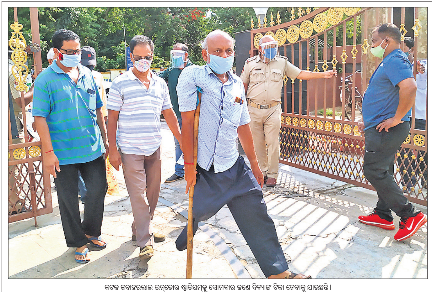
କଟକ ଜବାହରଲାଲ ଇନ୍ଦ୍ରପୋର ସ୍ମୃତିମନ୍ଦିର ସୋମବାର ଜଣେ ବିଦ୍ୟାଳ ଟିକା ନେବାକୁ ଯାଉଛନ୍ତି।

୧୨ତା ୩୦ରେ ବିଦ୍ୟୁତ୍ ଦେହ ବାବଦରେ ସଂଗ୍ରହ ହୋଇଥିବା ୬.୧୬ ଲକ୍ଷ ୧୬ହଜାର ୭୮୦ଟଙ୍କା ସଞ୍ଚିତ ଏକ ବ୍ୟାଗରେ ଧରି ବ୍ୟାଙ୍କରେ ଜମା କରିବା ପାଇଁ ଘରୁ ବାଜକରେ ବାଲୁଗା ଯାଉଥିଲେ।