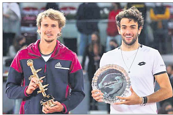
ଚାମ୍ପିୟନ ଆଲେକ୍ସାଣ୍ଡର ଜେଭ୍ରେଭ ଏବଂ ରନର୍ସଅପ୍ ମାରିଓ ବେରେଟିନି

ଚମ୍ପିୟନ ଫର୍ମ ବଜାୟ ରଖି ଆଲେକ୍ସାଣ୍ଡର ଜେଭ୍ରେଭ ମାଡ୍ରିଡ୍ ଓପନ ଚେମ୍ପିୟନ ଚାଲଟଳ କରିଛନ୍ତି। କ୍ୟାରିୟରରେ ଦ୍ୱିତୀୟଥର ପାଇଁ ସେ ମାଡ୍ରିଡ୍ ଚାଲଟଳ ହାସଲ କରିଛନ୍ତି। ଚତୁର୍ଥ ସ୍ଥାନ ରାଫାଲ ନାଡାଲଙ୍କୁ ଭାଙ୍ଗି ଫାଇନାଲ ଏବଂ ଧର୍ମ୍ୟାକ୍ରମେ ତୃତୀୟ ଥର ପାଇଁ ସେମିଫାଇନାଲରେ ହରାଇଥିବା ଜେଭ୍ରେଭ ଫାଇନାଲରେ ମାରିଓ ବେରେଟିନିଙ୍କୁ ୬-୭(୮), ୬-୪, ୬-୩ ସେଟ୍ରେ ପରାସ୍ତ କରି ଚାମ୍ପିୟନ ହୋଇଛନ୍ତି। ଚଳିତ ସିଜନରେ ଏହା ତାଙ୍କର ଦ୍ୱିତୀୟ ଚାଲଟଳ। ୬୫ ର୍ୟାଙ୍କିଂଆଧାର ଏହି ଜର୍ମାନୀ ଖେଳାଳି ଗତ ମାର୍ଚ୍ଚରେ ମେଡ୍ରିକାନ୍ ଓପନ ଜିତିଥିଲେ। ଜେଭ୍ରେଭ ୨୦୧୮ରେ କ୍ୟାରିୟରର ପ୍ରଥମ ମାଡ୍ରିଡ୍ ଚାଲଟଳ ଜିତିଥିଲେ। ସେତେବେଳେ ସେ ଫାଇନାଲରେ ଥିଲେ ପରାସ୍ତ କରିଥିଲେ। ଏଥର ଚାମ୍ପିୟନ ହେବାପରେ ସେ ୪ର୍ଥ ଥର ପାଇଁ ମାଷ୍ଟର୍ସ ୧୦୦୦ ଚାଲଟଳ ହାସଲ କରିଛନ୍ତି। ତେବେ ଗତ ୩ ବର୍ଷରେ ଏହା ପ୍ରଥମ ଥର ପାଇଁ ଗତବର୍ଷ ପ୍ରେସ୍