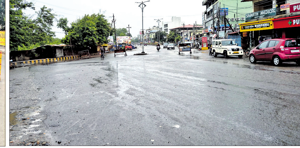
ମଙ୍ଗଳବାର ଅଦିନିଆ ବର୍ଷାରେ ଭିଜି ସମ୍ବଲପୁର ସହର।