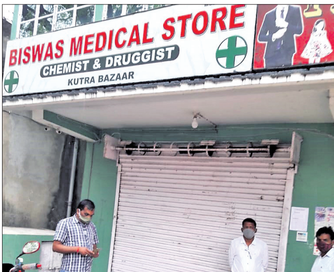
କୁଡ଼ାରେ ବେଆଇନ କ୍ଲିନିକ୍ ସିଲ୍ କରାଯାଇଛି ।