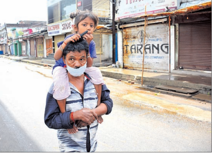
ମଙ୍ଗଳବାର ସମ୍ବଲପୁର ଲକ୍ଷ୍ମୀନଗର ଥାନାରେ ଜଣେ ବ୍ୟକ୍ତି ଶିଶୁକୁ କାନ୍ଧିବେ ବୋହି ଘର ପୁଆଁ ହେଉଛନ୍ତି। ଲକ୍ଷ୍ମୀନଗର ଛକଠାରେ ଏସ୍‌ପି ଲକ୍ଷ୍ମୀନଗର ଘୃତି ବିଷୟରେ ଆଲୋଚନା କରୁଛନ୍ତି।