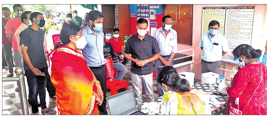
ଏସ୍‌ପିସିଏର ଏକ ଟିକାକେନ୍ଦ୍ର ତଦାରଖ କରୁଛନ୍ତି ଜିଲାପାଳ।