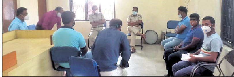
ବୈଠକରେ କମ୍ପାନୀ କର୍ମଚାରୀ, ସରକାରୀ ଅଧିକାରୀ ଓ ଅଞ୍ଚଳବାସୀ ।