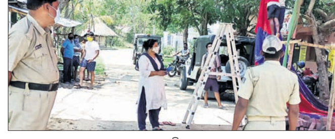
ରାସ୍ତାରେ ବନ୍ଧା ଯାଇଥିବା ଚେଷ୍ଟା ଯାଇଛି।

ବନ୍ଧ, ୧୨୧୫(ଡି.ଏନ.ଏ.): ଭଦ୍ରକ ଜିଲ୍ଲା ବନ୍ଧ ବ୍ଲକ୍ ରୋଡିଂପୁର ପଞ୍ଚାୟତ ଅଞ୍ଚଳୀୟ ଗ୍ରାମର ସର୍ବସାଧାରଣ ରାସ୍ତା ଉପରେ ବନ୍ଧା ଯାଇଥିବା ଚେଷ୍ଟାକୁ ବୁଧବାର ସ୍ଥାନୀୟ ପ୍ରଶାସନ ପକ୍ଷରୁ ଉଲ୍ଲଙ୍ଘନ ଅଭିଯୋଗରେ ତହସିଲଦାର କୋଭିଡ୍ କଟକଣା ତଦାରଖ ପାଇଁ