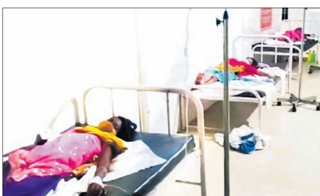
ଉଦକା ଡାକ୍ତରଖାନାରେ ଝଡ଼ିପୋକ ତରକାରି ଖାଇ ଅସୁସ୍ଥ ପିଲାକୁ ଚିକିତ୍ସା କରାଯାଉଛି।

ରାୟଗଡ଼ା ୨୧୨, ସୋନପୁର ୨୧୫, ଜଗତସିଂହପୁର ୨୩୨, କେନ୍ଦୁଝର ୨୫୩ ପୁଣି ବଢୁଛି। ମଙ୍ଗଳବାର ୯,୭୯୩ ଆକ୍ରାନ୍ତ ଚିହ୍ନଟ ହୋଇଥିଲେ। ହେଲେ ରୁଧିରୀରେ ୧୦ହଜାର ଡେଇଁଛି। ଗତ ୨୪ ଘଣ୍ଟାରେ ୧୦,୯୮୨ଜଣ ନୂଆ ଆକ୍ରାନ୍ତ ଚିହ୍ନଟ ହୋଇଛନ୍ତି। ଏବେ ବି ଖୋର୍ଦ୍ଧା, ସୁନ୍ଦରଗଡ଼ ଓ କଟକରେ ସଂକ୍ରମଣ ନିୟନ୍ତ୍ରଣ ଦାହାରେ ରହିଛି। ଖୋର୍ଦ୍ଧାରେ ସର୍ବାଧିକ ୧,୫୩୯ଜଣ ଚିହ୍ନଟ ହୋଇଥିବାବେଳେ ସୁନ୍ଦରଗଡ଼ରେ ଆଉ ୯୬୪ ଓ କଟକରେ ତୃତୀୟ ସର୍ବାଧିକ ୮୮୫ ଆକ୍ରାନ୍ତ ହୋଇଛନ୍ତି। ସେହିପରି ଅନୁଗୋଳ ୫୩୯, ସମ୍ବଲପୁର ୪୫୪, ବରଗଡ଼ ୪୩୧, ବଲାଙ୍ଗୀର ୪୨୬, ବାଲେଶ୍ଵର ୩୦୩, ନବରଙ୍ଗପୁର ୩୩୫, ନୂଆପଡ଼ା ୩୩୮, ପୁରୀ ୩୯୮, ଯାଜପୁର ୩୪୯, ଝାରସୁଗୁଡ଼ା ୩୮୦, କଳାହାଣ୍ଡି ୩୭୦, ମୟୂରଭଞ୍ଜ ୨୩୯,