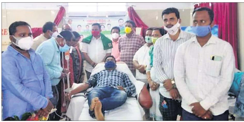
ଶିବିରରେ ରକ୍ତଦାନ କରାଯାଇଛି ।