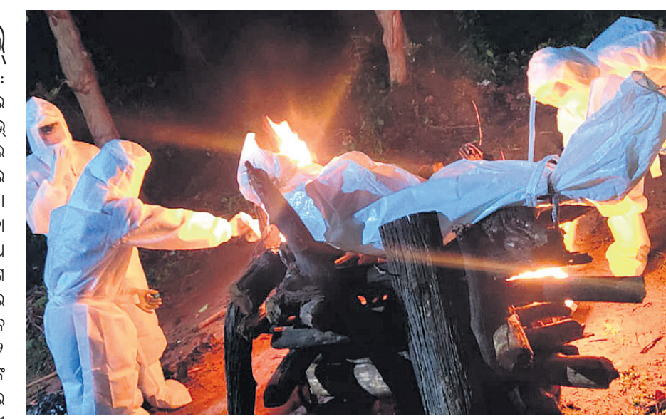
ଉପଜିଲାପାଳ ଓ ଅନ୍ୟମାନେ ମୃତଦେହ ସହାର କରୁଛନ୍ତି।