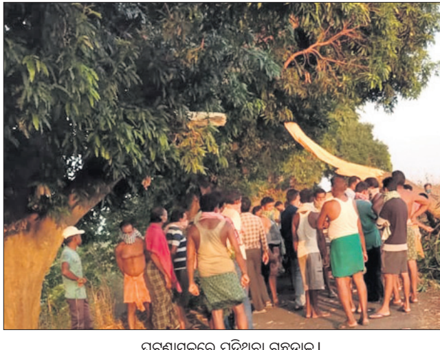
ଘଟଣାସ୍ଥଳରେ ପଡ଼ିଥିବା ଗନ୍ଧଡ଼ାକ।

ବରଗଡ଼ ଅଫିସ୍/ବରପାଲି, ୧୨।୫ ଅଭାବନୀୟ ଘଟଣା ଘଟିଛି। ରାସ୍ତାରେ ଆସୁଥିବାବେଳେ ଗନ୍ଧଡ଼ାକ ହଠାତ୍ ଭାଙ୍ଗି ପଡ଼ିବା ଯୋଗୁ ୨ବାଇକ୍ ଆରୋହୀଙ୍କ ମୃତ୍ୟୁ ଘଟିଛି। ମୃତକମାନେ ହେଲେ