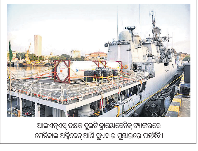
ଆଇଏସ୍‌ଏସ୍ ଡେଲଟି ଲାୟୋଜେନିକ୍ ଟ୍ୟାଙ୍କରରେ ମେଡିକାଲ ଅକ୍ସିଜେନ୍ ଆଣି ବୁଧବାର ମୁମ୍ବାଇରେ ପହଞ୍ଚିଛି।