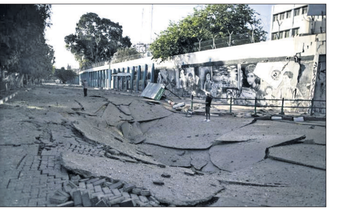
ରକେଟ ମାଡ଼ରେ ବାଜା ସିଟିର ରାସ୍ତାଘାଟ ଧ୍ୱସ୍ତବିଧି ହୋଇଯାଇଛି।

ବାଜା ସ୍ଥିତିରେ ପାଲେଷ୍ଟାଇନ୍ ଚରମପନ୍ଥୀ ଏବଂ ଲକ୍ଷ୍ମଣନ ସେନା ମଧ୍ୟରେ ଗୁଳି ବିନିମୟ ଓ ରକେଟ ଆକ୍ରମଣ ବଢ଼ିବାରେ ଲାଗିଛି।