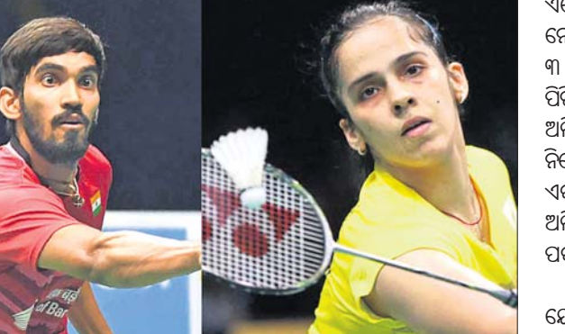
କିଡାୟା ଶ୍ରୀକାନ୍ତ ଓ ସାଇନା ନେହାଲ।

କ୍ୱାଲିଫାୟର୍ ଇଭେଣ୍ଟ ବିବେଚିତ ହେଉଥିଲା। କୋଭିଡ୍-୧୯ କାରଣରୁ ଗାରି କରାଯାଇଥିବା ଭ୍ରମଣକର୍ତ୍ତା କଟକଣା ପାଇଁ ଏହି କ୍ୱାଲିଫାୟର୍ ଚୁନାବଳୀକୁ ବାତିଲ କରାଯାଇଛି ବୋଲି ଆୟୋଜକମାନେ ସୂଚନା ଦେଇଛନ୍ତି। ସିଙ୍ଗାପୁର ବ୍ୟାଡମିଣ୍ଟନ ଆସୋସିଏସନ (ଏସିଏ) ଓ ବିତର୍କସୂଚୀ ମିଳିତ ଭାବେ ଏହି ଚୁନାବଳୀକୁ ବାତିଲ କରିବାକୁ ନିଷ୍ପତ୍ତି ନେଇଛନ୍ତି। ସିଙ୍ଗାପୁର ଓପନ କ୍ରୁ