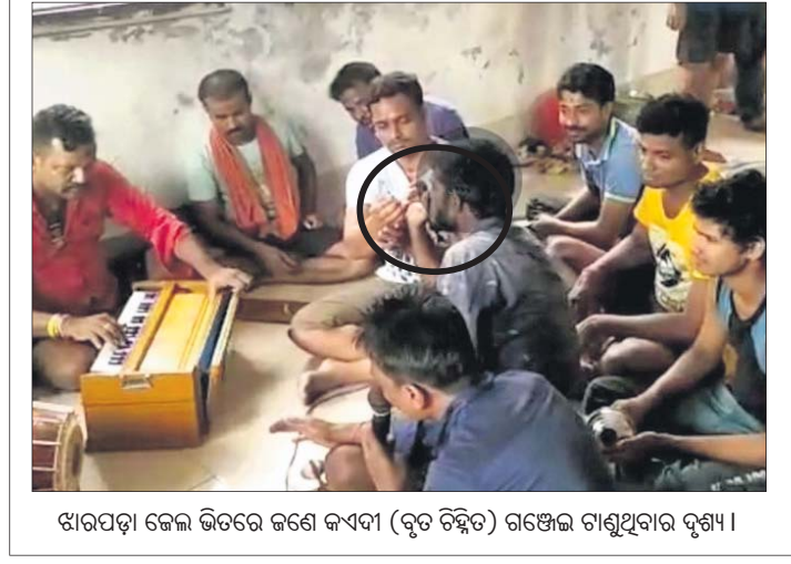
ଝାରପଡ଼ା ଜେଲ ଭିତରେ ଜଣେ କଏଦୀ (ବୃତ୍ତ ଚିହ୍ନିତ) ଗଞ୍ଜେଇ ଚାଣୁଥିବାର ଦୃଶ୍ୟ।

ରେକର୍ଡ(ସିଡିଆର) ମଗାଯାଇଛି। ସେହିପରି ମୋବାଇଲ୍ ଜେଲ ପରିସରକୁ ଆସିବା ପଛରେ କାହାର ହାତ ଅଛି, ସେନେଇ ଜେଲ ବିଭାଗ ପକ୍ଷରୁ ଖୋଜାଟାଡ଼ି ଆରମ୍ଭ ହୋଇଛି।