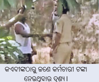
କଏଦୀଙ୍କୁ ଟଙ୍କା ନେଉଛନ୍ତି ବୁଣୀ।

ପୁଣି ଚଢ଼ାଉ, ମିଲିଲା ୨ ମୋବାଇଲ୍ ଜବତ ହେଲାଣି ୧୩ ଫୋନ୍