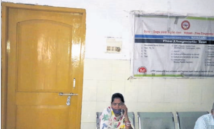
ହାଇ ଏଣ୍ଡ ପାଥୋଲୋଜି ରୁହ କବାଟରେ ତାଲା ପଡ଼ିଛି ।