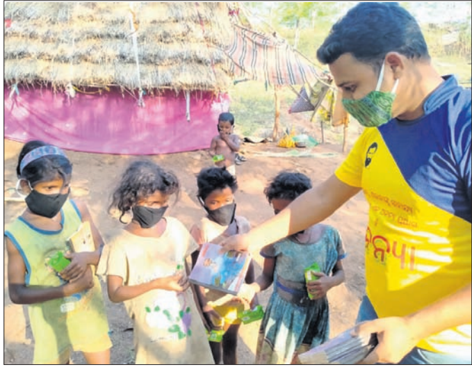
ଜନଜାତି ପିଲାମାନଙ୍କୁ ପାଠ୍ୟପୁସ୍ତକ ପ୍ରଦାନ କରାଯାଇଛି ।

ସଚେତନ କରାଯିବା ସହ ମାଙ୍କୁ ଓ ସାନିଟାଇଜର ବ୍ୟବହାର ସମ୍ପର୍କରେ ଅବଗତ କରାଯାଇଥିଲା । କନ୍ଧମାଳ ଜିଲ୍ଲାରୁ ଆସିଥିବା ଏହି ପରିବାର ସଦସ୍ୟମାନେ ଭିକ୍ଷା ବୃଦ୍ଧି କରି ଚଳୁଛନ୍ତି । ସେମାନଙ୍କ ପିଲାମାନେ ପାଠ ପଢ଼ିବା ପାଇଁ କିଛି ବହି ପ୍ରଦାନ କରାଯାଇଛି ।