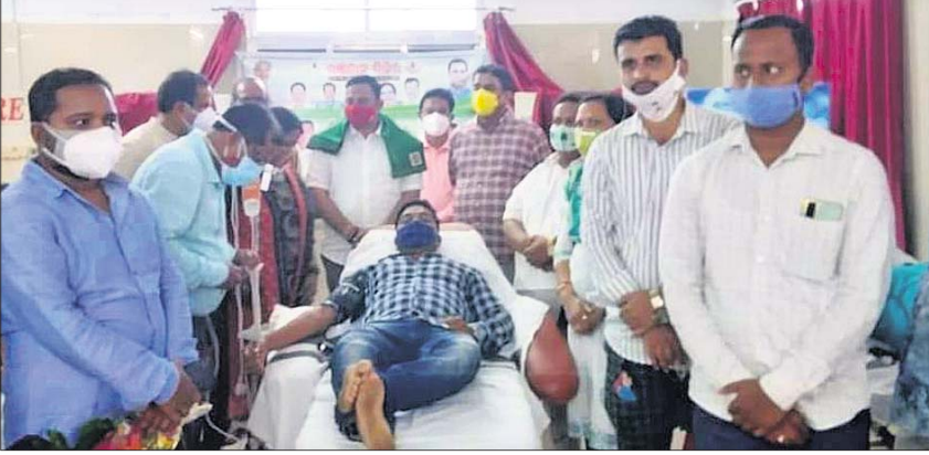
ଶିବିରରେ ରକ୍ତଦାନ କରାଯାଇଛି ।