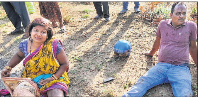
ଲୁଚି ଶିକାର ହୋଇଥିବା ଦମ୍ପତି ।