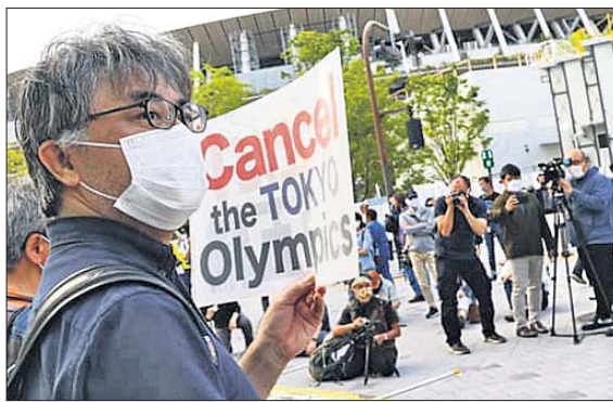
ଅଲିମ୍ପିକ୍ସ ଆୟୋଜନ ବିରୋଧ କରି ଲୋକମାନେ ପ୍ରଦର୍ଶନ କରୁଛନ୍ତି।

ଟୋକିଓ, ୧୨।୫(ଏସି) ଚୋକିଓ ଅଲିମ୍ପିକ୍ସ ଆୟୋଜନ ନେଇ ଜାପାନରେ ବିରୋଧ ପ୍ରଦର୍ଶନ କରିବା ସହ ଲୋକେ ଅସନ୍ତୋଷ ଜାହିର କରିଛନ୍ତି। ଅଲିମ୍ପିକ୍ସ ବାତିଲ କରିବା ନେଇ ଦାବି ଜୋର ଧରିଛନ୍ତି। ବିନା ଟୀକା କରଣରେ ସରକାରଙ୍କ ଅଲିମ୍ପିକ୍ସ ଆୟୋଜନ କରିବାର ଯତ୍ନ ଏବେ ଦେଶକୁ ବିପର୍ଯ୍ୟୟ ଆଡ଼କୁ ନେଇଛି ବୋଲି କୁହାଯାଉଛି। ୩ ଲକ୍ଷରୁ ଊର୍ଦ୍ଧ୍ୱ ନାଗରିକ ଏକ ପିଟିଶନରେ ସ୍ୱାକ୍ଷର କରି ଅଲିମ୍ପିକ୍ସକୁ ବାତିଲ କରିବାକୁ ନିବେଦନ କରିଛନ୍ତି। ଏପରିକି ଏକ ତାରକା ସତରଣକାରୀଙ୍କୁ ଅଲିମ୍ପିକ୍ସ ଓହରିଯିବାକୁ ଚାପ ପକାଇବାର ଅଭିଯୋଗ ହୋଇଛି।