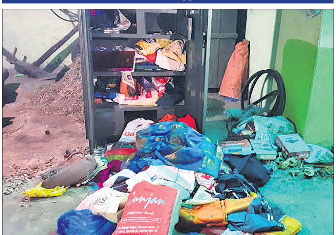
ଚୋରି ପରେ ଷ୍ଟିଲ ଆକିମିରା ବିଭିନ୍ନ ଭିନ୍ନିଷ ଏଣେତେଣେ ପଡ଼ିଛି ।

ସଦ୍‌କରୁପେକ୍ଷର ଏମ୍‌ଡି କାଫୁଲ, ଏସ୍‌ଏସ୍‌ଆଇ ସଞ୍ଜୀବସାହିପ୍ରମୁଖ ଚଢ଼ ଟଙ୍କାଛଡ଼ି । ସାଉଥ୍‌ପିକ୍ ଟିଏଫ୍ ଏସ୍‌ନାମା