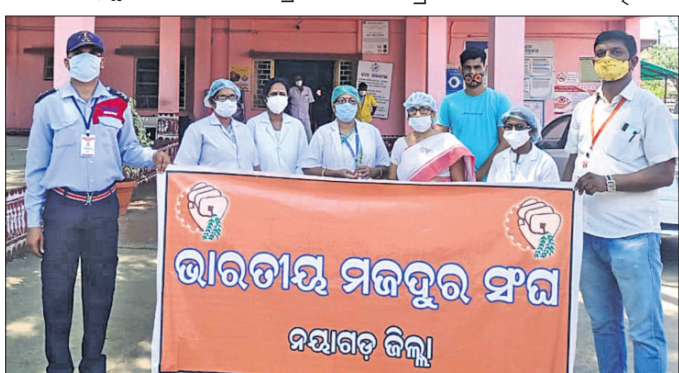
ନର୍ସ ଦିବସ କାର୍ଯ୍ୟକ୍ରମରେ ସାମିଲ ହୋଇଥିବା ସେବାକାମୀନେ ।