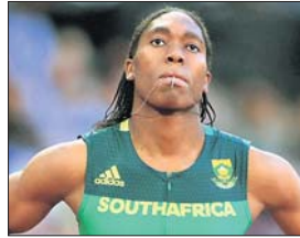
କେସ୍ ବାଉନ, ୧୨।୫(ଏସି)

କଲମ୍ବୋ, ୧୨।୫(ପି.ଟି.) ଉଇକେଟ କିପର ବ୍ୟାଟ୍ସମ୍ୟାନ କୁଶାଲ ପେରେରା ଶ୍ରୀଲଙ୍କା ଏକଦିବସୀୟ କ୍ରିକେଟ ଦଳର ଅଧିନାୟକ ନିଯୁକ୍ତ ହୋଇଛନ୍ତି। ଦିନିକିଆ କରୁଣାରତ୍ନେକ ସ୍ଥାନରେ ପେରେରାଙ୍କୁ ଏହି ସ୍ଥାନରେ ମିଳିଛି। ତଳେ ମାସରେ ହେବାକୁଥିବା ବାଲାଦେଶ ବିପକ୍ଷ ସିରିଜ ପାଇଁ କୁଶାଲ ମେଣ୍ଡିସଙ୍କୁ ପେରେରାଙ୍କୁ ତେପୁଟି ଅର୍ଥାତ୍ ଉପ-ଅଧିନାୟକ ମନୋନୀତ କରାଯାଇଛି। ଶ୍ରୀଲଙ୍କା ପକ୍ଷରୁ ପେରେରା ୧୦୧ ଦିନିକିଆ, ୨୨ ଟେଷ୍ଟ ଓ ୪୭ ଦିନିକିଆ ଖେଳିଛନ୍ତି। ବିଦାୟ ଅଧିନାୟକ କରୁଣାରତ୍ନେକ ସମେତ ସିନିୟର ଅଲ୍ରାଉଣ୍ଡର ଆକ୍ଷେଲୋ ମାଥୁସ, ଚପ୍ ଅର୍ଡର ବ୍ୟାଟ୍ସମ୍ୟାନ ଲାହିରୁ ପୁରୀନେ ଏବଂ ଉଇକେଟ କିପର ଦାନେଶ ରଞ୍ଜିମଲଙ୍କୁ ଦଳକୁ ବାଦ ଦିଆଯାଇଛି। କେତେକ ନୂଆ ପୂର୍ଣ୍ଣ ଦଳରେ ସାମିଲ କରାଯାଇଛି। ଦୁଇ ବୋଲର ଚାମିଳା କରୁଣାରତ୍ନେକ ଓ ବ୍ୟାଟ୍ସମ୍ୟାନ ଶିରନ ଫର୍ନାଣ୍ଡୋ ପ୍ରଥମଥର ପାଇଁ ଦଳରେ ସ୍ଥାନ ପାଇଥିବାବେଳେ କେତେକ ଟିଏ ୨୦ ମ୍ୟାଚ ଖେଳିଥିବା ସିନ୍ଧୁର ଫର୍ନାଣ୍ଡୋ ମଧ୍ୟ ନିଆଯାଇଛି। ଶ୍ରୀଲଙ୍କା ଦଳ ତଳେ ମାସ ୧୬ ତାରିଖରେ ବାଲାଦେଶ ଗସ୍ତ କରି ୩ ମ୍ୟାଚ ବିଶିଷ୍ଟ ଦିନିକିଆ ସିରିଜ ଖେଳିବ। ତାହାରେ ମ୍ୟାଚଟୁଟିକ ମେ' ୨୩, ୨୫ ଓ ୨୮ ତାରିଖରେ ଖେଳାଯିବ।