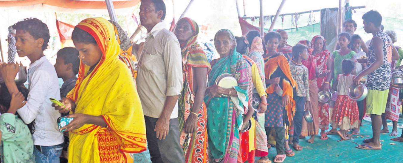
ବିପଦରେ ବିସ୍ତାପିତକ ଜୀବନ: କାଳବୈଶାଖୀ ଠାକୁରରେ ମଙ୍ଗଳବାର କଟକ ନୂଆପଡ଼ା ବାଲିସାହିସ୍ଥିତ ଅଲ୍ଲୋୟା ଥରଥାନ କ୍ୟାମ୍ପ ବାଲି ନଷ୍ଟ ହୋଇଯାଇଥିଲା। ଏଠାରେ ରହୁଥିବା ବିସ୍ତାପିତମାନେ ରୁଧିରୀକାରୀ ସମାଜିକ ସୁରକ୍ଷାକୁ ଭୁଲି ଖାଦ୍ୟ ପାଇଁ ଧାଡ଼ିରେ ଠିଆହୋଇଛନ୍ତି।

ନୂଆଦିଲ୍ଲୀ, ୧୨।୫ ଦେଶରେ କରୋନା ସଂକ୍ରମଣ ବଢ଼ିଚାଲିଥିବାବେଳେ ଏବେ ବିଭିନ୍ନ ରାଜ୍ୟରେ ବିଭିନ୍ନ ମ୍ୟୁକୋରମାଇକୋସିସ୍ ବା ଲୁକ୍ ଫଙ୍ଗସ୍ ସଂକ୍ରମଣ ଚିକ୍ତା ବଢ଼ାଇ ଦେଇଛି। ଏହି ଫଙ୍ଗସ୍ ଆଖି, ସାଇନସ୍, ମସ୍ତିଷ୍କ, ପୁସ୍‌ପୁସ୍‌ସ୍‌ସ୍ ସଂକ୍ରମଣ କରି ନଷ୍ଟ କରିଦେବା ସହ ଜୀବନ ପ୍ରତି ବିପଦ ସୃଷ୍ଟି କରିଛି। ମ୍ୟୁକୋରମାଇକୋସିସ୍ ଚିକିତ୍ସା ନିମନ୍ତେ ଆଣ୍ଟିଫୁଙ୍ଗାଲ୍ ଔଷଧ ଉପଯୋଗୀ ବଢ଼ାଇବା ଲାଗି ସରକାର ବିଭିନ୍ନ ପ୍ରକାରର ଚିକିତ୍ସା ଆରୋଗ୍ୟ