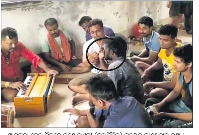
ଝାରପଡ଼ା ଜେଲ ଭିତରେ ଜଣେ କଏଦୀ (ବୃତ୍ତ ଚିହ୍ନିତ) ଗଞ୍ଜେଲ ଚାଣୁଥିବାର ଦୃଶ୍ୟ।

ରେକର୍ଡ(ସିଡିଆର) ମଗାଯାଇଛି। ସେହିପରି ମୋବାଇଲ୍ କେଲ ପରିସରକୁ ଆସିବା ପଛରେ କାହାର ହାତ ଅଛି, ସେନେଇ କେଲ ବିଭାଗ ପକ୍ଷରୁ ଖୋଜାଚାଡ଼ି ଆରମ୍ଭ ହୋଇଛି।