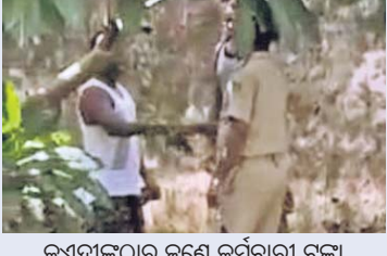
କଏଦୀଙ୍କଠାରୁ ଜଣେ କର୍ମଚାରୀ ଟଙ୍କା ନେଉଥିବାର ଦୃଶ୍ୟ।

ରେକର୍ଡ(ସିଡିଆର) ମଗାଯାଇଛି। ସେହିପରି ମୋବାଇଲ୍ କେଲ ପରିସରକୁ ଆସିବା ପଛରେ କାହାର ହାତ ଅଛି, ସେନେଇ କେଲ ବିଭାଗ ପକ୍ଷରୁ ଖୋଜାଚାଡ଼ି ଆରମ୍ଭ ହୋଇଛି।