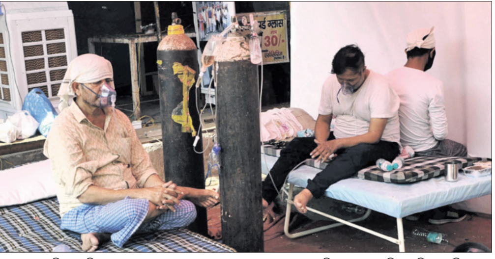
ଭାରତୀୟ ସରକାରଙ୍କ ଦ୍ୱାରା ଉତ୍ପାଦନ ହେଉଥିବା ଅଣ୍ଟା ସଳଖି ସ୍ୱାସ୍ଥ୍ୟକେନ୍ଦ୍ରରେ କୋଭିଡ୍ ରୋଗୀଙ୍କୁ ଅନୁକ୍ରମେ ଦିଆଯାଉଛି।

ନାହିଁ କି ଅନୁକ୍ରମେ ନାହିଁ। ଜୀବନ ରକ୍ଷାକାରୀ ଔଷଧ, ଲଜ୍ଜାହୀନ ଓ ଅନ୍ୟ ଉପକରଣ ଅଭାବକୁ ଲୋକ ବିପର୍ଯ୍ୟୟ ଭିତରକୁ ଚାଣିନେଇଛି। ସବୁ ସହର ରୋଗାକ୍ତ ଗନ୍ତାଘର, ପ୍ରତ୍ୟେକ ସମାଧି ସ୍ଥଳରେ ସ୍ଥାନାନ୍ତର। ଶୁଣାନ ଏବେଠାରୁ ଯେଉଁ ହିତାଧିକାରୀ ୪୨ରୁ ୬ ସପ୍ତାହ ମଧ୍ୟରେ ପୂର୍ଣ୍ଣ-୪