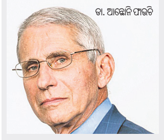
ଡା. ଆଲେକ୍ସି ପାଓର୍ଟି

ଫ୍ରେଣ୍ଡ୍‌ସ୍, ୧୨।୫ କରୋନା ପ୍ରଥମ ଲହର ନିୟନ୍ତ୍ରଣକୁ ନ ଆଣୁଥିବା ମହାମାରୀ ଶେଷ ହୋଇଯାଇଥିବା ନେଇ ଭାରତ 'ଭୁଲ୍ ଧାରଣା' କରିନେଇଥିଲା। ଫଳରେ ସମସ୍ତ ପୂର୍ବରୁ ଦେଶରେ ଲକ୍ଷ୍ମିଭାଙ୍ଗ ଚାଲି ଖୋଲିଦେବା ସହ ଅନ୍ୟାନ୍ୟ କଟକଣା ହଟାଇ ଦିଆଯାଇଥିଲା। ଏହି କାରଣରୁ କରୋନା ଦ୍ୱିତୀୟ ଲହର ଭାରତରେ ଭୟଙ୍କର ଛୁଟି ସୃଷ୍ଟି କରିଛି ବୋଲି କହିଛନ୍ତି ଆମେରିକାର ସଂକ୍ରମଣ ରୋଗ ବିଶେଷଜ୍ଞ ଡା. ଆଲେକ୍ସି ପାଓର୍ଟି। ଏଭଳି ଛୁଟିକୁ କେବଳ ଅନୁମାନ ଆଧାରରେ ଅଣଦେଖା କରିବା ଉଚିତ୍ ନୁହେଁ ବୋଲି ବର୍ତ୍ତମାନ ଭାରତର ଛୁଟି ଶିକ୍ଷା ଦେଇଥିବା ସେ କହିଛନ୍ତି।