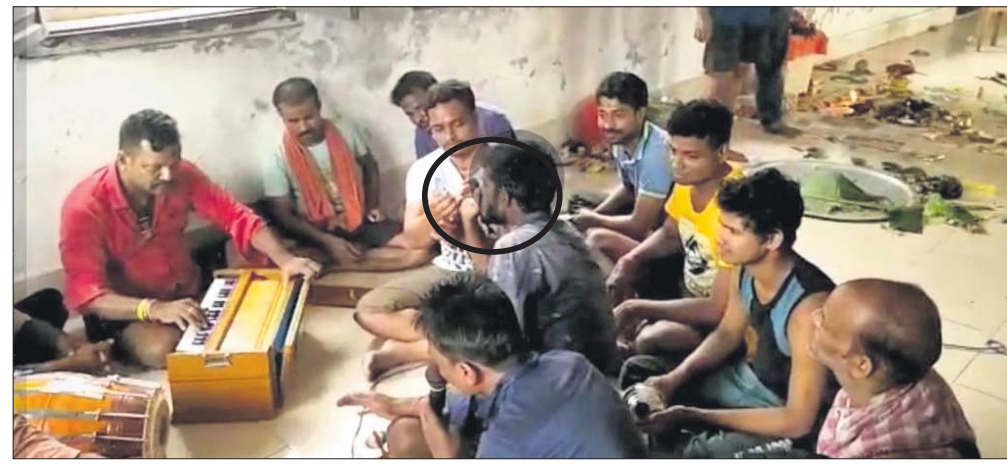
ଖାଉପତା ଜେଲ ଭିତର ଜଣେ କ୍ୟାଦୀ (କୃତ ଚିହ୍ନିତ) ଗଞ୍ଜେଇ ଚାଣୁଥିବାର ଦୃଶ୍ୟ।

ପୁରୀ ଅଫିସ, ୧୨/୫: ବଗଳା ଧର୍ମଶାଳା ବିକ୍ରି ପ୍ରସଙ୍ଗରେ ଜରୁରିକାଳୀନ ଶୁଣାଣି ପାଇଁ ଉଚ୍ଚ ନ୍ୟାୟାଳୟକୁ ନିବେଦନ କରାଯାଇଛି।