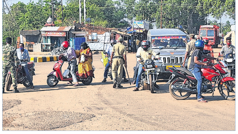
ରୁଧିରୀର କରୋନା ପାଇଁ ଖୋର୍ଦ୍ଧା ସ୍ୱାସ୍ଥ୍ୟକେନ୍ଦ୍ର ଉପରେ ପୋଲିସ୍ ଚେକ୍ କରିବାକୁ ଲାଗିଛି।