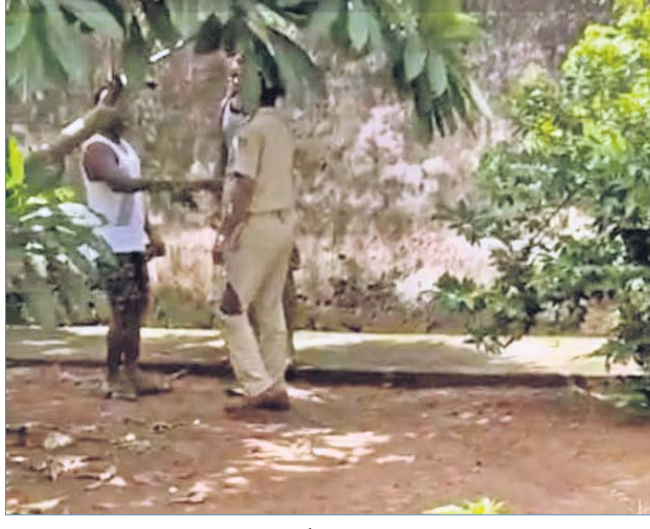
କ୍ୟାଦୀମାନଙ୍କୁ ଜେଲ କର୍ମଚାରୀ ଚଙ୍କା ନେଉଥିବାର ଦୃଶ୍ୟ।

ପରିସରକୁ ମୋବାଇଲ ଫୋନ୍ ମିଳୁଛି। କୁସାବାର ମଧ୍ୟ ଚଢ଼ାଉ କରାଯାଇ ଆଉ ୨ଟି ମୋବାଇଲ ଫୋନ୍ ଜବତ କରାଯାଇଛି।