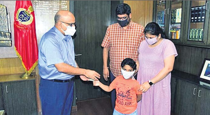
ଭୁବନେଶ୍ୱର, ୧୨/୫ (ଭୁବନେଶ୍ୱର)

କରୋନା ମୁକାବିଲାରେ ଆଗ୍ରାଧିକାରୀ ଯୋଗ୍ୟ ସାଜିଲି ପୋଲିସ କର୍ମଚାରୀ। ନିଜ ଜୀବନକୁ ବାଜି ଲଗାଇ କାର୍ଯ୍ୟ କରୁଛନ୍ତି।