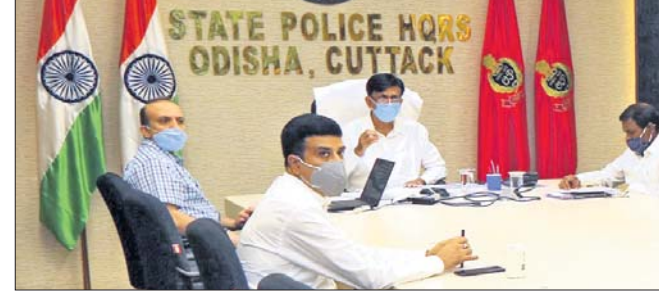
ସମୀକ୍ଷା ଫୈଠକରେ ଡିଜିପି ଅଧ୍ୟକ୍ଷ ଏବଂ ଅନ୍ୟ ଅଧିକାରୀ।

ପୁରୀ ପୋଲିସକୁ ପ୍ରଶଂସା କରିଥିଲେ। ସେହିପରି ଗଞ୍ଜାମ, ବାଲେଶ୍ୱର, ମୟୂରଭଞ୍ଜ, ସମ୍ବଲପୁର ଓ ଭଦ୍ରକ ଜିଲାରୁ କୋଭିଡ଼ ନିୟମ ଉଲ୍ଲଙ୍ଘନକାରୀଙ୍କୁ ଘରୋଇ କରିମାନା ଆଦାୟ କରାଯାଇଥିବାରୁ ସମସ୍ତ ଜିଲାର ସର୍ବମୁଖ୍ୟ ଡିଜିପି ପ୍ରଶଂସା କରିଥିଲେ।