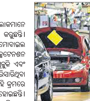
କୌଣସି ଗ୍ରାହକ ସେବା ଲାଭ କରିବାରେ ସମସ୍ୟା ସାମ୍ନା କରିଥାନ୍ତି ତେବେ ଚଳିତ ବର୍ଷ ଲୁଲାଇ ୩୧ ଯାଏ ଏହାର ଲାଭ ଗ୍ରାହକ ଉଠାଇ ପାରିବେ ବୋଲି କମ୍ପାନୀ ପକ୍ଷରୁ କୁହାଯାଇଛି। ସେହିଭଳି ଉପଭୋକ୍ତାମାନଙ୍କୁ

କରୋନା ବିତ୍ତୀୟ ଲହରୀ ଯୋଗୁଁ ଲୋକମାନେ ବର୍ତ୍ତମାନ ବିଭିନ୍ନ ସମସ୍ୟା ଦେଇ ରାତି କରୁଛନ୍ତି। ଏହାକୁ ଧ୍ୟାନରେ ରଖି ଦେଶର ଅଗୋପାବାଇଲ କମ୍ପାନୀଗୁଡ଼ିକ ଡ୍ରାରେଣ୍ଟି ଏବଂ ସର୍ଭିସ ଏକ୍ସଟେନ୍ସନ ସମ୍ପର୍କରେ ଯୋଷଣା କରିଛନ୍ତି। ମାତୃତ ପୁରୁଷ ଏବଂ ଗଣା ମୋଟର୍ସ ଏ ନେଇ ପୂର୍ବରୁ ଯୋଷଣା କରିସାରିଥିବା ବେଳେ ଏହା ବର୍ତ୍ତମାନ ଲାଗୁ ହୋଇଛି। ଏହି କ୍ରମରେ ରେନୋ ଇଣ୍ଡିଆ ଏବଂ ଯାମାହା ଯୋଡି ହୋଇଛନ୍ତି। ରେନୋ ଇଣ୍ଡିଆ ପକ୍ଷରୁ ଗୁରୁତ୍ୱ ଦେଇ କୁହାଯାଇଛି ଯେ, ଗ୍ରାହକଙ୍କ ଅଧିକାରୀଙ୍କୁ ଧ୍ୟାନରେ ରଖି ଡ୍ରାରେଣ୍ଟି ଏବଂ ଫ୍ରି ସର୍ଭିସ ସମୟ ସୀମାକୁ ବଢ଼ାଇଛନ୍ତି। ଚଳିତ ବର୍ଷ ଏପ୍ରିଲ ପହିଲାକୁ ମେ ୩୧ ଯାଏ ରହିଥିବା ସମୟ ସୀମା ଉପରେ ଏହା ଲାଗୁ ହେବ। ଏହି ସମୟ ମଧ୍ୟରେ ଯଦି