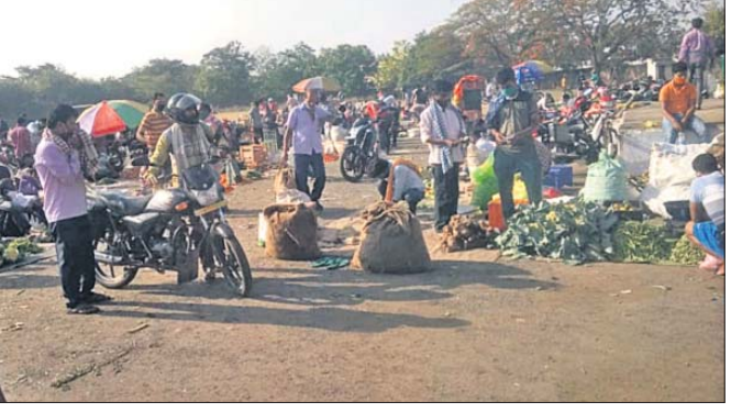
ଅସ୍ଥାୟୀ ପରିବା ବଜାର ଖୋଲାଯାଇଛି।

ଅନୁଗୋଳ ପୌରାଞ୍ଚଳର ୪ଟି ଗ୍ରାମରେ ଅସ୍ଥାୟୀ ହାଟ ଖୋଲିଛି। ଲୋକଙ୍କ ଭିଡ଼ ନିୟନ୍ତ୍ରଣ କରିବା ପାଇଁ ଏଭଳି ପଦକ୍ଷେପ ପ୍ରଶାସନ ପକ୍ଷରୁ ନିଆଯାଇଛି। ତେବେ ଲୋକମାନେ ଚାଲି ଚାଲି ଆସି ପରିବା କିଣି ପାରିବେ ବୋଲି କୁହାଯାଇଛି। ଅନୁଗୋଳ ସ୍ୱାସ୍ଥ୍ୟ, ଅମଳାପଡ଼ା ପୂର୍ବାଞ୍ଚଳ ପଡ଼ିଆ, ହେମସୁରପଡ଼ା ଆଣା, ଅକ୍ଷୟପୁଡ଼ି କର୍ମ, ସ୍ୱାସ୍ଥ୍ୟକର୍ମ ପ୍ରମୁଖ ଅଂଶ କରିଥିଲେ। ଏହି ସଚେତନତା ବାର୍ତ୍ତା ସମସ୍ତ ଗ୍ରାମରେ ପହଞ୍ଚାଇବାକୁ ପରାମର୍ଶ ଦିଆଯାଇଥିଲା।