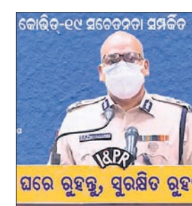
ଘରେ ରୁହନ୍ତୁ, ସୁରକ୍ଷିତ ରୁହନ୍ତୁ

ଯୋଗୁ ସେଭଳି ଯାନବାହନ ଚଳାଚଳ ନ କରିବାରୁ ପ୍ରାଥମିକ ପର୍ଯ୍ୟାୟରେ ଲୋକଙ୍କ ପକେଟ ଉପରେ ଏହାର ପ୍ରଭାବ ଦେଖିବାକୁ ମିଳି ନ ଥିଲା। ହେଲେ ପରେ ଏହା ଅନେକ ସମସ୍ୟା ସୃଷ୍ଟି କରିଛି। କେନ୍ଦ୍ର ସରକାରଙ୍କ ଚିକିତ୍ସ ବୃଦ୍ଧି ଏତିକିରେ ସୀମିତ ନ ଥିଲା। ୨୦୨୧-୨୨ ବଜେଟରେ ସରକାର ପୁଣିଥରେ ପେଟ୍ରୋଲ ଏବଂ ଡିଜେଲ ଉପରେ କୃଷି ଭିତ୍ତିକ ଉତ୍ତମୋତ୍ତର ଚିକିତ୍ସ ବାଦ ଦାବି ଲିଟର ପିଛା ୨.୫୦ ଟଙ୍କା ଓ ୪ ଟଙ୍କା ସେହି ବଢ଼ାଇଛନ୍ତି। ଏପରି ଲୋକଙ୍କ କଷ୍ଟ କମାଇବା ଲାଗି ସରକାର ଚିକିତ୍ସ କମାଇବାକୁ କୌଣସି ପଦକ୍ଷେପ ଗ୍ରହଣ କରୁନାହାନ୍ତି। ଫଳରେ ଦରବୃଦ୍ଧି ଯୋଗୁ ଲୋକେ ନାହିଁ ନ ଥିବା ସମସ୍ୟାକୁ ସାମ୍ନା କରୁଛନ୍ତି।