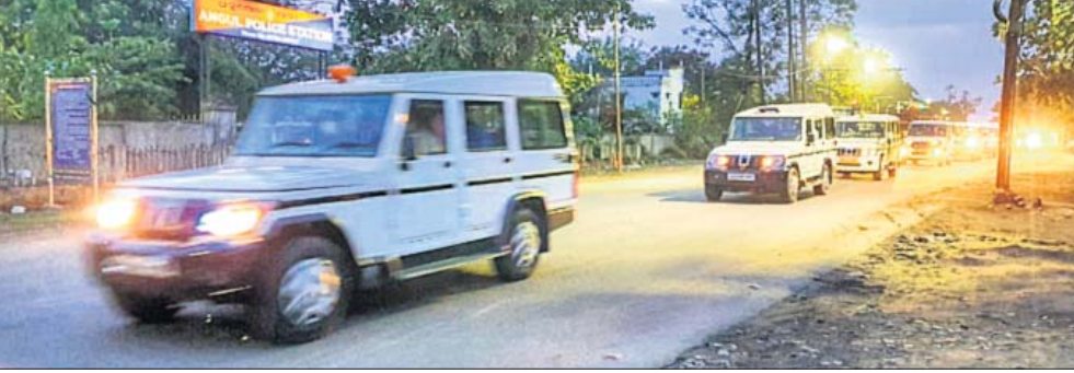
ସହରବାସୀଙ୍କୁ ସଚେତନ କରିବାକୁ ପ୍ରଶାସନ ଓ ପୋଲିସ୍ ଅଧିକାରୀମାନେ ଯାଉଛନ୍ତି।

ଚିକା ଅଭାବକୁ ନେଇ ଏବେ ରାଜ୍ୟରେ ଅସୁବିଧା ସୃଷ୍ଟି ହୋଇଛି। ଚିକା ନେବାକୁ ଲୋକେ ବିଭିନ୍ନ ମେଡିକାଲରେ ଭିଡ଼ ଲାଗୁଥିବା ବେଳେ ମାତ୍ର ଅଳ୍ପ କେତେଜଣଙ୍କୁ ଚିକାକରଣ କରାଯାଇ ପାରୁଛି। ଫଳରେ ଧିରେ ଧିରେ ଚିକା ଅଭାବରେ ନିରାଶରେ ଫେରିଯିବାକୁ ବାଧ୍ୟ ହେଉଛନ୍ତି। ତେବେ ପଞ୍ଚାୟତରେ ଅଭାବକୁ ଯୋଗୁ ଚିକା ନେଇ ନ ଥିବା ବ୍ୟକ୍ତିଙ୍କୁ ନିକଟରୁ ଚିକା ନେଇ ଆଣିବାକୁ ସମ୍ପର୍କରେ ମୋବାଇଲ୍ ସୂଚନା ଆସୁଛି। କୋରୋନା ଚିକା ଚିକିତ୍ସା ଉପରେ ୬୦ ବର୍ଷର ପ୍ରମୁଖ ପ୍ରଧାନ ବୁଧବାର ବୈପାରୀରୁ ଗୋଷ୍ଠୀ ସ୍ୱାସ୍ଥ୍ୟକେନ୍ଦ୍ରରେ ଚିକା ନେଇଥିଲେ। କିନ୍ତୁ ଚିକା ନେଇ ଆଣିବାକୁ ସମ୍ପର୍କରେ ସୂଚନା ଅନୁଗୋଳ ହେମସୁରପଡ଼ା ଅଞ୍ଚଳର ଅଳ୍ପ ଉଚ୍ଚତରାଘର ମୋବାଇଲ୍ ବୁଧବାର ଚିକାକରଣ କରାଯାଇଛି। ଚିକା ନେଇ ଆଣିବାକୁ ସମ୍ପର୍କରେ ମୋବାଇଲ୍ ସୂଚନା ଆସୁଛି।