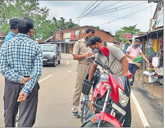
ଅମାନିଆଁଙ୍କୁ କଟକଣା ଆଦାୟ କରାଯାଇଛି।

ଲୋକଙ୍କୁ ସଚେତନ କରିଛନ୍ତି। ଏଥିସହ ପୂର୍ବରୁ ବଜ୍ରପାତ ଗାଡ଼ି ନେଇ ନ ଯାଇ ନିଜ ଅଞ୍ଚଳରେ ଥିବା ପରିବା ବଜାର ସହ ରାଶନ ଦୋକାନକୁ ଚାଲି ଚାଲି ଯାଇ ସାମଗ୍ରୀ କିଣିବାକୁ ନିବେଦନ କରିଛନ୍ତି। ସେହିଭଳି ପ୍ରାନ୍ତ ଗ୍ରାମ ସକାଳ ୫ଟାକୁ ୬ଟା ସମୟ ମଧ୍ୟରେ ସାରିବାକୁ କୁହାଯାଇଛି। ଏଥିରେ ବ୍ୟତିକ୍ରମ ହେଲେ ପ୍ରଶାସନ ବାଧ୍ୟ ହୋଇ କେତେଜଣଙ୍କୁ ଉପଜିଲ୍ଲାପାଳ ଶତପଥୀ କହିଛନ୍ତି, ଅମାନିଆମାନେ କୌଣସି କଟକଣା ମାରିବାହାନ୍ତି। କୋଭିଡ଼ ନିୟମ ପାଳନ କରୁ ନ ଥିବାରୁ ପ୍ରଶାସନ ବାଧ୍ୟ ହୋଇ କେତେଜଣଙ୍କୁ ଶୁକ୍ରବାର ଠାକୁ କାର୍ଯ୍ୟାନୁଷ୍ଠାନ ଗ୍ରହଣ କରାଯିବ ବୋଲି ଉପଜିଲ୍ଲାପାଳ କହିଛନ୍ତି।