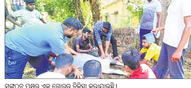
ସଙ୍ଗଠନ ପକ୍ଷରୁ ଏକ ଗୋରୁର ଚିକିତ୍ସା କରାଯାଇଛି।

ଦେଢ଼ାମାଲ ଅଞ୍ଚଳ, ୧୩୫୫ ମଠକରଗୋଳା ଗ୍ରାମର ସ୍ୱେଚ୍ଛାସେବୀ ସଙ୍ଗଠନ ବକରଜଙ୍ଗ କ୍ଲବ୍ ପକ୍ଷରୁ ଗୁରୁବାର ଠାକୁ ଆରମ୍ଭ ହୋଇଛି ଗୋ-ସେବା ଅଭିଯାନ। ଅଞ୍ଚଳର ପଶୁପକ୍ଷୀ ଲାଗି ସଙ୍ଗଠନ ପକ୍ଷରୁ ଲକ୍ଷ୍ମୀନାଥ ସମୟରେ ଖାଦ୍ୟପାନୀୟ ବ୍ୟବସ୍ଥା କରାଯାଇଛି। ସ୍ୱେଚ୍ଛାସେବୀମାନେ ପୂର୍ବରୁ ଗୋରୁ ଚିକିତ୍ସା କରୁଛନ୍ତି।