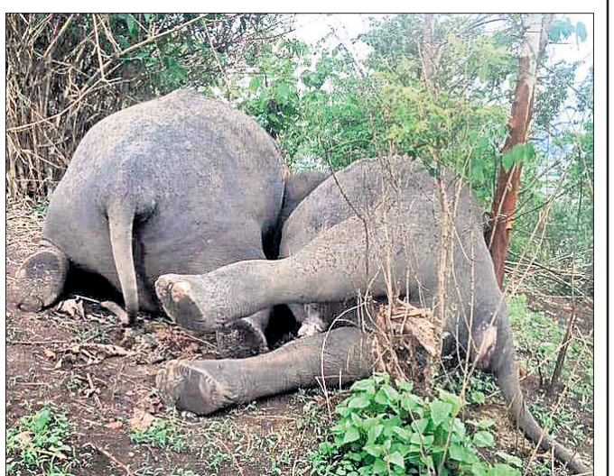
ଆସାମର କୁଣ୍ଡୋଲି ଜଙ୍ଗଲରେ ହାତୀଙ୍କ ମୃତଦେହ ପଡ଼ିଛି।

ଗୁଆହାଟୀ, ୧୩।୫ ଆସାମର ନଗାଓଁ ଜିଲ୍ଲା ପାର୍ବତ୍ୟାଞ୍ଚଳରେ ଯାଇଛି ୧୮ ହାତୀଙ୍କ ଜୀବନ। କୁଣ୍ଡୋଲି ପ୍ରପୋକ୍ତ ଚିକିତ୍ସା ଫରେଷ୍ଟ (ପିଆର୍ଏଫ୍)ରେ କୁଧବାର ରାତିରେ ଘଟିଛି ଏହି ଦୁର୍ଘଟଣା। ଏତେ ସଂଖ୍ୟକ ହାତୀଙ୍କ ମୃତ୍ୟୁର କାରଣ ସ୍ପଷ୍ଟ ହୋଇ ନ ଥିବାବେଳେ ବନ୍ତାଘାତରେ ହାତୀ ପଲର ଜୀବନ ଯାଇଥିବା ବନ ବିଭାଗ ପକ୍ଷରୁ କୁହାଯାଇଛି। ତେବେ ପ୍ରକୃତ କାରଣ ସ୍ପଷ୍ଟ କରିବା ଲାଗି ପୁଞ୍ଜୀବୁଞ୍ଜୀ ଚେତ୍ କରାଯିବ ବୋଲି ଗୁଜୁରାଟ ଜଣେ ବରିଷ୍ଠ ଅଧିକାରୀ ସୂଚନା ଦେଇଛନ୍ତି। କୁଣ୍ଡୋଲି ଜଙ୍ଗଲରେ ହାତୀ ପଲ ବୁଲୁଥିବାବେଳେ କୁଧବାର ରାତିରେ ହଠାତ୍ ବନ୍ତାପାତ ଟେଲିମୁଣ୍ଡା-୪