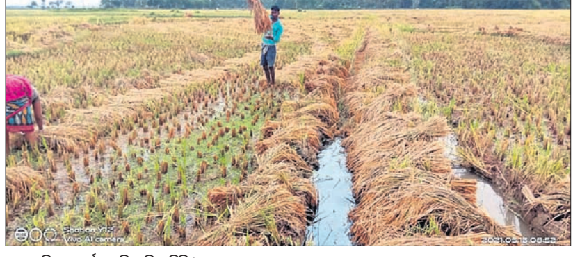
ଧାନଜମିରେ ବର୍ଷା ପାଣି ଜମି ରହିଛି।

ବାଲେଶ୍ଵର ଜିଲ୍ଲା ଅଧୀନ ବାଲିଆପାଳ ଏବଂ ଲଙ୍କାଜେଶ୍ଵର ଅଞ୍ଚଳର ଚାଷୀମାନେ ମୁଖ୍ୟତଃ ଧାନଚାଷ ଉପରେ ନିର୍ଭର କରିଥାନ୍ତି। ଏବେ ଧାନ ଅମଳ ସମୟ ହୋଇଥିବାରୁ ଚାଷୀମାନେ ପ୍ରଭୃତି ଆରମ୍ଭ କରିଛନ୍ତି। ଏହି ଅଞ୍ଚଳର ଚାଷୀମାନେ ଧାନକୁ ଆଠାରୁ ଆରମ୍ଭ କରି ଧାନ ଅମଳ ପର୍ଯ୍ୟନ୍ତ ସମସ୍ତ ଚାଷ କାର୍ଯ୍ୟ ପାଇଁ ପଡ଼ୋଶୀ ମୟୂରଭଞ୍ଜ ଜିଲ୍ଲା ଏବଂ ପଶ୍ଚିମବଙ୍ଗର ଶ୍ରମିକଙ୍କ ଉପରେ ନିର୍ଭର କରିଥାନ୍ତି। ମାତ୍ର ଏବେ ଲଙ୍କାଡ଼ାନ୍ଦ କଟକଣା ଯୋଗୁ ବାହାର ରାଜ୍ୟରୁ ଶ୍ରମିକ