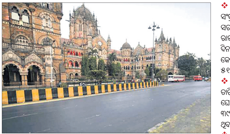
ଲକ୍ଷ୍ମଣାଭ୍ୟାସ ବେଳେ ମୁମ୍ବାଇ ରାସ୍ତା ଜନଶୂନ୍ୟ।

ମୁମ୍ବାଇ/ପାଟନା, ୧୩।୫: ଦେଶରେ କରୋନା ସଂକ୍ରମଣ ଥମ୍ବୁ ନ ଥିବାବେଳେ ମହାରାଷ୍ଟ୍ର ଓ ବିହାରରେ ଲକ୍ଷ୍ମଣାଭ୍ୟାସ ଅବଧି ବଢ଼ାଯାଇଛି। ମହାରାଷ୍ଟ୍ରରେ ଲୁହ ୧୯ ପର୍ଯ୍ୟନ୍ତ ଏହି କଟକଣା ଜାରି ରହିବ ବୋଲି ରାଜ୍ୟ ସରକାର ଘୋଷଣା କରିଥିବାବେଳେ ବିହାର ରାଜ୍ୟରୁ ଆସୁଥିବା ଲୋକେ ଆରୁ-ପିସିଆର୍ ନେଗେଟିଭ୍ ରିପୋର୍ଟ ଦେଖାଇବା ବାଧ୍ୟତାମୂଳକ କରାଯାଇଛି। ପୂର୍ବରୁ ମେ ୧୫ ପର୍ଯ୍ୟନ୍ତ ଲକ୍ଷ୍ମଣାଭ୍ୟାସ ଲାଗୁ ହୋଇଥିଲା। ଗତ ୨୪ ଘଣ୍ଟାରେ ମହାରାଷ୍ଟ୍ରରେ ୪୬,୭୮୧ ନୂଆ ସଂକ୍ରମିତ ଚିହ୍ନ ହୋଇଥିବାବେଳେ ୮୧୬ ଜଣଙ୍କ ମୃତ୍ୟୁ ଘଟିଛି। ସେହିପରି ବିହାର ସରକାର ଲକ୍ଷ୍ମଣାଭ୍ୟାସ ସମୟ ଆଉ ୧୦ ଦିନ ବଢ଼ାଇଛନ୍ତି। ମେ ୧୬ ପରିବର୍ତ୍ତେ ମେ ୨୫ ପର୍ଯ୍ୟନ୍ତ ଏହି କଟକଣା ଜାରି ରହିବ। ଦିନକରେ ବିହାରରେ ୯,୮୬୩ ନୂଆ ମାମଲା ସାମନାକୁ ଆସିଥିବାବେଳେ ୭୪ ଆକ୍ରାନ୍ତଙ୍କ ମୃତ୍ୟୁ ଘଟିଛି। ଏହା ପୂର୍ବରୁ ଅନ୍ୟ ରାଜ୍ୟଗୁଡ଼ିକ ମଧ୍ୟ ସଂକ୍ରମଣ ରୋକିବାକୁ ଲକ୍ଷ୍ମଣାଭ୍ୟାସ, କର୍ଫ୍ୟୁ ଅବଧି ବଢ଼ାଇଛନ୍ତି। ସେନୁକି ହେଲା: ❖ ଦିଲ୍ଲୀ: ଦିଲ୍ଲୀ ସରକାର ପ୍ରଥମେ ଏପ୍ରିଲ ୨୬ରେ ୬ ଦିନିଆ ଲକ୍ଷ୍ମଣାଭ୍ୟାସ ଘୋଷଣା କରିଥିଲେ। ପରେ ତାହାକୁ ମେ ୧୭ ପର୍ଯ୍ୟନ୍ତ ବଢ଼ାଯାଇଛି। ଗତ