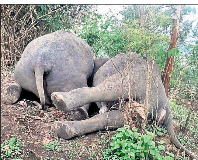
ଆସାମର କୁଣ୍ଡୋଲି ଜଙ୍ଗଲରେ ହାତୀଙ୍କ ମୃତଦେହ ପଡ଼ିଛି।

ଆସାମର ନଗାଓଁ ଜିଲ୍ଲା ପାର୍ବତ୍ୟାଞ୍ଚଳରେ ଯାଇଛି ୧୮ ହାତୀଙ୍କ ଜୀବନ। କୁଣ୍ଡୋଲି ପ୍ରପୋକ୍ତ ଚିରଣ୍ଡ ଫରେଷ୍ଟ (ପିଆର୍ଏଫ୍)ରେ ବୁଧବାର ରାତିରେ ଘଟିଛି ଏହି ଦୁଃଖଦ ଘଟଣା। ଏତେ ସଂଖ୍ୟକ ହାତୀଙ୍କ ମୃତ୍ୟୁର କାରଣ ସ୍ପଷ୍ଟ ହୋଇ ନ ଥିବାବେଳେ ବଜ୍ରପାତରେ ହାତୀ ପଲର ଜୀବନ ଯାଇଥିବା ବନ ବିଭାଗ ପକ୍ଷରୁ କୁହାଯାଇଛି। ତେବେ ପ୍ରକୃତ କାରଣ ସ୍ପଷ୍ଟ କରିବା ଲାଗି ପୁଞ୍ଜୀନୁସୂଚୀ ତଦନ୍ତ କରାଯିବ ବୋଲି ଗୁରୁବାର ଜଣେ ବରିଷ୍ଠ ଅଧିକାରୀ ସୂଚନା ଦେଇଛନ୍ତି। କୁଣ୍ଡୋଲି ଜଙ୍ଗଲରେ ହାତୀ ପଲ ବୁଲୁଥିବାବେଳେ ବୁଧବାର ରାତିରେ ହଠାତ୍ ବଜ୍ରପାତ ହେବାରୁ ୧୮ ହାତୀଙ୍କ ମୃତ୍ୟୁ ହୋଇଥିଲା।