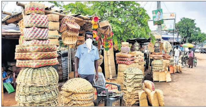
ରାସ୍ତାକଡ଼ରେ ବାଉଁଶ ସାମଗ୍ରୀର ପସରା ।

ରାଜ୍ୟରେ କରୋନା ସଂକ୍ରମଣ ରୋକିବା ଲାଗି ଲକ୍ଷ୍ମଣନାଥ କାରିଗରଙ୍କୁ ଏଥିପାଇଁ ରାସ୍ତାପାର୍ଶ୍ୱ ବାଉଁଶ କାରିଗରଙ୍କ ବେପାର ମାନ୍ୟତା ପଢ଼ିଛି। ବେପାର ହେଉ ନ ଥିବାରୁ ସେମାନଙ୍କ ପକ୍ଷେ ପରିବାର ଚଳାଇବା କଷ୍ଟକର ହେଉଛି। ପୂର୍ବରୁ ଦିନକୁ ୧ ହଜାର ଟଙ୍କା ପର୍ଯ୍ୟନ୍ତ ରୋଜଗାର କରୁଥିବା ବ୍ୟବସାୟୀଙ୍କ ପାଇଁ ଏବେ ୬୦୦ ଟଙ୍କା ହେଉଛି। ଖୋର୍ଦ୍ଧା ନୂଆବସ୍ତାଖଣ୍ଡରେ ରହୁଥିବା ପ୍ରାୟ ୫୦ରୁ ଊର୍ଦ୍ଧ୍ୱ ପରିବାର ଏବେ ଦୁଃଖକଷ୍ଟରେ ଚଳୁଛନ୍ତି। ସେମାନଙ୍କୁ ପରିବାର ଚିନ୍ତା ଘାଟିଛି। ରାତି ପାହିଲେ ରାସ୍ତାକଡ଼ରେ ବାଉଁଶ ନିର୍ମିତ ସାମଗ୍ରୀର ପସରା ମେଲି ସେମାନେ ବସୁଛନ୍ତି ସତ ଯଦିଓ ଗ୍ରାହକଙ୍କ ସେବାନାହିଁ। କାରିଗର ବିକାସ ପାଇଁ କିଛିକିଛି, ଏଠାରେ ଆମେ