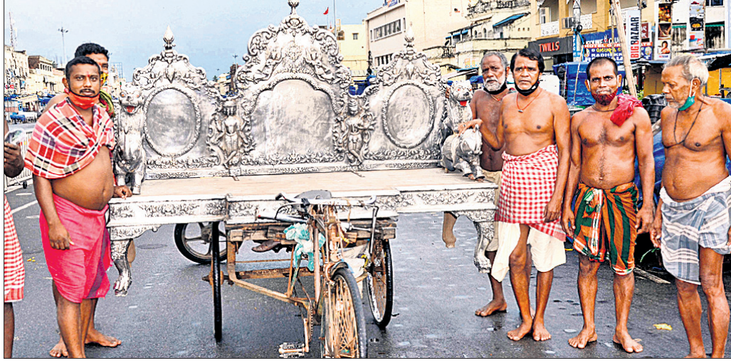
ଆପଣଙ୍କ ଚନ୍ଦନ ମାଗ୍ରା: ଚନ୍ଦନ ଚାପରେ ଲାଗିବା ପାଇଁ ମହାପ୍ରଭୁଙ୍କ ରୂପା ସିଂହାସନକୁ ଗୁରୁବାର ଏକ ଟ୍ରଲିରେ ଚନ୍ଦନ ଚକଟାକୁ ନିଆଯାଇଛି ।