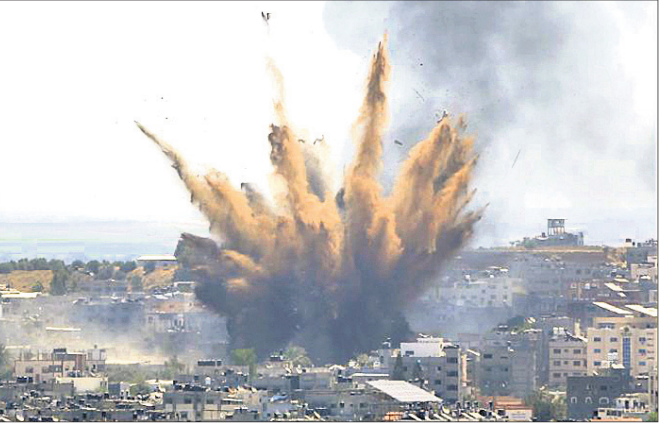
ଗାଜା ସିଟିରୁ ହମାସ ନିୟନ୍ତ୍ରଣାଧୀନ ସ୍ୱାଧିକାରୀମାନଙ୍କୁ ୨୦୦ରୁ ଅଧିକ ଥର ରକେଟ ମାଡ଼ କରାଯାଇଛି।

ଗାଜା ସିଟି, ୧୩।୫ ଇସ୍ରାଏଲ ଓ ହମାସ ଚରମପନ୍ଥାଙ୍କ ମଧ୍ୟରେ ଚାଲିଥିବା ସଂଘର୍ଷ ଉଗ୍ରରୂପ ଧାରଣ କରିଛି। ଇସ୍ରାଏଲ ଆକ୍ରମଣରେ ପାଲେଷ୍ଟାଇନ୍‌ର ୧୭ ଶିଶୁ ଓ ୭ ମହିଳାଙ୍କ ସମେତ ୮୩ ଜଣଙ୍କ ମୃତ୍ୟୁ ଘଟିଲାଣି। ଅନ୍ୟପକ୍ଷରେ ପାଲେଷ୍ଟାଇନ୍ ଆକ୍ରମଣରେ ଇସ୍ରାଏଲର ୬ ଜଣ ନିହତ ହେଲେଣି। ଏଥିସହ ୪୮୭ ଜଣ ଆହତ ହୋଇଥିବା ଗାଜା ସିଟିରୁ ହମାସ ନିୟନ୍ତ୍ରଣାଧୀନ ସ୍ୱାଧିକାରୀମାନଙ୍କୁ ୨୦୦ରୁ ଅଧିକ ଥର ରକେଟ ମାଡ଼ କରାଯାଇଛି। ଅନ୍ୟପକ୍ଷେ ହମାସ ଚରମପନ୍ଥାମାନେ ଇସ୍ରାଏଲକୁ ଗର୍ଭେଷ୍ଟ କରିବା ପାଇଁ ଅନୁରୋଧ କରିଥିଲେ।