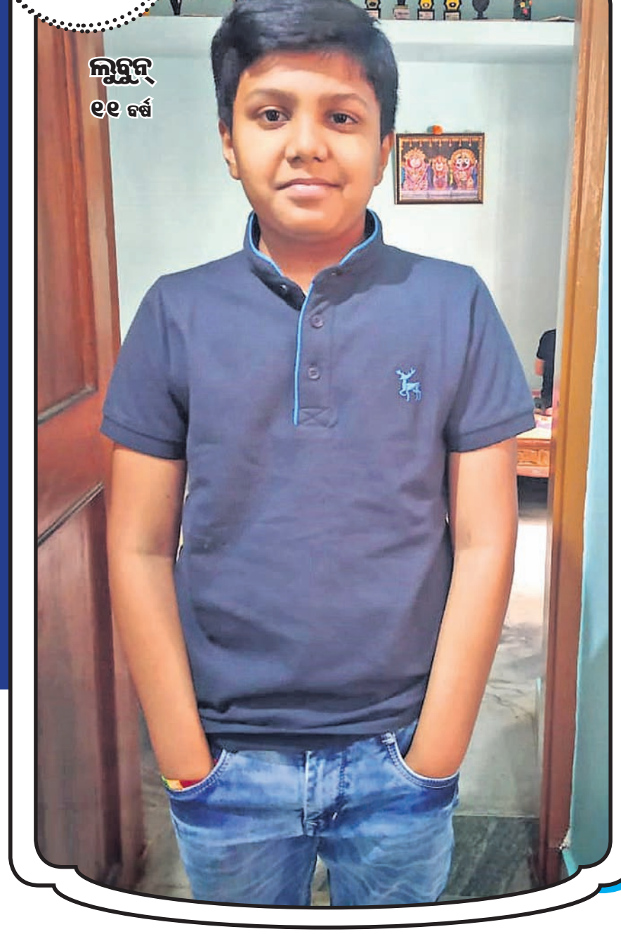
ଲୁହୁନ୍ ୧୧ ବର୍ଷ