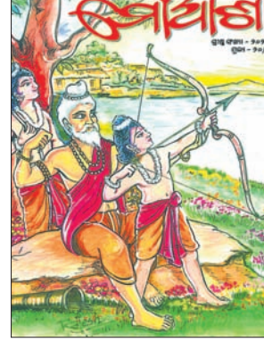
ଷ୍ଟାର ଗ୍ରୁପ୍ ପାଟପୁର, ନିମାପଡ଼ା, ପୁରୀ, ପିନ୍-୭୫୨୧୦୬