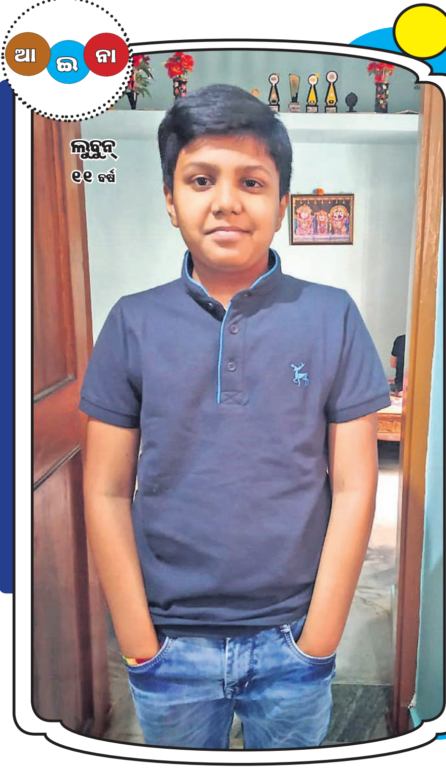
ଆନିରବ ୧୧ ବର୍ଷ