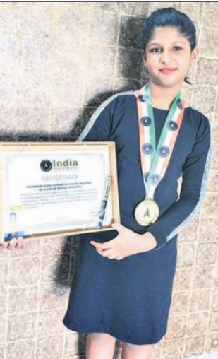
ସର୍ବପିକେଟ୍ ଓ ମୋଡାଲ ସହ ସାଜସଜ୍ଜା