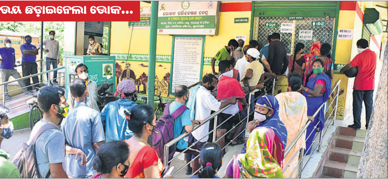
ଲକ୍ଷ୍ମୀପୁର ଯୋଗୁଁ ହୋଟେଲ ବନ୍ଦ ଥିବାରୁ ଭୁବନେଶ୍ୱର କ୍ୟାମ୍ପରେ ହସ୍ପିଟାଲ ପରିସର ଆହାର କେନ୍ଦ୍ରରେ ରୋଗୀଙ୍କ ସମ୍ପର୍କାୟମାନେ ଖାଦ୍ୟ ପାର୍ବଳ ନେବାକୁ ଧାଡ଼ିରେ ଭିଡ଼ ଲାଗିଛନ୍ତି ।