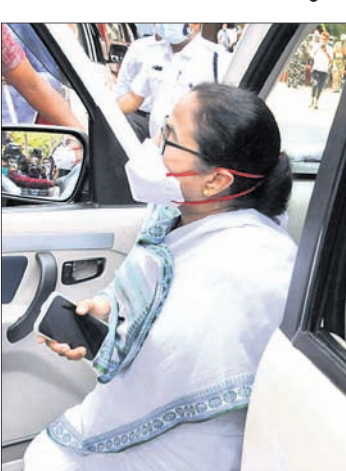
ଅଫିସ୍ ଆଗରେ ମନତାଙ୍କ ଧାରଣା।