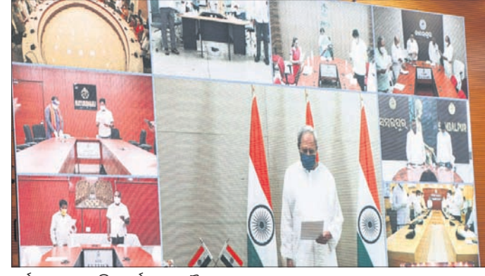
ଭର୍ଚୁଆଲରେ ଅନୁଷ୍ଠିତ ସର୍ବଦଳୀୟ ବୈଠକରେ ମୁଖ୍ୟମନ୍ତ୍ରୀ ନବୀନ ପଟ୍ଟନାୟକ ଓ ଅନ୍ୟମାନେ।

ସେହିପରି ଗୃହ ସଙ୍ଗରୋଧ ତଦାରଖ ଦାୟିତ୍ୱରେ ଥିବା ଆଶାକର୍ମୀମାନଙ୍କୁ ମଧ୍ୟ ସାଲକେଇ, ଚପଲ, ଛତା, ଚର୍ଚି ଓ କପଡ଼ା ଆଦି ପାଇଁ ଏକକାଳୀନ ୧୦ ହଜାର ଟଙ୍କା ସହାୟତା ଦିଆଯିବ ବୋଲି ମୁଖ୍ୟମନ୍ତ୍ରୀ ଘୋଷଣା କରିଛନ୍ତି। ମୁଖ୍ୟମନ୍ତ୍ରୀ କହିଛନ୍ତି, ଗାଁରେ ପରିସ୍ଥିତିକୁ ଦେଖି ସରପଞ୍ଚମାନେ ଲକଡାଉନ ଓ ଅଲ୍ଲୋଡ଼ା ମେଡିକାଲ ସେଣ୍ଟର (ଟିଏମ୍ସି) ଖୋଲିବା ସମ୍ପର୍କରେ ପୃଷ୍ଠା-୪