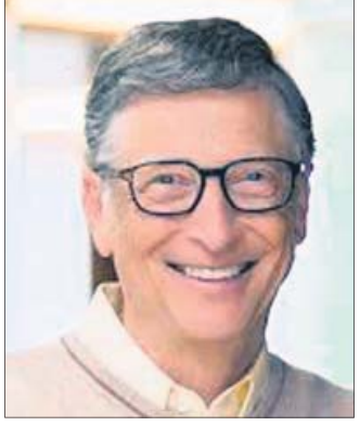
ପରେ କମ୍ପାନୀ ଏହାର ତଦନ୍ତ ଆରମ୍ଭ କରିଥିଲା। ଅଭିଯୋଗ ଅନୁସାରେ, ୨୦୦୦ ମସିହାଠାରୁ ବିଲ୍ ରେଟ୍ ଏହି କର୍ମଚାରୀଙ୍କ ସହ ନିବିଡ ସମ୍ପର୍କରେ ରହିଥିଲେ। ଘଟଣାର ଗୁରୁତ୍ୱକୁ ବିଚାର କରି ବୋର୍ଡର ଏକ କମିଟି ବାହା ଆଇନ ଚାର୍ଜର ସହାୟତା ନେଇଥିଲା। ତଦନ୍ତ ସମୟରେ ଅଭିଯୋଗ ଆଣିଥିବା କର୍ମଚାରୀଙ୍କୁ କମ୍ପାନୀ ସବୁ ପ୍ରକାର

୨ ଦଶନ୍ଧି ପୂର୍ବରୁ ମାଲକୋସ୍‌ସିଏର ଜଣେ ମହିଳା କର୍ମଚାରୀଙ୍କ ସହ ବିଲ୍ ରେଟ୍‌କର ସମ୍ପର୍କ ଥିବା ଅଭିଯୋଗ ଆଧିବା ପରେ ମାଲକୋସ୍‌ସିଏ ଏହାକୁ ନେଇ ତଦନ୍ତ ଆରମ୍ଭ କରିଥିଲା। ଏହା ପରେ ବିଲ୍ ରେଟ୍ କମ୍ପାନୀ ବୋର୍ଡ ଛାଡିଥିବା ଏକ ରିପୋର୍ଟରେ ପ୍ରକାଶ ପାଇଛି। ଏହି ମହିଳାଙ୍କ ସହ ସେ ଏକ ନିର୍ଦ୍ଧାରିତ ସମୟସୀମାରେ ହେବାକୁ ୨୦୨୧ର ବାର୍ଷିକ ବୈଠକ କୋଭିଡ୍ ମହାମାରୀ ଯୋଗୁ ସର୍ବସମ୍ପର୍କକ୍ରମେ ବାତିଲ କରାଯାଇଛି। ଏହି ବୈଠକରେ ସାରା ବିଶ୍ୱରୁ ପ୍ରତିନିଧି ମାନେ ଯୋଗଦେଇ ବିଭିନ୍ନ ବିଷୟ ଓ ଘଟଣା ଉପରେ ଆଲୋଚନା କରିଥାନ୍ତେ ବୋଲି କାର୍ଯ୍ୟକ୍ରମ ରହିଥିଲା। ସେହିପରି ମହାମାରୀ ସମ୍ପର୍କରେ ବିଶେଷ ଆଲୋଚନା ଓ ଚିକା ଓ ପରାକ୍ଷା ସାଙ୍ଗକୁ ସମ୍ପୂର୍ଣ୍ଣ ଦେଶର ବିଭିନ୍ନ ବିଷୟରେ ଚର୍ଚ୍ଚା କରାଯାଇଥାନ୍ତା।