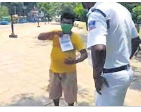
ପାଇଁ ଏକ ପରିଚୟ ପତ୍ର ତିଆରି କରିଛନ୍ତି। ବ୍ୟକ୍ତିଗଣଙ୍କ ଏକ କାଗଜରେ ଲେଖିଛନ୍ତି କି ସେ ମିଠା କିଣିବାକୁ ଯାଉଛନ୍ତି। ଆଉ ସେହି କାଗଜଟିକୁ ସେ ଏକ ସୂତାରେ ବାନ୍ଧି ବେକରେ ଝୁଲାଇ ଦେଇଛନ୍ତି। ତେଣୁ ବାଟରେ ପୋଲିସ୍ ଅଟକାଇବା ସମୟରେ ସେ ତାଙ୍କ ବେକରେ ଝୁଲୁଥିବା ଲେଖା

କୋଲକାତା: ଲକ୍ଷ୍ମୀପୁର ପାଇଁ ବାହାରକୁ ଯିବା ସମୟରେ ପୋଲିସ୍‌ଙ୍କୁ ଅତି ଜରୁରି କାରଣ ଜଣାଇବାକୁ ପଡୁଛି। ଏଥିପାଇଁ ବିଭିନ୍ନ କାମରେ ଯାଉଥିଲେ ଲୋକେ ପରିଚୟ ପତ୍ର ସାଙ୍ଗରେ ନେଇ ଯାଉଛନ୍ତି। ମାତ୍ର କୋଲକାତାରେ ଜଣେ ବ୍ୟକ୍ତି ଏକ ଭିନ୍ନ ଧରଣର ପରିଚୟପତ୍ର ତିଆରି କରି ଏବେ ସୋସିଆଲ ମିଡିଆରେ ଚର୍ଚ୍ଚିତ ହୋଇଛନ୍ତି। କୋଲକାତାର ଜଣେ ବ୍ୟକ୍ତି ମିଠା କିଣିବା ପାଇଁ ବଜାରକୁ ଯାଉଥିବାବେଳେ ଏକ ଭିଡିଓ ଏବେ ସୋସିଆଲ ମିଡିଆରେ ଭାଇରାଲ ହେବାରେ ଲାଗିଛି। ଭାଇରାଲ ଭିଡିଓରେ ଜଣେ ବ୍ୟକ୍ତି ମିଠା କିଣିବା ପାଇଁ ବଜାରକୁ ଯାଉଛନ୍ତି। କିନ୍ତୁ କୋଲକାତାରେ ଏବେ ଲକ୍ଷ୍ମୀପୁର ଚାଲିଥିବା ବିଭିନ୍ନ ଗ୍ଲାନରେ ପୋଲିସ୍ ଲୋକଙ୍କୁ ଯାଞ୍ଚ କରୁଛି। ଅନାବଶ୍ୟକଭାବେ ଘରୁ ବାହାରକୁ ବାହାରୁଥିବା ଲୋକଙ୍କୁ ଦୃଢ ଭାବରେ ଚାଲି ପଡୁଛି। ଏହି କାରଣରୁ ବ୍ୟକ୍ତିଗଣଙ୍କ ବଜାରକୁ ମିଠା କିଣିବାକୁ ଯାଉଛନ୍ତି ବୋଲି ନିଜ