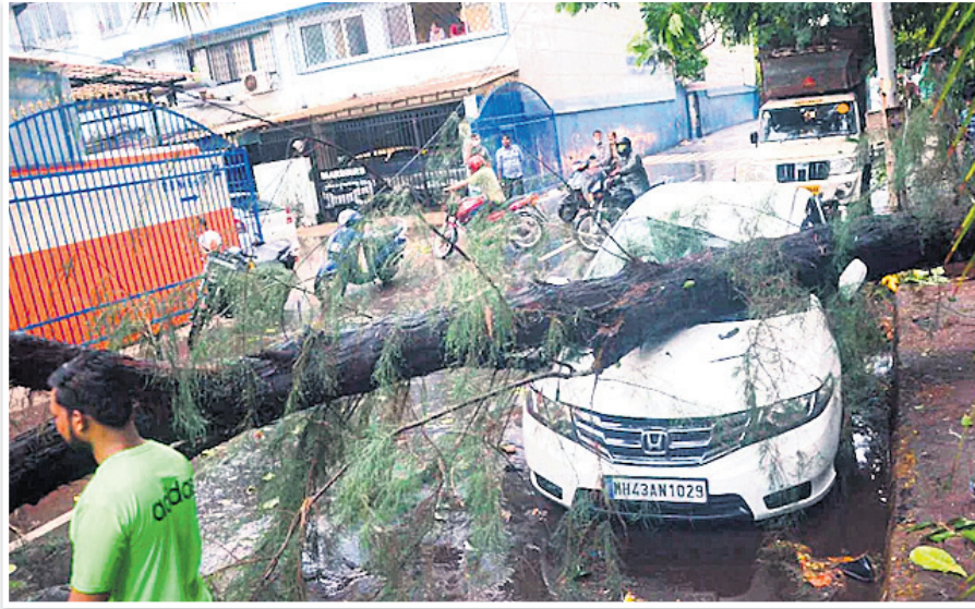
ମହାରାଷ୍ଟ୍ରର କଳଶରେ କାର ଉପରେ ଗଛ ଭାଙ୍ଗିପଡ଼ିଛି।