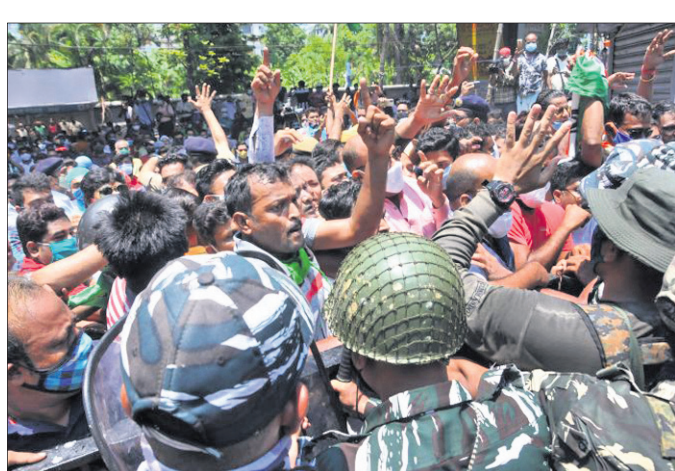
କୋଲକାତା ସିବିଆଇ ଅଫିସ୍ ସମ୍ମୁଖରେ ଟିଏମ୍‌ସି କର୍ମୀ-ସହାନ ମୁହାଁମୁହିଁ।

ପ୍ରତିବାଦରେ ଧାରଣାରେ ବସିଥିଲେ। କୋଲକାତା ହାଇକୋର୍ଟ ଷ୍ଟିଲ୍ ଅପରେଶନ ଲାଞ୍ଚ ମାମଲାର ତଦନ୍ତ ସିବିଆଇକୁ ଦେଇଥିଲେ।