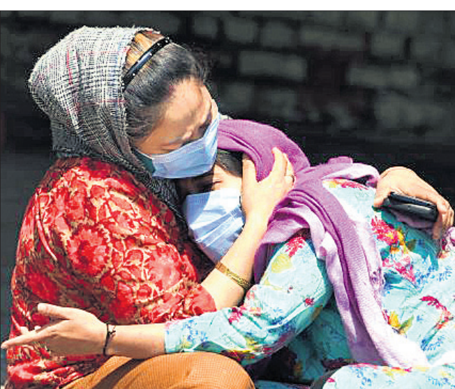
ଶ୍ରୀନଗରରେ ଜଣେ ସମ୍ପର୍କୀୟଙ୍କ ମୃତ୍ୟୁରେ କ୍ରନ୍ଦନରେ ପରିବାର ସଦସ୍ୟ।

ନୂଆଦିଲ୍ଲୀ, ୧୭।୫: ଭାରତରେ ଦୈନିକ ସଂକ୍ରମଣରେ ସାମାନ୍ୟ ହ୍ରାସ ପାଇଥିଲେ ହେଁ ମୃତ୍ୟୁସଂଖ୍ୟା ପୁଣି ୪ ହଜାର ଚଢ଼ିଛି।