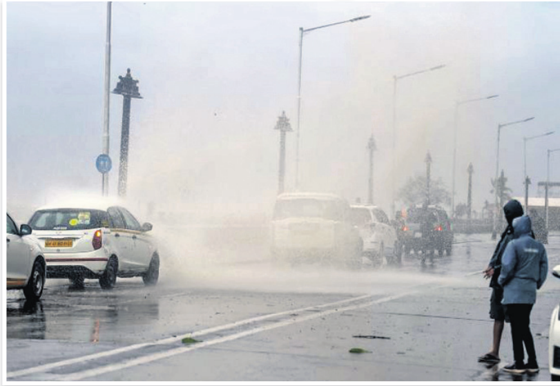
ପୁରୀର ରେଭୁ ଅଫ ଇଣ୍ଡିଆ ନିକଟରେ ଝଡ଼ର ଭୟଙ୍କର ରୂପ।