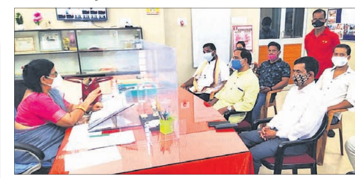
ଭାଜପା କାର୍ଯ୍ୟକର୍ତ୍ତାମାନେ ସିଡିଏମ୍‌ସି ସହିତ ଆଲୋଚନା କରୁଛନ୍ତି।