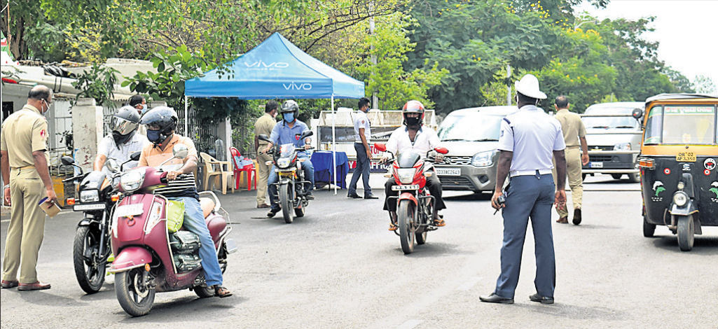
ସୋମବାର ରାଜ୍ୟରେ ଲକ୍ଷ୍ୟ ରଖି ଅବଧିକୁ ୧୫୦୦ ବୃଦ୍ଧି କରାଯାଇଥିବା ବେଳେ ଭୁବନେଶ୍ୱର ଏକ ଛକରେ ପୋଲିସ୍ ପକ୍ଷରୁ ଯାଞ୍ଚ କରାଯାଇଛି।