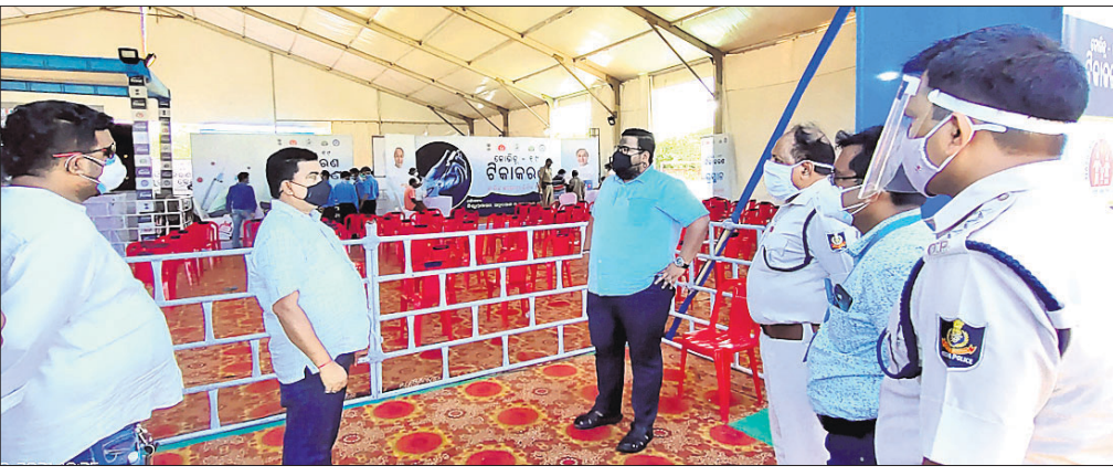
ଷ୍ଟାଡ଼ିୟମରେ ଚିକାକରଣ କାର୍ଯ୍ୟ ଅନୁଧ୍ୟାନ କରୁଛନ୍ତି ଜିଲ୍ଲାପାଳ, ଉପଜିଲ୍ଲାପାଳ ଓ ଅନ୍ୟ ଅଧିକାରୀମାନେ।

ପରିସରରେ ଏକ ସେଲ୍‌ଫି ପଏଣ୍ଟ ନିର୍ମାଣ କରାଯାଇଛି। ଚିକା ନେଉଥିବା ବ୍ୟକ୍ତି ଏହି ସେଲ୍‌ଫି ପଏଣ୍ଟରେ ପତ୍ତା ଉଠାଇ ଲୋକଙ୍କ ମନ ଛୁଇଁଥିବାବେଳେ ଷ୍ଟାଡ଼ିୟମ