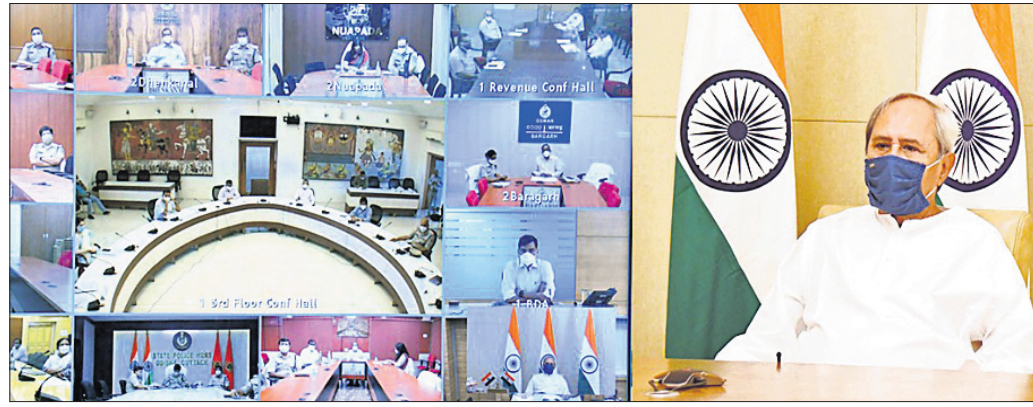
ସମୀକ୍ଷା ଟିଏସିରେ ପୁଖ୍ୟମନ୍ତ୍ରୀ ନବୀନ ପଟ୍ଟନାୟକ ଓ ଅଧିକାରୀମାନେ।

ରାଜ୍ୟର କୋଭିଡ୍ ସ୍ଥିତି ସମ୍ପର୍କରେ ପୁଖ୍ୟମନ୍ତ୍ରୀ ନବୀନ ପଟ୍ଟନାୟକ ମଙ୍ଗଳବାର ସଂଖ୍ୟାରେ ସମୀକ୍ଷା କରିଛନ୍ତି। ଏହି ଅବସରରେ ପୁଖ୍ୟମନ୍ତ୍ରୀ ସୋମବାର ସର୍ବଦଳାୟ ଟିଏସିରେ ଯୋଗଦାନ କରିଥିବା କାର୍ଯ୍ୟକ୍ରମର ସଫଳ କାର୍ଯ୍ୟକାରୀତା ସହିତ ରୋଗୀଙ୍କ ଅବସ୍ଥା ସମ୍ପର୍କରେ ସମୀକ୍ଷା କରି ଓଡ଼ିଶା ସରକାରଙ୍କୁ ନିର୍ଦ୍ଦେଶ ଦେଇଛନ୍ତି। ଏଥିରେ ପଞ୍ଚାୟତ ସମାପ୍ତି ଉପରେ ମଧ୍ୟ ଗୁରୁତ୍ୱ ଦିଆଯାଇଛି। ରାଜ୍ୟରେ କୋଭିଡ୍ ସ୍ଥିତି ଏବେ ନିୟନ୍ତ୍ରଣାଧୀନ ଅଛି। ପୁଣ୍ୟ ପୁଣ୍ୟ ରୋଗୀଙ୍କ ସଂଖ୍ୟା ନୂଆ ଚିହ୍ନଟ ହେଉଥିବା ରୋଗୀଙ୍କଠାରୁ ଅଧିକ ହେବ, ତାକୁ ଆଖି ଆଗରେ ରଖି ଯୋଜନା ସଂକ୍ରମଣ କରିବା ପାଇଁ ଲୋକପାଳନକୁ ନିର୍ଦ୍ଦେଶ ଦେଇଛନ୍ତି। ଏଥିରେ ପଞ୍ଚାୟତ ଓ ଗାଁ କଲ୍ୟାଣ ସମିତିମାନଙ୍କୁ ସକ୍ରିୟ ଭାବେ ସାମିଲ କରିବାକୁ ପୁଖ୍ୟମନ୍ତ୍ରୀ ହାରକୁ ସମ୍ପୂର୍ଣ୍ଣ କମାଇବା ପାଇଁ ରାଜ୍ୟ ସରକାର ଲକ୍ଷ୍ୟ ରଖି ଅବଧିକୁ ଆଉ ୨ ସପ୍ତାହ ବୃଦ୍ଧି କରିଛନ୍ତି। ଆମେ ଯଦି ସମସ୍ତେ କୋଭିଡ୍ ନିୟମ ମାନି ମାସ ପିନ୍ଧିବା, ବାରମ୍ବାର ସାବୁନରେ ହାତ ଧୋଇବା, ସାମାଜିକ ଦୂରତା ରକ୍ଷା କରିବା ଏବଂ ଅନାବଶ୍ୟକ ଭାବରେ ବାହାରେ ବୁଲିବା ବନ୍ଦ କରିଦେବା, ତେବେ ଆମେ ନିଶ୍ଚୟ ଏହି ଲକ୍ଷ୍ୟ ଲାଭ କରିପାରିବା। ସର୍ବଦଳାୟ ଟିଏସିରେ ଯୋଗଦାନ କରିବା ପାଇଁ ପୁଖ୍ୟମନ୍ତ୍ରୀ ବିଭିନ୍ନ ପଦକ୍ଷେପ ସମ୍ପର୍କରେ ଉଲ୍ଲେଖ କରି ପୁଖ୍ୟମନ୍ତ୍ରୀ କହିଛନ୍ତି, କୋଭିଡ୍ ଯୋଗୁ ଅନେକ ପରିବାର ଛାଡ଼ିଯାଇଛି। ତେଣୁ କୋଭିଡ୍ ମୃତକଙ୍କ ବିଧବା ଏବଂ ମା’ବାପାଙ୍କୁ ହରାଇଥିବା ପିଲାମାନେ ଯେପରି ଭୁବନେଶ୍ୱର ସହାୟତା ପାଇପାରିବେ, ସେଥିପାଇଁ ପଦକ୍ଷେପ