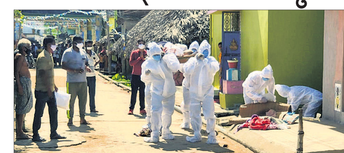
ପୁରୁଣୁଙ୍କ ମୃତଦେହ ଶୁଶ୍ରୁଷା ନିଆଯାଇଛି।