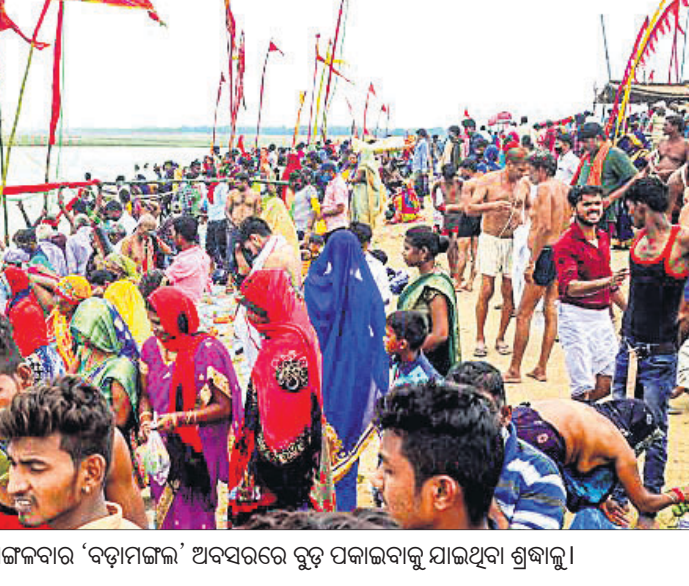
ଉତ୍ତରପ୍ରଦେଶର ପ୍ରୟାଗରାଜସ୍ଥିତ ସଙ୍ଗମରେ ମଙ୍ଗଳବାର 'ବଡ଼ାମଙ୍ଗଳ' ଅବସରରେ ବହୁ ପକାଇବାକୁ ଯାଇଥିବା ଶୁଖାଳୁ।