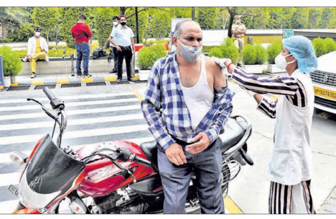
ନୂଆଦିଲ୍ଲୀର ନୋଏଡାରେ ମଙ୍ଗଳବାର ଡ୍ରାଇଭ୍ ଇନ୍ ଭାଙ୍ଗିଦେଇଥିବା ବେଳେ ଜଣେ ବ୍ୟକ୍ତିଙ୍କୁ କୋଭିଡ୍ ଟିକା ଦିଆଯାଇଛି।

ଆଇଲା ମାଳି, ମାଲିଆ ଚାଳି ଧରି ପକାଇଲା ଖେତୁଡ଼ି ଆଳି କେତେକଣ ବ୍ୟକ୍ତି ଅତ୍ୟନ୍ତ ଧୂଳି ପ୍ରକୃତିର ହୋଇଥାନ୍ତି। ଆଖିରେ ଆଲୁମିନିୟମ ଗୋଟି ସବୁଜିଲି ଏପରି ଆତ୍ମସାତ କରିନଥାନ୍ତି ଯେ ତା'ର ଚେର ବି କେହି ପାଇ ପାରି ନଥାନ୍ତି। ଅନ୍ୟକୁ ବୋକା ବା ଭକ୍ତୁଆ ବନେଇ ସାର ପଦାର୍ଥ ଧରି ଚମ୍ପଟ ମାଲୁଥିବା ବ୍ୟକ୍ତିଙ୍କ ପ୍ରତି ଏଭଳି ଭକ୍ତି ଉଲ୍ଲେଖ କରାଯାଇଛି।