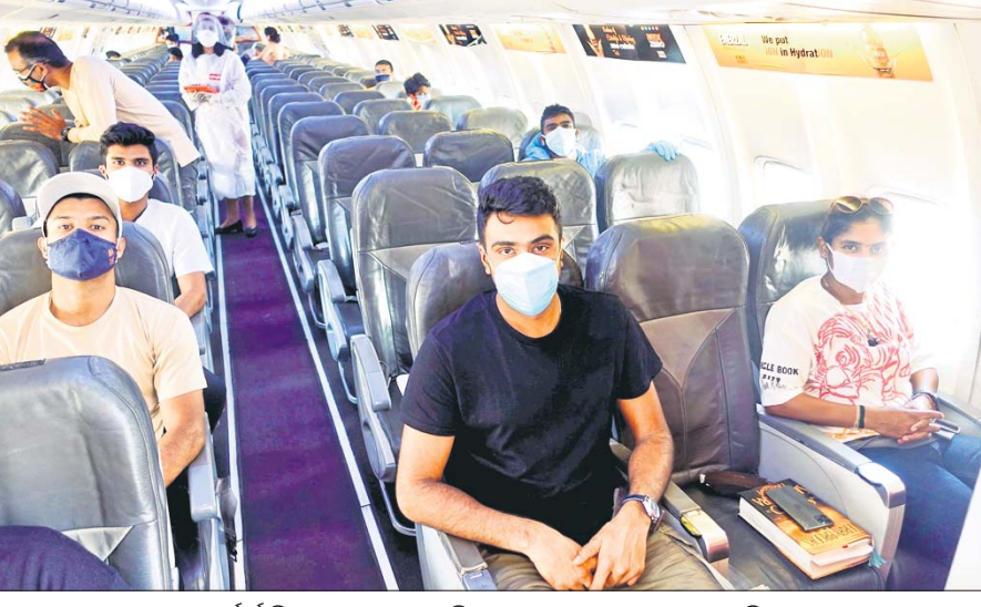
ସ୍ୱଚ୍ଛ ଗର୍ଗଟ ବିନା ନେଇ ପୂର୍ଣ୍ଣ ଆସିବା ଅବସରରେ ଭାରତୀୟ ଖେଳାଳିମାନେ।

ଜୁନ୍ ୧୮ରୁ ୨୨ ତାରିଖ ମଧ୍ୟରେ ଇଂଲଣ୍ଡର ସାଉଥାମ୍ପଟନଠାରେ ଆୟୋଜନ ହେବାକୁ ଯାଉଛି ବିଶ୍ୱ ଚେଷ୍ଟ ଚାମ୍ପିୟନଶିପ୍ ପ୍ରଥମ ସଂସ୍କରଣର ଫାଇନାଲ ମ୍ୟାଚ। ଏହି ହାଇପ୍ରୋଫାଇଲ ମ୍ୟାଚ୍‌ରେ ଭାରତ ଓ ନ୍ୟୁଜିଲାଣ୍ଡ ପରସ୍ପରକୁ ଭେଟିବେ। ଏବେଠାରୁ ଏହି ମ୍ୟାଚ୍ ନେଇ ପ୍ରଶଂସକଙ୍କ ମଧ୍ୟରେ ଉତ୍ତୁକତା ଦେଖାଦେଇଛି। ଚେଷ୍ଟ ଯଦି ଏହି ନିର୍ଣ୍ଣାୟକ ଚେଷ୍ଟ ମ୍ୟାଚ୍ ଡ୍ର, ଟାଇ କିମ୍ବା ଖିଆଉଟ ହୁଏ ତେବେ ଫାଇନାଲ କ'ଣ ହେବ ଓ କେଉଁ ଦଳକୁ ଚାମ୍ପିୟନ ଘୋଷିତ କରାଯିବ ସେ ନେଇ ପ୍ରଶ୍ନବାଚୀ ସୃଷ୍ଟି ହୋଇଛି। ପୂର୍ବ ମ୍ୟାଚ୍‌ରେ ଚେଷ୍ଟ କଣ୍ଡିଶନ ଅର୍ଥାତ୍ ମ୍ୟାଚ୍ ସହିତ ଜଡ଼ିତ ପରିସ୍ଥିତି ସମ୍ପର୍କିତ ନିୟମ ଓ ସର୍ତ୍ତ ନେଇ ଅଭିଜ୍ଞତା ଲାଭ କରିବାକୁ ଆଗାମୀ କିଛିଦିନରେ ଆଇସିସି ଚେଷ୍ଟ କଣ୍ଡିଶନ ନେଇ ବିବରଣୀ ପ୍ରଦାନ କରିବ ବୋଲି ଆଶା କରାଯାଉଛି। ଏହା ଏକ ଦ୍ୱିପାକ୍ଷିକ ସିରିଜର ଚେଷ୍ଟ ମ୍ୟାଚ୍ ନୁହେଁ। ଏହା ଏକ ନିର୍ଣ୍ଣାୟକ ଫାଇନାଲ ମ୍ୟାଚ୍। ଚେଷ୍ଟ ଚେଷ୍ଟ କଣ୍ଡିଶନ ନେଇ ଆମେ ଶାନ୍ତିବାକୁ ଚାହୁଁଛୁ ବୋଲି ଭାରତୀୟ କ୍ରିକେଟ କଣ୍ଡିଶନ ବୋର୍ଡ (ବିସିଆଇ) ଜଣେ ବରିଷ୍ଠ ଅଧିକାରୀ କହିଛନ୍ତି। ଯଦି ଏହି ମ୍ୟାଚ୍ ଡ୍ର, ଟାଇ କିମ୍ବା ଖିଆଉଟ ହେବ ତେବେ ଆୟୋଜନ ହେବାକୁ ଥିବା ୨୦୨୩ ଏସିଆନ୍ କପ୍ ପାଇଁ ବାଧ୍ୟତା ସୃଷ୍ଟି ହେବ। ଆଗାମୀ କିଛିଦିନରେ ଆଇସିସି ଚେଷ୍ଟ କଣ୍ଡିଶନ ନେଇ ବିବରଣୀ ପ୍ରଦାନ କରିବ ବୋଲି ଆଶା କରାଯାଉଛି। ଏହା ଏକ ନିର୍ଣ୍ଣାୟକ ଫାଇନାଲ ମ୍ୟାଚ୍। ଚେଷ୍ଟ ଚେଷ୍ଟ କଣ୍ଡିଶନ ନେଇ ଆମେ ଶାନ୍ତିବାକୁ ଚାହୁଁଛୁ ବୋଲି ଭାରତୀୟ କ୍ରିକେଟ କଣ୍ଡିଶନ ବୋର୍ଡ (ବିସିଆଇ) ଜଣେ ବରିଷ୍ଠ ଅଧିକାରୀ କହିଛନ୍ତି। ଯଦି ଏହି ମ୍ୟାଚ୍ ଡ୍ର, ଟାଇ କିମ୍ବା ଖିଆଉଟ ହେବ ତେବେ ଆୟୋଜନ ହେବାକୁ ଥିବା ୨୦୨୩ ଏସିଆନ୍ କପ୍ ପାଇଁ ବାଧ୍ୟତା ସୃଷ୍ଟି ହେବ।