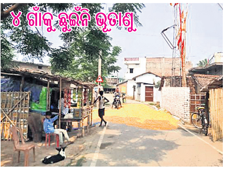
୪ ଗାଁକୁ ଛୁଇଁବି ଭୃତାଣୁ

ପାଟଣା: କଠୋର ଅନୁଶୀଳନ, କଡ଼ା ନିୟମ, ଆବଶ୍ୟକ ସତର୍କତାମୂଳକ ପଦକ୍ଷେପ ପାଇଁ ବିହାରର ଖଗଡ଼ିଆ ସମେତ ୪ ଗ୍ରାମକୁ ଛୁଇଁପାରିବି କରୋନା । କୋଭିଡ଼-୧୯ର ପ୍ରଥମ ଲହରକୁ ସଫଳ ମୁକାବିଲା କରିଥିବା ଏହି ଗାଁ ଦ୍ୱିତୀୟ ଲହର ସମୟରେ ମଧ୍ୟ ନିଜକୁ ସୁରକ୍ଷିତ ରଖିପାରିଛି । କରୋନା ପାଇଁ ଦେଶର ପ୍ରାୟ ସବୁଘାଟଣା କଟକଣା କାରି କରାଯାଇଥିବାବେଳେ ଖଗଡ଼ିଆ, ଗଡ଼ିଆ, ପାହାଡ଼କ ଏବଂ ଫରେହି ଗ୍ରାମବାସୀ ସ୍ୱାଭାବିକ ଜୀବନ ଚଳାଇଛନ୍ତି । ଭୃତାଣୁ କଟକଣା ଜୀବନ ବଞ୍ଚାଇବା ଲାଗି ଦୀର୍ଘ ଦେହବର୍ଷ ହେଲା ଅଞ୍ଚଳବାସୀ ଲାଗୁ କରିଛନ୍ତି କଡ଼ା ନିୟମ, ଯାହାକୁ ମାନିବାକୁ ସମସ୍ତେ ବାଧ୍ୟ । ବହିରାଗତକ ପାଇଁ ଗ୍ରାମ ମୁଖରେ ରହିଛି କ୍ୱାରାଣ୍ଟାଇନ୍ ସେଣ୍ଟର । କୌଣସି ପ୍ରବାସୀ ଘରେ ପ୍ରବେଶ କରିବା ପୂର୍ବରୁ ଏକରୁ ଦୁଇ ସପ୍ତାହ ସେଠାରେ ରହିବାକୁ ବାଧ୍ୟ । ଏହାକୁ ବାଦ୍ ଦେଲେ ସମ୍ପୂର୍ଣ୍ଣ ଅଞ୍ଚଳବାସୀ ତିନିକରଣ କାର୍ଯ୍ୟକ୍ରମକୁ ସଫଳ କରିବାରେ ଲାଗିପଡ଼ିଛନ୍ତି । ଅଧିକାଂଶ ବୟସ୍କ