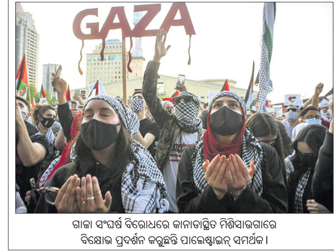
ଗାଜା ସଂଘର୍ଷ ବିରୋଧରେ କାନାଡାସ୍ଥିତ ମିଶିଗାଉଗାରେ ବିକ୍ଷୋଭ ପ୍ରଦର୍ଶନ କରୁଛନ୍ତି ପାଲେଷ୍ଟାଇନ୍ ସମର୍ଥକ।