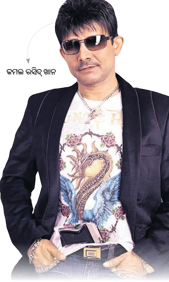
କମଳ ରସିଦ୍ ଖାନ

ମୁଁଙ୍କର ଦେଶରେ କରୋନାରେ ଘାତକ ଦ୍ୱିତୀୟ ଲହର କାରି ଥିବାବେଳେ ଦିଲ୍ଲିର ଅନେକ ତାରକା ସହଯୋଗୀ ହାତ ବଢ଼ାଇବା ସହ କେତେଜଣ ପାଣି ଚୁଲ ବା ଫୁଟ ରେଳ ପ୍ରୋଗ୍ରାମ ମଧ୍ୟ ଆରମ୍ଭ କରିଛନ୍ତି । ଏହି ଫୁଟ ରେଳ କାର୍ଯ୍ୟକ୍ରମକୁ ନେଇ ଦିଲ୍ଲିର ଅଭିନେତା ତଥା ଫିଲ୍ମ ନିର୍ମାତା କମଳ ରସିଦ୍ ଖାନ (କେଆର୍.ସି.) ସେଲିବ୍ରିଟିଙ୍କୁ ସମାଲୋଚନା କରିଛନ୍ତି । ଏପରିକି ସେ ତାଙ୍କ ବୁଦ୍ଧିରେ ଭାରତୀୟ