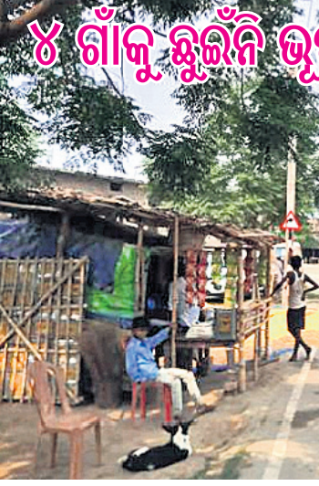
ବିକାର ଦୁଇ ଡୋକ୍ ନେଇପାରିଲେଣି । କହିବାକୁ ଗଲେ, ବରିଷ୍ଠମାନଙ୍କ ପରାମର୍ଶ ଏବଂ ଯୁବବର୍ଗଙ୍କ କୋଭିଡ୍-୧୯ ପ୍ରତି ସତର୍କତା ହିଁ ଏହିସବୁ ଗ୍ରାମକୁ କରୋନା କଟକଣା ପୁରୁଷିତ ରଖିପାରିଛି । ଗୟା ଜିଲ୍ଲାରେ ଅବସ୍ଥିତ ଗଡ଼ିଆ,

ପାଟଣା: କଠୋର ଅନୁଶୀଳନ, କଡ଼ା ନିୟମ, ଆବଶ୍ୟକ ସତର୍କତାମୂଳକ ପଦକ୍ଷେପ ପାଇଁ ବିହାରର ଖରଟୁଆ ସମେତ ୪ ଗ୍ରାମକୁ ଛୁଇଁପାରିବି କରୋନା । କୋଭିଡ୍-୧୯ର ପ୍ରଥମ ଲହରକୁ ସଫଳ ମୁକାବିଲା କରିଥିବା ଏହି ଗାଁ ଦ୍ୱିତୀୟ ଲହର ସମୟରେ ମଧ୍ୟ ନିଜକୁ ସୁରକ୍ଷିତ ରଖିପାରିଛି । କରୋନା ପାଇଁ ଦେଶର ପ୍ରାୟ ସବୁସ୍ଥାନରେ କଟକଣା କରି କରାଯାଇଥିବାବେଳେ ଖରଟୁଆ, ଗଡ଼ିଆ, ପାହାଡ଼କ ଏବଂ ଫରେହି ଗ୍ରାମବାସୀ ସ୍ୱାଭାବିକ ଜୀବନ ଜିଉଛନ୍ତି । ଭୃତାଣୁ କଟକଣା ଜୀବନ ବଞ୍ଚାଇବା ଲାଗି ଦାରି ଦେବଦର୍ଶ ହେଲା ଅଜ୍ଞାନବାସୀ ଲାଗୁ କରିଛନ୍ତି କଡ଼ା ନିୟମ, ଯାହାକୁ ମାନିବାକୁ ସମସ୍ତେ ବାଧ୍ୟ । ବହୁରାଗତକ ପାଇଁ ଗ୍ରାମ ମୁଖରେ ରହିଛି କ୍ୱାରେଣ୍ଟାଇନ୍ ସେଣ୍ଟର । କୌଣସି ପ୍ରବାସୀ ଘରେ ପ୍ରବେଶ କରିବା ପୂର୍ବରୁ ଏକରୁ ଦୁଇ ସପ୍ତାହ ସେଠାରେ ରହିବାକୁ ବାଧ୍ୟ । ଏହାକୁ ବାଦ୍ ଦେଲେ ସମ୍ପୂର୍ଣ୍ଣ ଅଜ୍ଞାନବାସୀ ବିନାକରଣ କାର୍ଯ୍ୟକ୍ରମକୁ ସଫଳ କରିବାରେ ଲାଗିପଡ଼ିଛି । ଅଧିକାଂଶ ବୟସ୍କ