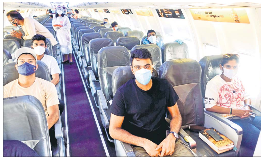
ସ୍ୱଚ୍ଛ ଗାର୍ଟି ବିନାମରେ ମୁଖ୍ୟ ଆସିବା ଅବସରରେ ଭାରତୀୟ ଖେଳାଳିମାନେ।

ଜୁନ୍ ୧୮ରୁ ୨୨ ତାରିଖ ମଧ୍ୟରେ ଭାରତୀୟ ସ୍ୱାଧୀନାଧିକାରୀ ଆୟୋଜନ ହେବାରୁ ଯାହା ବିଶ୍ୱ ଚେଷ୍ଟା ଚାମୁଣ୍ଡୀପୂର୍ବ ପ୍ରଥମ ସଂଘରଣର ଫାଇନାଲ ମ୍ୟାଚ୍। ଏହି ହାଇପୋଥାଇଲ ମ୍ୟାଚ୍ରେ ଭାରତ ଓ ୟୁନାଇଟେଡ ପ୍ରଥମରୁ ଭେଟିବେ। ଏବେଠାରୁ ଏହି ମ୍ୟାଚ୍ ନେଇ ପ୍ରଶଂସକଙ୍କ ମଧ୍ୟରେ ଉତ୍ସାହ ଦେଖାଦେଇଛି। ଚେଷ୍ଟା ସହ ଏହି ନିର୍ଣ୍ଣାୟକ ଚେଷ୍ଟା ମ୍ୟାଚ୍ ତ୍ର, ଚାଲି କିମ୍ପା ଖଣ୍ଡିଆଡ଼େ ହୁଏ ଚେଷ୍ଟା ଫାଇନାଲ କ'ଣ ହେବ ଓ କେଉଁ ଦଳକୁ ଚାମୁଣ୍ଡୀ ଯୋଜିତ କରାଯିବ ସେ ନେଇ ପ୍ରଶ୍ନାତ୍ମକ ସୂଚି ହୋଇଛି। ପୂର୍ବ ମ୍ୟାଚ୍ରେ ଯୁଇଲ୍ କଞ୍ଚିକନ ଅର୍ଥାତ୍ ମ୍ୟାଚ୍ ସହିତ ଜିତି ପରିସ୍ଥିତି ସମ୍ପର୍କିତ ନିର୍ଣ୍ଣୟ ଓ ସର୍ତ୍ତ ନେଇ ଅଭିକାତୀୟ କ୍ରିକେଟ କାଉନ୍ସିଲ (ଆଇସିସି) କି ନିଷ୍ପତ୍ତି ନେଉଛି ସେ ନେଇ ଭାରତ ଉତ୍ସାହୀ ସହ ଅପେକ୍ଷା କରିଛି। ଆଗାମୀ ଜିତିବିଜିତର ଆଇସିସି ଯୁଇଲ୍ କଞ୍ଚିକନ ନେଇ ବିବରଣୀ ପ୍ରଦାନ କରିବ ବୋଲି ଆଶା କରାଯାଇଛି। ଏହା ଏକ ଦ୍ୱିପକ୍ଷିକ ସିଦ୍ଧି ଚେଷ୍ଟା ମ୍ୟାଚ୍ ରୁହେଁ। ଏହା ଏକ ନିର୍ଣ୍ଣାୟକ ଫାଇନାଲ ମ୍ୟାଚ୍। ଚେଷ୍ଟା ଯୁଇଲ୍ କଞ୍ଚିକନ ନେଇ ଆମେ କାହିଁକି ଚାହୁଁଛୁ ବୋଲି ଭାରତୀୟ କ୍ରିକେଟ କଞ୍ଚିକନ ବୋର୍ଡ (ବିସିଆଇ) ଜଣେ ବରିଷ୍ଠ ଅଧିକାରୀ କହିଛନ୍ତି। ଯଦି ଏହି ମ୍ୟାଚ୍ ତ୍ର, ଚାଲି କିମ୍ପା ଖଣ୍ଡିଆଡ଼େ