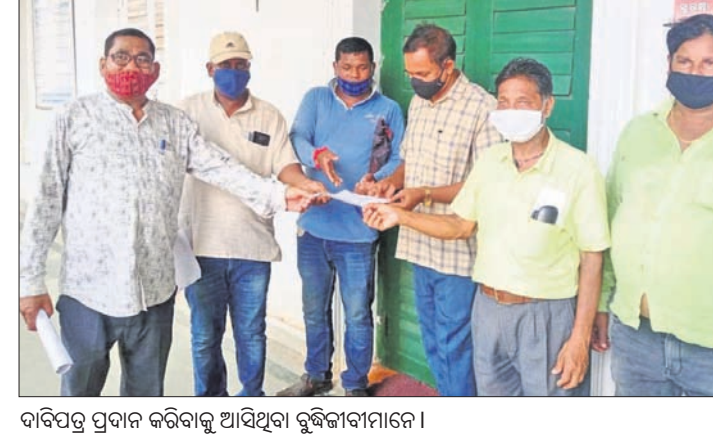
ଦାବିପତ୍ର ପ୍ରଦାନ କରିବାକୁ ଆସିଥିବା ବୁଦ୍ଧିଜୀବୀମାନେ।

କୋଭିଡ୍ ମହାମାରୀ ସମୟରେ ସହରାଞ୍ଚଳର ପରିମଳ ବ୍ୟବସ୍ଥା ସଜାଡ଼ିବା ଉପରେ ସରକାର ଗୁରୁତ୍ୱ ଦେଉଥିବାବେଳେ ଦେଶାନ୍ତରାଳରେ ଏହାର ଓଲଟା ଚିତ୍ର ଦେଖିବାକୁ ମିଳିଛି। ସହରର ଗଳିକନ୍ଦି କୁଡ଼କୁଡ଼ ଆବର୍ଜନାରେ ଭରି ହୋଇଛି। ଏହାର ପରିଚାଳନାରେ ପୌର ପ୍ରଶାସନ ଯେତିକି ତତ୍ପରତା ଦେଖାଇବା କଥା, ତାହା ହେଉ ନ ଥିବା ଅଭିଯୋଗ ହେଉଛି। ଏହାକୁ ନେଇ ସହରବାସୀଙ୍କ ମଧ୍ୟରେ ଜନ ଅସତ୍ୟତା ଚାପ ହେବାରେ ଲାଗିଛି। ମୁଖ୍ୟକାରୀ