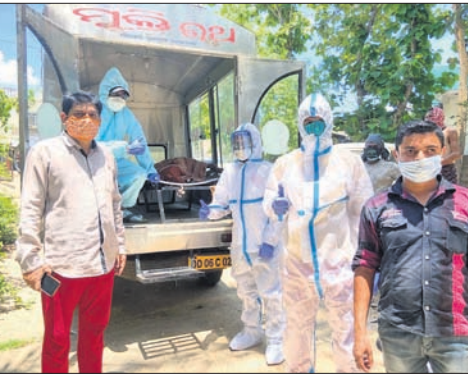
ମୃତଦେହ ମଶାଣିକୁ ନିଆଯାଇଛି।