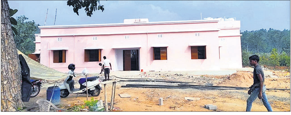
ଉଦ୍‌ଘାଟନ ଅପେକ୍ଷାରେ ଅଧିକାରୀ ଥାନା।

ଅନୁଗୋଳ ଜିଲ୍ଲା ଆଠମଇକ ଉପଖଣ୍ଡରେ ଚୋରା ମଦ ବହୁଳ ମଦ କାରବାର ବୃଦ୍ଧି ପାଇଛି। ଅଧିକାରୀ ବିଭାଗ ଓ ପୋଲିସ୍ ପକ୍ଷରୁ ଠିକ୍ ଭାବେ ଚଢ଼ାଉ କରାଯାଉ ନ ଥିବା ଯୋଗୁ ଚୋରା ମଦ ବ୍ୟବସାୟୀମାନେ ଖୋଲାଖୋଲି ଭାବେ ଏହି କାରବାର ଚଳାଇଛନ୍ତି। ଏପରି କି ବିଭାଗର କେତେଜଣ କର୍ମଚାରୀଙ୍କୁ ହାତ କରି ଦୈନିକ ଦେଶୀ ମଦ ଭାଡ଼ି କର୍ମଚାରୀମାନେ ବାଲକ୍ ଯୋଗେ ବିଭିନ୍ନ ଗ୍ରାମକୁ ଚୋରା ମଦ ଚାଲାଇ କରୁଥିବା ସାଧାରଣରେ ଅଭିଯୋଗ ହେଉଛି। ବିଶେଷକରି ହୁଣ୍ଡପା, କିଶୋରନଗର, କିଆକଟା, ଆଠମଇକ, ଠାକୁରଗଡ଼ ଆନାର ବଲଣା, କମ୍ପୁନାଳି, ମାଧପୁର, ହିଞ୍ଜିରିତା, ବିଲେଇନାଳି, ବୁଢ଼ୁଲିପୁଣ୍ଡା, କନ୍ଧାପୁଣ୍ଡା, ଆମାପାଳ, ହିମିରିତା, ଜିବରାଟ, ଧଉରାପାଳି, ସଞ୍ଜାପୁରା, ରଣିଆକଟା, ଉତ୍ତୁଳୁକା, ସାମନ୍ତୁକା, ପେପିପଥର, ମଲପୁରା, ସପରା, ହାଟପଦା, ପଟାକା, ଆଠମଇକ, ଜମୁଡ଼ୋଲି, ଲୁହାସିଂହା, ମାଧପୁର, ପୁରୁଣାମାଣିଡ଼ି, କିଆକଟା, ବାସୁଦେବପୁର ଅଞ୍ଚଳରେ ଏହି ଚୋରା ମଦ କାରବାର ବୃଦ୍ଧି ପାଇଛି। କେତେଜଣ ଚୋରା ମଦ ବ୍ୟବସାୟୀ ବିଭିନ୍ନ ଗ୍ରାମରେ ଦେଶୀ ମଦକୁ ମଦ ରାନ୍ଧି ବ୍ୟବସାୟ କରୁଛନ୍ତି। ହେଲେ ଅଧିକାରୀ ବିଭାଗ ପକ୍ଷରୁ କେଉଁଠି କାଁ ଭାଁ ଚଢ଼ାଉ କରାଯାଇ ୫ ରୁ ୧୦ ଲିଟର ମଦ ଜବତ କରାଯାଇଛି। ଏପ୍ରକାରେ ମେ ମାସରେ ଅଧିକାରୀ ବିଭାଗ ପକ୍ଷରୁ ଆଠମଇକ ଆନାର ବିଭିନ୍ନ ଗ୍ରାମରେ ଚଢ଼ାଉ କରାଯାଇ