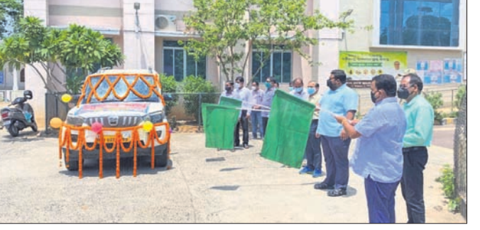
ରାଜସ୍ୱ ରଥର ଶୁଭାରମ୍ଭ କରାଯାଇଛି।