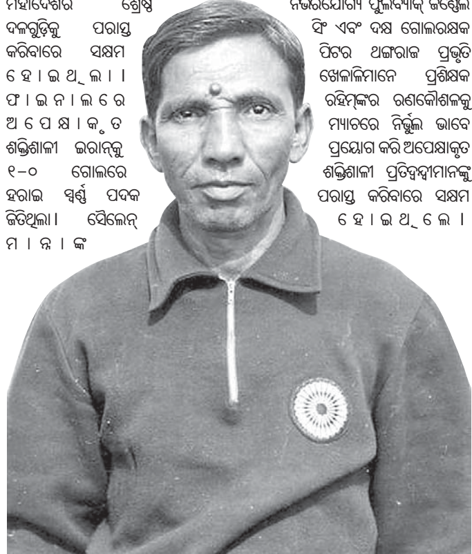
(ଅବଦୁଲ ରହିମ: ୧୯୦୯-୧୯୬୩)