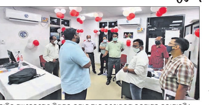
କୋଭିଡ଼ ମ୍ୟାନେଜମେଣ୍ଟ ସିଷ୍ଟମର କମାଣ୍ଡ ଆଣ୍ଡ କଣ୍ଟ୍ରୋଲରୁ ଉଦ୍‌ଘାଟନ କରାଯାଇଛି।