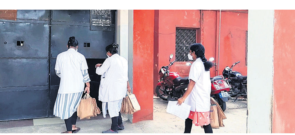
ଆକ୍ରାନ୍ତ ମେଡିସିନ ଦେବାକୁ ସାମ୍ବ୍ୟକର୍ମୀ ଜେଲ ଭିତରକୁ ଯାଉଛନ୍ତି।

ଅନୁଗୋଳ ଅଫିସ୍, ୨୦୧୫: ଅନୁଗୋଳ ଜିଲ୍ଲାରେ ବହୁଥିବା କରୋନା ସଂକ୍ରମଣରୁ କାରାଗାରର କର୍ମଚାରୀ ମଧ୍ୟ ବଢ଼ିପାରି ନାହାନ୍ତି। ଜେଲ ମଧ୍ୟରୁ ଗୁରୁତାର ୨୬ ଜଣ କରୋନାରେ ଆକ୍ରନ୍ତ ହୋଇଛନ୍ତି। ସେମାନଙ୍କ ମଧ୍ୟରୁ ୨ ଜଣଙ୍କ ଅବସ୍ଥା ଗୁରୁତର ହେବାରୁ କଟକ ସ୍ଥାନାନ୍ତର କରାଯାଇଛି। ଏବେ ୨୪ ଜଣଙ୍କୁ କାରାଗାରରେ ଥିବା