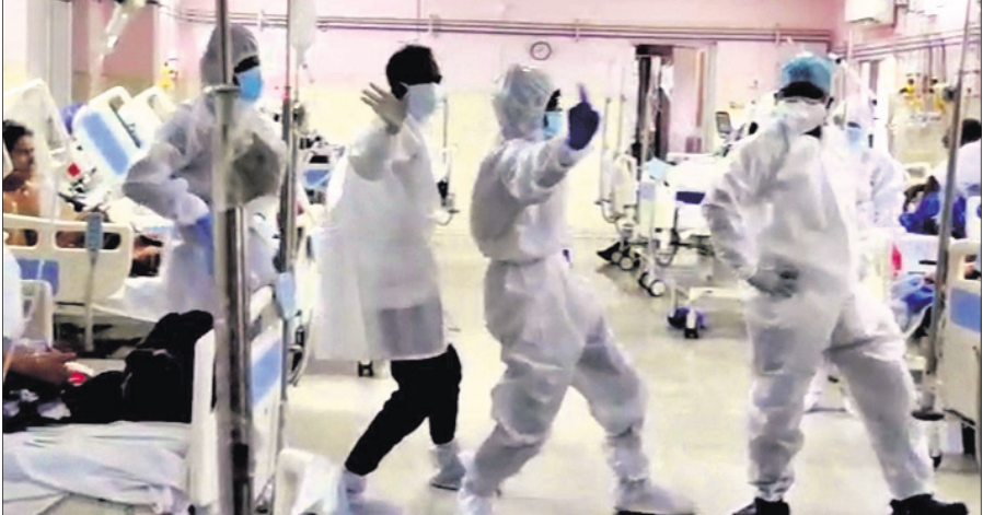
ଭିନ୍ନସାର କୋଭିଡ୍ ମେଡିକାଲରେ ତାତ୍ତ୍ୱର, କର୍ମଚାରୀ ନୃତ୍ୟ ପରିବେଷଣ କରୁଛନ୍ତି ।

ସମ୍ବଲପୁର, ୨୦।୫(ଭୁବନେଶ୍ୱର) ସଂକ୍ରମିତ ରୋଗୀଙ୍କୁ ମାନସିକ ଚାପକୁ ମୁକ୍ତ କରିବା ପାଇଁ ଭିନ୍ନସାର କୋଭିଡ୍ ମେଡିକାଲ-୨ରେ ଅଭିନବ ପ୍ରୟାସ କରାଯାଇଛି। କାର୍ଯ୍ୟରତ କେତେକଙ୍କ ତାତ୍ତ୍ୱର ଓ ଅନ୍ୟ କର୍ମଚାରୀ ନୃତ୍ୟକରି ରୋଗୀଙ୍କୁ ଖୁସି କରିବାକୁ ଚେଷ୍ଟା କରିଛନ୍ତି। ରୋଗୀମାନେ ମଧ୍ୟ