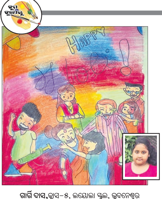
ଗାନ୍ଧୀ ବାସ, କ୍ଲାସ-୫, ଲୟୋଲା ସ୍କୁଲ, ଭୁବନେଶ୍ଵର