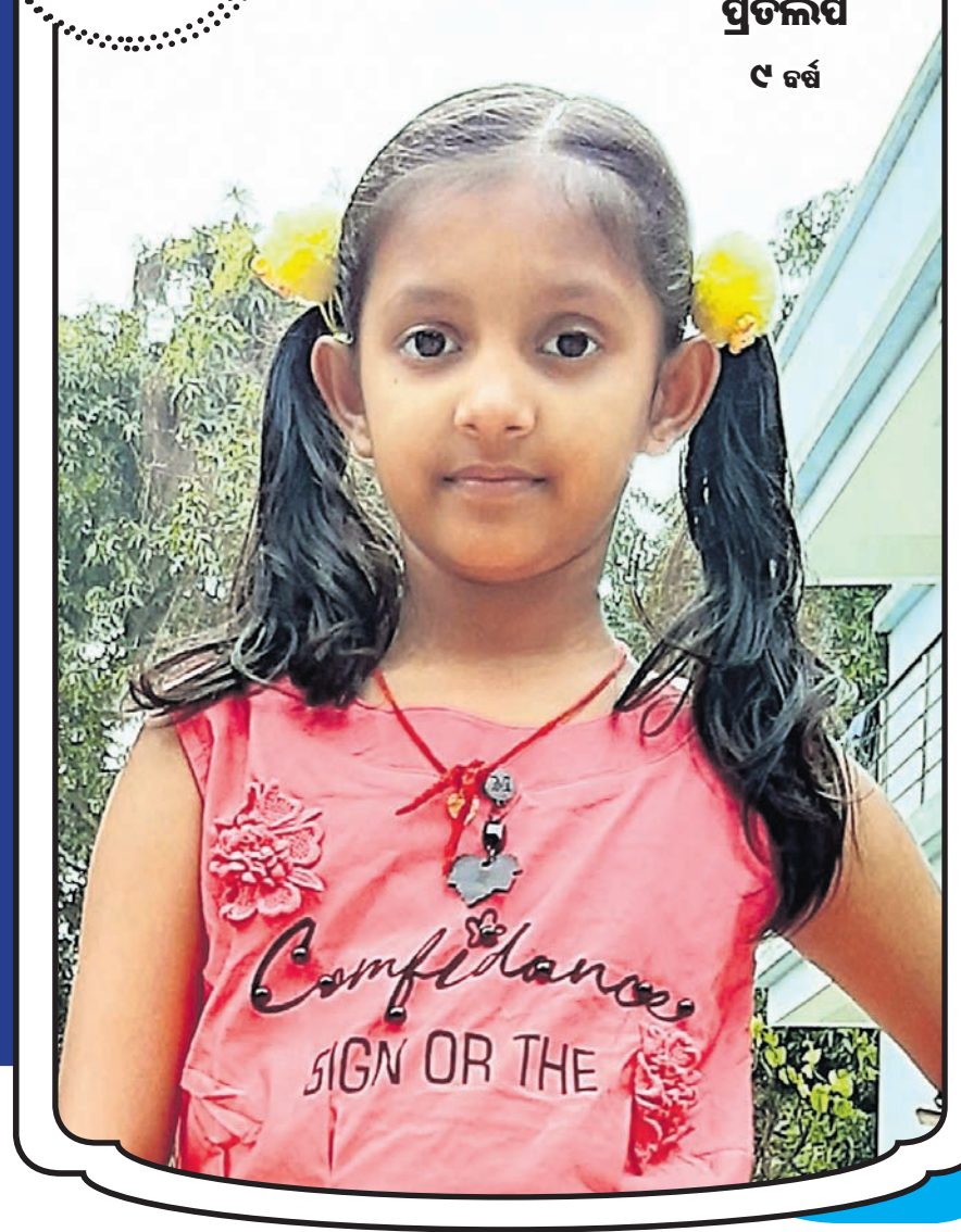
ପ୍ରତିଲିପି ୯ ବର୍ଷ