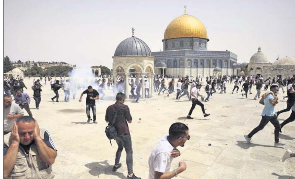
କେରୁଜେଲମ୍ ଅଲ-ଅକ୍ସା ମସଜିଦ୍ ପରିସରରେ ତୋମ୍ ଅଫ୍ ଦି ରକ୍ ସାମ୍ବାରେ ଇସ୍ରାଏଲ୍ ପୋଲିସ୍ ପକ୍ଷରୁ ବୋମା ଫିଙ୍ଗାଯାଇଛି। ଏହାର ଶବ୍ଦ ଶୁଣି ପାଲେଷ୍ଟାଲିଆନ୍ ନାଗରିକ ଧାଉଁଛନ୍ତି।

ଗାଜା ସିଟି/କେରୁଜେଲମ୍, ୨୧ ମଇ ବିବାଦୀୟ ପୂର୍ବ କେରୁଜେଲମ୍ ନେଇ ଇସ୍ରାଏଲ୍ ଓ ପାଲେଷ୍ଟାଲିଆନ୍ ହମାସ୍ କଠୋରପକ୍ଷୀ ମୁହାଁମୁହିଁ ହୋଇଥିଲେ। ମେ' ୧୦ରେ ଗାଜାରେ ସଂଘର୍ଷ ଆରମ୍ଭ ହୋଇଥିଲା। ଉଭୟ ପକ୍ଷ ପରସ୍ପରକୁ ଚାର୍ଜେଜ୍ କରି ରକେଟ୍ ଓ ମୋର୍ଟାର ମାଡ଼ କରୁଥିଲେ। ଏଥିରେ ୨୪୦ରୁ ଉର୍ଦ୍ଧ୍ଵ ନିହତ ହୋଇଥିବାବେଳେ ଶତାଧିକ ଆହତ ହୋଇଛନ୍ତି। ମୃତକଙ୍କ ମଧ୍ୟରୁ ୨୩୨ ଜଣ କେବଳ ଗାଜା ସ୍ଥିପୁରେ ପ୍ରାଣ ହରାଇଛନ୍ତି। ପ୍ରାୟ ୧୦୦ ମହିଳା ଓ ଶିଶୁଙ୍କ ଜୀବନ ଯାଇଥିବା ଗାଜା ସ୍ଵାସ୍ଥ୍ୟ ମନ୍ତ୍ରଣାଳୟ କହିଛି। ଇସ୍ରାଏଲ୍ କହିବା ହେଉଛି, ଗାଜାରେ ପ୍ରାୟ