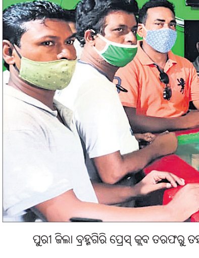
ପୁରୀ ଜିଲ୍ଲା ବ୍ରହ୍ମଗିରି ପ୍ରେସ କ୍ଲବ ତରଫରୁ ତତ୍ତ୍ୱାବଳିତାର କାର୍ଯ୍ୟକ୍ରମର ଉଦ୍ଦେଶ୍ୟରେ ଉପଜିଲ୍ଲାପାଳଙ୍କୁ ଦାବିପତ୍ର ପ୍ରଦାନ ।