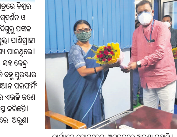
କାର୍ଯ୍ୟରେ ଯୋଗଦେବା ଅବସରରେ ଅରୁଣା ମହାନ୍ତି।

ଭୁବନେଶ୍ୱର, ୨୧।୫(ବୁଧବାର)- ଅରୁଣା ମହାନ୍ତି ଓଡ଼ିଶା ନୃତ୍ୟ କ୍ଷେତ୍ରରେ ବିଶ୍ୱର ଜଣେ ପରିଚିତ ବ୍ୟକ୍ତିତ୍ୱ। ଗୁରୁ ଶ୍ରୀ ଗଙ୍ଗାଧର ପ୍ରଧାନଙ୍କ ପ୍ରତ୍ୟକ୍ଷ ଦିଗ୍‌ବର୍ତ୍ତନ ଓ ତତ୍ତ୍ୱାବଧାନରେ ସେ ଓଡ଼ିଶା ନୃତ୍ୟ ଜଗତକୁ ପ୍ରବେଶ କରିଥିଲେ। ଆଦିଗୁରୁ ପଙ୍କଜ ଚରଣ ଦାସ, ଗୁରୁ ପଦ୍ମବିଭୂଷଣ କେଳୁଚରଣ ମହାପାତ୍ର, ପଦ୍ମଶ୍ରୀ ସଂପୂଜ୍ଞା ପାଣିଗ୍ରାହୀ ଓ ପଦ୍ମବିଭୂଷଣ ସୋନାଲ ମାନସିହଙ୍କଠାରୁ ନୃତ୍ୟ ଶିଖିବାର ସୌଭାଗ୍ୟ ପାଇଥିଲେ। ଭାରତ ସରକାରଙ୍କଠାରୁ ସେ ପଦ୍ମଶ୍ରୀ ସମ୍ମାନରେ ସମ୍ମାନିତ ହେବା ସହ କେନ୍ଦ୍ର ସମ୍ପାଦକ ନାଟକ ଏକାଡେମୀ, ଓଡ଼ିଶା ସମ୍ପାଦକ ନାଟକ ଏକାଡେମୀ ଭଳି ବହୁ ପୁରସ୍କାର ପାଇଛନ୍ତି। ସଂସ୍କୃତି ମନ୍ତ୍ରାଳୟ, ପକ୍ଷରୁ ଫେଲୋଶିପ୍ ପାଇବା ସହ ଇଣ୍ଡିଆନ ପରଫର୍ମ ଆର୍ଟ ଫାଉଣ୍ଡେସନ ପକ୍ଷରୁ ମଧ୍ୟ ସମର୍ଥିତ ହୋଇଛନ୍ତି। ରାଜ୍ୟ ସରକାର ଏଭଳି ଜଣେ ବ୍ୟକ୍ତିକୁ ହାତରେ ଓଡ଼ିଶା ସମ୍ପାଦକ ନାଟକ ଏକାଡେମୀ ଭାରି ନ୍ୟସ୍ତ କରିଛନ୍ତି। ଶୁକ୍ରବାର ଏକାଡେମୀର ସଭାପତି ଭାବେ ଦାୟିତ୍ୱ ଗ୍ରହଣ ଅବସରରେ ଅରୁଣା ମହାନ୍ତିଙ୍କ ସହ ଧରିତ୍ରୀର ସ୍ୱତନ୍ତ୍ର ଆଳାପ।