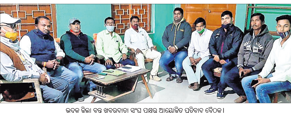
ଉତ୍କଳ ଜିଲ୍ଲା ବନ୍ଧୁ ଖବରଦାତା ସଂଘ ପକ୍ଷରୁ ଆୟୋଜିତ ପ୍ରତିବାଦ ଦୈନିକ ।