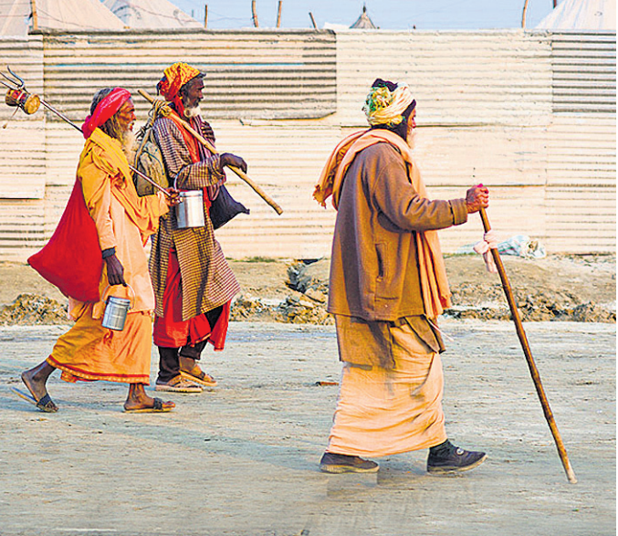
କହିବ ନାହିଁ। ସୁଦାମକୁ ଶପଥ କରାଇ ସାଧୁ ବିଦାୟ ନେଲେ।

ବିକ୍ରି ଆଉ ଚୋରି ଛାଡ଼ିପାରିବ କି ? ସୁଦାମ ଉତ୍ତର ଦେଲା, 'ନା'। କାରଣ ଚୋରି କଲେ ମୁଁ ରାତିଏ ଗଲେ ହାତୀଏ ଆଶୁଛି। ତେଣୁ ଏ ଦୁଇଟି ଜନଶତ୍ରୁ ଛାଡ଼ି ପାରିବି ନାହିଁ।' ସାଧୁ କହିଲେ, ଆଜ୍ଞା ଠିକ୍ ଅଛି, ତୁମେ ମିଛ କହିବା ଛାଡ଼ି ପାରିବ ? ସୁଦାମ କହିଲା, ହଁ, ମିଛ କହିବା ଛାଡ଼ିପାରିବି। କାରଣ ଏଥିରେ କିଛି ଅସୁବିଧା ନାହିଁ। ଏକଥା ଶୁଣିବା ପରେ ସାଧୁ ମନେ ମନେ ଭାବିଲେ, 'ଏବେ ସୁଦାମ ବାଟକୁ ଆସିବ'। ତା' ଶପଥେ ସୁଦାମକୁ କହିଲେ, 'ଆଜି ତୁମେ ଶପଥ ନିଅ ଯେ ଆଜିଠାରୁ କେତେବ ମିଛ ବେଳେ ଅନ୍ୟ ଚୋର ଜଣକ ସୁଦାମକୁ କହିଲା, 'ଆମେ ସବୁ ନେଇ ଦୁଇଟି ହାତୀ ହାର ରଖି ଦେଇଯିବା।' ପରଦିନ ମନ୍ତ୍ରୀ ଆସି ରାଜାଙ୍କୁ କହିଲେ, ଆଜ୍ଞା କାଲି କିଏ ଆମ ଭଣ୍ଡାର ଘରୁ ସବୁ ସୁନାତୁପା ଗହଣା ଚୋରି କରିନେଇଛି। ହେଲେ ଚୋର ଛାଡ଼ି ଦେଇ ଯାଇଥିବା ଦୁଇଟି ହାତୀ ହାରକୁ ମନ୍ତ୍ରୀ ନିଜ ପକେଟରେ ରଖିଦେଇଥିଲେ। ରାଜା ଯେତେବେଳେ ସୁଦାମକୁ ଡାକି ଚୋରି କଥା ପଚାରିଲେ, ସେ କହିଲା, ଆଜ୍ଞା, ମୁଁ ଏବଂ ଆଉ ଜଣେ ଚୋର ମିଶି କରି ସୁନା ଗହଣା ନେଇଛୁ, ଏକଥା ସତ,