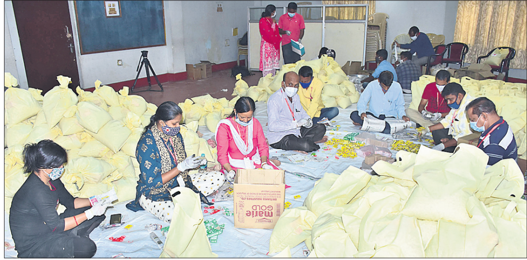
ବାତ୍ୟାକୁ ଦୃଷ୍ଟିରେ ରଖି ରେଡ୍ କ୍ରସ୍ ସେଣ୍ଟର ସେବାମାନେ ସୋମବାର ଭୁବନେଶ୍ୱରସ୍ଥିତ ରେଡ୍ କ୍ରସ୍ ଭବନରେ ବିପନଙ୍କ ଉଦ୍ଦେଶ୍ୟରେ ଶୁଖିଲା ଖାଦ୍ୟ ପୂର୍ଣ୍ଣ ଆ ପ୍ରସ୍ତୁତ କରୁଛନ୍ତି।

ସେହିପରି ବରିଷ୍ଠ ଯନ୍ତ୍ରୀମାନଙ୍କୁ ମଧ୍ୟ ବାତ୍ୟା ପ୍ରସ୍ତୁତି, ରିଲିଫ୍ ଓ ପୁନରୁଦ୍ଧାର କାର୍ଯ୍ୟ ପାଇଁ ନିୟୋଜିତ କରାଯାଇଛି। ବାଲେଶ୍ୱର ଜିଲା ପାଇଁ ସର୍ବୋଚ୍ଚ ଯନ୍ତ୍ରୀ