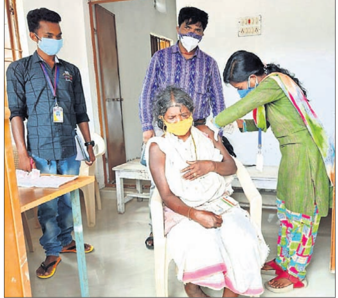
ଜଣେ ଡଙ୍ଗାରିଆ ମହିଳା ଟିକା ନେଉଛନ୍ତି।