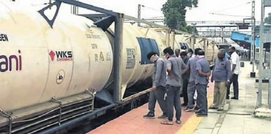
ରାୟଗଡ଼ା ଷ୍ଟେଶନରେ ଅଟକିଥିବା ଅଧିକେନ ଟ୍ୟାଙ୍କର।

ଦିଶିଥିବା ଏକ ହେଲୁ ଡେସ୍ ଏବଂ କଣ୍ଠେଲି ଚୁଲ୍ ଖୋଲାଯାଇ ନିରନ୍ତର ଭାବେ ସୂଚନା ପ୍ରଦାନ କରାଯାଇଛି ବୋଲି ଏମ୍ବୁସ ପକ୍ଷରୁ ସୂଚନା ପ୍ରଦାନ କରାଯାଇଛି। ଏହା ବ୍ୟତୀତ ଅଣ କୋଭିଡ୍ ରୋଗୀଙ୍କ ପାଇଁ 'ଟେଲିମେଡିସିନ ସ୍ୱାସ୍ଥ୍ୟ ଆପ୍' ଏବଂ 'ଟେଲିମେଡିସିନ ବହିର୍ଭିତ୍ତୀ (ଓପିଡି)' କ୍ରିଆରେ ସ୍ୱାସ୍ଥ୍ୟ ଓ ଟିକିସିଡ ସମ୍ପର୍କରେ ସୂଚନା ଓ ସେବା ପ୍ରଦାନ କରାଯାଇଛି। କୋଭିଡ୍ କଟକଣା ଓ ଗାଲିଭୁଲାଇନକୁ ପାଳନ କରାଯାଇ ହସ୍ପିଟାଲ ତରଫରୁ ରୋଗୀଙ୍କ ସମ୍ପର୍କରେ ଆବେଦନା (ସେଲ୍ କାଟେରିଂ କ୍ରିଆରେ) ନିଶ୍ଚିତ ଭାବେ ପ୍ରଦାନ କରାଯାଇଛି। କୋଭିଡ୍ ମହାମାରୀ ପ୍ରାରମ୍ଭରୁ ଅଧିକାଂଶ କୋଭିଡ୍ ଖର୍ଚ୍ଚ/ଆସିଲ୍ରେ ୫୦୦୦ରୁ ଊର୍ଦ୍ଧ୍ୱ ରୋଗୀ ଟିକିସିଡ ହୋଇସାରିଛନ୍ତି ବୋଲି ଏମ୍ବୁସ ପକ୍ଷରୁ ସୂଚନା ଦିଆଯାଇଛି।