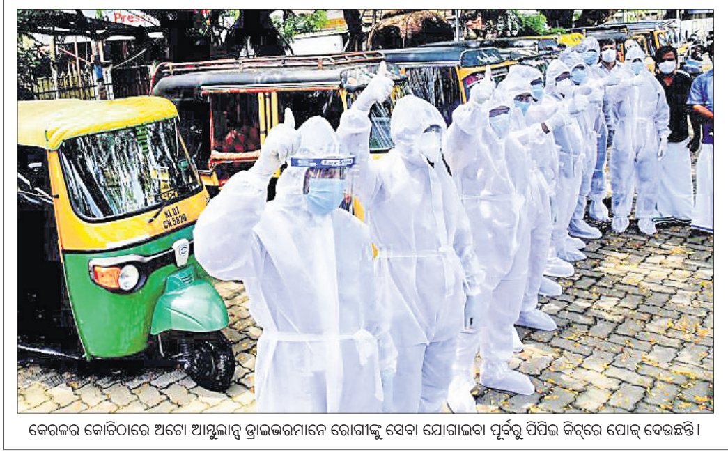
କେରଳର କୋଟିଠାରେ ଅତୀତ ଆମ୍ବୁଲାନ୍ସ ଡ୍ରାଇଭରମାନେ ରୋଗୀଙ୍କୁ ସେବା ଯୋଗାଇବା ପୂର୍ବରୁ ପିପିଲ କିଟ୍ରେ ପୋଲ୍ ଦେଖିଛନ୍ତି।

କାଠମାଣ୍ଡୁ, ୨୪୫: ନେପାଳରେ ପାର୍ଲିମେଣ୍ଟ ଭଙ୍ଗ, ବିରୋଧୀ ଦଳ ନେତାଙ୍କୁ ପ୍ରଧାନମନ୍ତ୍ରୀ ଘୋଷଣା ନ କରିବା ଏବଂ ମଧ୍ୟବର୍ତ୍ତୀ ନିର୍ବାଚନ ପାଇଁ ରାଷ୍ଟ୍ରପତି ବିଧ୍ୟାଦେବୀ ଭଣ୍ଡାରୀଙ୍କ ନିଷ୍ପତ୍ତି ବିରୋଧରେ ବିରୋଧୀ ଦଳ ପକ୍ଷରୁ ଘୋଷଣା ପ୍ରସ୍ତୁତ ହୋଇଛି।