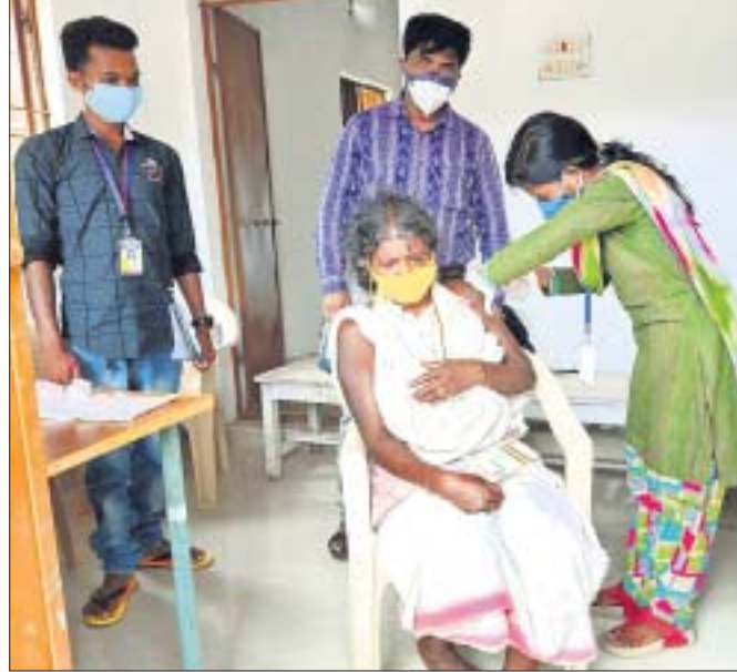
ଜଣେ ଡକ୍ଟରୀଆ ମହିଳା ଚିକା ନେଉଛନ୍ତି