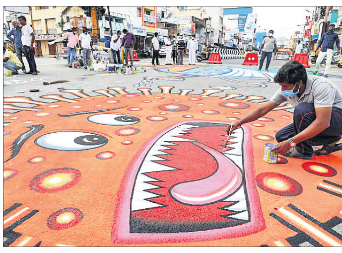
ତାମିଲନାଡୁର ଜିଲ୍ଲାରେ ଚିତ୍ରକର କୋଭିଡ୍ ସଚେତନତା ପାଇଁ ରାସ୍ତାରେ ଚିତ୍ର ଆଙ୍କିଛନ୍ତି।

ନୂଆଦିଲ୍ଲୀ, ୨୪୫(ପି.ଟି.): ଦେଶରେ ଗତ ୨୪ ଘଣ୍ଟାରେ ୨,୨୨,୩୧୫ କରୋନା ସଂକ୍ରମଣ ହୋଇଥିବାବେଳେ ୪,୪୫୫ ଜଣଙ୍କ ଜୀବନ ଯାଇଛି।