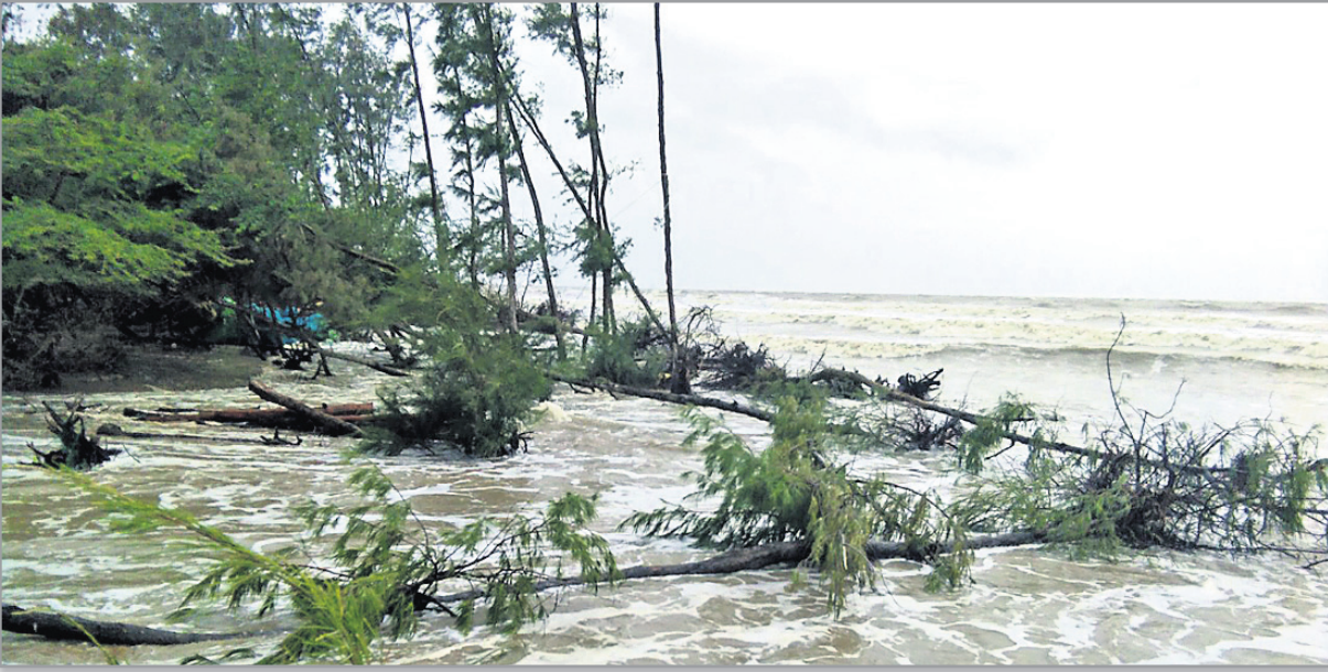
ବାଲେଶ୍ୱର ଜିଲା ତାଳସାରୀ ବେଳାଭୂମିରେ କୁଆରମାଡ଼ରେ ଝାଉଁ କଟାଇ ଧରାଶାୟୀ ।