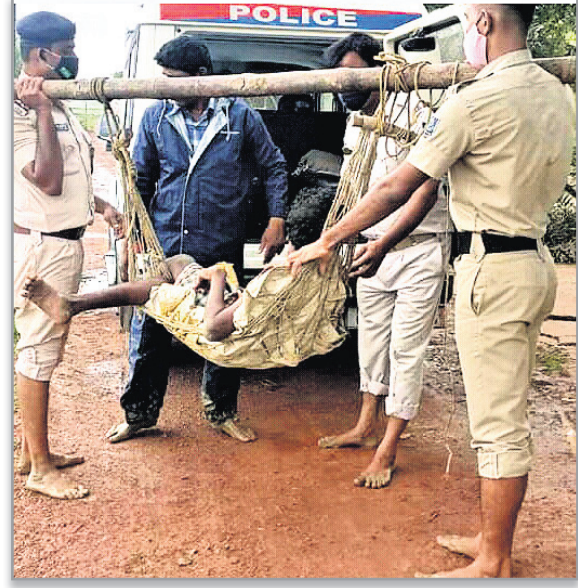
ଭଦ୍ରକ ଜିଲା ବୃତ୍ତାମଣି ସାମୁଦ୍ରିକ ଥାନା ପୋଲିସ୍ ଜଣେ ଦିବ୍ୟାଙ୍ଗଙ୍କୁ ଆଶ୍ରୟସ୍ଥଳୀକୁ ନେଉଛନ୍ତି ।