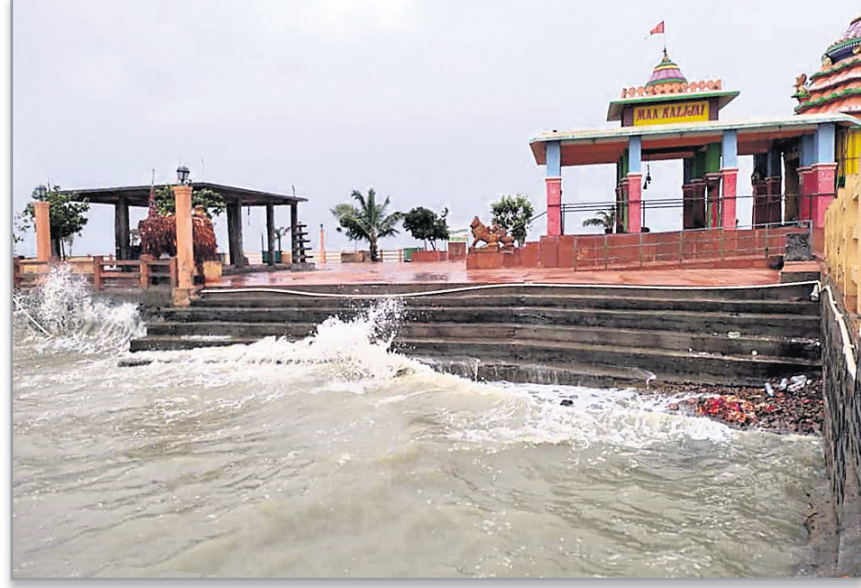
ଚିଲିକାସ୍ଥିତ ମା' କାଳିଜାଲ ପୀଠ ପାହାଚରେ ଭେଜ ମାଡ଼ ହେଉଛି ।