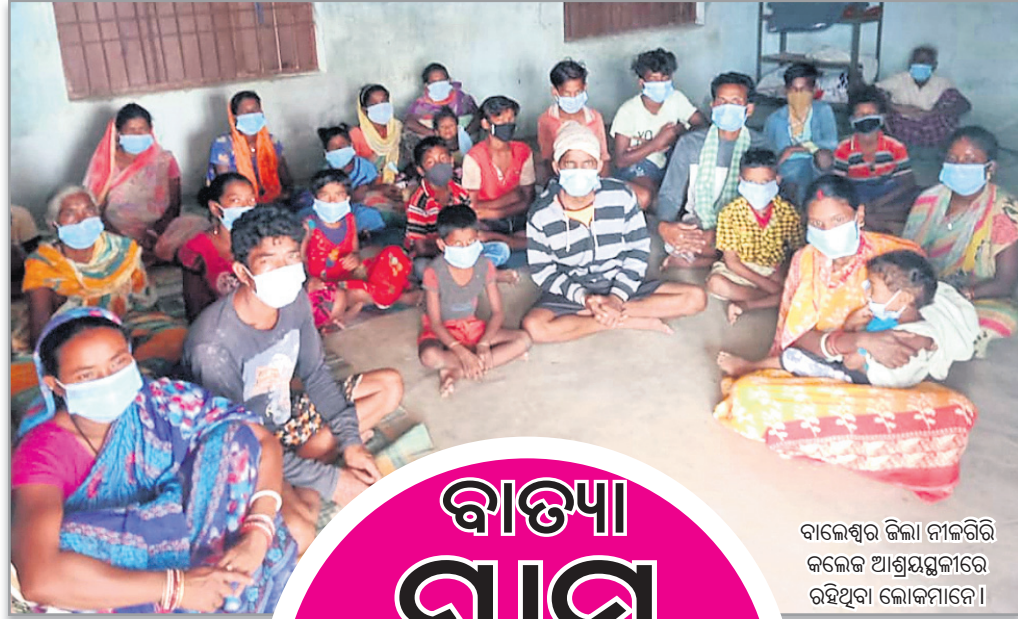
ବାଲେଶ୍ୱର ଜିଲା ନୀଳଗିରି କଲେଜ ଆଶ୍ରୟସ୍ଥଳୀରେ ରହିଥିବା ଲୋକମାନେ ।