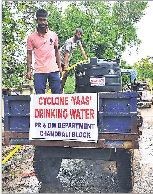
ଭଦ୍ରକ ଜିଲା ଚାନ୍ଦବାଲି ବ୍ଲକ ପ୍ରଶାସନ ପକ୍ଷରୁ ଟ୍ୟାଙ୍କର ଯୋଗେ ପିଇବା ପାଣି ଯୋଗାଣ ।