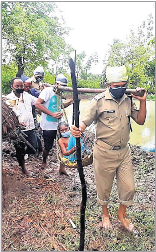
କେନ୍ଦ୍ରାପଡ଼ା ଜିଲା ରାଜନଗର ବ୍ଲକ ତାଳବୁଆ ସାମୁଦ୍ରିକ ଥାନା ଆଇଆଇସି ଜଣେ ବୃଦ୍ଧାଙ୍କୁ ଭାରରେ ସ୍ଥାନାନ୍ତର କରୁଛନ୍ତି ।