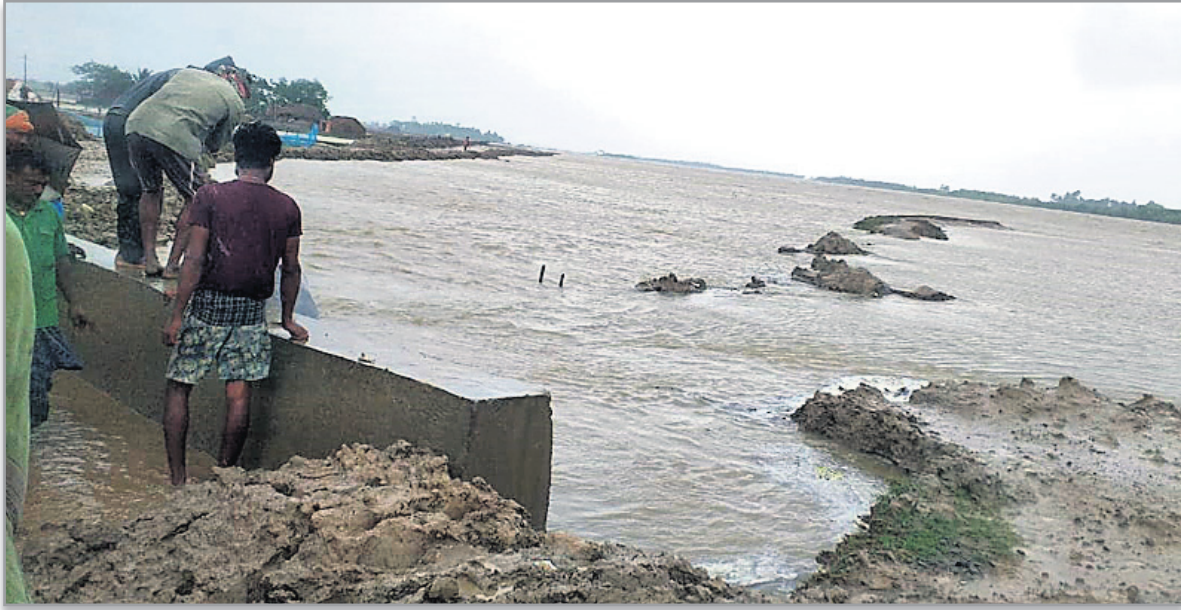
ସାମୁଦ୍ରିକ କୁଆର ପ୍ରଭାବରେ କେନ୍ଦ୍ରାପଡ଼ା ଜିଲା ରାଜନଗର ବ୍ଲକ ଲକ୍ଷ୍ମୀପୁର ପଞ୍ଚାୟତ ପୁରୁଣୋତ୍ତରପୁର ଗାଁ ନିକଟରେ ଥିବା ଲୁଣା ଘେରି ବନ୍ଧରେ ଘାଲ ।