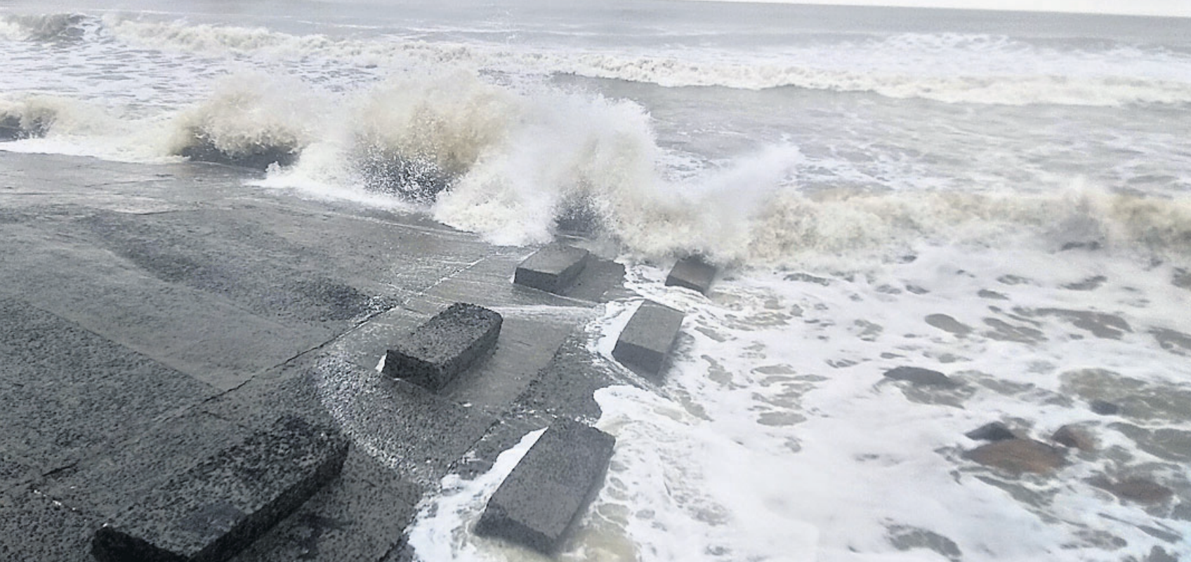
ବାଲେଶ୍ୱର ଜିଲ୍ଲା ଉପକୂଳରେ ବେକାଭୁମିରେ ମଙ୍ଗଳବାର ଅପରାହ୍ନରେ ସମୁଦ୍ର ଅଶାନ୍ତ ତେଜ।

ଭୁବନେଶ୍ୱର, ୨୫୫ (ବୁଧବାର) ପୂର୍ବ କେନ୍ଦ୍ରୀୟ ବଙ୍ଗୋପସାଗରରେ ସୃଷ୍ଟି ହୋଇଥିବା ଅବପାତ(ଡିପ୍ରେସନ) ମଙ୍ଗଳବାର ଅତି ଭୟଙ୍କର ବାତ୍ୟା (ଯାସ୍)ରେ ପରିଣତ ହୋଇଛି। ବୁଧବାର ଏହା ୧୫୫ରୁ ୧୬୫ କିଲୋମିଟର ବେଗରେ ସ୍ଥଳଭାଗକୁ ମାଡ଼ କରିବା ନେଇ ଭାରତୀୟ ପାଣିପାଗ ବିଭାଗ(ଆଇଏମ୍‌ଡି) ପକ୍ଷରୁ ଅନୁମାନ କରାଯାଇଛି। ଆକଳନ ଯଦି ସତ୍ୟ ହୁଏ, ତେବେ ବାତ୍ୟା ଯେଉଁ ବାଟ ଦେଇ ଯିବ ସେ ସବୁ ଅଞ୍ଚଳ ଛାଡ଼ିବାର ହୋଇଯିବ।