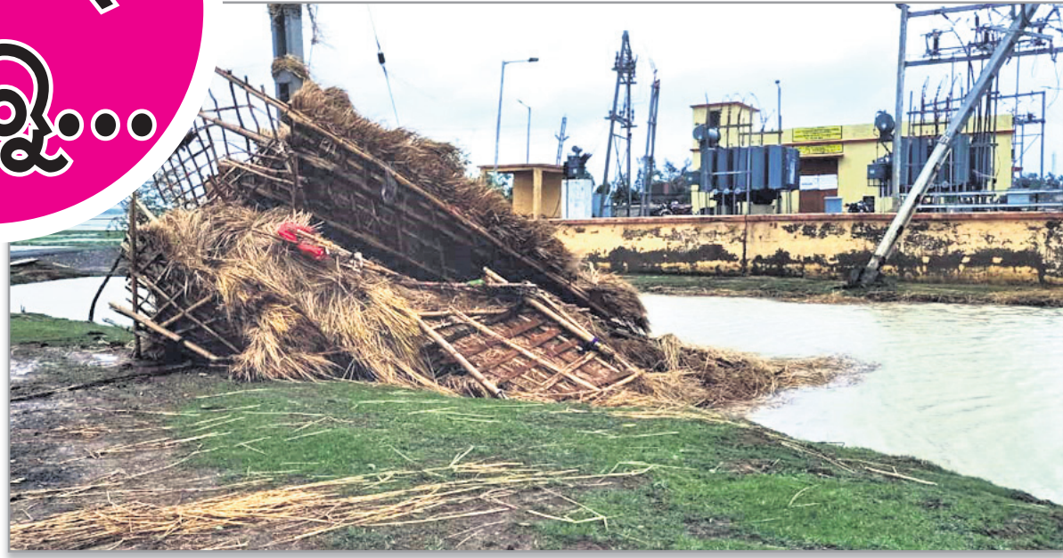
ପ୍ରବଳ ପବନ ଯୋଗୁ କେନ୍ଦ୍ରାପଡ଼ା ଜିଲା ରାଜନଗର ବ୍ଲକ ତାଳମାଳ ପଞ୍ଚାୟତ ବତାଡ଼ିଆ ବିଦ୍ୟୁତ୍ ସେକ୍ସନର ଗ୍ରାଡ଼ କ୍ଷତିଗ୍ରସ୍ତ ହେବା ସହ କବା ଘର ଭାଙ୍ଗିଯାଇଛି ।