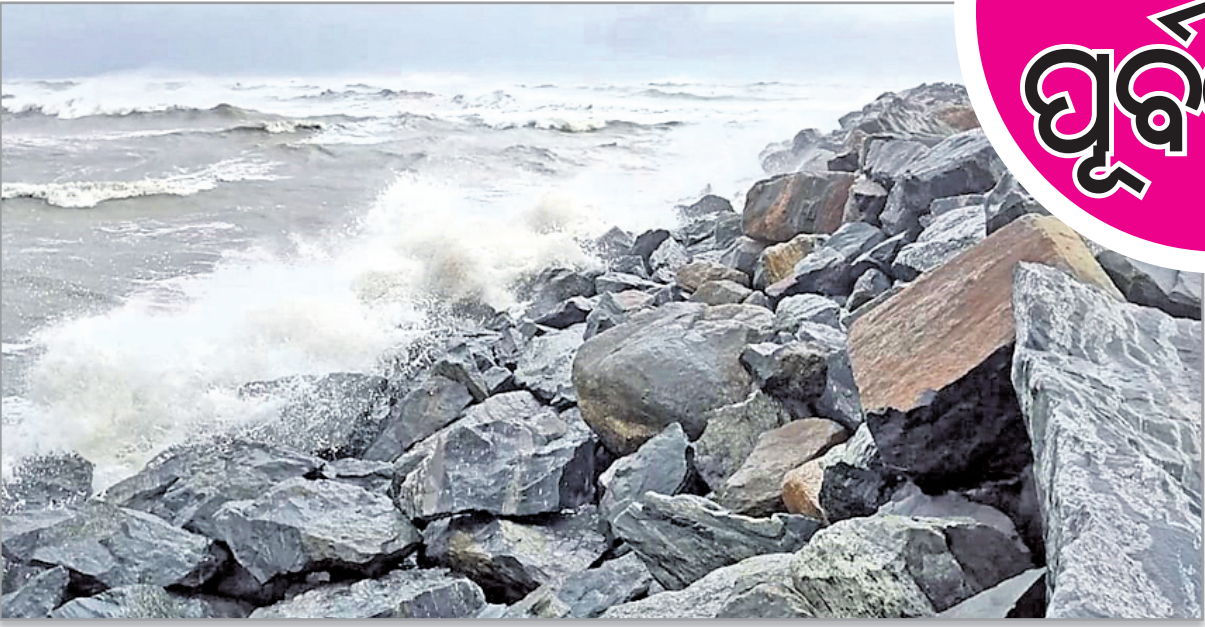
ଜଗତସିଂହପୁର ଜିଲା ପାରାଦୀପ ମହାନଦୀ ମୁହାଣଠାରେ ଅଣାନ୍ତ ସମୁଦ୍ର ପଥରରେ ମାଡ଼ ହେଉଛି ।