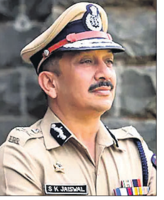
ସୁବୋଧ କୁମାର ଜୟସାଲ

ନୂଆଦିଲ୍ଲୀ, ୨୫୫ କେନ୍ଦ୍ରୀୟ ଶିଳ୍ପ ନିରାପତ୍ତା ବାହିନୀ (ସିଆଇଏସ୍‌ଏଫ୍) ମହାନିର୍ଦ୍ଦେଶକ ସୁବୋଧ କୁମାର ଜୟସାଲଙ୍କୁ ମଙ୍ଗଳବାର କେନ୍ଦ୍ରୀୟ ତଦନ୍ତ ବୁଧବାର (ସିବିଆଇ)ର ନୂଆ ନିର୍ଦ୍ଦେଶକ ଭାବେ ନିଯୁକ୍ତି ଦିଆଯାଇଛି। ପ୍ରଧାନମନ୍ତ୍ରୀ