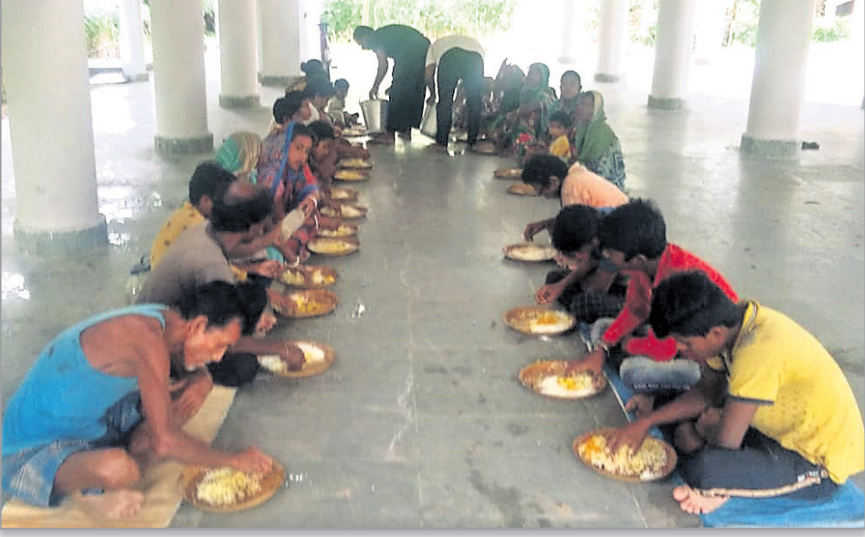
ବାଲେଶ୍ୱର ଜିଲା ଚନ୍ଦନେଶ୍ୱର ନିକଟସ୍ଥ ଏକ ବାଟୋ ଆଶ୍ରୟସ୍ଥଳୀରେ ଲୋକଙ୍କୁ ରକ୍ଷାଖାଦ୍ୟ ଦିଆଯାଇଛି ।