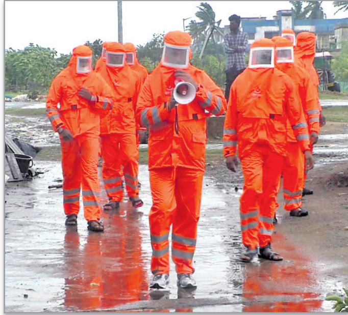
ଜଗତସିଂହପୁର ଜିଲା ପାରାଦୀପସ୍ଥିତ ସଞ୍ଜୁକବନ୍ଧୁରେ ଓଡ୍ରାଏ ଫ୍ ମ୍ ଉଦ୍ଧାର କାର୍ଯ୍ୟ କରୁଛନ୍ତି ।