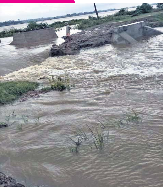
କେନ୍ଦ୍ରାପଡ଼ା ଜିଲା ମହାକାଳପଡ଼ା ବୁକ କଂସାର ବାଟ ଦାଣ୍ଡୁଆ ଗାଁରେ କୁଣା ବନ୍ଧ ଭାଙ୍ଗି ସମୁଦ୍ର ପାଣି ପଶୁଛି ।