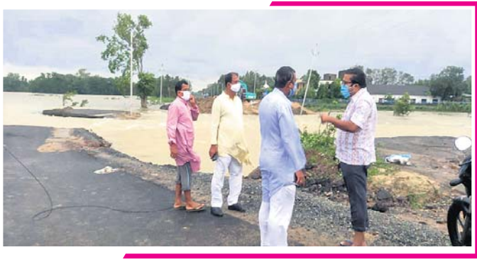
ଜଳ ନିଷାସନ ପାଇଁ ଲୋକେ ବାସୁଦେବପୁର-ବାସୁଣ୍ଡାଡ଼ି ରାସ୍ତାକୁ କାଟି ଦେବା ପରେ ପ୍ରଶାସନିକ ଅଧିକାରୀମାନେ ସ୍ଥିତି ଅନୁଧ୍ୟାନ କରୁଛନ୍ତି ।