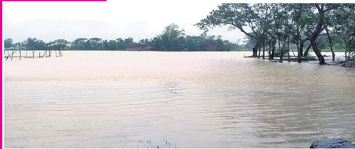
କୁଆର ଆସି କେନ୍ଦ୍ରାପଡ଼ା ଜିଲା ରାଜନଗର ବୁକ ଡାକରୁଆ ପଞ୍ଚାୟତ ରାଜକେନ୍ଦ୍ରନଗରର ଘର ସହ ଚାଷଜମିରେ ପାଣି ଜମି ରହିଛି ।