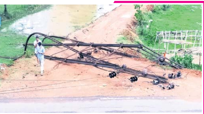
ବାଲେଶ୍ଵର ୬୦ ନଂ. ଚାନ୍ଦିୟ ରାଜପଥ ପାର୍ଶ୍ଵ ଖୁଲାତିଠାରେ ବିଦ୍ୟୁତ୍ ଖୁଣ୍ଟ ଭାଙ୍ଗିପଡ଼ିଛି ।