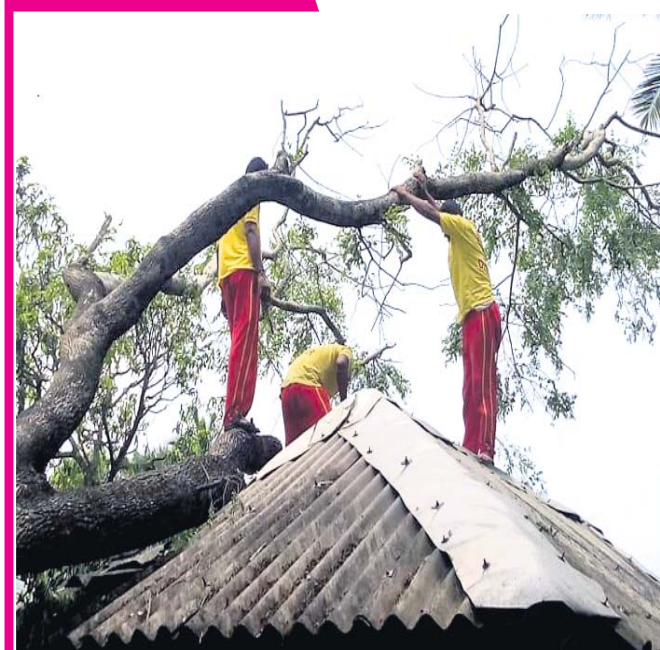
ଭଦ୍ରକ ଜିଲା ଚାନ୍ଦବାଲିରେ ଅଗ୍ନିଶମ କର୍ମଚାରୀ ଏକ ଘର ଉପରେ ପଡ଼ିଥିବା ଗଛକୁ କାଟୁଛନ୍ତି ।