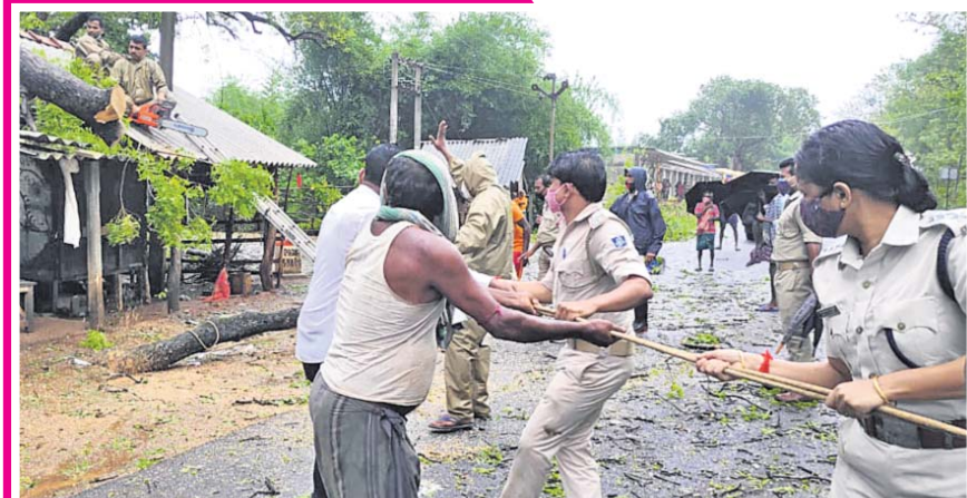
ମୟୂରଭଞ୍ଜ ଜିଲା ରାସଗୋବିନ୍ଦପୁର ବଜାରର ଏକ ଘର ଉପରେ ପଡ଼ିଥିବା ଗଛକୁ ପୋଲିସ କର୍ମଚାରୀ ପରିଷ୍କାର କରୁଛନ୍ତି ।