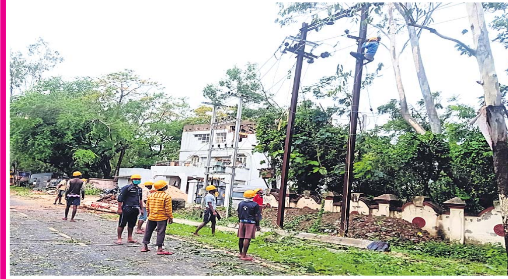
ବାଲେଶ୍ଵର ସହର ପୋଲିସ ଲାଇନ ପଡ଼ିଆରେ ବାତ୍ୟା ପରେ ବିଦ୍ୟୁତ୍ ଖୁଣ୍ଟ ମରାମତି କରାଯାଉଛି ।