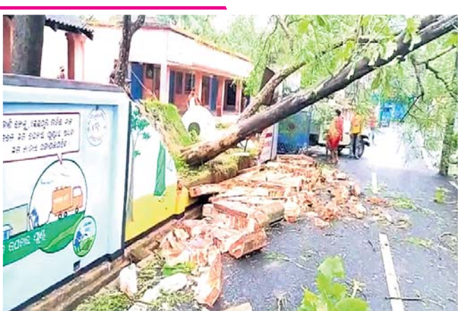
ବାଲେଶ୍ଵର ସହର ସୁନହଟସ୍ଥିତ ଶକୁନ୍ତଳା ହାଇସ୍କୁଲ ପାଟେରି ଉପରେ ଗଛ ଭାଙ୍ଗିପଡ଼ିଛି ।