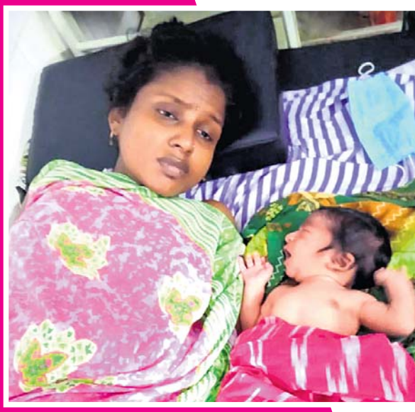
ଭଦ୍ରକ ଚାନ୍ଦବାଲି ଡାକ୍ତରଖାନାରେ ନବଜାତକ ସହ ମା' ।