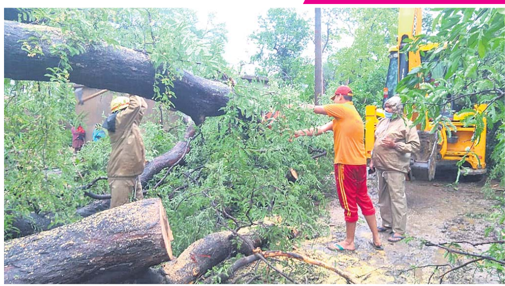
ମୟୂରଭଞ୍ଜ ଜିଲା ବାରିପଦା ବୁକ ଅନ୍ତର୍ଗତ ଗାଙ୍ଗରାଜ ଅଞ୍ଚଳରେ ପଡ଼ିଥିବା ଗଛକୁ ଅଗ୍ନିଶମ ବିଭାଗ କାଟି ସଫା କରୁଛନ୍ତି ।