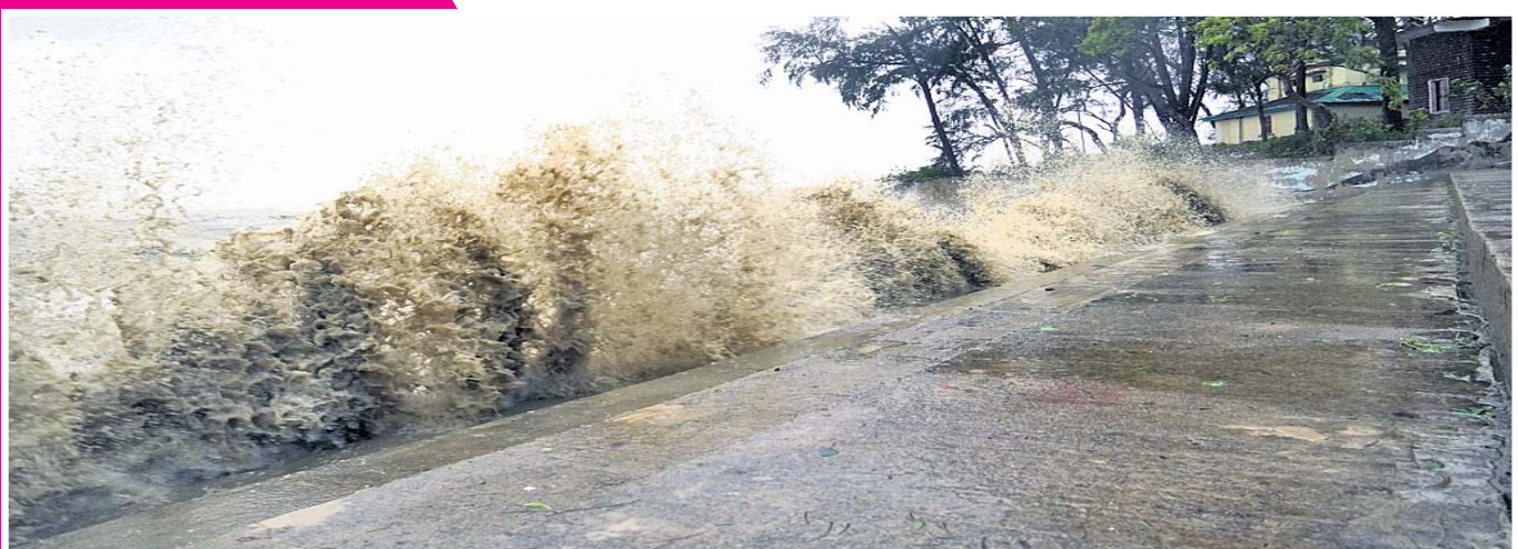
ବାଲେଶ୍ଵର ଜିଲା ଚାନ୍ଦିପୁର ବେଳାଭୂମିରେ କୁଆର ମାତ ।