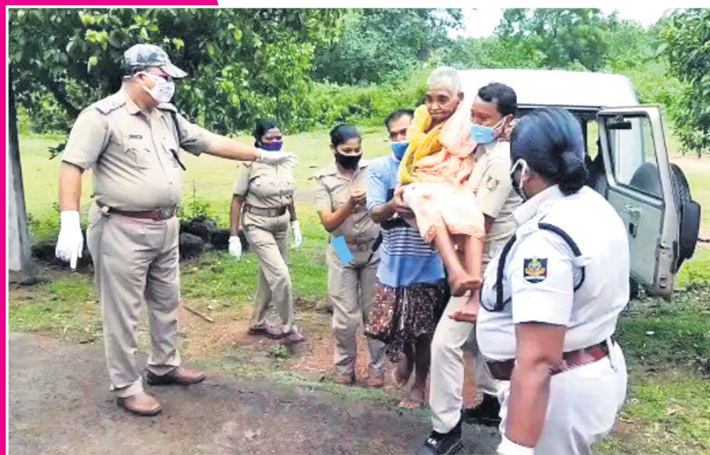
ମୟୂରଭଞ୍ଜ ଜିଲା ମୋରଡ଼ା ବୁକ ଅଞ୍ଚଳର ଜଣେ ବୁଢ଼ାଙ୍କୁ ପୋଲିସ ଉଦ୍ଧାର କରୁଛି ।