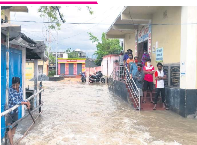
ବାଲେଶ୍ଵର ଜିଲା ଖଇରା ଗୋଷ୍ଠୀ ସ୍ଵାସ୍ଥ୍ୟକେନ୍ଦ୍ର ପାଣିଘେରରେ ।