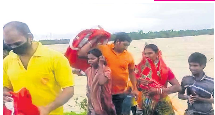
ବାଲେଶ୍ଵର ରେପୁଣା ବୁକ ଗୁରୁ ପଞ୍ଚାୟତରେ ଏକତୀଆରଏଫ୍ ଟିମ୍ ପାଣିଘେରରୁ ଲୋକଙ୍କୁ ଉଦ୍ଧାର କରୁଛି ।