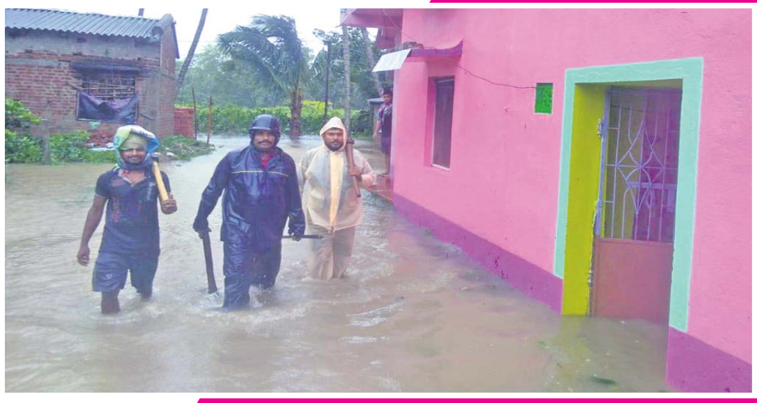
ଭଦ୍ରକ ଜିଲା ବାସୁଦେବପୁର ୨୨ ନଂ. ଖର୍ବୁରେ ଲୋକଙ୍କ ଘରେ ବର୍ଷାପାଣି ପଶିଛି ।