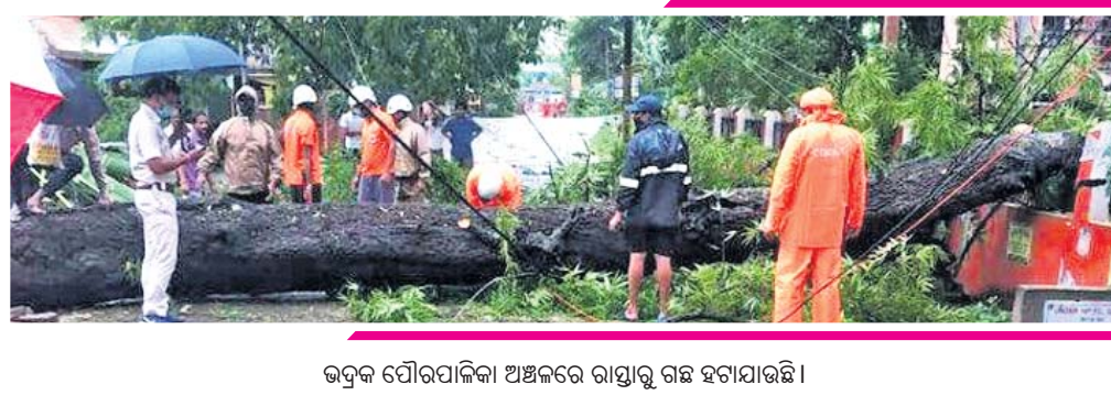
ଭଦ୍ରକ ପୌରପାଳିକା ଅଞ୍ଚଳରେ ରାସ୍ତାକୁ ଗଛ ହଟାଯାଉଛି ।