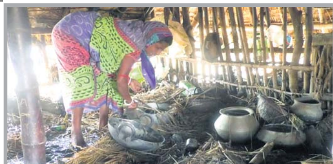
ବାଲେଶ୍ଵର ଜିଲ୍ଲା ଭୋଗରାଇ ବ୍ଲକ କୁମ୍ଭାରୀଗଡ଼ି ଗାଁର ଜଣେ ମହିଳା ଭଙ୍ଗାଘର ମଧ୍ୟରୁ ବାସନ ବାହାର କରୁଛନ୍ତି ।