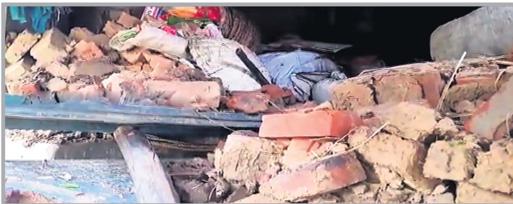
କେନ୍ଦ୍ରାପଡ଼ା ଜିଲ୍ଲା ରାଜନଗର ବ୍ଲକ ତାଳମାଳ ପଞ୍ଚାୟତର ଜଣେ ବ୍ୟକ୍ତିଙ୍କ ଘର ଭାଙ୍ଗି ଯାଇଛି ।