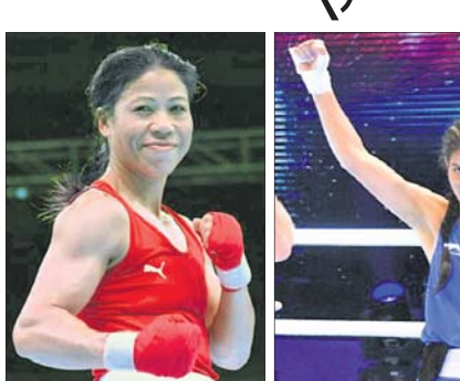
ଏମ୍. ସି. ମେରୀ କମ୍ ସାକ୍ଷୀ