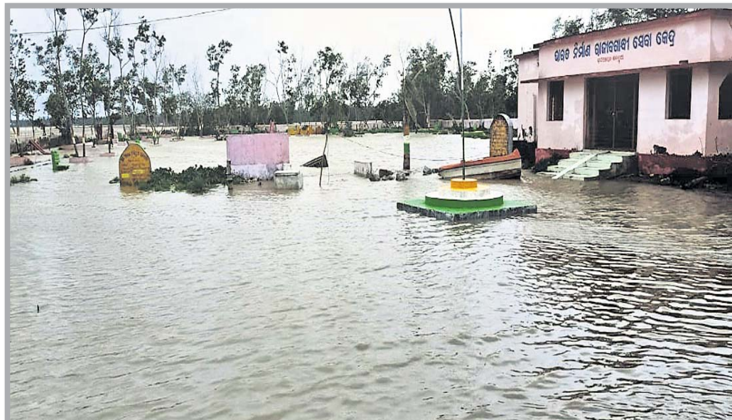
କେନ୍ଦ୍ରାପଡ଼ା ଜିଲ୍ଲା ରାଜନଗର ବ୍ଲକ ତାଳଗୁଆ ପଞ୍ଚାୟତ କାର୍ଯ୍ୟାଳୟ ଓ ପାର୍କ ପାଖରେ ବୁଡି ରହିଛି ।