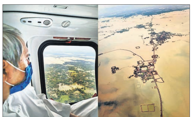
'ଯାଏ' ଯୋଗୁଁ କ୍ଷତିଗ୍ରସ୍ତ ଅଞ୍ଚଳକୁ ଆକାଶମାର୍ଗରୁ ମୁଖ୍ୟମନ୍ତ୍ରୀ ନବୀନ ପଟ୍ଟନାୟକ ଦେଖିଛନ୍ତି।

ଭୁବନେଶ୍ୱର, ୨୭।୫ (ବୁଧବୋ) ବନ୍ୟା ହୋଇଛି। ଏଥିପାଇଁ ବୈତରଣୀରେ ବନ୍ୟା ପାଇଁ ଉଚ୍ଚୁକ୍ତି। ଏହି ନଦୀର ବନ୍ୟା ବିପଦ ବୁଝିବାକୁ ଆହୁରି ବୃଦ୍ଧିପାଇଁ ବନ୍ୟାଜଳ ବିପଦ ସଙ୍କେତ ଉପରେ ଆଶଙ୍କା ସୃଷ୍ଟି କରିଛି। ବାତ୍ୟାଜନିତ ବନ୍ୟା ଯୋଗୁଁ ଉତ୍ତର ଓଡ଼ିଶାର ଅଧିକାଂଶ ଜିଲ୍ଲାରେ ଗତ ୨୪ ଘଣ୍ଟା ମଧ୍ୟରେ ପ୍ରବଳରୁ ଅତିପ୍ରବଳ ବିପଦ ସଙ୍କେତ ୧୭.୮୩ ମିଟର ଥିବା ବେଳେ ୧୮.୬୯ ମିଟର ଉପରେ ବନ୍ୟାଜଳ ପ୍ରବାହିତ ହେଉଛି। ଏହାଦ୍ୱାରା ଯାଜପୁର ଜିଲ୍ଲାର ବୈତରଣୀ ନଦୀ ତଟବର୍ତ୍ତୀ କୋରୋଳ, ଦଶରଥପୁର ଓ ଯାଜପୁର ବ୍ଲକ୍‌ସାଥୀ ଆଡ଼କିଟ ଅବସ୍ଥାରେ ସେହିପରି ଭଦ୍ରକ ଜିଲ୍ଲାର ଧାମନଗର, ଭଣ୍ଡାରିପୋଖରୀ ଓ ତିହଡ଼ି ବ୍ଲକ୍‌ରେ ବନ୍ୟା ଆଶଙ୍କା ବଢ଼ିଯାଇଛି। ଏହି ବନ୍ୟାଜଳ ୩ ବ୍ଲକ୍‌ର ନିକଟୁଆଁ ଠାଁ ପାଇଁ ବିପଦ ଆଣିପାରେ ବୋଲି ଜିଲ୍ଲା ପ୍ରଶାସନ ଆକଳନ କରିଛି। ବ୍ଲକ୍ ପ୍ରଶାସନ ପକ୍ଷରୁ ତାଙ୍କବାସି ଯନ୍ତ୍ର ପୁଷ୍ପା-୪