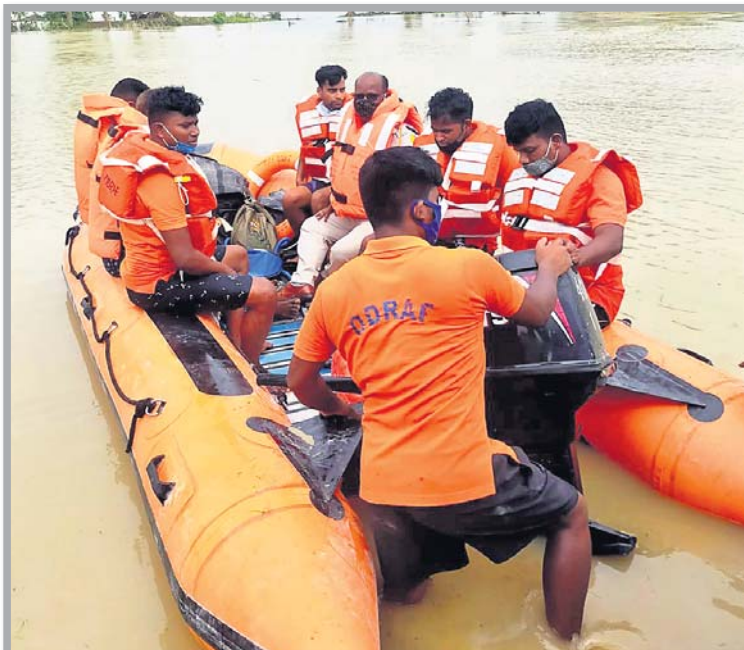
ଭଦ୍ରକ ଜିଲ୍ଲା ବାସୁଦେବପୁର ଗମେଇ ନଦୀରେ ନିଖୋଜ ମସ୍ୟାକାବାଙ୍କୁ ଖୋଜାଚାଲିଛି ।