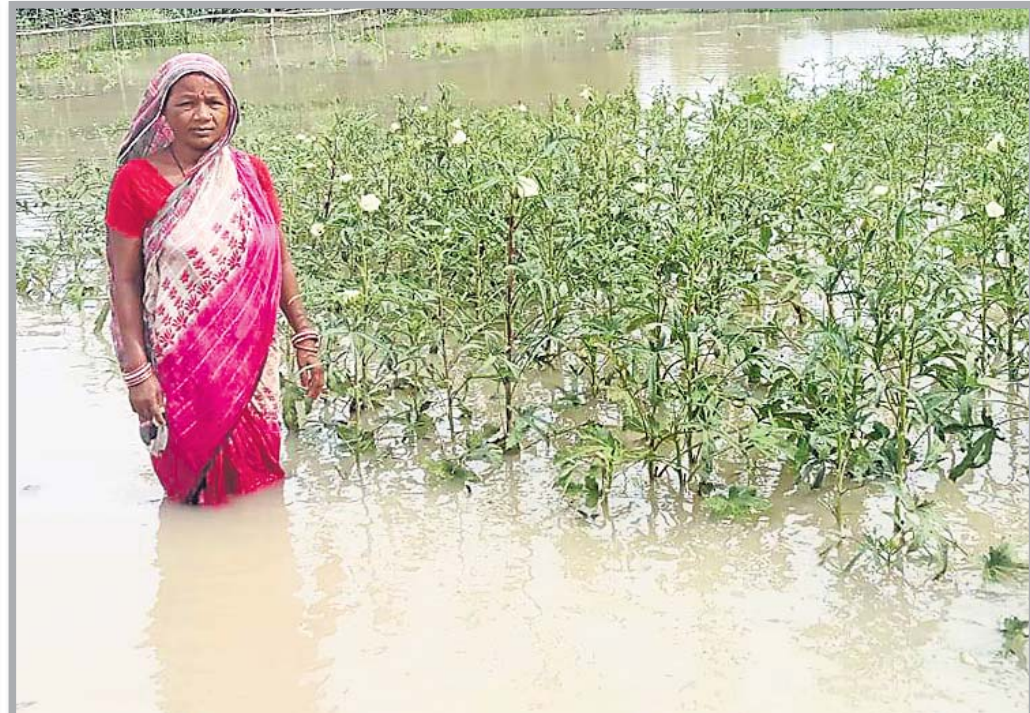
ଭଦ୍ରକ ଜିଲ୍ଲା ବନ୍ତରେ ପାଣିରେ ବୁଡି ରହିଥିବା ପରିବା ଚାଷକୁ ବୁଲି ଦେଖୁଛନ୍ତି ମହିଳା ।