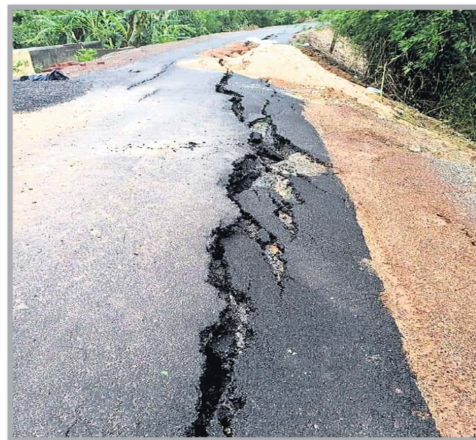
ଭଦ୍ରକ ଜିଲ୍ଲା ଧାମନଗର ଜରାନିବାସ ରାସ୍ତା ଦବିଯାଇଛି ।