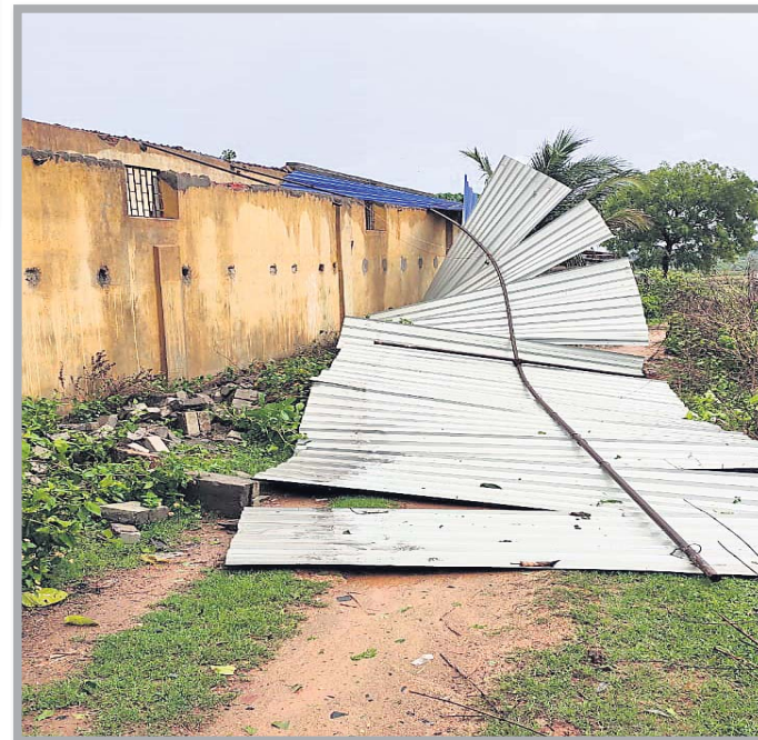
କେନ୍ଦୁଝର ଜିଲ୍ଲା ତେକିକୋଟରେ ଏକ ସ୍କୁଲର ଛପର ଭଡ଼ିଯାଇଛି ।