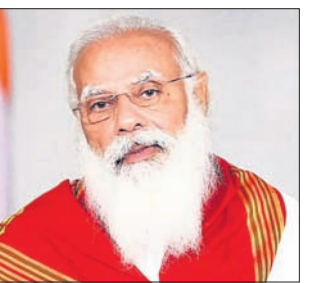
ନରେନ୍ଦ୍ର ମୋଦି ନୂଆଦିଲ୍ଲୀ, ୨୭।୫

ପ୍ରଧାନମନ୍ତ୍ରୀ ନରେନ୍ଦ୍ର ମୋଦି ଶୁକ୍ରବାର ଓଡ଼ିଶା ଓ ପଶ୍ଚିମବଙ୍ଗ ଗସ୍ତ କରି ବାତ୍ୟା ଯାଏ ପରବର୍ତ୍ତୀ ସ୍ଥିତି ଓ କ୍ଷୟକ୍ଷତିର ସମୀକ୍ଷା କରିବେ। ବୁଧବାର ସାମୁଦ୍ରିକ ଝଡ଼ ଓଡ଼ିଶା ଉପକୂଳରେ ମାଡ଼ କରିବା ସହ ଉତ୍ତର ରାଜ୍ୟରେ ବ୍ୟାପକ କ୍ଷୟକ୍ଷତି କରିଥିଲା। ପ୍ରଧାନମନ୍ତ୍ରୀଙ୍କ କାର୍ଯ୍ୟକ୍ରମର ସୂଚନା ଅନୁଯାୟୀ ମୋଦି ଶୁକ୍ରବାର ଭୁବନେଶ୍ୱରରେ ବିମାନରୁ ଅବତରଣ କରି ଏକ ସମୀକ୍ଷା ଦେବେ।