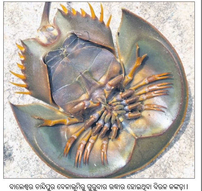
ବାଲେଶ୍ୱର ଚାନ୍ଦିପୁର ବେଳାଭୂମିରୁ ଗୁରୁବାର ଉଦ୍ଧାର ହୋଇଥିବା ବିରଳ କଙ୍କଡ଼ା।

ସେ ମରି ଯାଇଥିବା ଭାବି ତାଙ୍କୁ ବାଜକରେ ବସ୍ତା ପରି ଲାଦି ନେଇ ଘୋଷାଡି ଘୋଷାଡି ତାଳପତା ନାଳରେ ଫିଙ୍ଗି ଦେଇ ଥିଲେ।