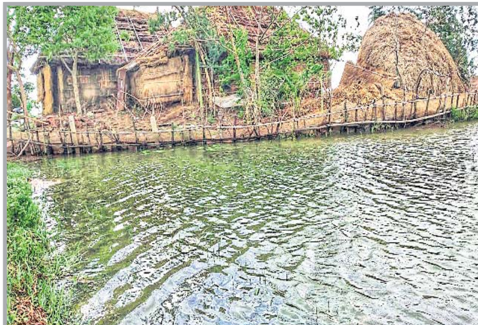
ଭଦ୍ରକ ଜିଲ୍ଲା ଆରଡ଼ି ଅଞ୍ଚଳରେ ପାଣିଘୋରରେ ରହିଛି ଘର ।