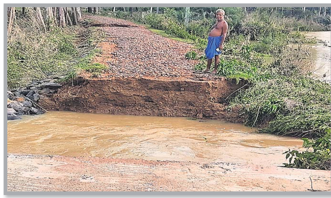
ଖଇରା ବ୍ଲକ ସାରତାଳ ପଞ୍ଚାୟତ ଭୂଆଁକରଡିଆ ଗ୍ରାମ ରାସ୍ତା ପଥରକଟା ନଦୀ ଯୋଲ ନିକଟରେ ସୃଷ୍ଟି ହୋଇଥିବା ୧୨ଫୁଟ ଓସାର ଘାଇ ।