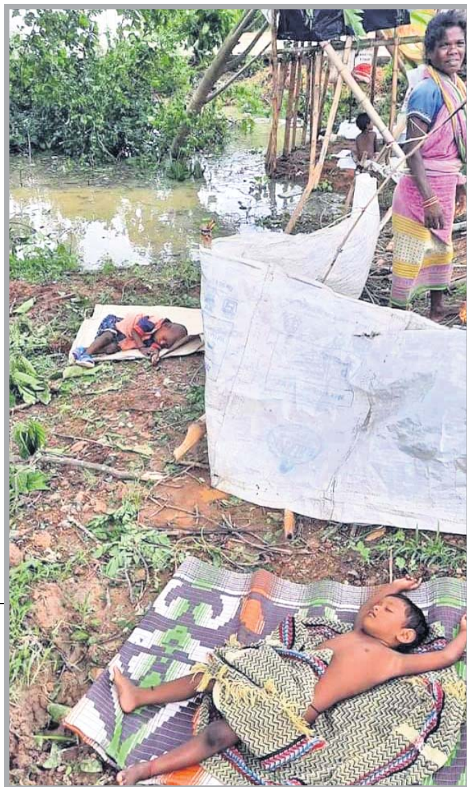
ବାଲେଶ୍ଵର ଜିଲ୍ଲା ସୋର ବ୍ଲକ ଚତକମରା ଗାଁର ଜଣେ ବ୍ୟକ୍ତିଙ୍କ ଘର ଭାଙ୍ଗିଯାଇଥିବାରୁ ସୁଇ ଶିଶୁ ବାହାରେ ଶୋଇଛନ୍ତି ।