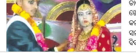
କନ୍ୟା: ଉତ୍ତରପ୍ରଦେଶର ଇଟାଓରେ ଏକ ଦୁଃଖଦ ଘଟଣା ଘଟିଛି । ଧୂମଧାମରେ ବାହାଘର ଚାଲୁଥିବାବେଳେ ହଠାତ୍ କନ୍ୟାଙ୍କ ମୃତ୍ୟୁ ଘଟିଥିଲା । ପରେ ଆୟୋଜିତ ରୁଖାମଣାରେ ବର ତାଙ୍କ ଶାଳୀକୁ ବିବାହ କରିଥିବା ଜଣାପଡ଼ିଛି । ମେ' ୨୫ରେ ଇଟାଓ ଜିଲ୍ଲା ସମସ୍ତର ଗାଁର ପୁରୁଭିକ୍ତ ସହ ମାଓଲି ତିରଭବନର ମଞ୍ଜେସକ୍ ବିବାହ ଅନୁଷ୍ଠିତ ହୋଇଥିଲା । ବିବାହର ସମସ୍ତ ରୀତିନୀତି ସୁରୁଖୁରୁରେ ଚାଲିଥିଲା । ହେଲେ ସାତଫେରା