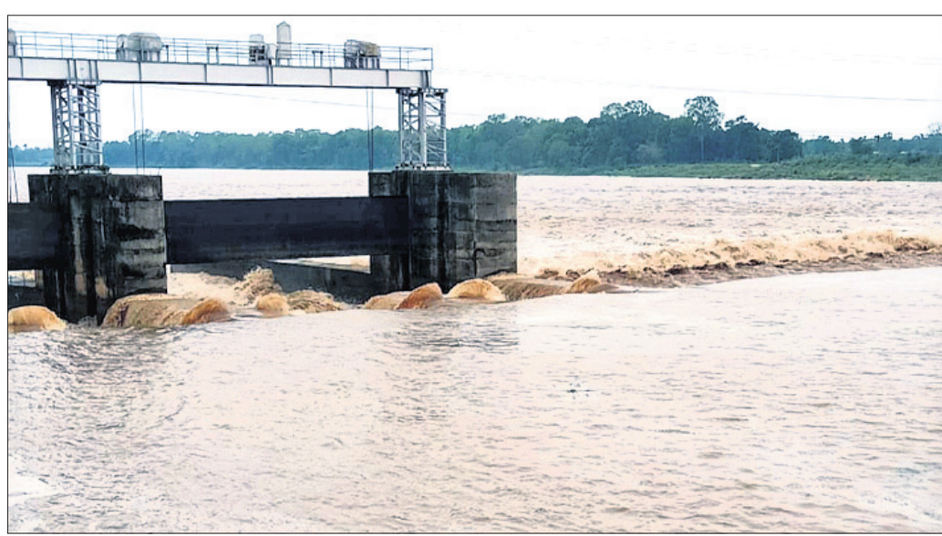
ଭଦ୍ରକ ଜିଲ୍ଲା ଭଣ୍ଡାରିପୋଖରୀର ଆଖୁଆପଦାଠାରେ ଗୁରୁବାର ବିପଦସଙ୍କେତ ଉପରେ ବୈତରଣୀ।

ଭୁବନେଶ୍ୱର, ୨୭।୫ (ବୁଧବୋ) ବନ୍ୟା ହୋଇଛି। ଏଥିପାଇଁ ବୈତରଣୀରେ ବନ୍ୟା ପାଇଁ ଉଚ୍ଚୁକ୍ତି। ଏହି ନଦୀର ବନ୍ୟା ବିପଦ ବୁଝିବାକୁ ଆହୁରି ବୃଦ୍ଧିପାଇଁ ବନ୍ୟାଜଳ ବିପଦ ସଙ୍କେତ ଉପରେ ଆଶଙ୍କା ସୃଷ୍ଟି କରିଛି। ବାତ୍ୟାଜନିତ ବନ୍ୟା ଯୋଗୁଁ ଉତ୍ତର ଓଡ଼ିଶାର ଅଧିକାଂଶ ଜିଲ୍ଲାରେ ଗତ ୨୪ ଘଣ୍ଟା ମଧ୍ୟରେ ପ୍ରବଳରୁ ଅତିପ୍ରବଳ ବିପଦ ସଙ୍କେତ ୧୭.୮୩ ମିଟର ଥିବା ବେଳେ ୧୮.୬୯ ମିଟର ଉପରେ ବନ୍ୟାଜଳ ପ୍ରବାହିତ ହେଉଛି। ଏହାଦ୍ୱାରା ଯାଜପୁର ଜିଲ୍ଲାର ବୈତରଣୀ ନଦୀ ତଟବର୍ତ୍ତୀ କୋରୋଳ, ଦଶରଥପୁର ଓ ଯାଜପୁର ବ୍ଲକ୍‌ସାଥୀ ଆଡ଼କିଟ ଅବସ୍ଥାରେ ସେହିପରି ଭଦ୍ରକ ଜିଲ୍ଲାର ଧାମନଗର, ଭଣ୍ଡାରିପୋଖରୀ ଓ ତିହଡ଼ି ବ୍ଲକ୍‌ରେ ବନ୍ୟା ଆଶଙ୍କା ବଢ଼ିଯାଇଛି। ଏହି ବନ୍ୟାଜଳ ୩ ବ୍ଲକ୍‌ର ନିକଟୁଆଁ ଠାଁ ପାଇଁ ବିପଦ ଆଣିପାରେ ବୋଲି ଜିଲ୍ଲା ପ୍ରଶାସନ ଆକଳନ କରିଛି। ବ୍ଲକ୍ ପ୍ରଶାସନ ପକ୍ଷରୁ ତାଙ୍କବାସି ଯନ୍ତ୍ର ପୁଷ୍ପା-୪