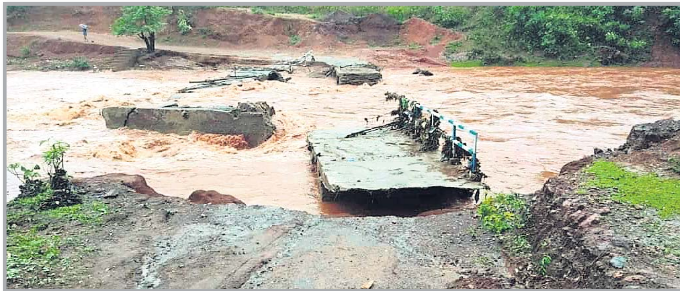
କେନ୍ଦୁଝର କେଥ ହଟି ନିକଟରେ ସୁନା ନଦୀ ଯୋଲ ଭାସିଯାଇଛି ।