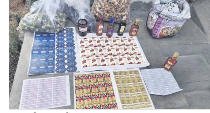
ଜବତ ନକଲି ମଦ ଓ ପ୍ରସ୍ତୁତି ସାମଗ୍ରୀ ।