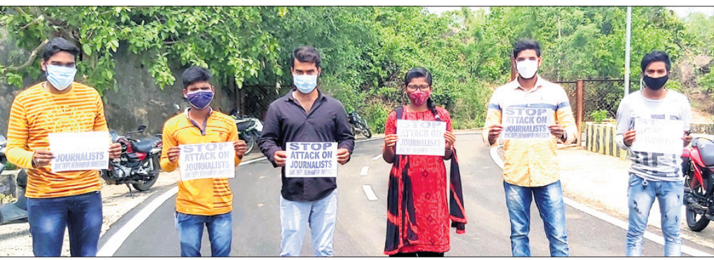
ବ୍ରହ୍ମପୁର ବିଶ୍ୱବିଦ୍ୟାଳୟ ସାୟଦିକତା ଓ ଗଣ ଯୋଗାଯୋଗ ବିଭାଗ ପିଠି ଛାତ୍ରାଛାତ୍ରୀମାନେ ପ୍ରତିବାଦ କଣାଉଛନ୍ତି ।

ଭଞ୍ଜନଗର, ୨୭।୫(ଡି.ଏନ୍.ଏ.): ରାଜ୍ୟରେ ଗଣମାଧ୍ୟମରେ କାର୍ଯ୍ୟକ୍ରମ ଖବରଦାତା ସତ୍ୟକୁ ଉଲ୍ଲୋଚନା କରିବାକୁ ନିରାପେକ୍ଷ ଆକ୍ରୋଶର ଶିକାର ହେଉଛନ୍ତି। ପୁରୀରେ 'ଧରିତ୍ରୀ'ର ଜିଲ୍ଲା