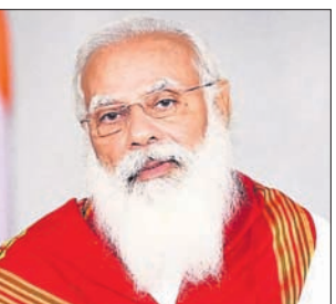
ନରେନ୍ଦ୍ର ମୋଦି ନୂଆଦିଲ୍ଲୀ, ୨୭ତମ

ପ୍ରଧାନମନ୍ତ୍ରୀ ନରେନ୍ଦ୍ର ମୋଦି ଶୁକ୍ରବାର ଓଡ଼ିଶା ଓ ପଶ୍ଚିମବଙ୍ଗ ଗସ୍ତ କରି ବାତ୍ୟା ଯାଏ ପରବର୍ତ୍ତୀ ସ୍ଥିତି ଓ କ୍ଷୟକ୍ଷତିର ସମୀକ୍ଷା କରିବେ। ବୁଧବାର ସାମୁଦ୍ରିକ ଝଡ଼ ଓଡ଼ିଶା ଉପକୂଳରେ ମାଡ଼ କରିବା ସହ ଉତ୍ତର ରାଜ୍ୟରେ ବ୍ୟାପକ କ୍ଷୟକ୍ଷତି କରିଥିଲା। ପ୍ରଧାନମନ୍ତ୍ରୀଙ୍କ କାର୍ଯ୍ୟକ୍ରମର ସୂଚନା ଅନୁଯାୟୀ ମୋଦି ଶୁକ୍ରବାର ଭୁବନେଶ୍ୱରରେ ବିମାନରୁ ଅବତରଣ କରି ଏକ ସମୀକ୍ଷା ଦେଠକରେ ଯୋଗଦେବେ। ଏହା ପରେ ସେ ବାଲେଶ୍ୱର ଓ ଭଦ୍ରକ ଜିଲାର କ୍ଷୟକ୍ଷତି ଆକାଶମାର୍ଗରୁ ଅନୁଧ୍ୟାନ କରିବେ। ପଶ୍ଚିମବଙ୍ଗର ପୂର୍ବ ଦେଶପାର୍ଶ୍ୱର ଜିଲ୍ଲା ବାତ୍ୟାଞ୍ଚଳ ଆକାଶମାର୍ଗରୁ ଦେଖିବା ସହ ସେଠାରେ ଅନ୍ୟ ଏକ ସମୀକ୍ଷା ପୂଷା-୪