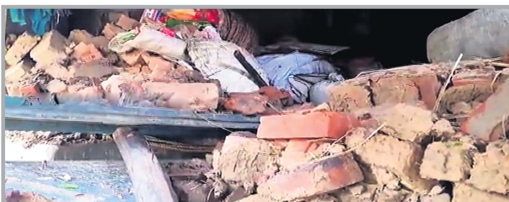
କେନ୍ଦ୍ରାପଡ଼ା ଜିଲା ରାଜନଗର ବ୍ଲକ ତାଳମାଳ ପଞ୍ଚାୟତର ଜଣେ ବ୍ୟକ୍ତିଙ୍କ ଘର ଭାଙ୍ଗି ଯାଇଛି ।