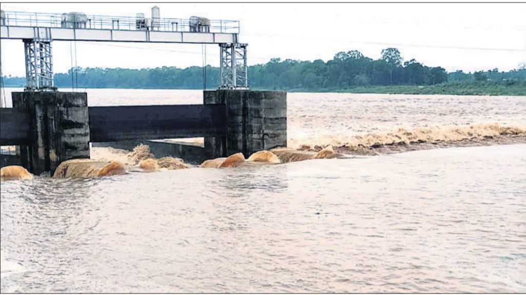
ଭଦ୍ରକ ଜିଲ୍ଲା ଭଣ୍ଡାରିପୋଖରୀର ଆଖୁଆପଦାଠାରେ ଗୁରୁବାର ବିପଦସଙ୍କେତ ଉପରେ ବୈତରଣୀ।

ଭୁବନେଶ୍ୱର, ୨୭ତମ (ବୁଧବୋ) ବାତ୍ୟା 'ୟାସ୍' କ୍ଷତି ଭରି ନ ଥିବା ବେଳେ ବନ୍ୟା ପାଇଁ ଉଚ୍ଚକୃତ୍ତି। ଏହି ନଦୀର ଆନନ୍ଦପୁର ଏବଂ ଆଖୁଆପଦାଠାରେ ବନ୍ୟା ବିପଦ ଦୁର୍ଦ୍ଦଶାକୁ ଆହୁରି ବଢ଼ାଇବା ବନ୍ୟାଜଳ ବିପଦ ସଙ୍କେତ ଉପରେ ଆଶଙ୍କା ସୃଷ୍ଟି କରିଛି। ବାତ୍ୟାଜଳିତ ବର୍ଷା ଯୋଗୁ ଉତ୍ତର ଓଡ଼ିଶାର ଅଧିକାଂଶ ଜିଲ୍ଲାରେ ଗତ ୨୪ ଘଣ୍ଟା ମଧ୍ୟରେ ପ୍ରବଳରୁ ଅତିପ୍ରବଳ