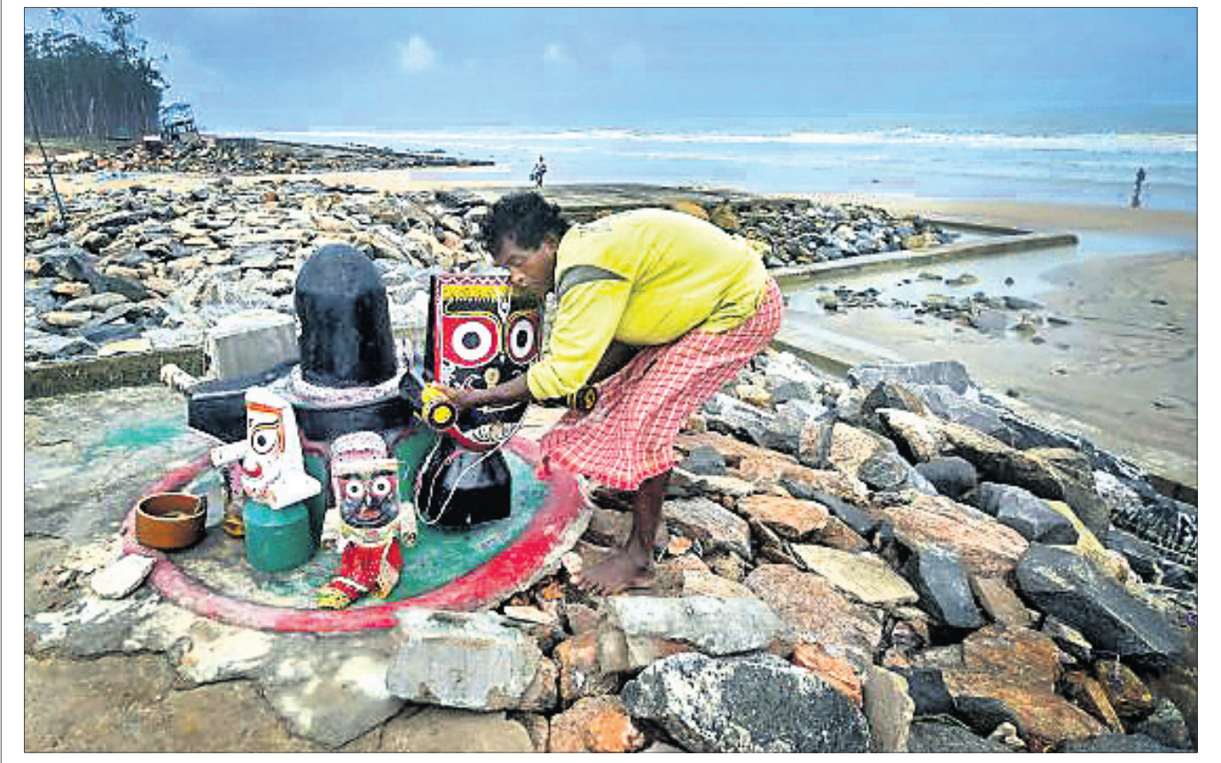
ସାମୁଦ୍ରିକ ଝଡ଼ 'ୟାଏ' ଯିବା ପରେ ପଶ୍ଚିମବଙ୍ଗର ପୂର୍ବ ମେଦିନୀପୁର ଜିଲା ଉପକୂଳରେ ଶ୍ରୀକାନ୍ତଙ୍କ ବିଗ୍ରହକୁ ପୁନଃ ସ୍ଥାପନ କରୁଛନ୍ତି ଜଣେ ଭକ୍ତ ।