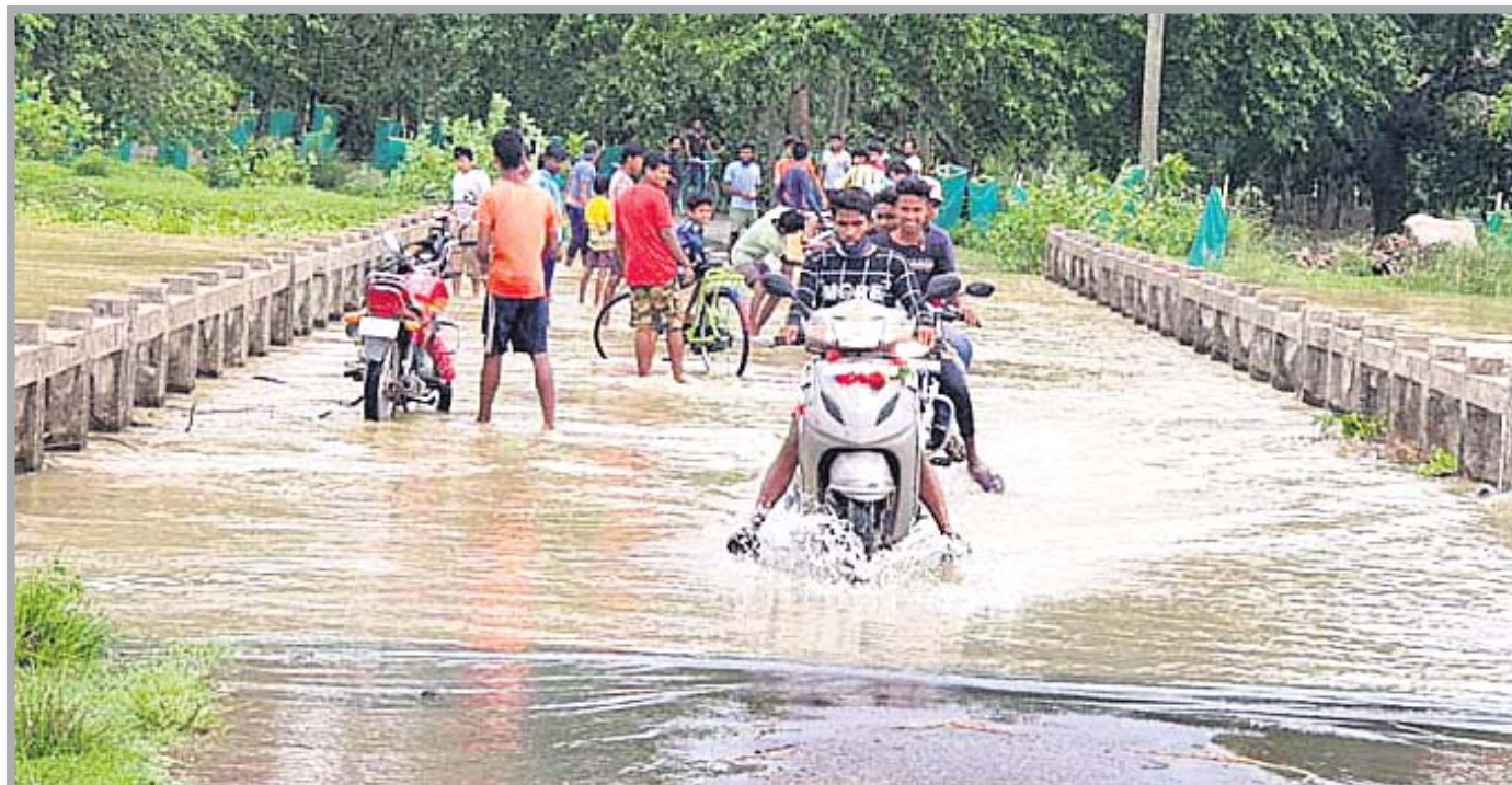
ବାଲେଶ୍ୱର ଜିଲା ସିମ୍ଲିଆ-ସୋର ରାସ୍ତାର କ୍ଷୀରକୋଣା ନିକଟ କାଂଗବାଂଶ ନଦୀ ଯୋଲ ଉପରେ ବର୍ଷାପାଣି ।