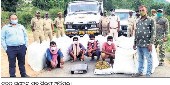
ଜବତ ଗଞ୍ଜେଇ ସହ ଗିରଫ ଅଭିଯୁକ୍ତ ।