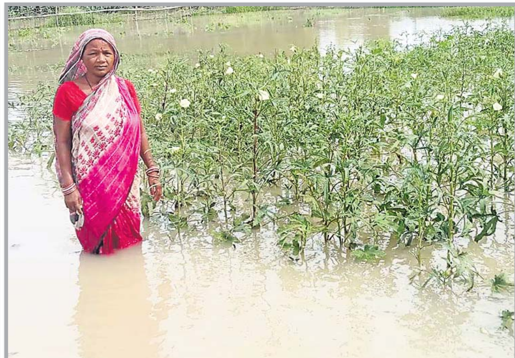
ଭଦ୍ରକ ଜିଲା ବନ୍ତରେ ପାଣିରେ ବୁଡି ରହିଥିବା ପରିବା ଚାଷକୁ ବୁଲି ଦେଖୁଛନ୍ତି ମହିଳା ।