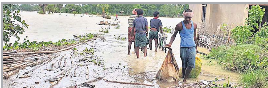
ବାଲେଶ୍ୱର ଜିଲା ସିମ୍ଲିଆ ବ୍ଲକ ରାଧାବଲ୍ଲଭପୁର ରାସ୍ତା ଉପରେ ପାଣି ଚାଲିଛି ।