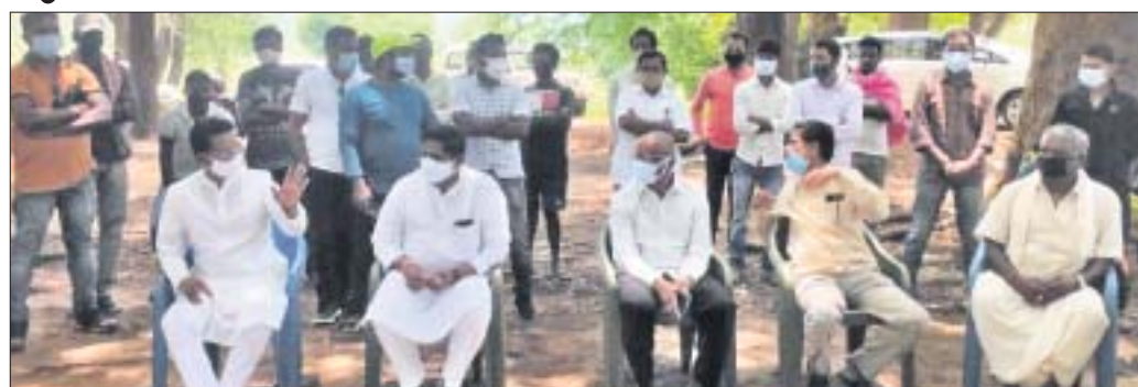
ଗୁରୁବାର ଏମ୍ପି, ବିଧାୟକ ମୃତକଙ୍କ ପରିବାର ଲୋକଙ୍କ ନିକଟରେ ପହଞ୍ଚି ସମବେଦନା ଜଣାଇଛନ୍ତି।