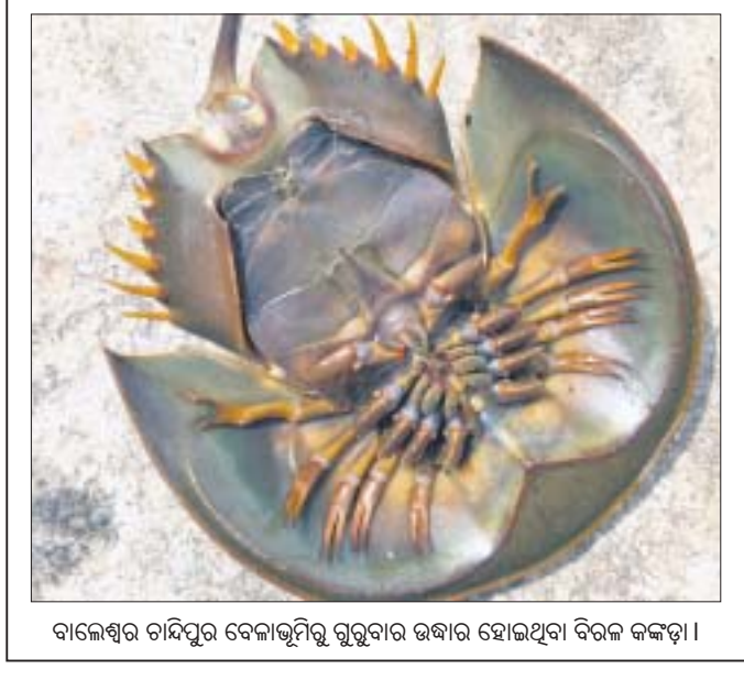
ବାଲେଶ୍ୱର ଚାନ୍ଦିପୁର ବେଳାଭୂମିରୁ ଗୁରୁବାର ଉଦ୍ଧାର ହୋଇଥିବା ବିରଳ କଙ୍କଡ଼ା।