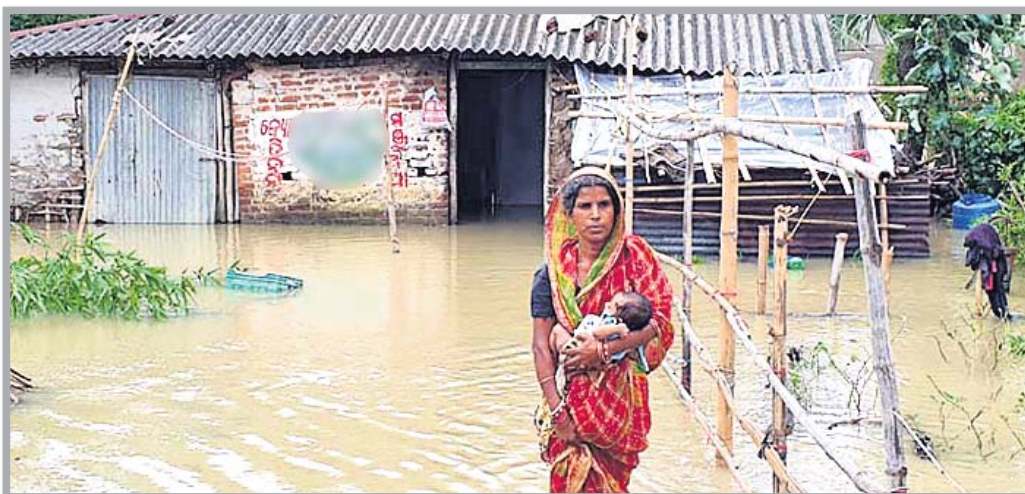
ସିମ୍ଲିଆ ବ୍ଲକ ଦୀପ ଅଞ୍ଚଳରେ ବର୍ଷା ପାଣିରେ ଘର ବୁଡି ରହିଥିବାରୁ ଜଣେ ମହିଳା ତାଙ୍କ ନାବୁଣୀକୁ ଧରି ବାହାରକୁ ଆସୁଛନ୍ତି ।