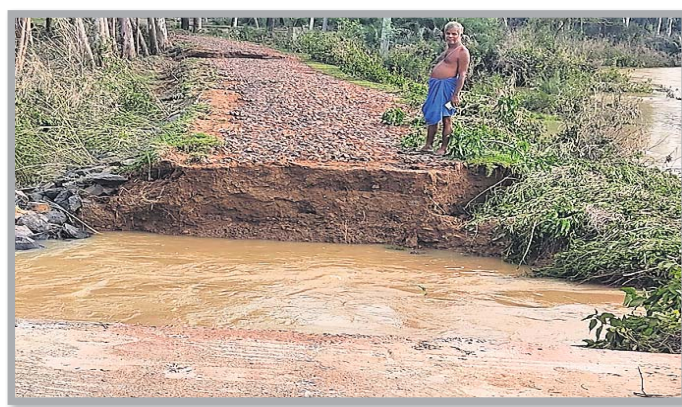
ଖଇରା ବ୍ଲକ ସାରତାଳ ପଞ୍ଚାୟତର ଭୂଆଁକରଡିଆ ଗ୍ରାମ ରାସ୍ତା ପଥରକଟା ନଦୀ ଯୋଲ ନିକଟରେ ସୃଷ୍ଟି ହୋଇଥିବା ୧୨୨୫ ଓସାର ଘାଇ ।