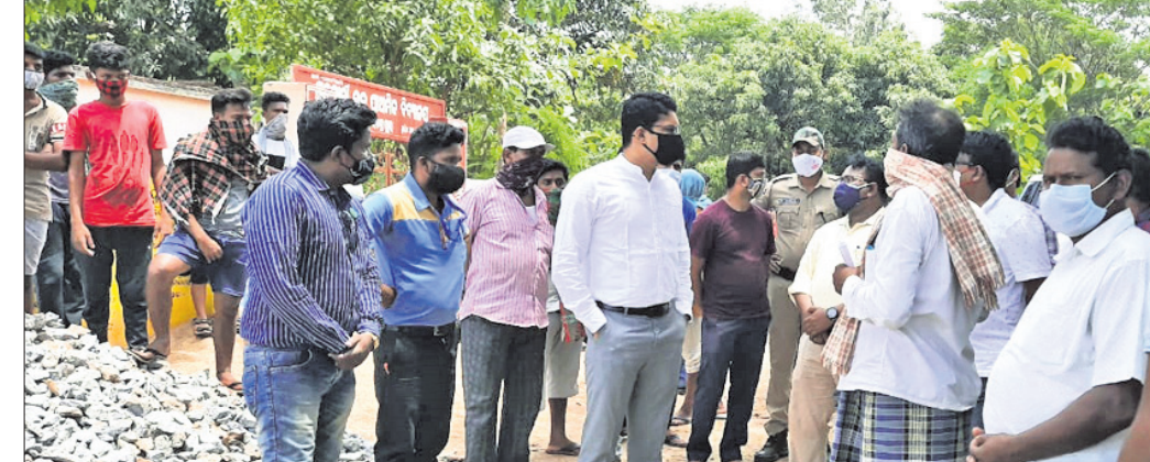
ଗ୍ରାମବାସୀଙ୍କ ସହ ଆଲୋଚନା କରୁଛନ୍ତି ପିତି ।

ପକ୍ଷରୁ ମଙ୍ଗଳବାର ଭାଇରକ ହୋଇଥିଲା। ଏ ନେଇ ଭାଙ୍ଗପା ରାଜ୍ୟ କାର୍ଯ୍ୟକାରୀଣା ନେଇ ପହାସ୍ତା ନିଗମ ସାମଲୀ ଗଞ୍ଜାମ ଜିଲ୍ଲାପାଳଙ୍କ ନିକଟରେ ଅଭିଯୋଗ କରିଥିଲେ। ଏହାର ତଦନ୍ତ ପାଇଁ ଗୁରୁବାର ତିଆରିଏ ପିତି ସିନ୍ଧେ ମେଶିନ ବ୍ୟବହାର ହେଉଥିବା ଫଟୋ