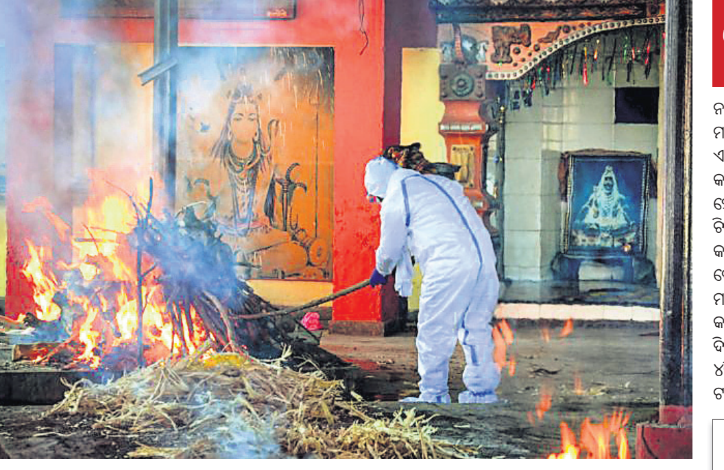
ଅମୃତସରସ୍ୱତ ଏକ ଶୁଖାମରେ ଜଣେ କୋଭିଡ଼ ମୃତକଙ୍କ ଶେଷକୃତ୍ୟ ସମ୍ପନ୍ନ କରାଯାଇଛି ।

ନୂଆଦିଲ୍ଲୀ, ୨୭:୫(ପି.ଟି.) ଦେଶରେ କରୋନା ସଂକ୍ରମଣ ଗତ ୨୦ ଦିନ ମଧ୍ୟରେ କ୍ରମାଗତ ଭାବେ ହ୍ରାସ ପାଇଗଲାଣି । ଗତ ସପ୍ତାହକୁ ୨୪ ରାଜ୍ୟରେ ସକ୍ରିୟ ମାମଲା ସଂଖ୍ୟା କମିଥିବା ସ୍ୱାସ୍ଥ୍ୟ