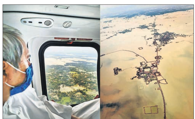
'ୟାସ୍' ଯୋଗୁ କ୍ଷତିଗ୍ରସ୍ତ ଅଞ୍ଚଳକୁ ଆକାଶମାର୍ଗରୁ ମୁଖ୍ୟମନ୍ତ୍ରୀ ନବୀନ ପଟ୍ଟନାୟକ ଦେଖିଛନ୍ତି।

ଧାମନଗର, ଭଣ୍ଡାରିପୋଖରୀ ଓ ତିହଡ଼ି ବ୍ଲକ୍‌ରେ ବନ୍ୟା ଆଶଙ୍କା ବଢ଼ିଯାଇଛି। ଏହି ବନ୍ୟାଜଳ ୩ ବ୍ଲକ୍‌ରେ ନିକଟୁଆ ଠାଁ ପାଇଁ ବିପଦ ଆଣିପାରେ ବୋଲି ଜିଲ୍ଲା ପ୍ରଶାସନ ଆକଳନ କରିଛି। ବ୍ଲକ୍ ପ୍ରଶାସନ ପକ୍ଷରୁ ତାଙ୍କବାସୀଙ୍କୁ ସତର୍କ