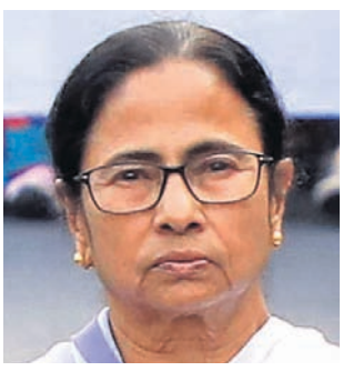
ଉପସ୍ଥିତ ଥିବାରୁ ପୃଷ୍ଠା କଂଗ୍ରେସ (ଟିଏମସି) ସୁପ୍ରିମୋ ଏପରି କରିଥିବା ଆଲୋଚନା ହେଉଛି। ପୃଷ୍ଠା-୪