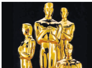
ଦି ସ୍ପାକ୍ ମେସିନ୍' ଚଳଚ୍ଚିତ୍ର ପୁରସ୍କାର ଉପରେ ପ୍ରକ୍ରିୟାରେ ସାମିଲ ହୋଇପାରି ନ ଥିଲେ।

କୋଭିଡ଼ ମହାମାରୀ କାରଣରୁ ଓଫିସ୍ ସେକ୍ଟର-୨୦୨୨ରୁ ଗୋଟିଏ ମାସ ଘୁଞ୍ଚିଲା ଦିଆଯାଇଛି। ଏକାଡେମୀ ଅଫ୍ ମୋଶନ ପିକ୍ଚର ଆର୍ଟ୍ ଆଣ୍ଡ୍ ସାଇନ୍ସ (ଏଏମ୍ପିଏଏସ୍) ଏହି ନିଷ୍ପତ୍ତି ନେଇଛି।