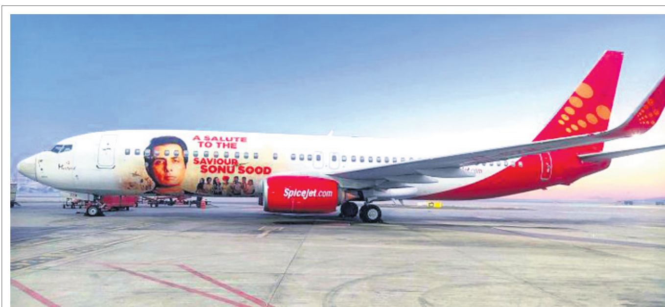
ବାରାଣସୀ ବିମାନବନ୍ଦରରେ ଥିବା ସ୍ପାଇସଜେଟ୍ ଏକ ବିମାନରେ ବଲିଉଡ଼ ଅଭିନେତା ସୋନୁ ସୁଦ୍ଧଙ୍କ ଫଟୋ ରହିଛି। କୋଭିଡ଼-୧୯ ଲକ୍ଡାଉନ ବେଳେ ଯୋଗୁଁ ସମାଜ ସେବାକୁ ସମ୍ମାନ ଜଣାଇ ସ୍ପାଇସଜେଟ୍ ଏପରି କରିଛି।

କୋଲକାତା, ୨୮: ସାମୁଦ୍ରିକ ଝଡ଼ 'ୟାସ୍' ପ୍ରଭାବରେ କ୍ଷତିଗ୍ରସ୍ତ ପଶ୍ଚିମବଙ୍ଗ ପାଇଁ ପୁଖ୍ୟମନ୍ତ୍ରୀ ମମତା ବାନାର୍ଜୀ ଶୁକ୍ରବାର ୨୦ ହଜାର କୋଟି ଟଙ୍କାର କେନ୍ଦ୍ରୀୟ ସହାୟତା ଦାବି କରିଛନ୍ତି।