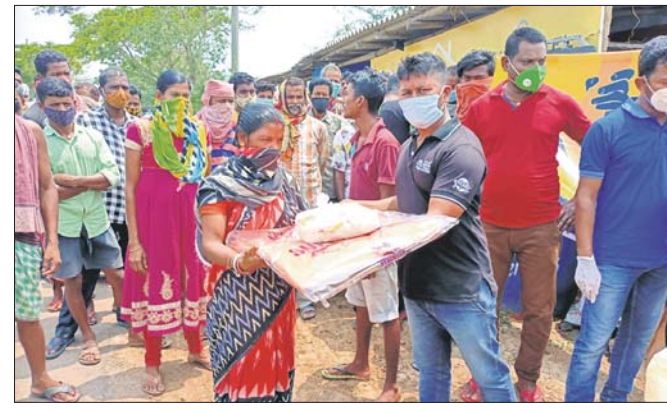
ଭୁବନେଶ୍ୱର, ୨୮ ଅଗଷ୍ଟ

ଭୁକ୍ତାନରେ ୧୦ ରୁଣା ଡାଉନଲୋଡ୍ ହିଲ୍ ଏବଂ ୩ ରୁଣା ଡାଉନଲୋଡ୍ ସ୍ପିଡ୍ ମିଳିପାରିବ ବୋଲି ଏହା ସ୍ପଷ୍ଟ କରିଛି । ୫ଜିର ଇଣ୍ଟିଆନ ସେଟିଂକୁ ପରୀକ୍ଷଣ କରାଯିବ କାର୍ଯ୍ୟକ୍ରମ ରହିଛି । ଏହା ମଧ୍ୟରେ ଟେଲିମେଡିଅଟିଭ, ଟେଲିଏକ୍ସକୋମ୍, ଟ୍ରୋନ ଟିଭି କୃଷି କାର୍ଯ୍ୟ ତଦାରଖ ଭଳି ଅନ୍ୟ ପ୍ରସ୍ତୁତ ଦିନ ସାମିଲ ରହିଛି । ଟେଲିକମ୍ ଅପରେଟରମାନେ ସେମାନଙ୍କ ନେଟୱାର୍କରେ ବିଭିନ୍ନ ୫ଜି ଡିଭାଇସ୍ ପରୀକ୍ଷଣ କରାଯିବାର ସମ୍ଭାବନା ରହିବେ । ପରୀକ୍ଷଣ ଅବଧି ୬ ମାସ ରହିବ । ଏଥିଲାଗି ବିଭିନ୍ନ ମନ୍ତ୍ରାଳୟ ସଂଗ୍ରହ ଏବଂ ଏହାର ସ୍ଥାପନା ଲାଗି ୨ ମାସ ସମୟ ଅବଧି ସାମିଲ ରହିଛି । କମ୍ପାନୀଗୁଡ଼ିକ ଉତ୍ତମ ଗ୍ରାମ୍ୟାଞ୍ଚ ଏବଂ ଅର୍ଥ ସହଯୋଗ ଦେବେ । ସହଯୋଗରେ ସେଟିଂ ସହ ସହଯୋଗରେ ସେଟିଂ ହେବ କାର୍ଯ୍ୟ କରିବେ । ପଞ୍ଜାବ, ହରିୟାଣା ଏବଂ ତତ୍ପର ପାଇଁ କୌଣସି କମ୍ପାନୀ ଖେତ୍ର ଲାଭ କରି ନ ଥିବା ଅଧିକାରୀ ଜଣକ କହିଛନ୍ତି ।