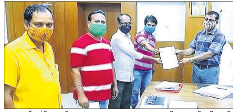
ତାଳଚେର ଖାକି କର୍ମାଳିଷା ଆସୋସିଏଟସ୍ ପକ୍ଷରୁ ପୁଖ୍ୟମନ୍ତ୍ରୀଙ୍କ ଉଦ୍ଦେଶ୍ୟରେ ତାଳଚେର ଉପଜିଲ୍ଲାପାଳଙ୍କୁ ଦାବିପତ୍ର ଦିଆଯାଇଛି।