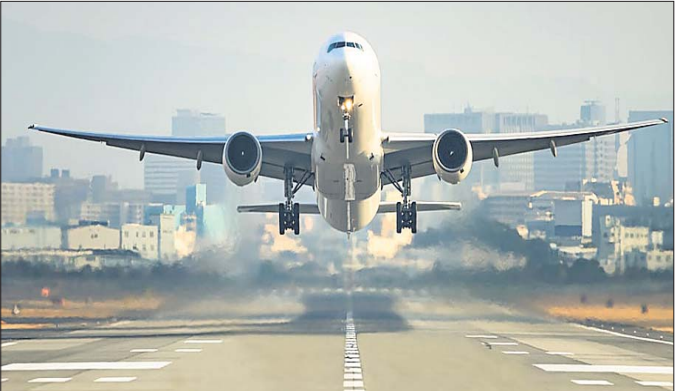
ନୂଆଦିଲ୍ଲୀ, ୨୮ ଅଗଷ୍ଟ

କରୋନା ସ୍ଥିତି ବର୍ତ୍ତମାନ ଠିକ୍ ହୋଇ ନ ଥିବାରୁ ଅନ୍ତର୍ଜାତୀୟ ବିମାନ ସେବାକୁ ଭୁମ୍ ମିଠା ଯାଏ ବାତିଲ କରିଛନ୍ତି । ଶୁକ୍ରବାର ଏ ନେଇ ବେସମ୍ପରକ ବିମାନ ଚଳାଚଳ ମହାନିର୍ଦ୍ଦେଶକ (ଡିଏସିଏ) ପକ୍ଷରୁ ସ୍ପଷ୍ଟ କରାଯାଇଛି । ଏହାଦ୍ୱାରା ବିଭିନ୍ନ କ୍ଷେତ୍ରରେ ବିଭିନ୍ନ ପ୍ରସଙ୍ଗକୁ ବିଚାର କରି ଅନ୍ତର୍ଜାତୀୟ ବିମାନ ସେବାକୁ ଅନୁମତି ମିଳିପାରେ । ଏଥିଲାଗି କର୍ତ୍ତୃପକ୍ଷକ ଠାରୁ ଅନୁମତି ଲୋଡ଼ା ପଡିବ । ଭାରତରେ କରୋନା ମହାମାରୀ ଜନିତ