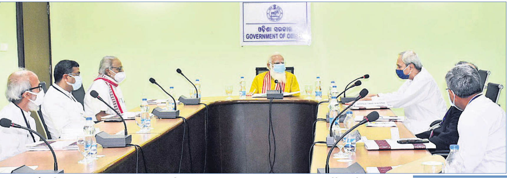
ବିଜୁ ପଟ୍ଟନାୟକ ଅବଗାଧ୍ୟାୟ ବିଦ୍ୟାଳୟରେ କର୍ମଚାରୀମାନଙ୍କୁ ହଲରେ ପ୍ରଧାନମନ୍ତ୍ରୀ ନରେନ୍ଦ୍ର ମୋଦି, ରାଜ୍ୟପାଳ ପ୍ରଫେସର ରମେଶ ଲାଲ, ମୁଖ୍ୟମନ୍ତ୍ରୀ ନବୀନ ପଟ୍ଟନାୟକଙ୍କ ଉପସ୍ଥିତିରେ ଅନୁଷ୍ଠିତ ସମୀକ୍ଷା ବୈଠକ।