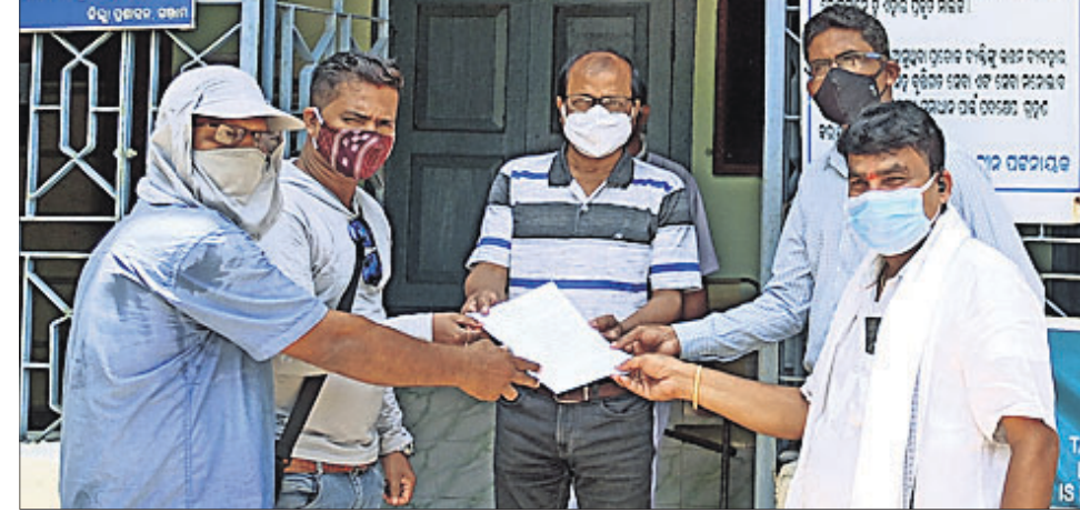
ଗଞ୍ଜାମ ଜିଲ୍ଲାର ବିଗପହଣ୍ଡି ସାଧୁବିକଳ ସଂଘ ପକ୍ଷରୁ ପୁଖ୍ୟମନ୍ତ୍ରୀଙ୍କ ଉଦ୍ଦେଶ୍ୟରେ ତହସିଲଦାର ଅଧିକୃତ କୁମାର ସାଙ୍ଗୁକୁ ଦାବିପତ୍ର ପ୍ରଦାନ।